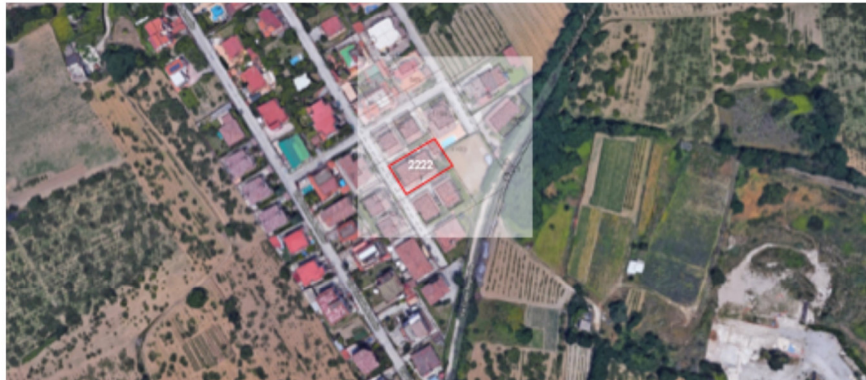
STRALCIO DA GOOGLE MAPS con SOVRAPPOSIZIONE CATASTALE