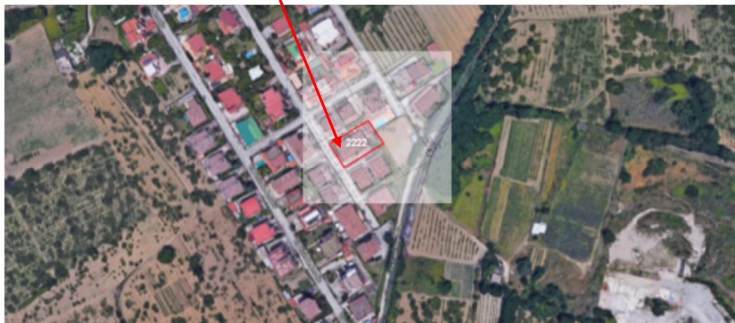
STRALCIO DA GOOGLE MAPS con SOVRAPPOSIZIONE CATASTALE

N.B.: Ai fini della esatta individuazione delle unità immobiliari è stata effettuata la sovrapposizione della mappa catastale su uno stralcio di Google Maps [All.2i].