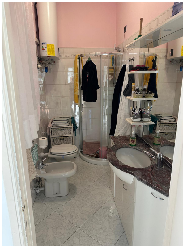
Foto 7 - Bagno