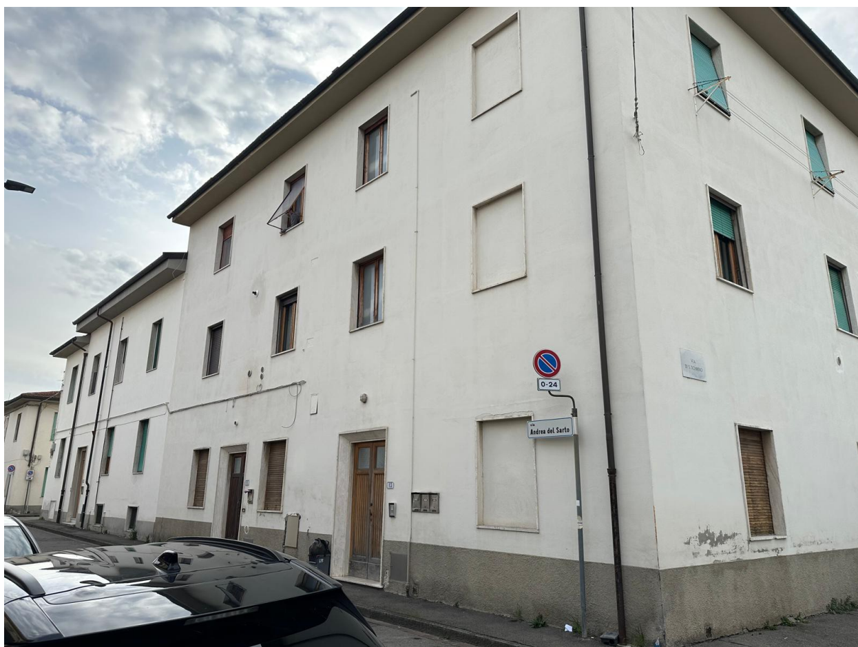
Foto 1 – Foto dell'edificio che ricomprende l'unità immobiliare – Via Andrea del Sarto n.13 – Empoli (FI)