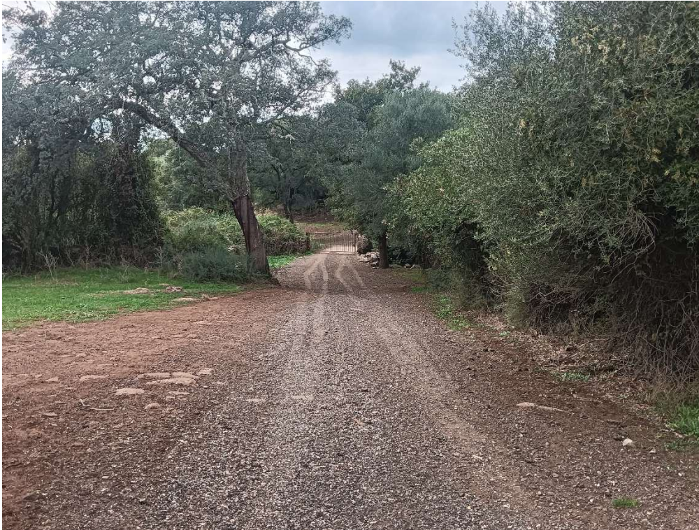
Foto 4 – Stradello costituente la servitù di passaggio – Ultimo tratto prima del cancello di ingresso ai terreni pignorati

Una volta percorso lo stradello si raggiunge il ponticello di attraversamento dei “Rio Bubolica” oltre il quale è immediatamente presente il cancello di accesso ai terreni pignorati (Foto 5).