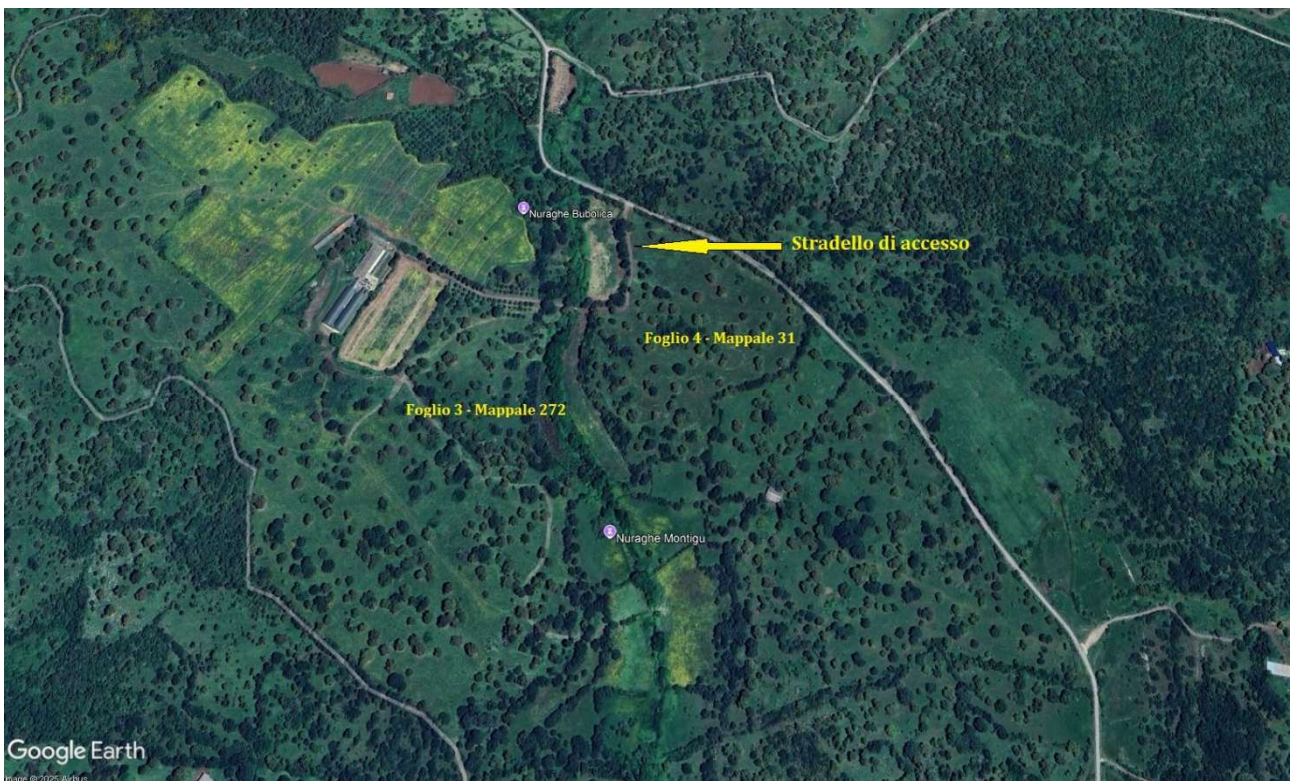
Immagine 1 – Foto aerea attuale

Se si osserva la seguente immagine si potrà notare come all'interno di questo mappale sia ben visibile una strada, con accesso diretto dalla strada comunale, da sempre utilizzata per raggiungere i mappali pignorati.