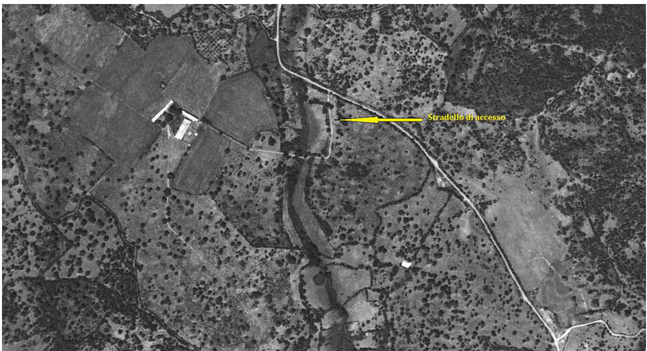
Immagine 3 - Foto aerea del 1997

(Le foto aeree sono tutte reperibili al seguente link