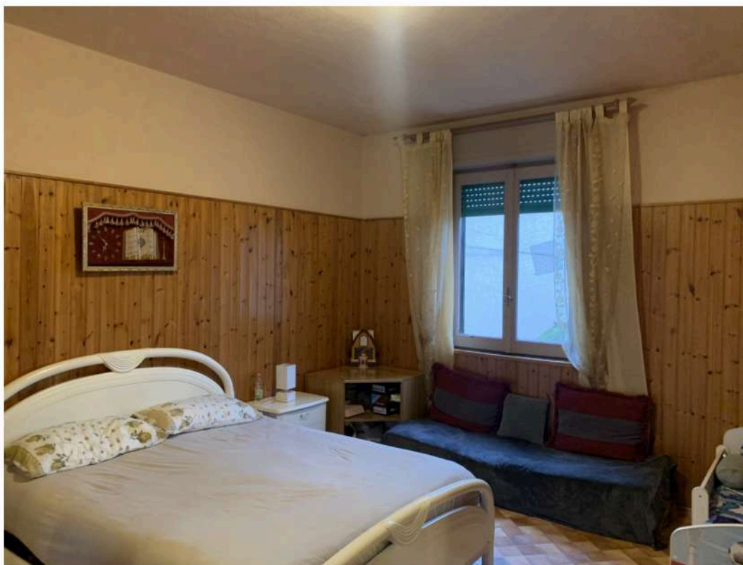
12 - Camera da letto lato sud