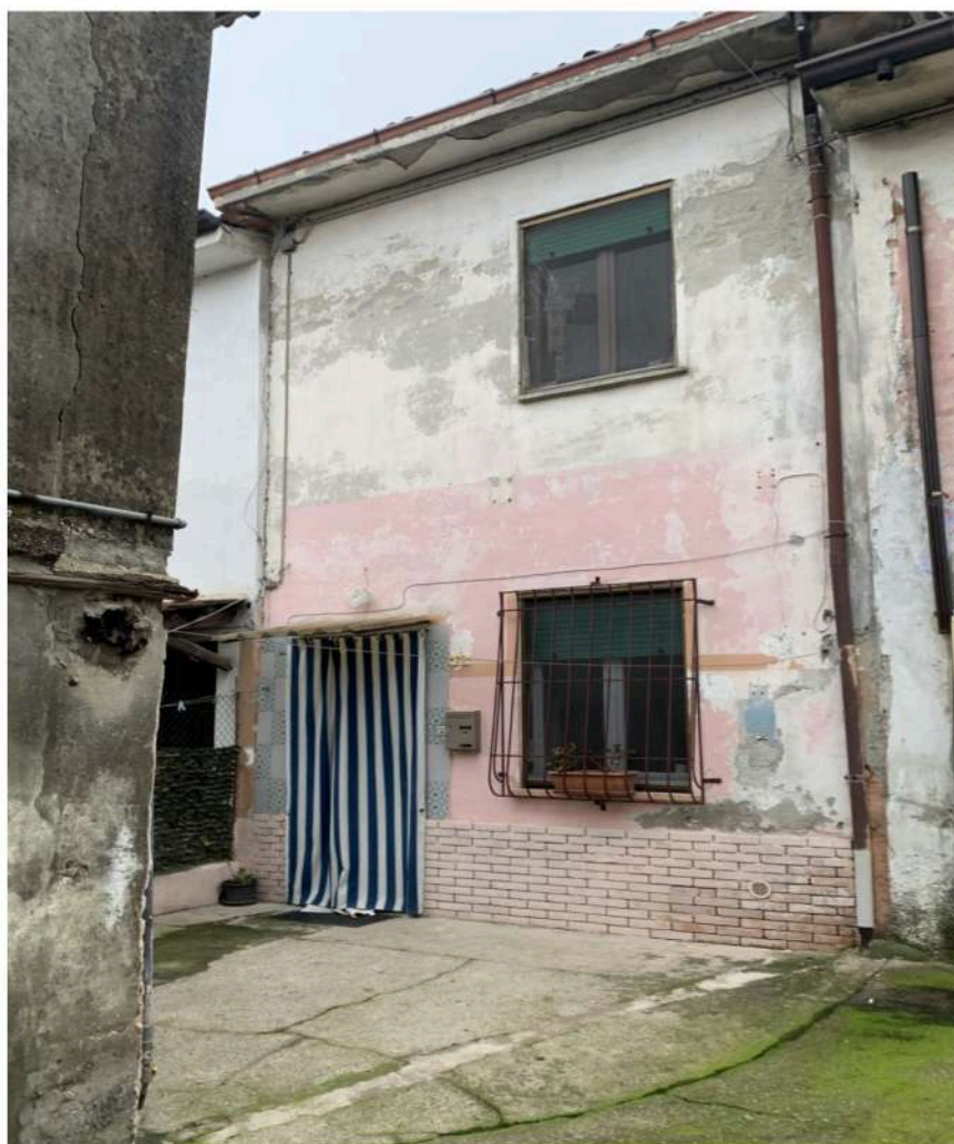
2 - Prospetto sud abitazione