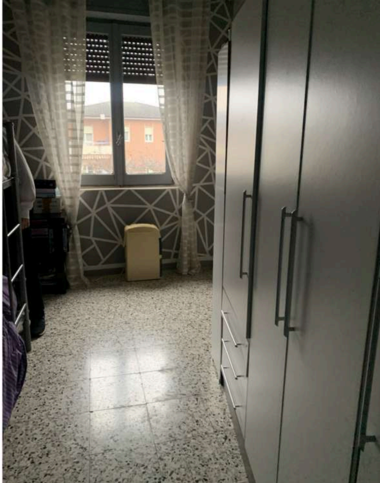
13 - Camera d aletto lato nord