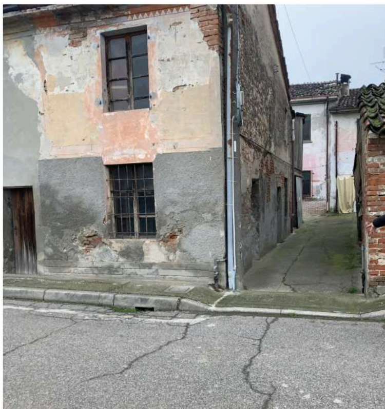
1 - Unità immobiliare fatiscente, ripresa da via San Rocco