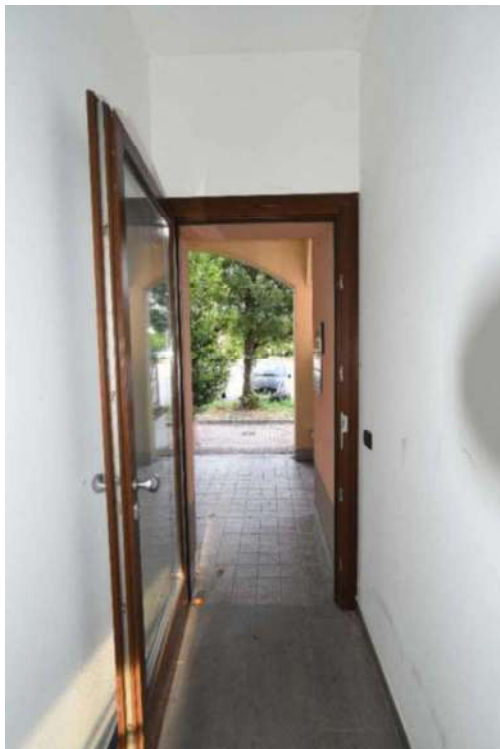
Ingresso con vista porta d'entrata ai piani superiori