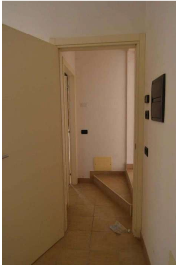
disimpegno zona notte