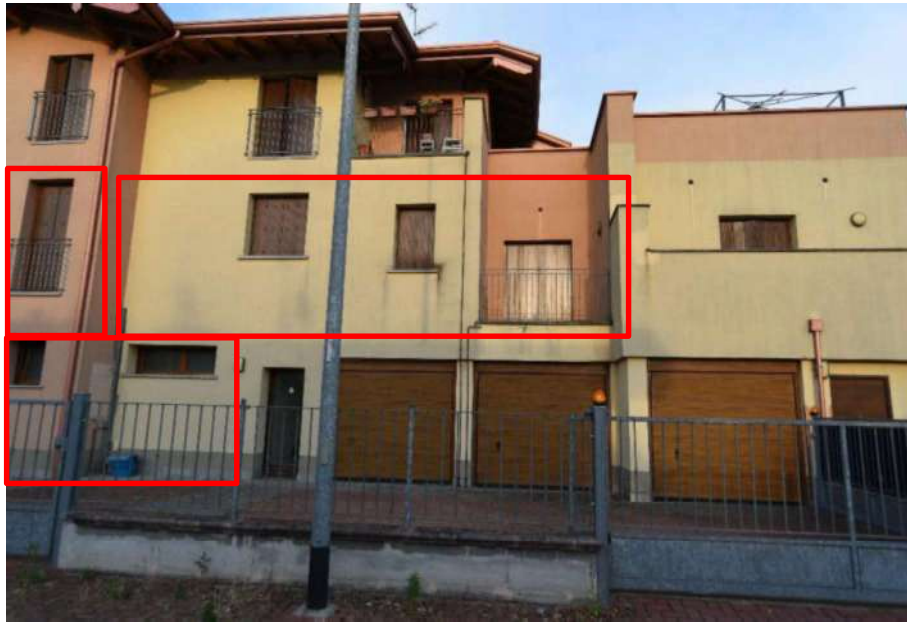
Vista dalla Via degli Scarriolanti