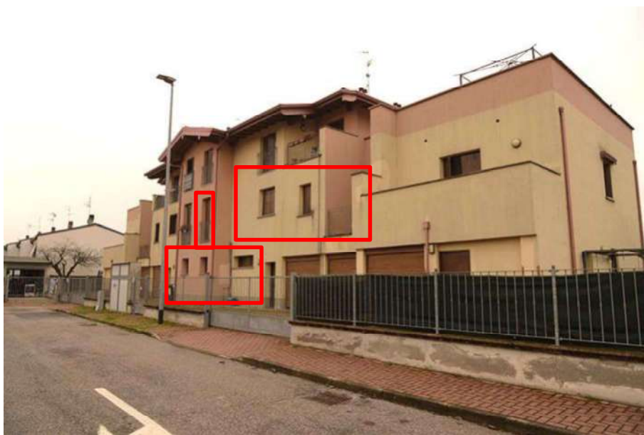
Vista secondaria dalla via degli Scariolanti