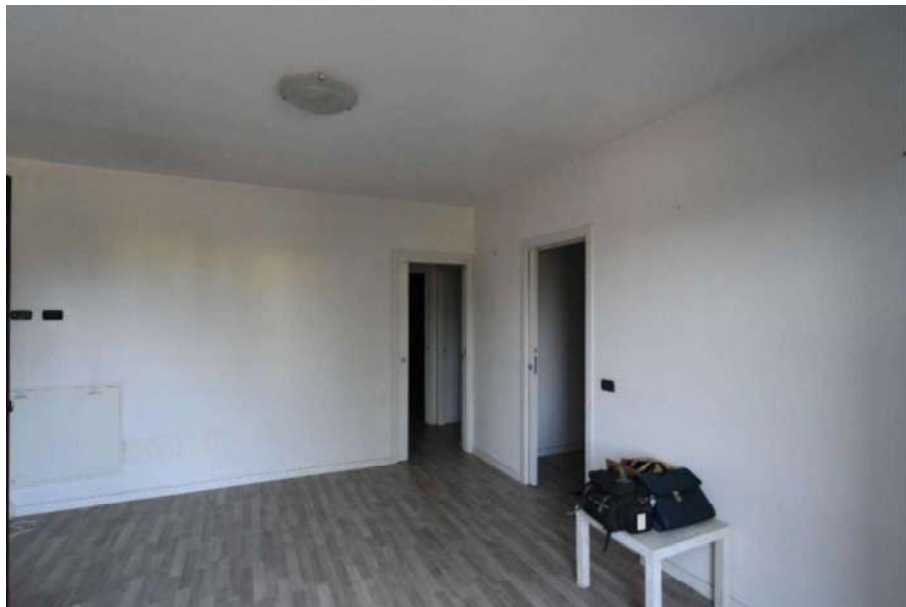
Vista del soggiorno verso cucina e zona notte