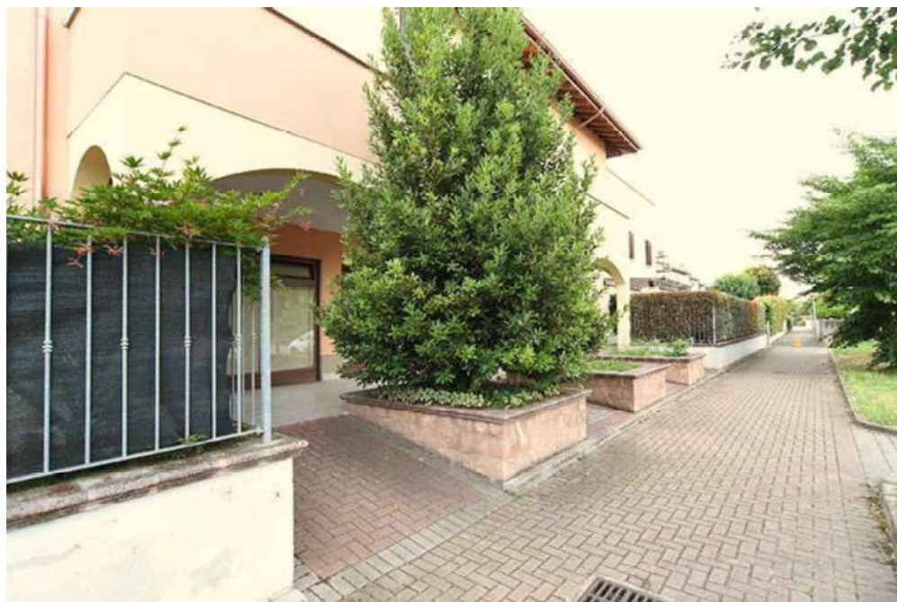
Camminamento antistante fra l'immobile e la Piazza Caprioli