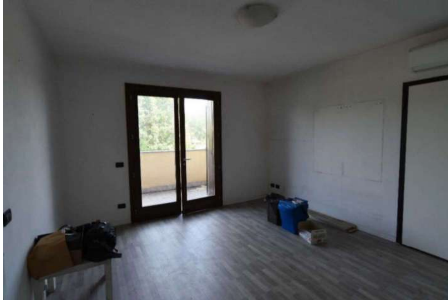
Vista dell'ingresso dal soggiorno