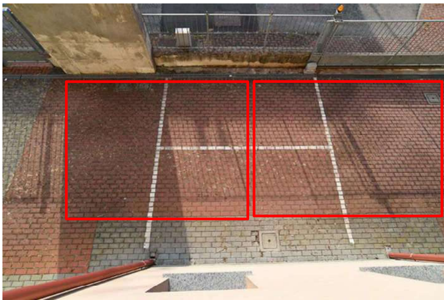
In rosso si evidenziano i posti auto come da accatastamento