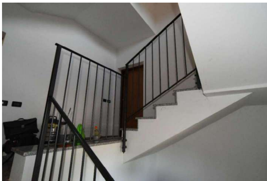
INGRESSO CONDOMINIALE ALL' APPARTAMENTO N°2 sub 523