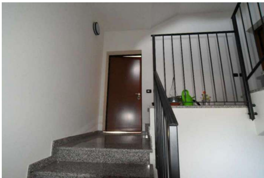
INGRESSO CONDOMINIALE ALL' APPARTAMENTO N°1 sub 522