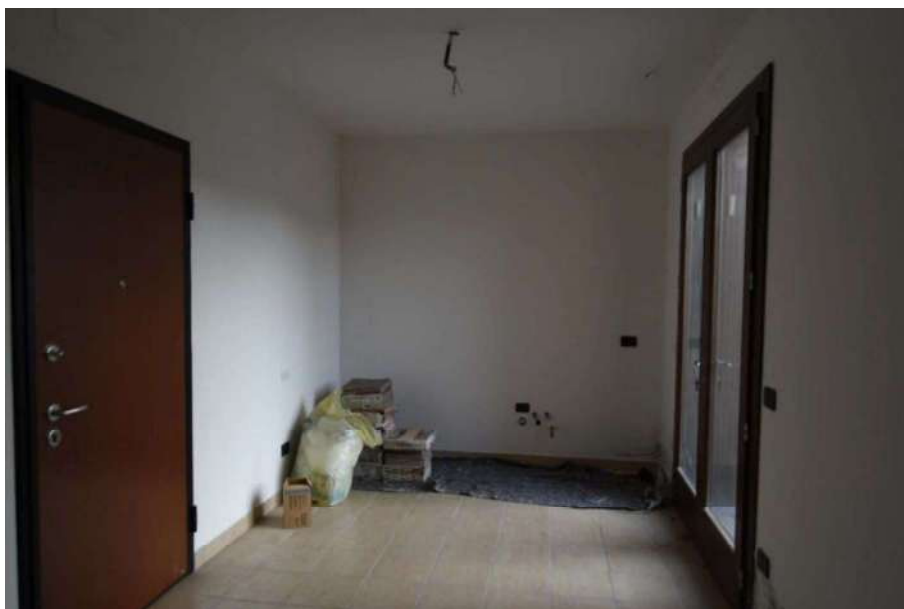
Soggiorno con vista cucina