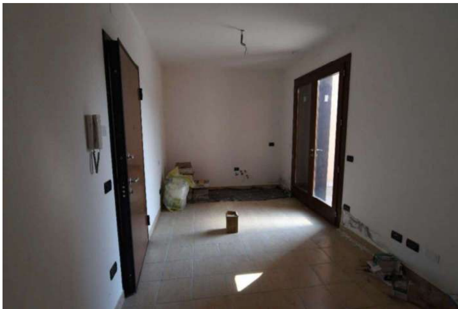
Soggiorno zona salotto