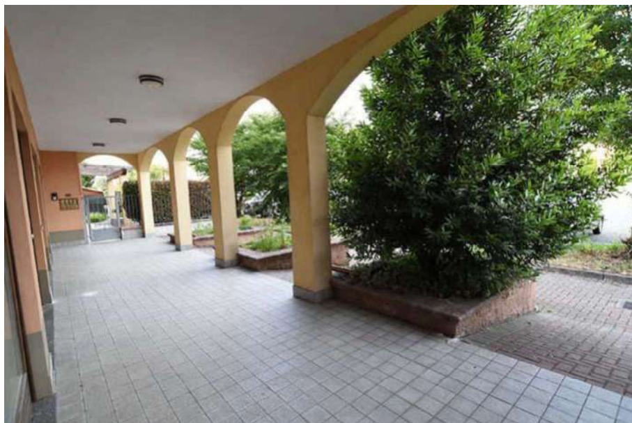
Vista sotto il porticato