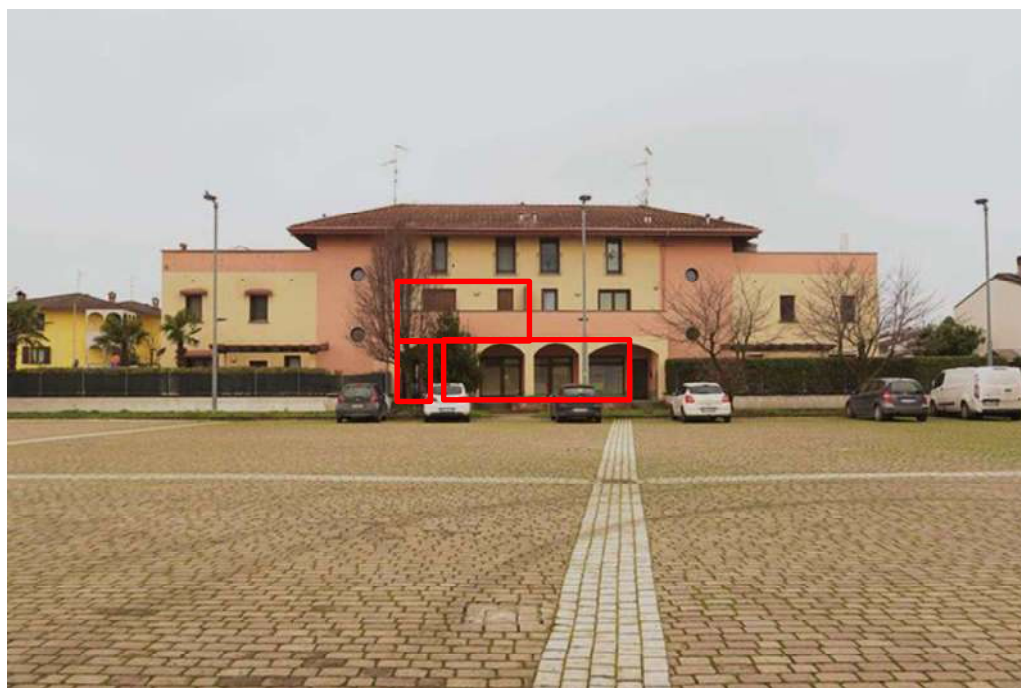
Vista dalla Piazza Tommaso Caprioli