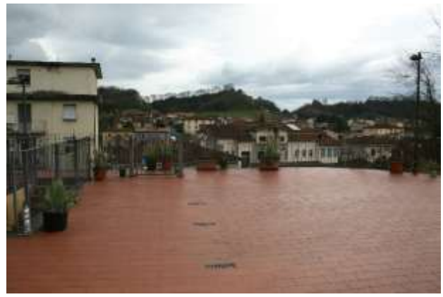
INGRESSO SUL RESEDE