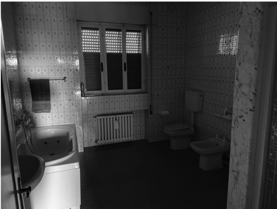
13 - Bagno piano 1°