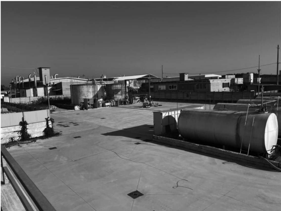
7 - Vista della proprietà