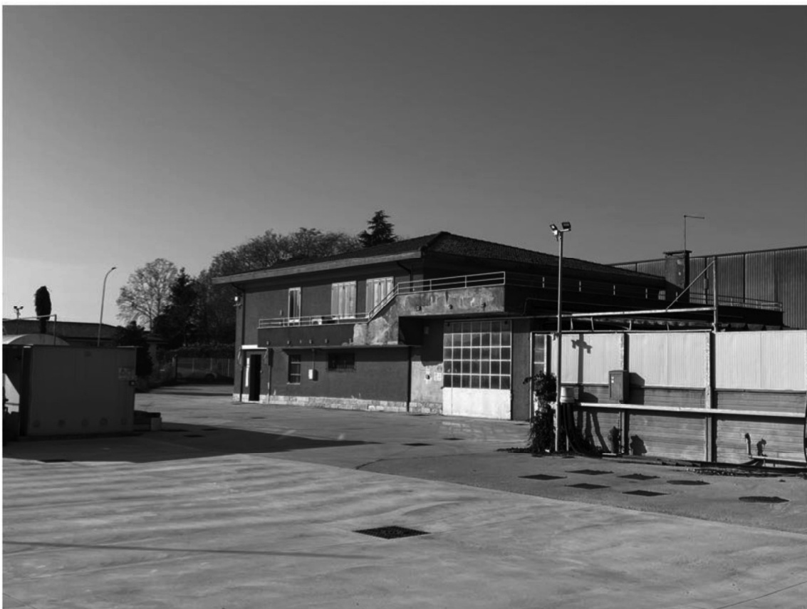
5 - Vista fabbricato lati nord/est