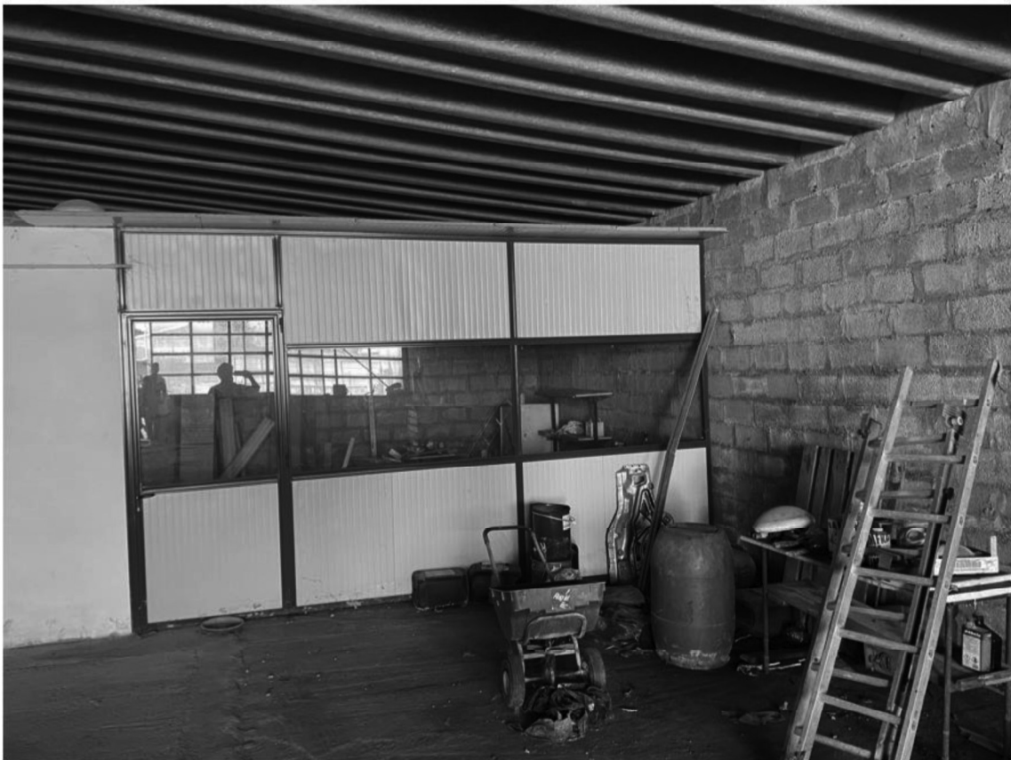
11 - Magazzino