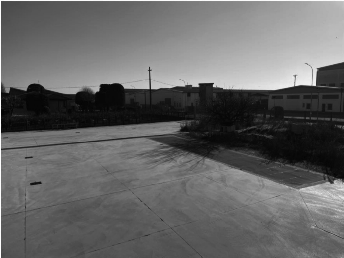
6 - Vista della proprietà