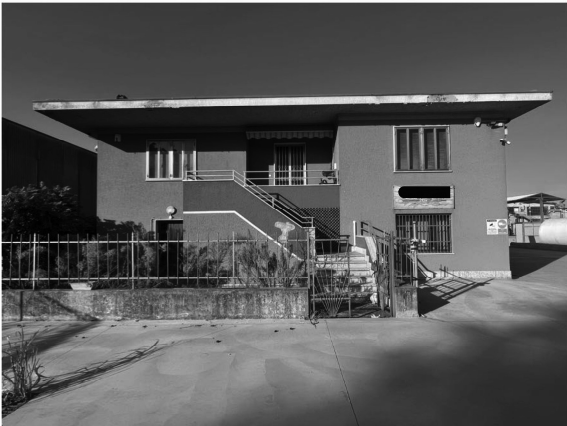
4 - Vista fabbricato lato sud