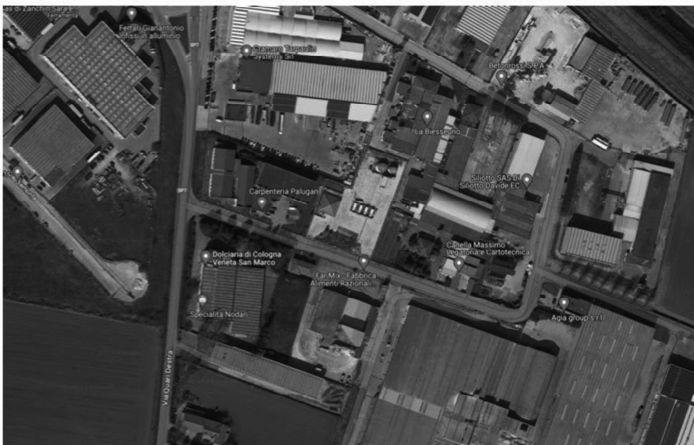
3 - Vista satellitare