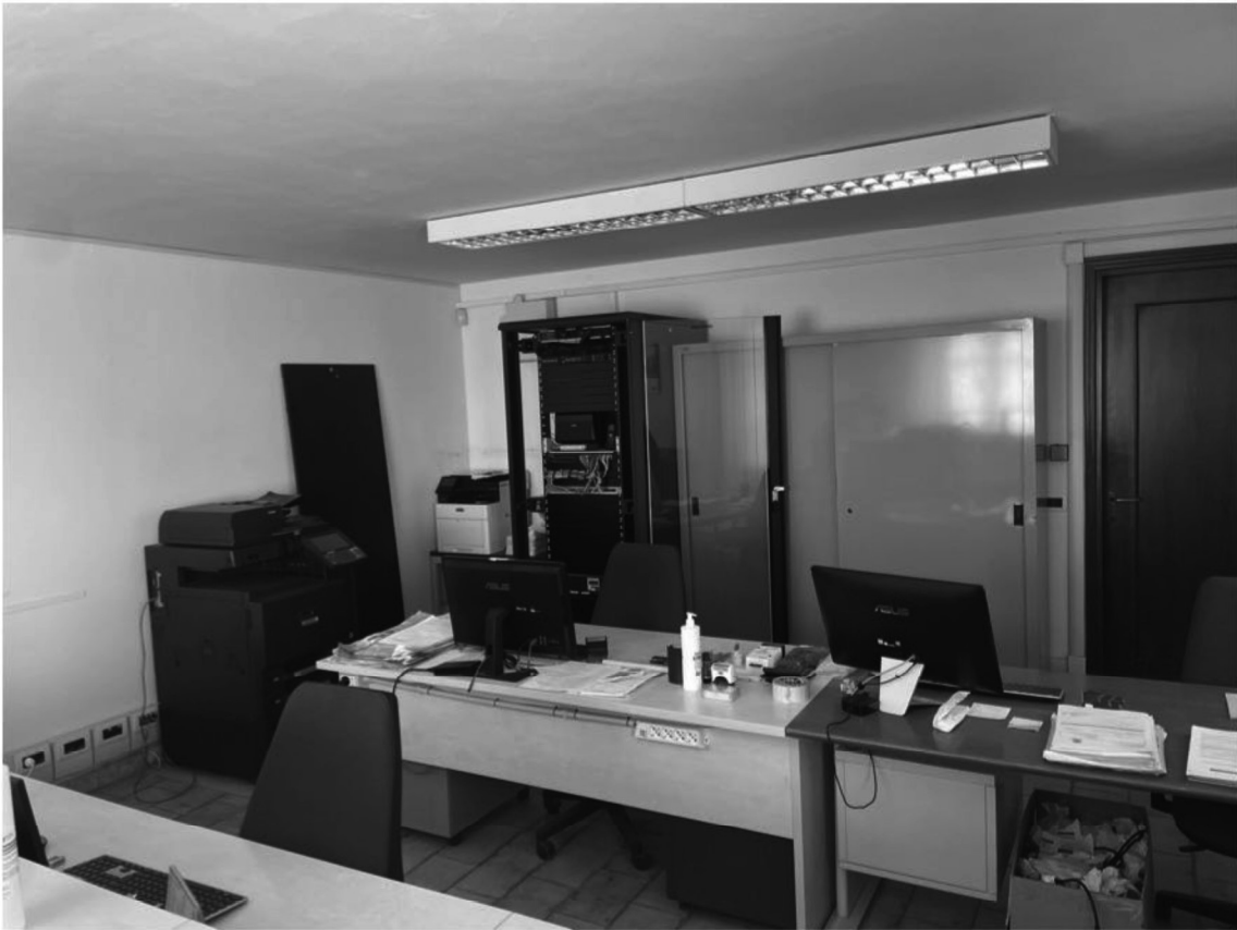
8 - Uffici piano terra