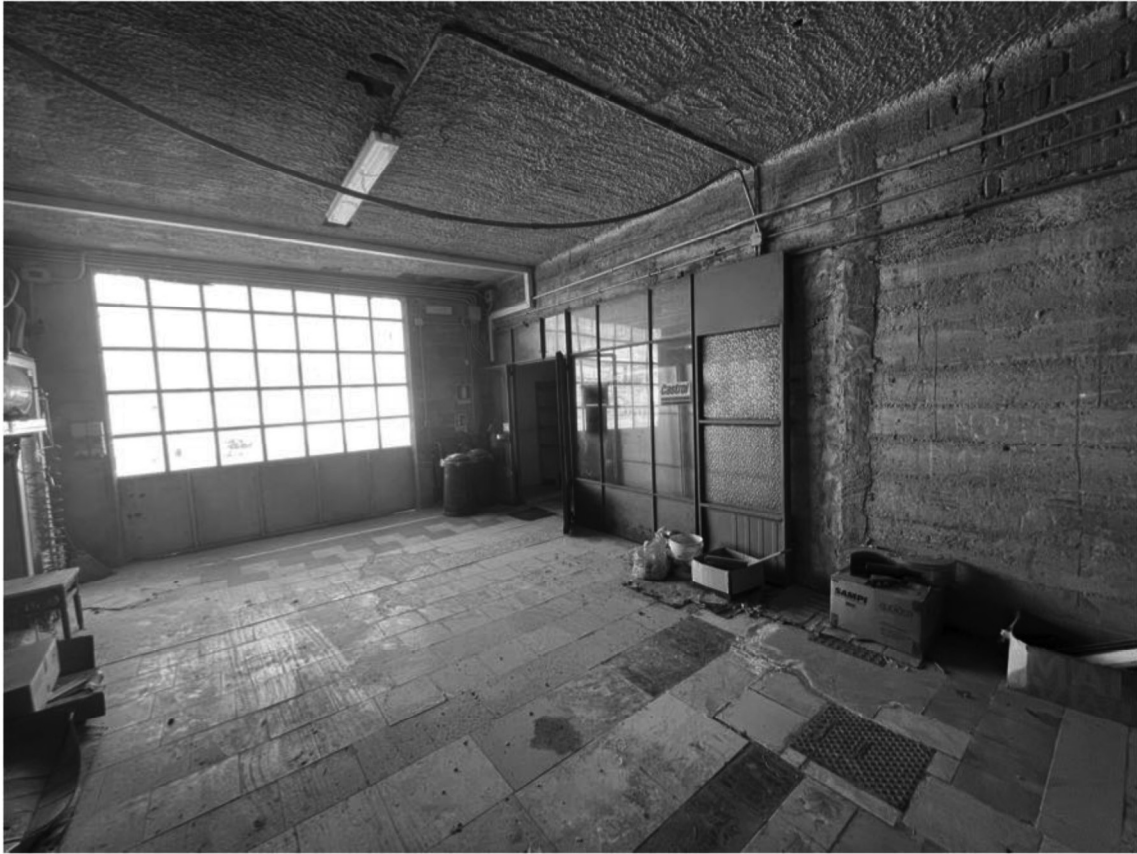
10 - Magazzino