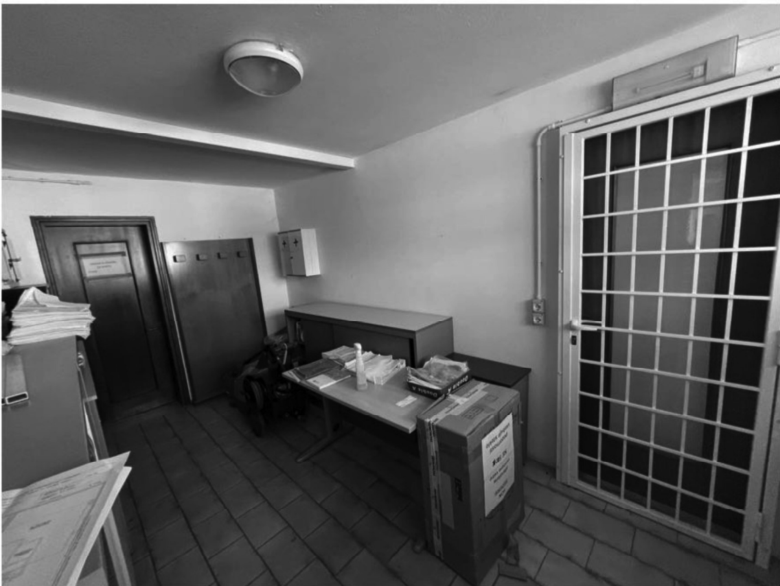
9 - Uffici piano terra