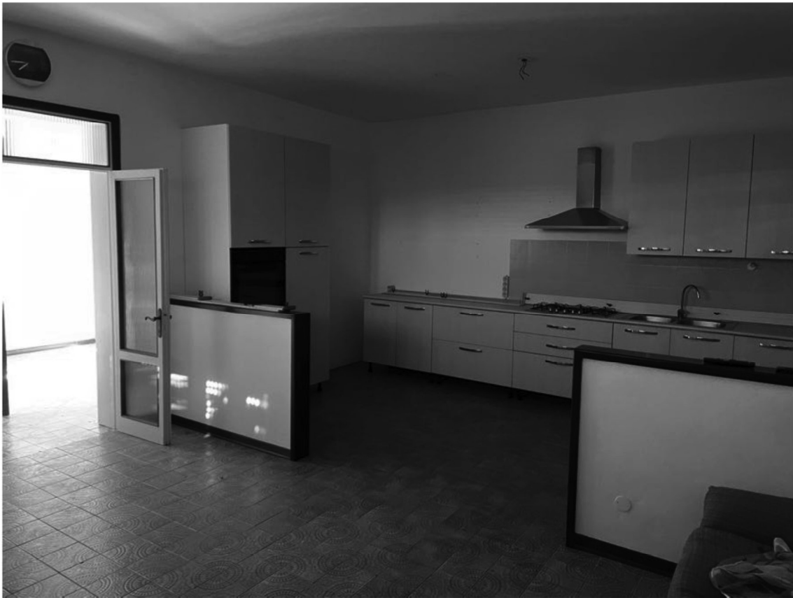
12 - Cucina/pranzo piano 1°