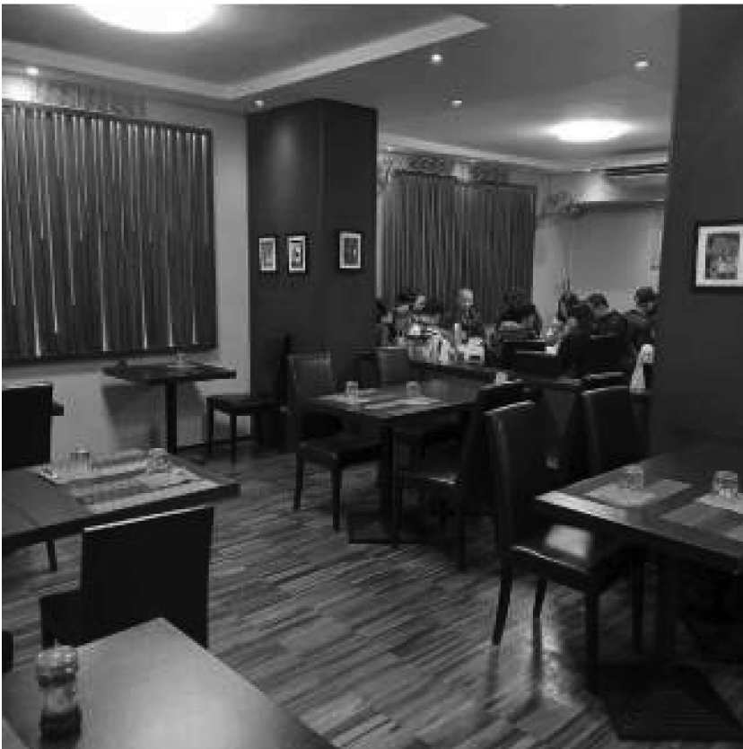
Sala piano terra