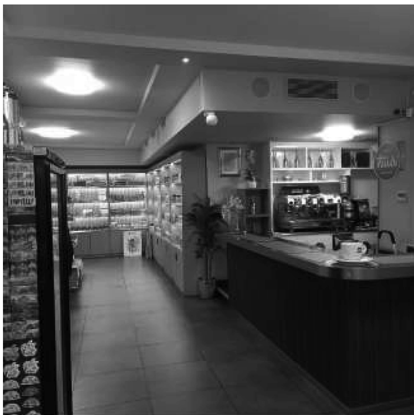
Corridoio (RILEVATA DIFFORMITA')*