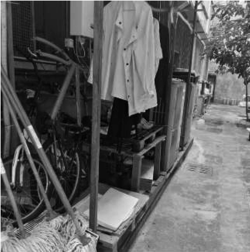
Esterno uscita emergenza