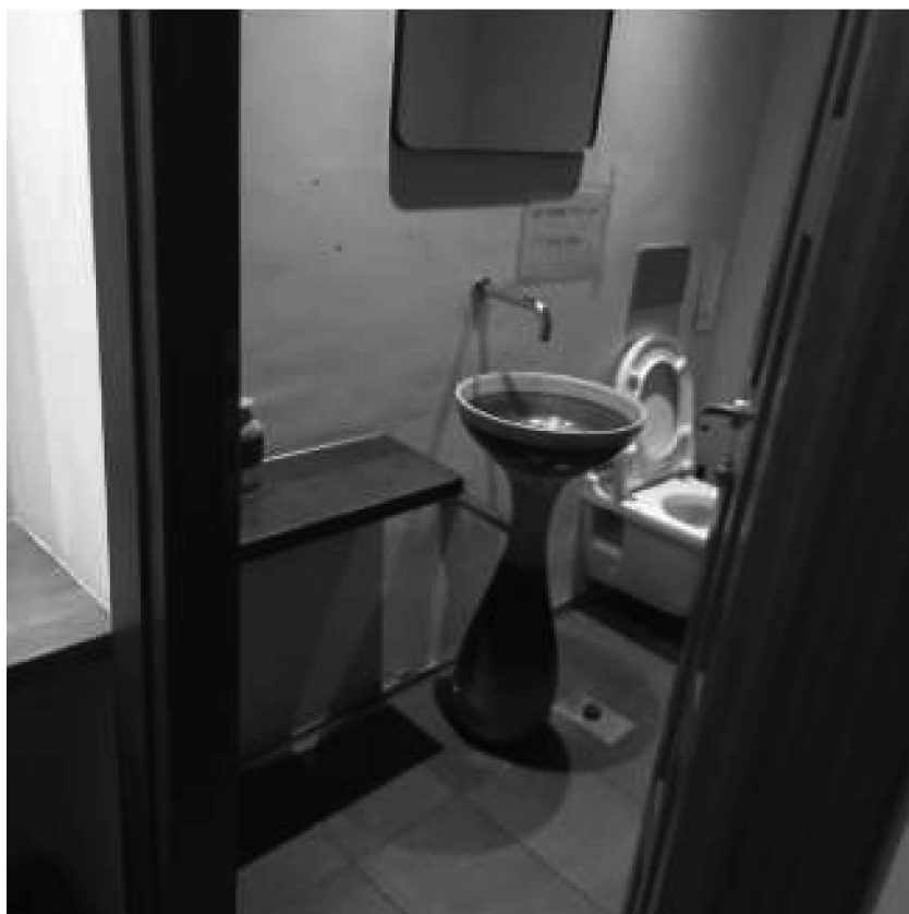
Bagno piano primo