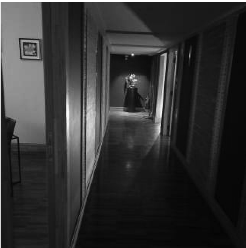
Sala Piano primo