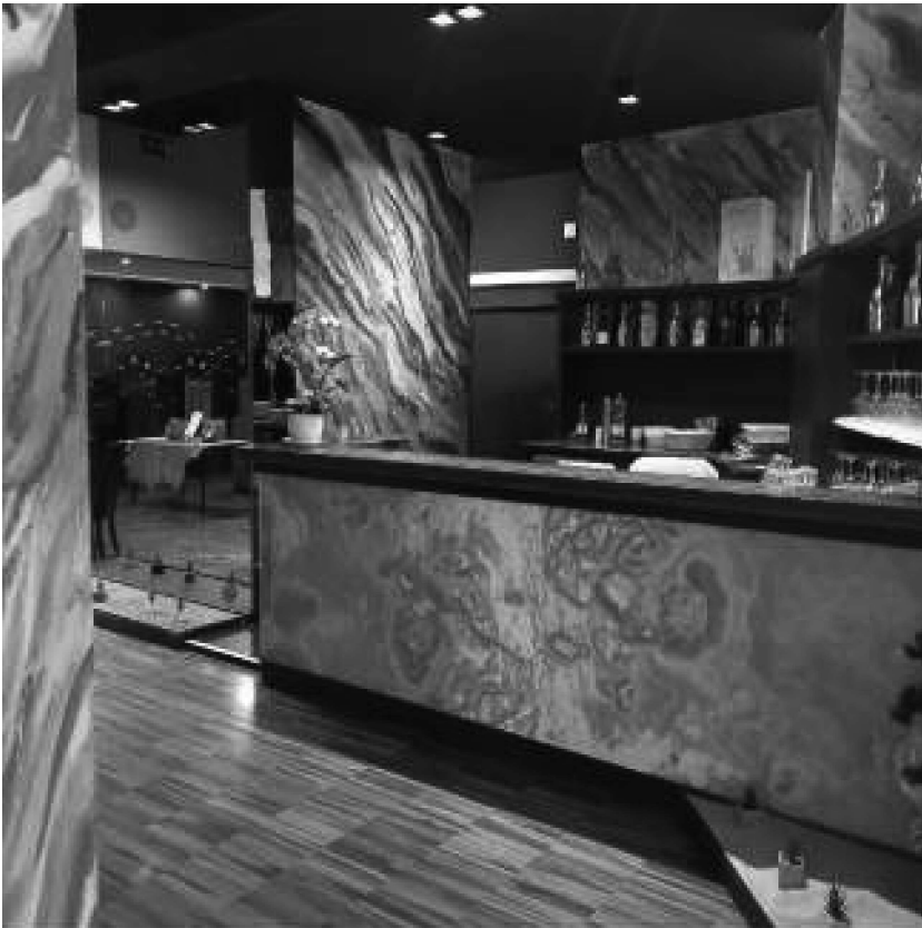
Bancone piano terra