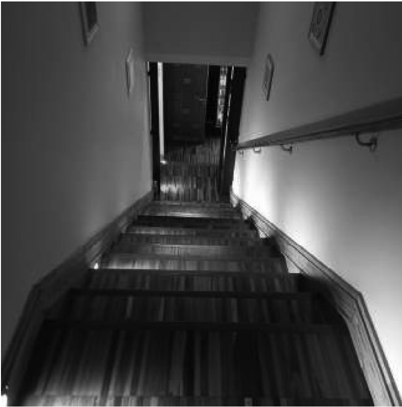
Scale di accesso al piano primo