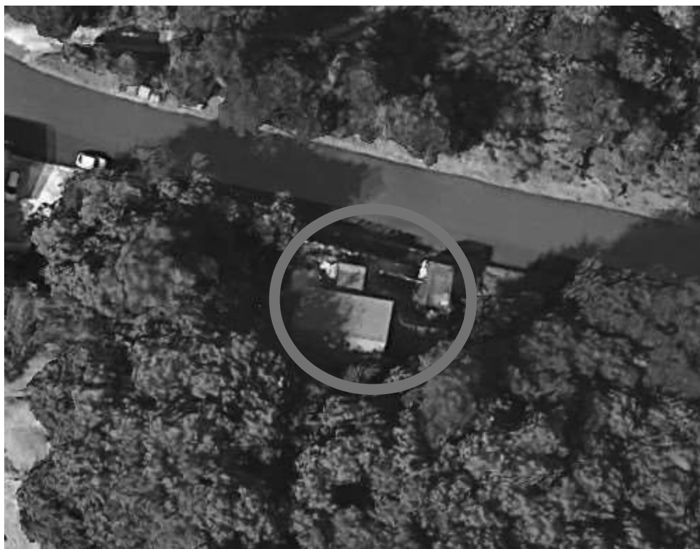
immagine 1: ortofoto con individuazione del fabbricato