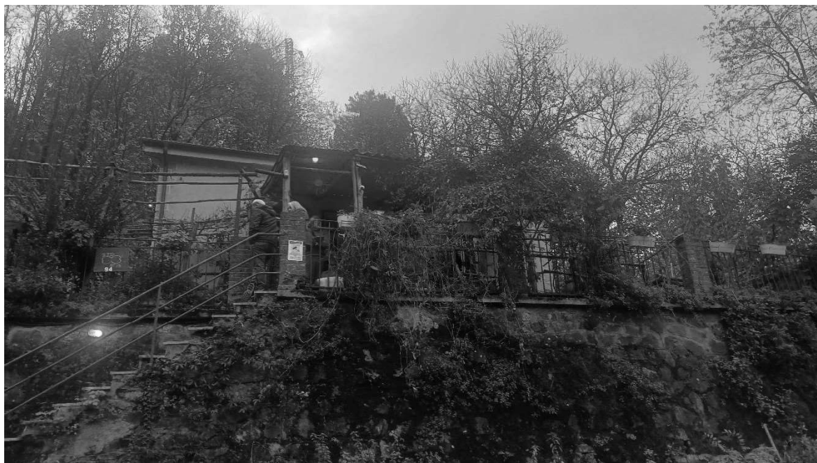
immagine 16: muro di valle antistante il fabbricato

A completamento della presente perizia descrittiva, si vuole porre l'attenzione anche sul muro di sostegno di valle: