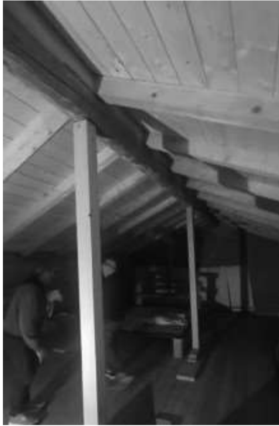
immagine 11: copertura lignea e relativi montanti