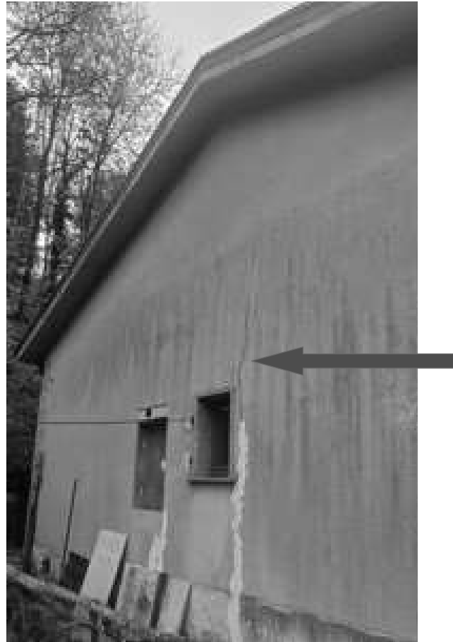
immagine 5: crepa sul prospetto laterale