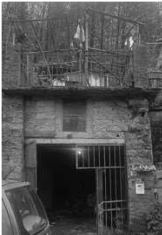
immagine 15: manufatto ad uso box/deposito

Manufatto ad uso box/magazzino a piano strada: sono presenti infiltrazioni di acqua nel muro controterra, il solaio intermedio presenta profilati metallici con uno stato ossidativo avanzato, mentre il solaio di copertura presenta ferrottondini scoperti, arrugginiti e la struttura appare parzialmente compromessa