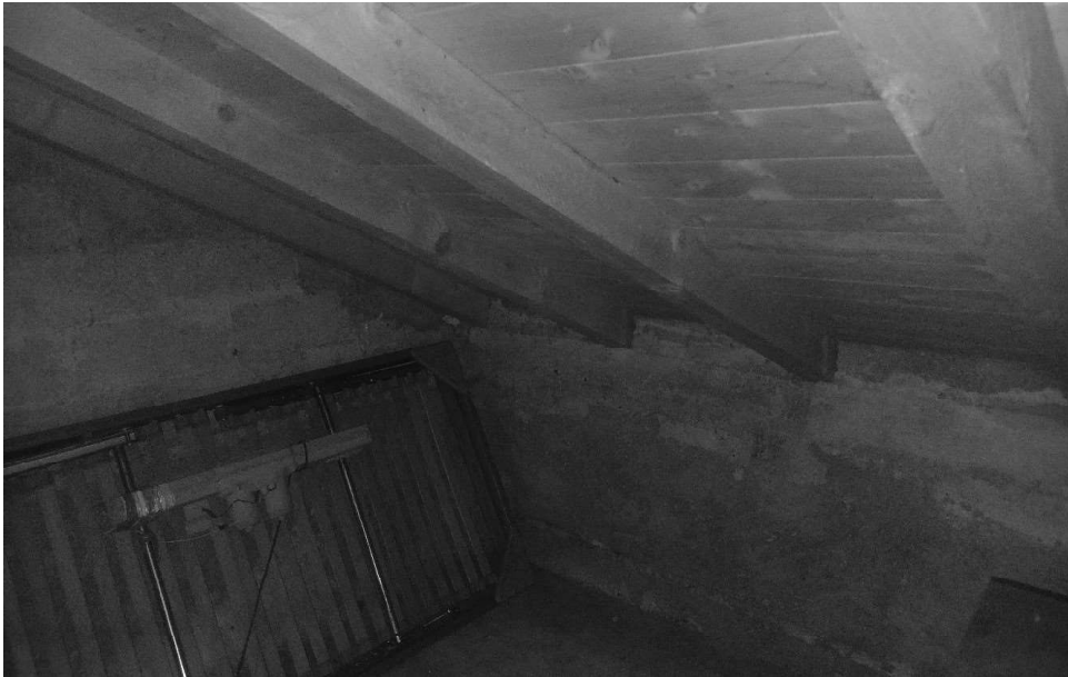
immagine 12: innesto copertura lignea a perimetro