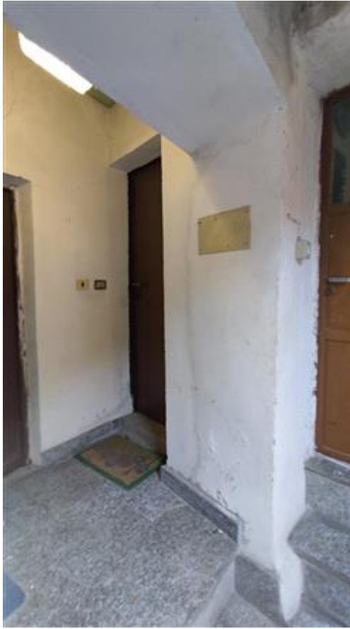
Ingresso all'unità oggetto di pignoramento