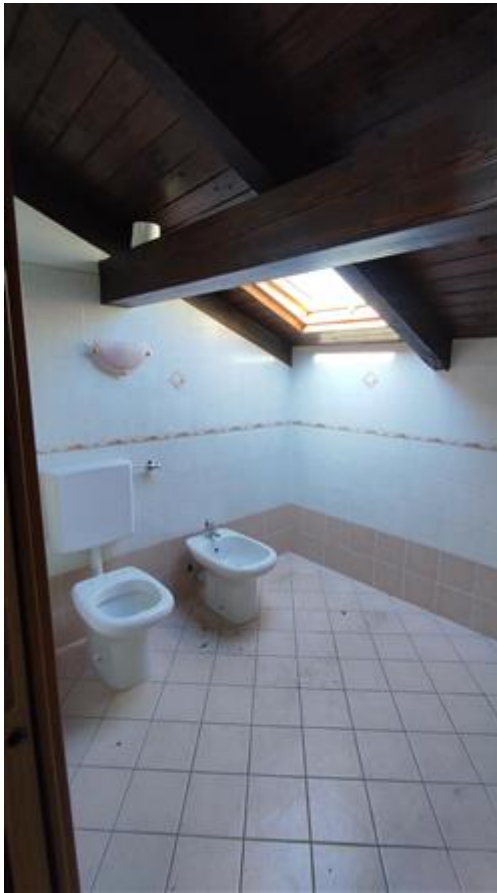
Bagno piano 3