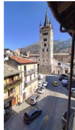
La limitrofa piazza S. Giusto