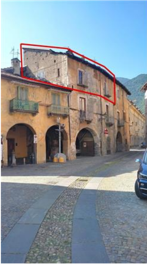
Facciata con indicazione unità oggetto di pignoramento