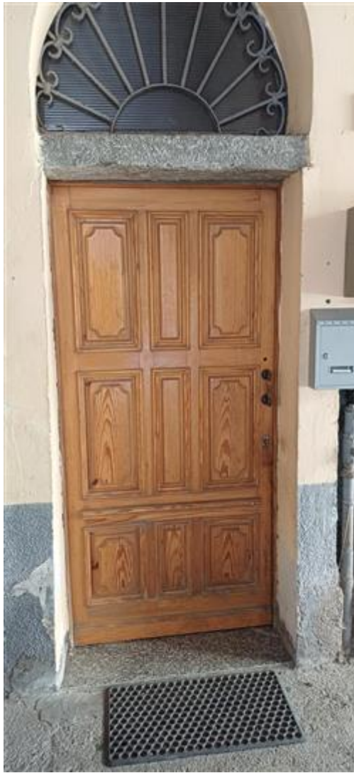
Portoncino d'ingresso allo stabile