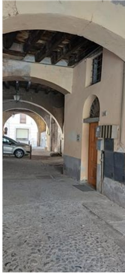
Porticato d'ingresso allo stabile