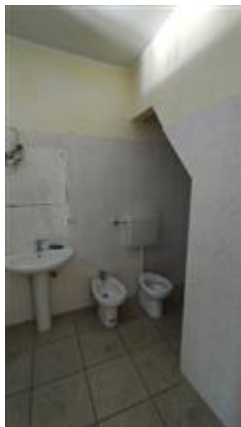
Bagno piano 2