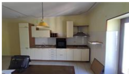
Parete attrezzata cucina