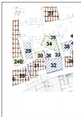
PLANIMETRIA Identificazione fronti ed orientamento