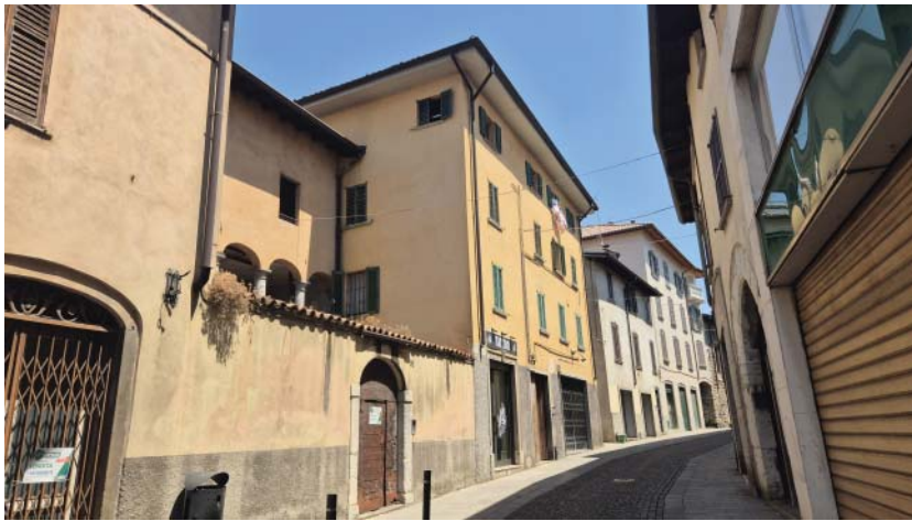
Vista da via G. Garibaldi