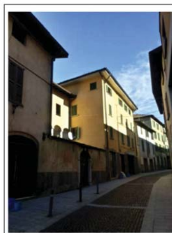
DOCUMENTAZIONE FOTOGRAFICA Vista panoramica di contesto