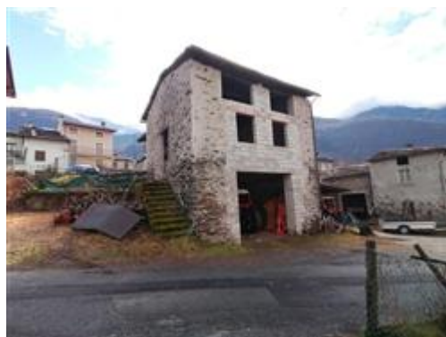
foto 2 - edificio particella 306