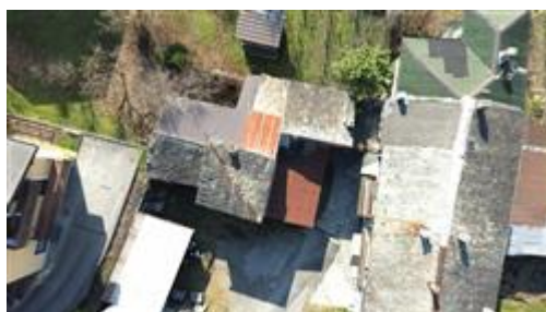
vista aerea dei fabbricati particelle 290-291-777 (LOTTO 2)

I beni sono ubicati in zona semicentrale in un'area residenziale, le zone limitrofe si trovano in un'area residenziale (i più importanti centri limitrofi sono Sondrio). Il traffico nella zona è locale, i parcheggi sono sufficienti. Sono inoltre presenti i servizi di urbanizzazione primaria e secondaria.