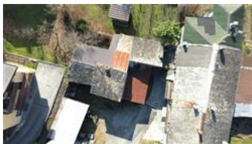
vista aerea dei fabbricati particelle 290-291-777 (LOTTO 2)