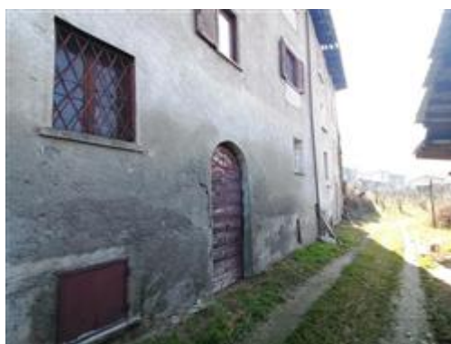
accesso alla cantina particella 198 sub. 1

L'intero edificio sviluppa 4 piani, 3 piani fuori terra, 1 piano interrato. Immobile costruito nel 1940.