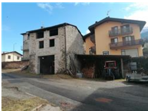
foto 1 - edificio particella 306