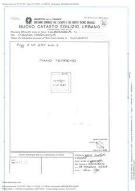
scheda catastale fabbricato particella 291 sub. 1