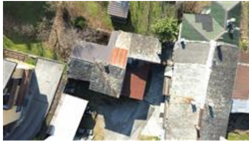
vista aerea dei fabbricati particelle 290-291-777 (LOTTO 2)

I beni sono ubicati in zona semicentrale in un'area residenziale, le zone limitrofe si trovano in un'area residenziale (i più importanti centri limitrofi sono Sondrio). Il traffico nella zona è locale, i parcheggi sono sufficienti. Sono inoltre presenti i servizi di urbanizzazione primaria e secondaria.