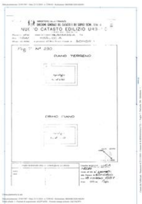
scheda catastale fabbricato particella 290