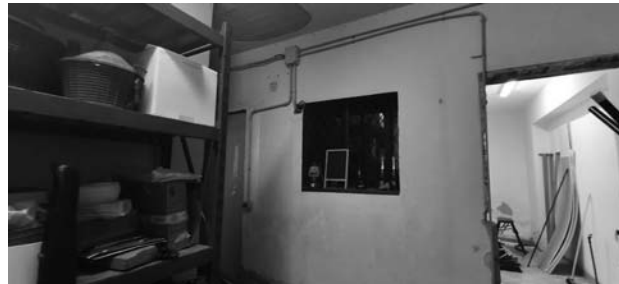
Ex Pozzo Luce