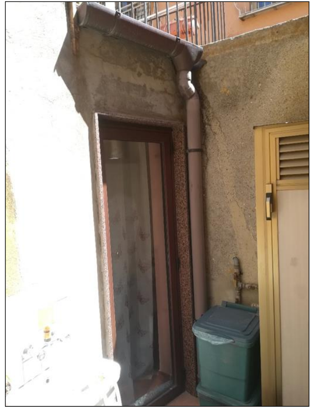
Foto n. 15-16 Cortile esterno