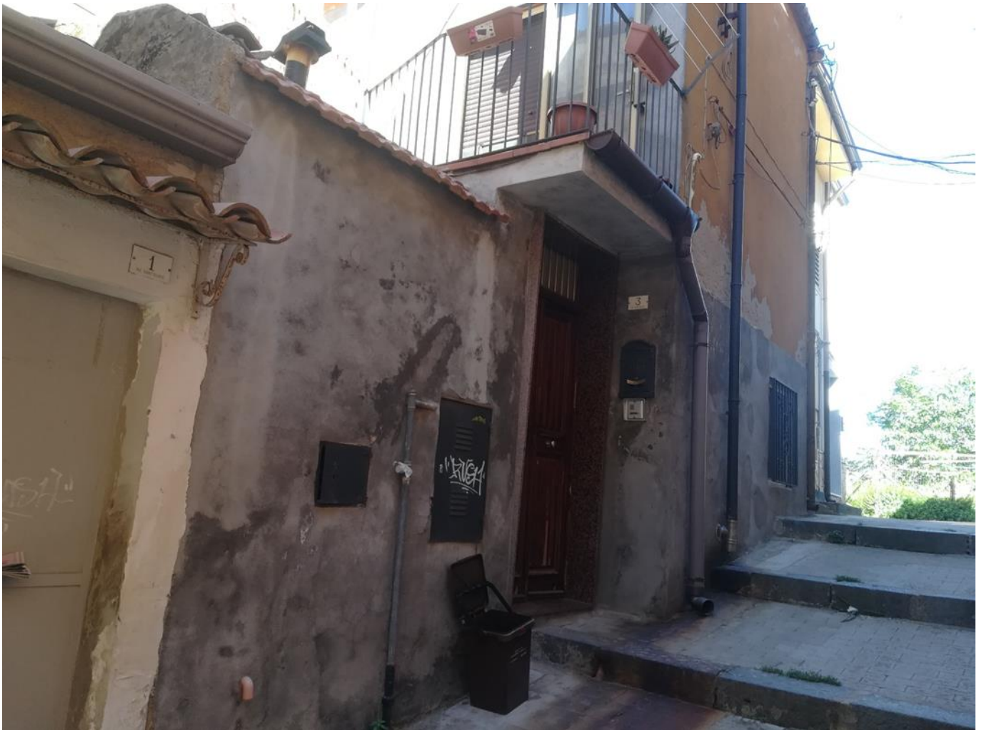
Foto n. 4 - Esterno