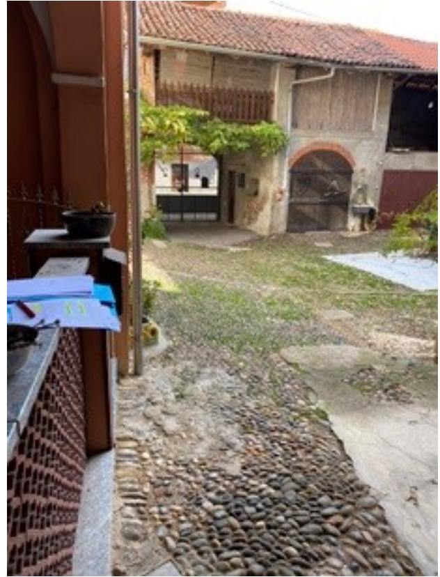
2 passo carraio part. 78 e corte part. 81