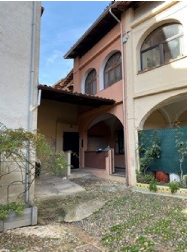
3 fronte Sud dalla corte part. 81