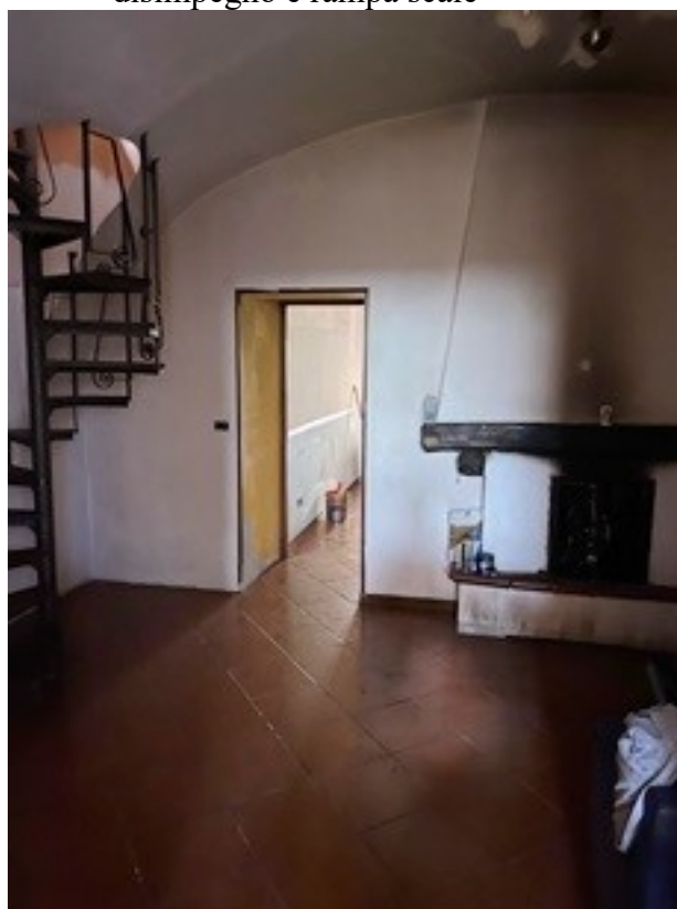
6 disimpegno e rampa scale