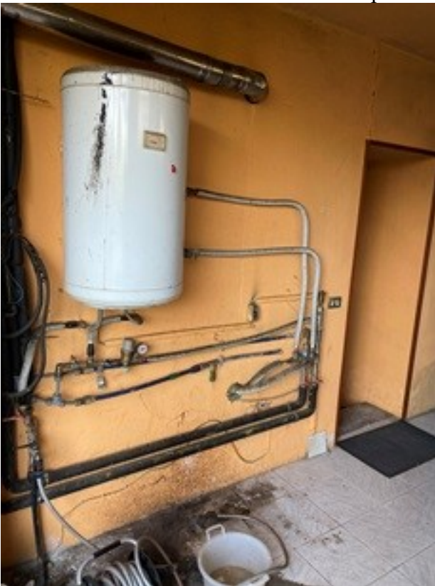
15 rete distribuzione riscaldamento /ACS a pellet