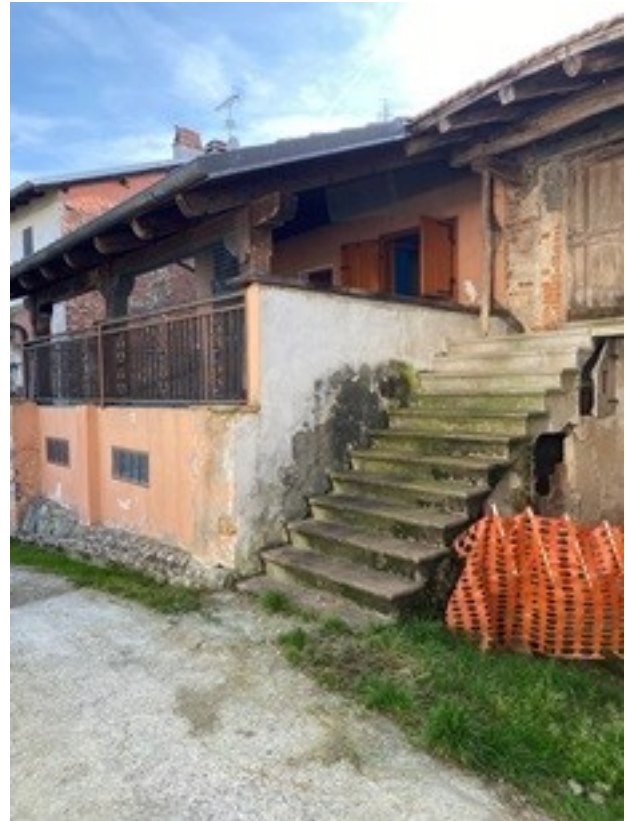
14 fronte Nord