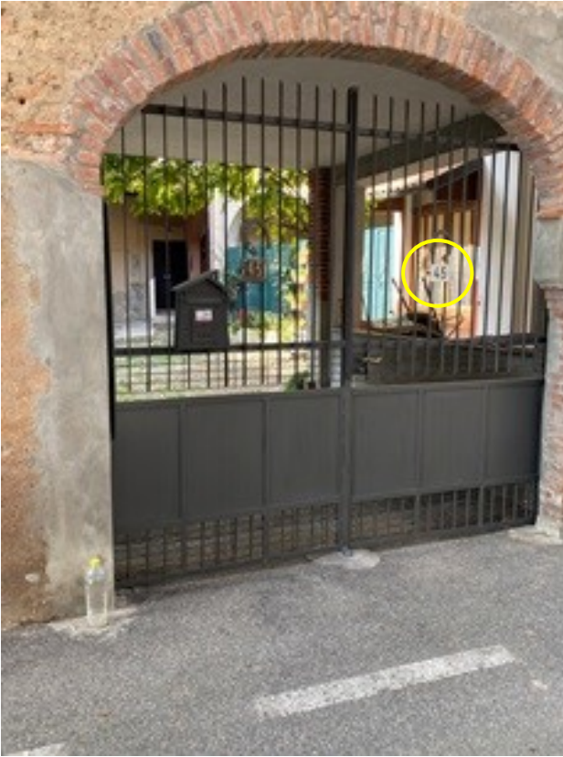
1 ingresso da via Dante Alighieri 45