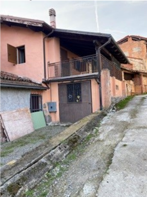
13 ingresso autorimessa e fronte Nord