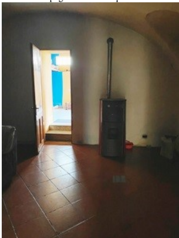
7 disimpegno e caldaia a pellet