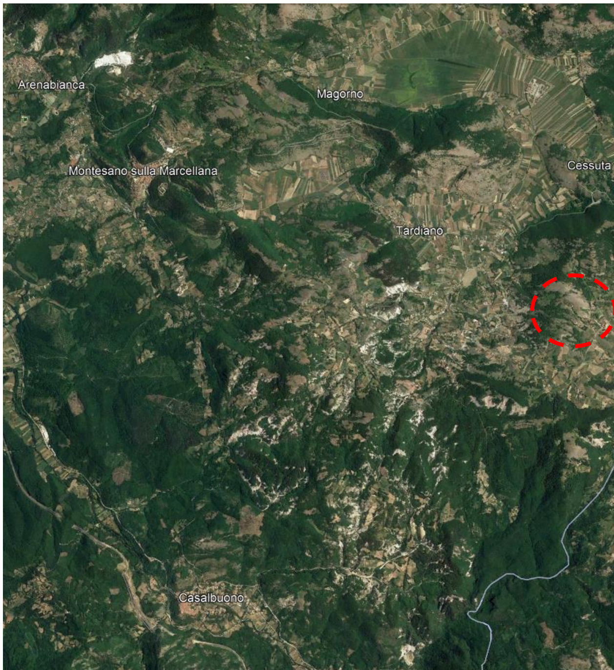
Immobilie ubicato in Montesano sulla Marcellana (Sa) via Perillo

QUESITO n.14: acquisire le certificazioni di stato civile, dell'ufficio anagrafe e della Camera di Commercio e precisare il regime patrimoniale in caso di matrimonio.