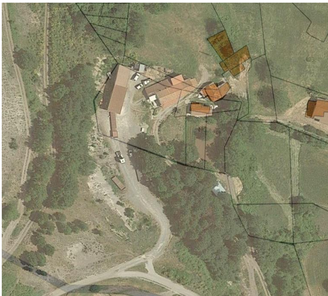
Sovrapposizione foto aerea con stralcio catastale

Dalla documentazione estratta non risulta che vi siano variazioni rispetto a quanto depositato dal creditore precedente ai sensi dell’ex art. 567 c.p.c..