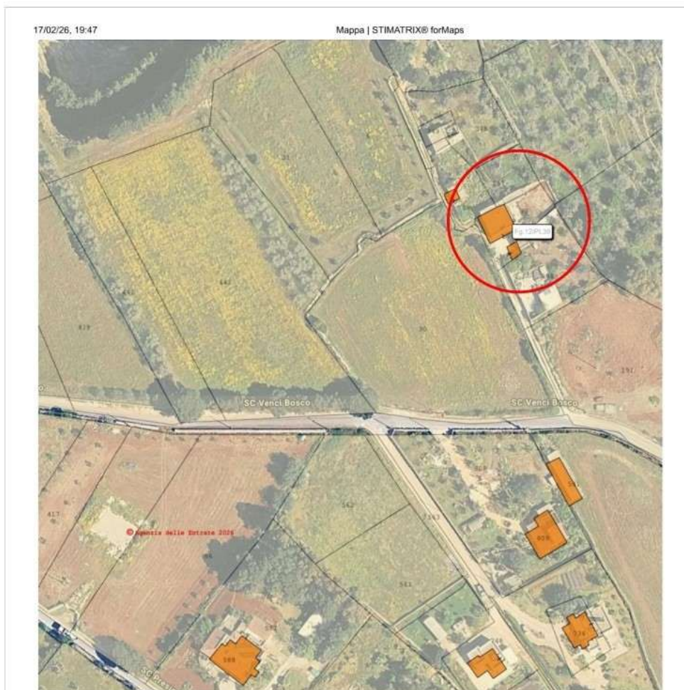
LOCALIZZAZIONE DELLA ZONA SU CATASTALE SOVRAPPOSTO A FOTO SATELLITARE

Al piano terra, oltre a un garage e alcuni vani abusivi, si trova un'abitazione composta da n. 3 vani letto, n. 1 vano tinello, n.1 cottura, n.1 bagno, n.1 corridoio; completa la dotazione di piano l'area scoperta di pertinenza.