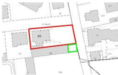
con poligonale rossa area mappale 65 comune alle uiu residenziali e box, in poligonale verde l'area di circa 37 mq. assegnata al lotto 1

Il cortile identificato con il mappale 65, su cui si affacciano tutte le unità immobiliari componenti il fabbricato residenziale che il corpo di fabbrica ad uso autorimessa, rimarrà comune alle anzidette u.i.u.. L'area comune scoperta di cui al mappale 65, oggi delimitata a nord dalla Via Tasso con recinzione, delimitata a est dalla Via Dante con recinzione, delimitata a sud per circa 6 mt da recinzione e per il restante sviluppo da fabbricato di cui al mappale 126, a ovest da recinzione e parte con fabbricato ad uso autorimessa, sarà al netto di una superficie di circa 37 mq. che è assegnata al lotto 1. L'area di circa 37 mq. sempre identificata con il mappale 65, è delimitata dal restante mappale 65, a nord da recinzione dello sviluppo lineare di circa 6 mt, a est dalla Via Dante, a sud dal terreno di cui al mappale 254, a ovest dal fabbricato di cui al mappale 126.