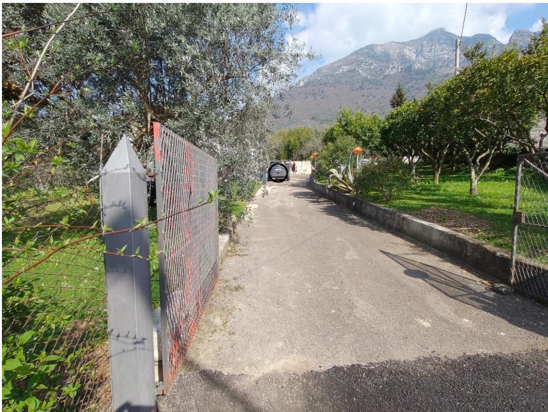
Foto n. 2 __Ingresso vialetto