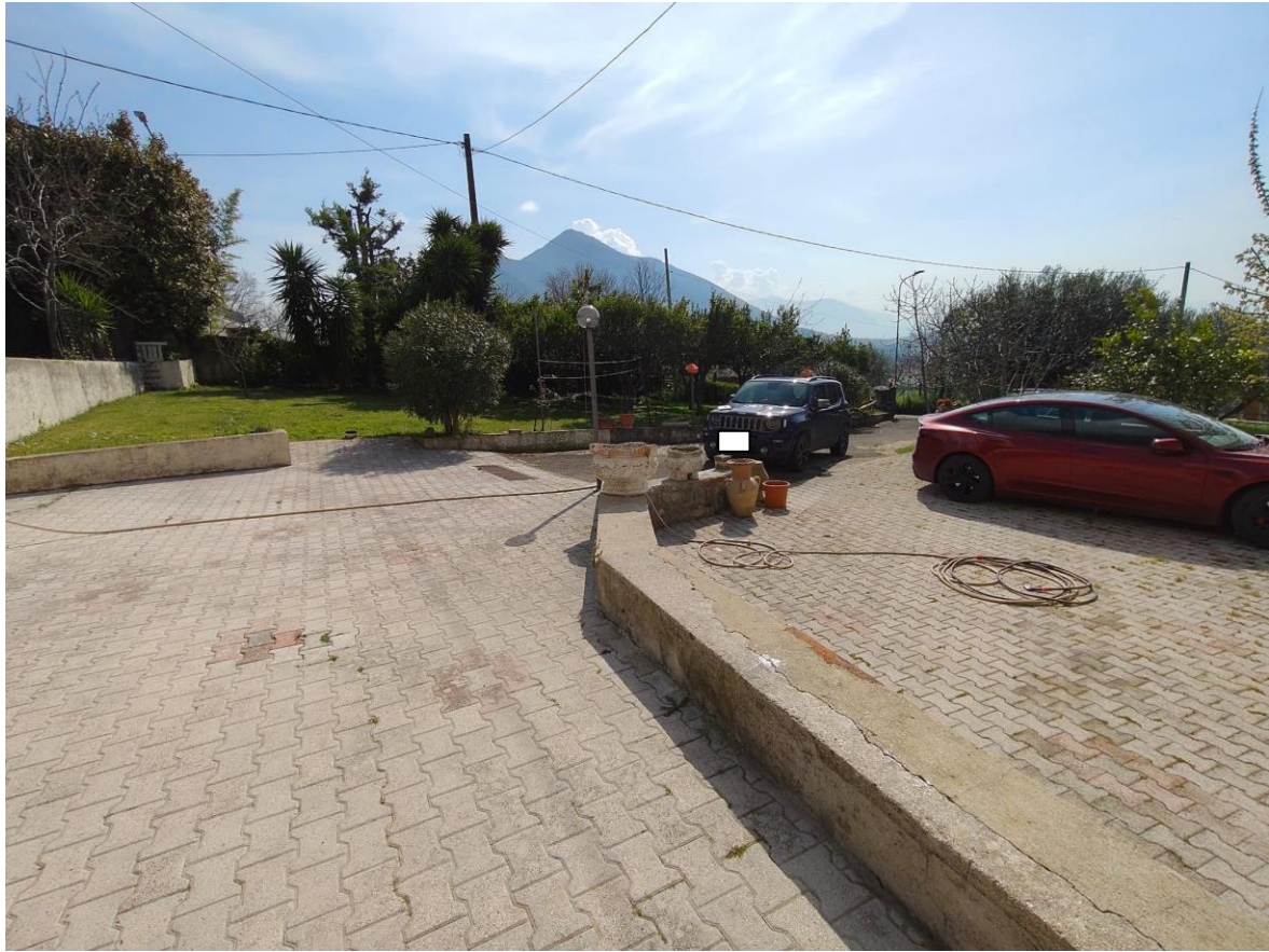
Foto n. 7__ Area di pertinenza al fabbricato