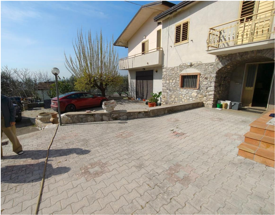
Foto n. 5 Area di pertinenza al fabbricato