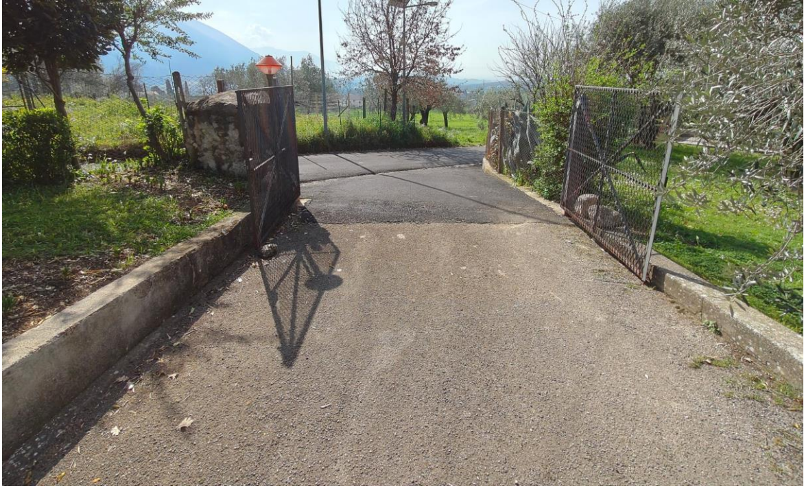
Foto n. 3__Ingresso vialetto