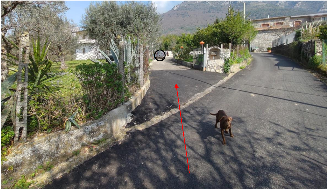
Foto n. 1 __Ingresso da via Peroni (vialetto di accesso al fabbricato pignorato)