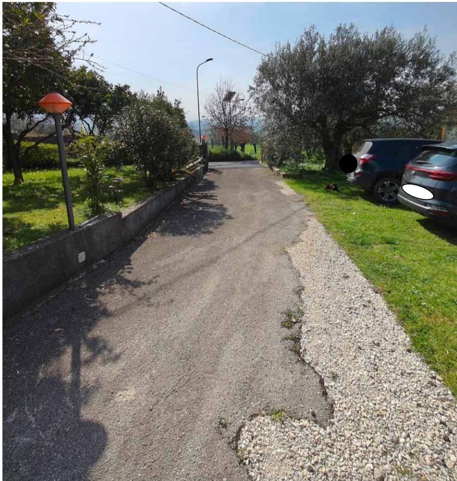
Foto n. 4__Vialeto