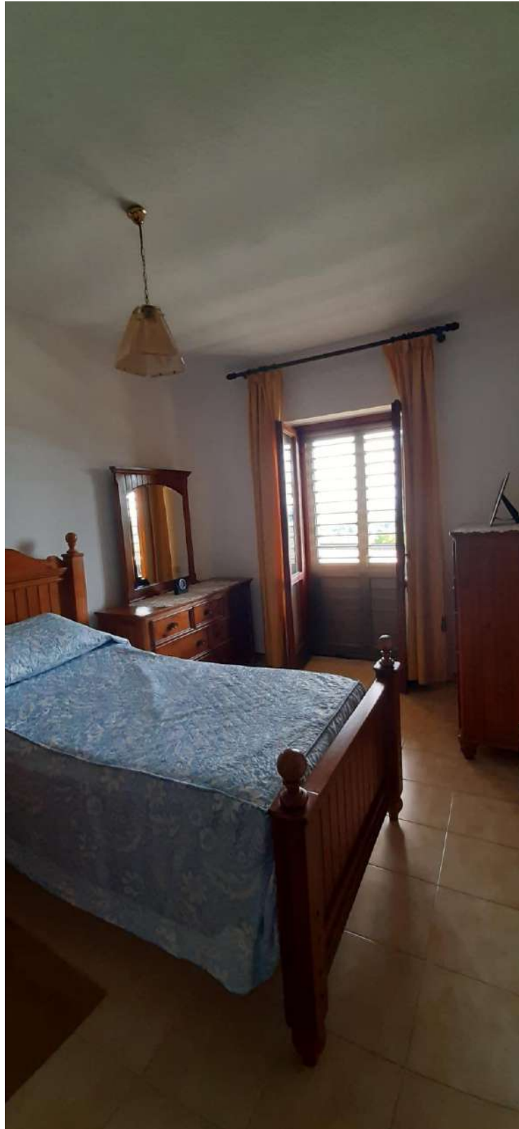
Foto n. 11__ Piano primo camera letto 1