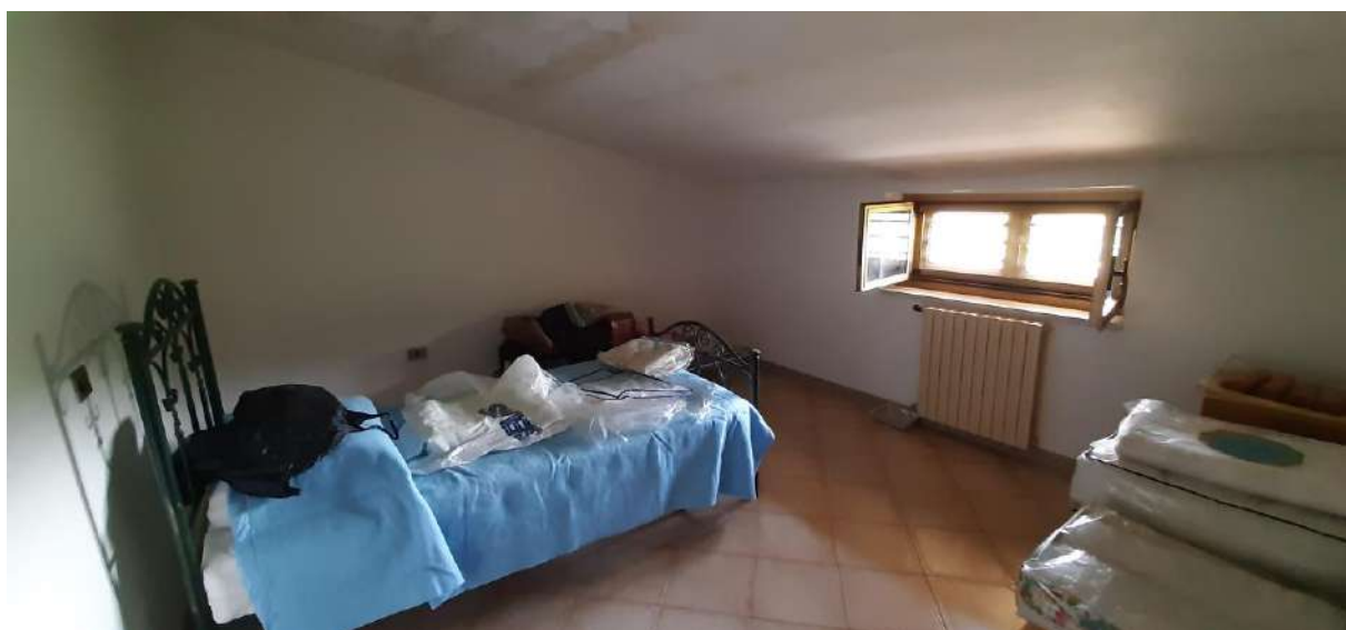
Foto n. 8__ Piano primo camera letto 4