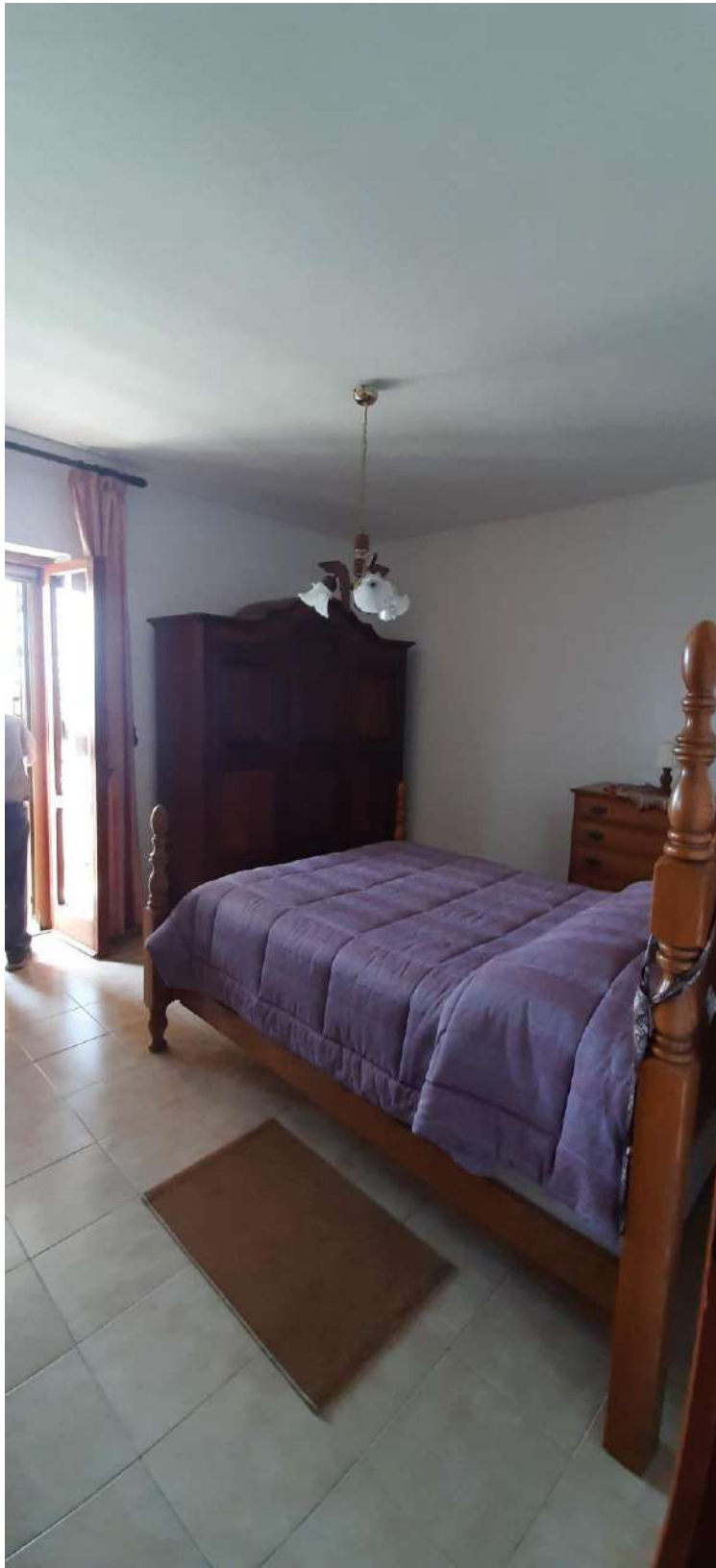
Foto n. 12__ Piano primo camera letto 2