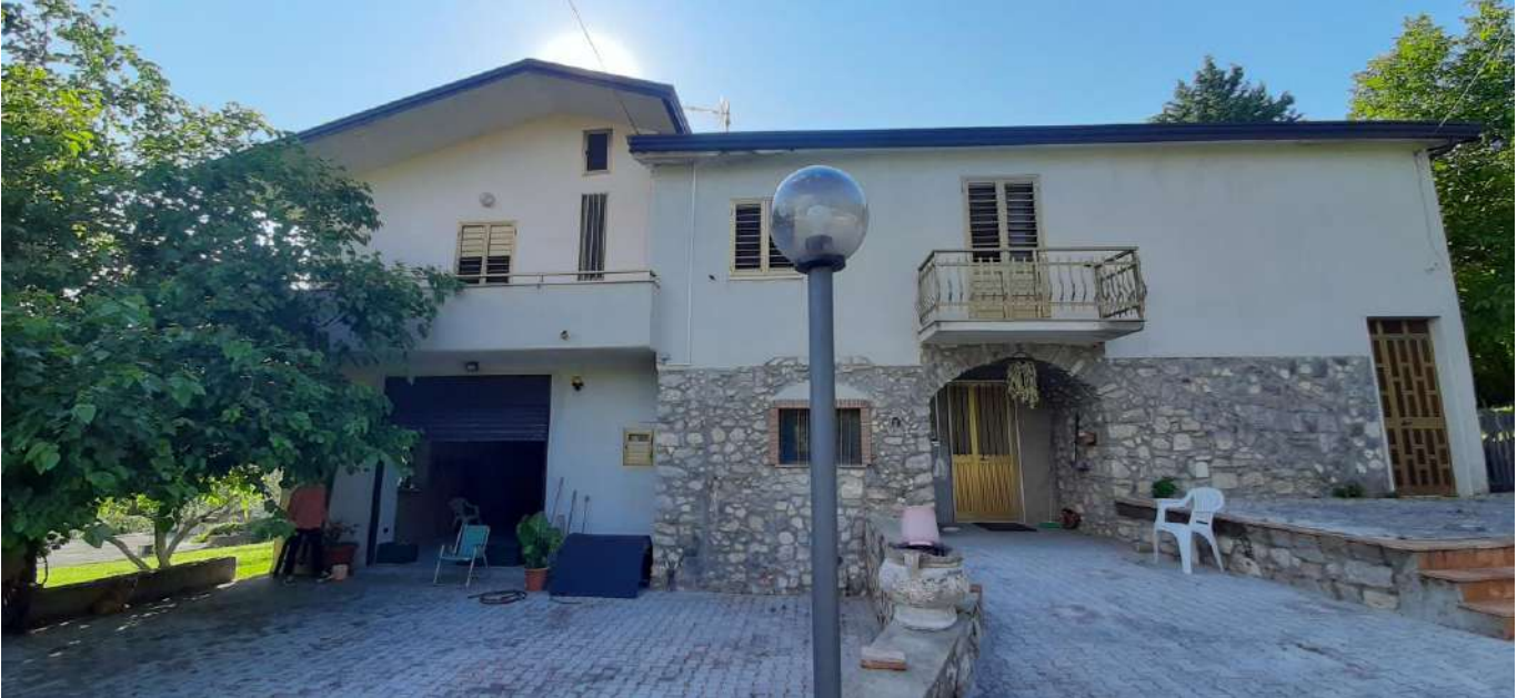
Foto n. 1__ Prospetto principale