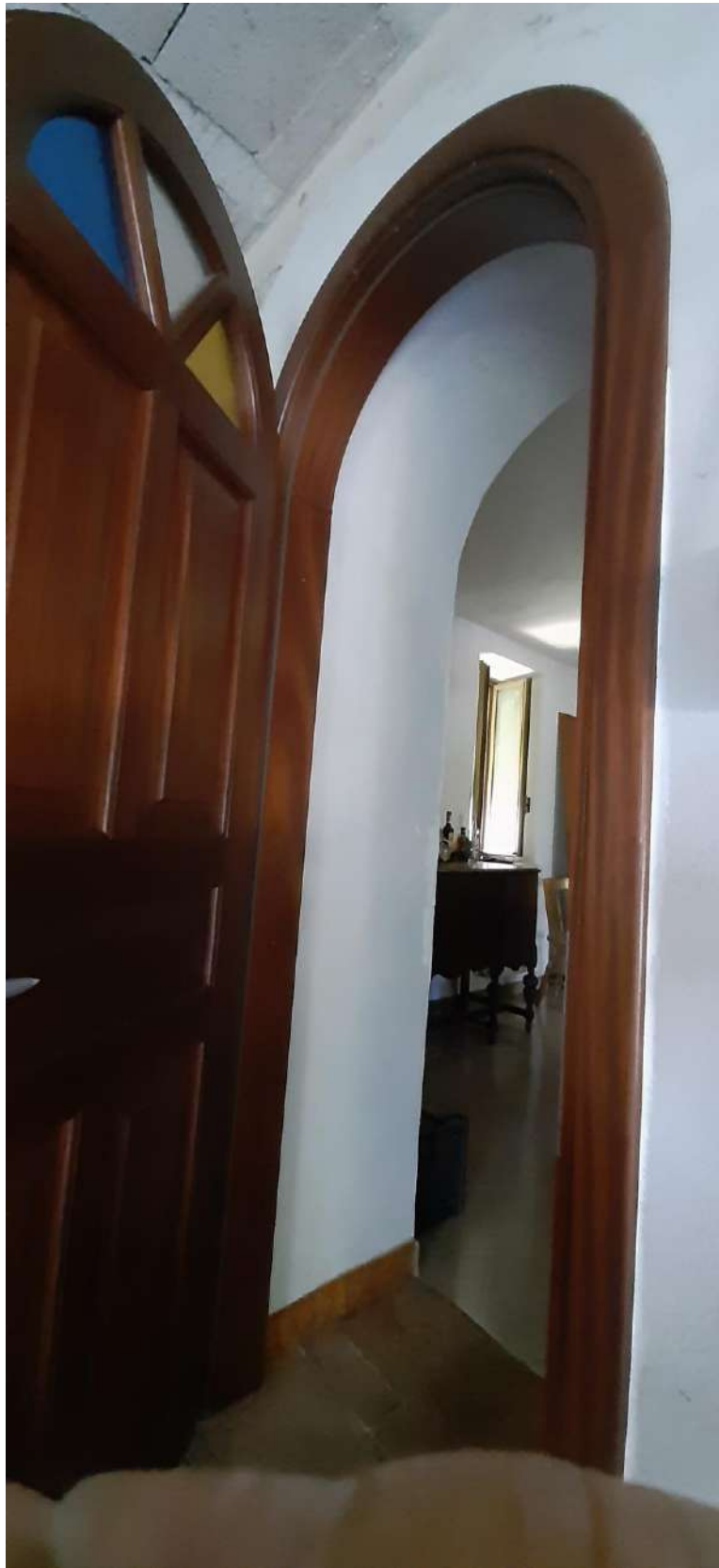
Foto n. 16 Porta di comunicazione tra la cucina e il deposito al Piano terra