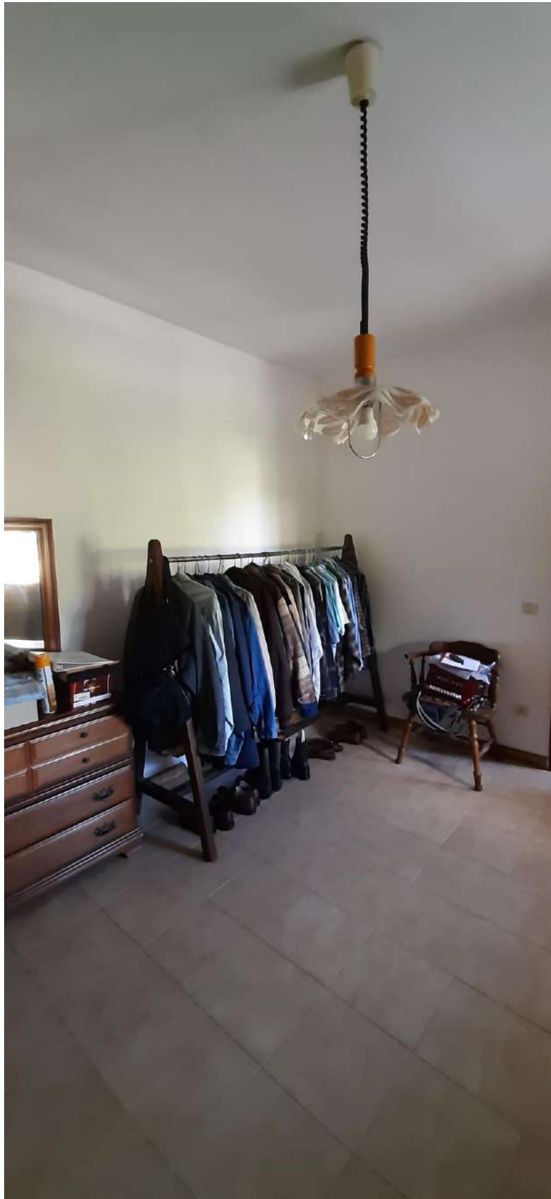
Foto n. 14__ Piano primo camera letto 3