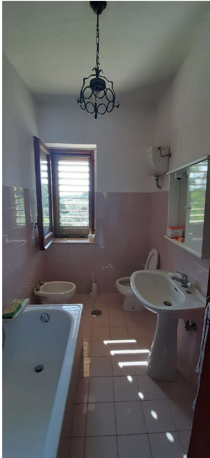
Foto n. 13__ Piano primo Wc 2