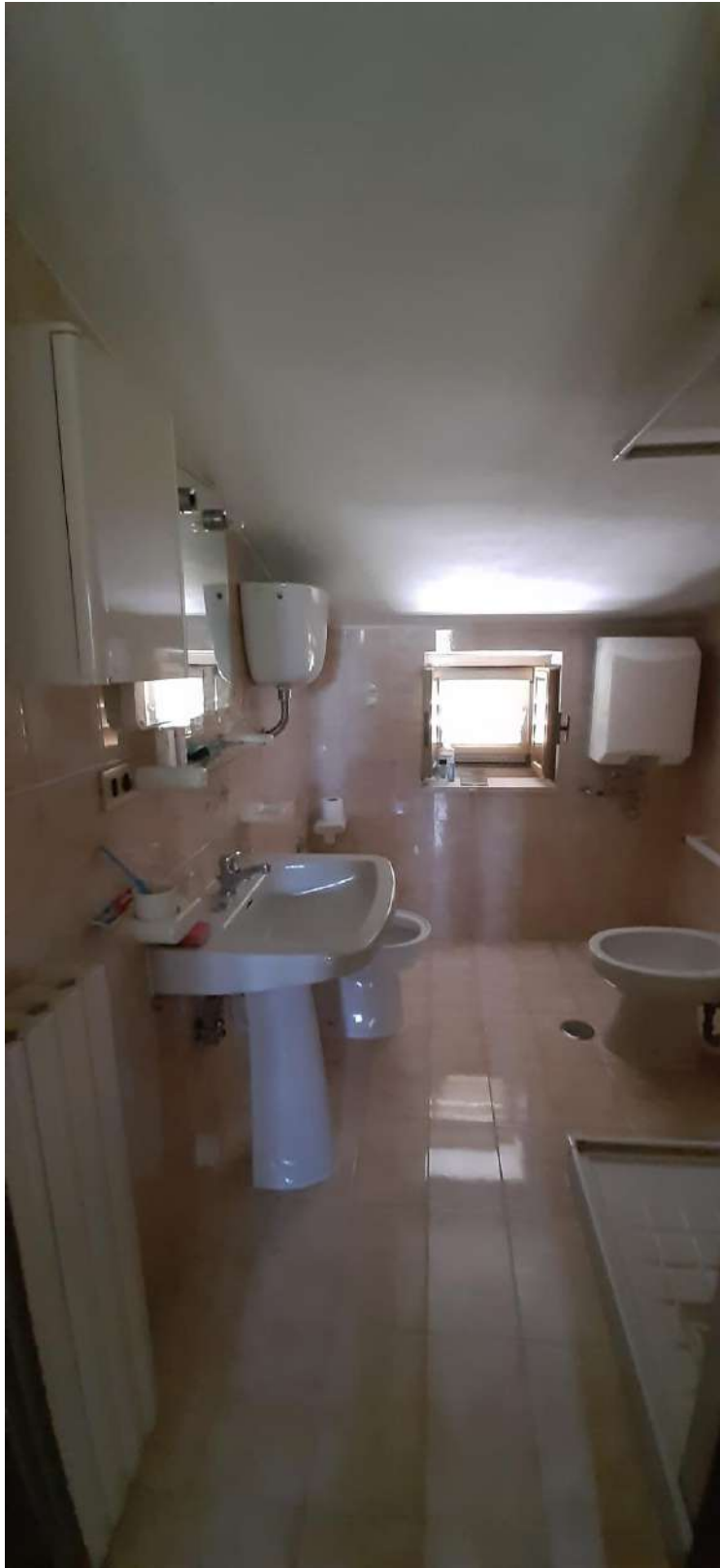
Foto n. 10__Piano primo Wc 1