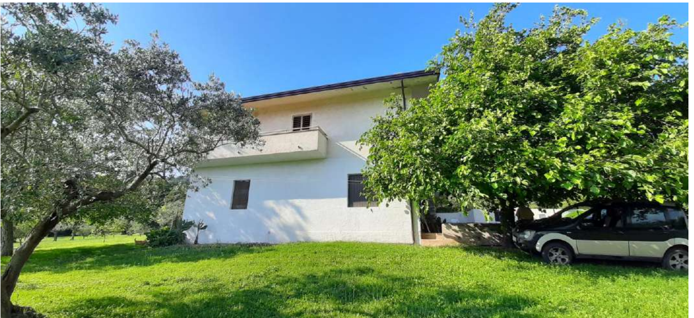
Foto n. 2__ Prospetto laterale sx