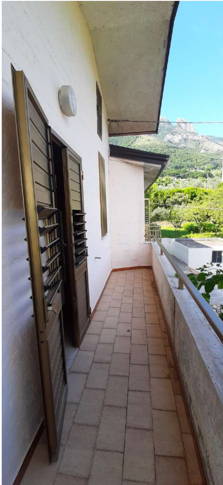
Foto n. 15__Vista dal balcone camera letto 3