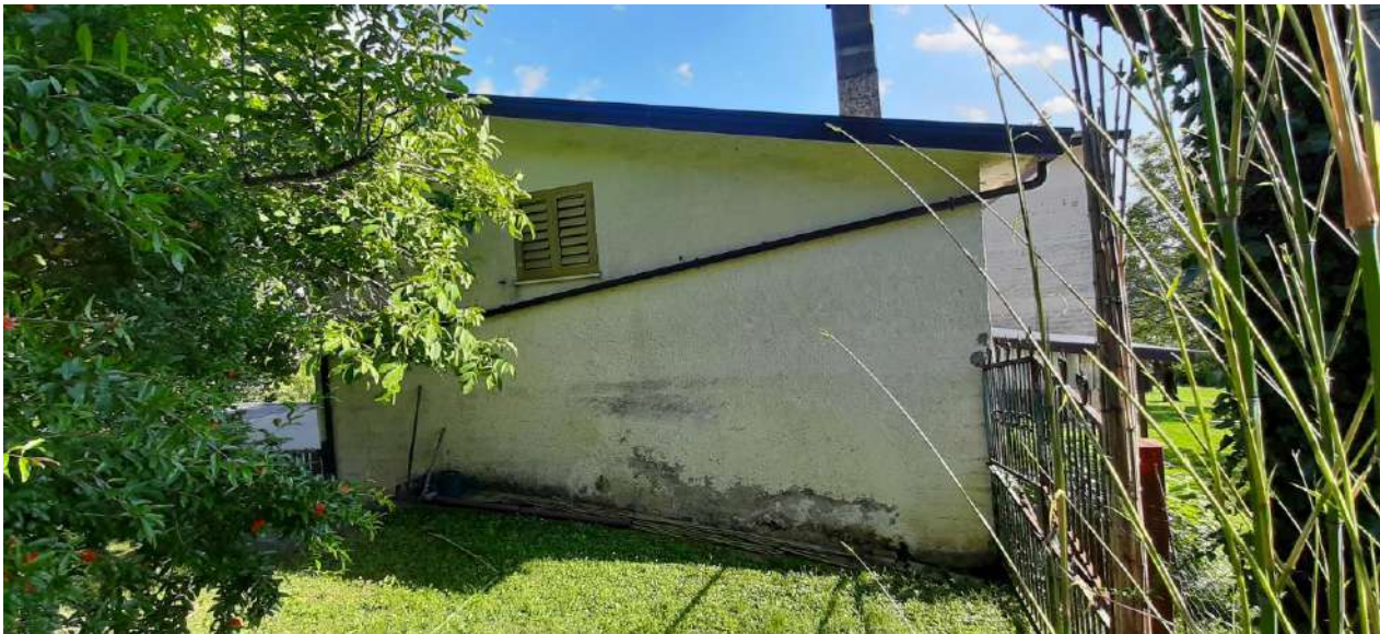
Foto n. 4__ Prospetto laterale dx