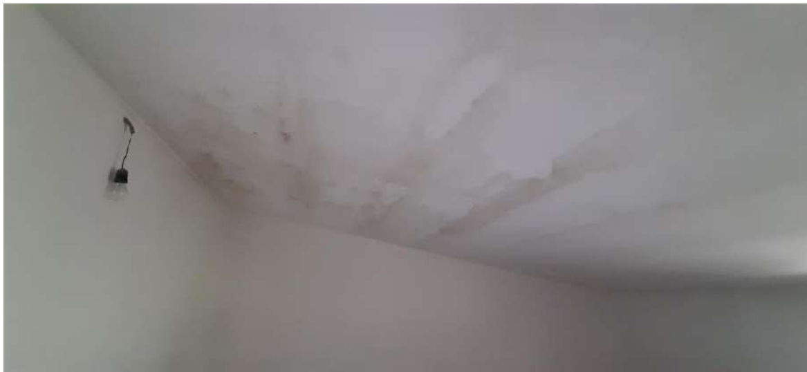
Foto n. 19__Evidente macchie di umidità nella camera da letto 4 (piano primo)