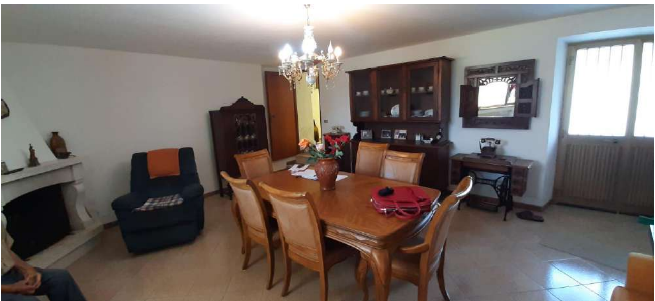
Foto n. 5__ Vista interna soggiorno-pranzo