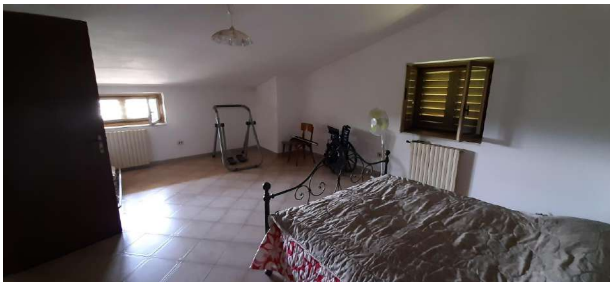
Foto n. 7__ Piano primo camera letto 5