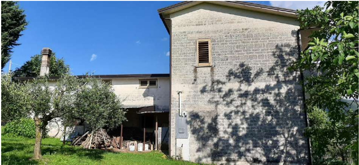
Foto n. 3__ Prospetto posteriore