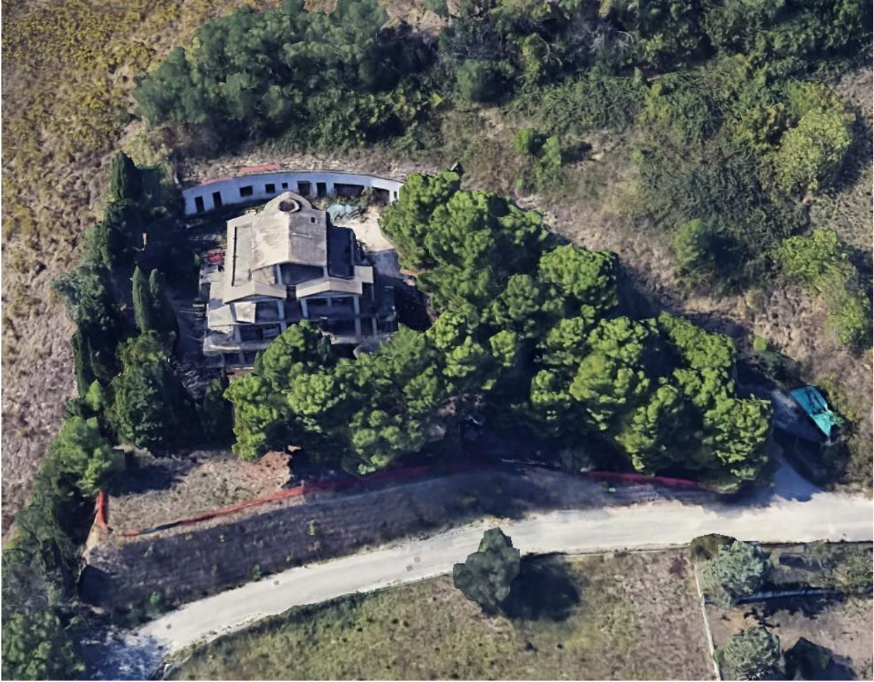
FOTO. N1- VISTA AEREA DEI BENI PIGNORATI