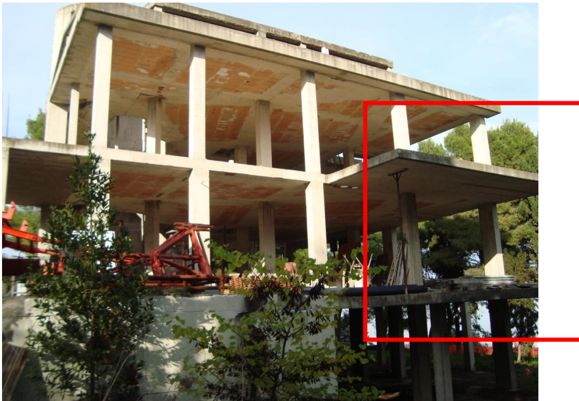
FOTTO N.4 PROSPETTO SUD