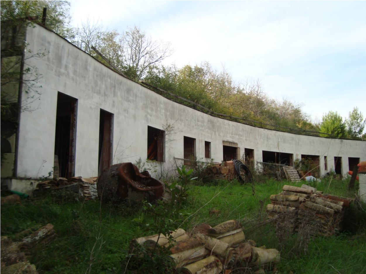
FOTO N. 14 - MANUFATTO TOTALMENTE DIFFORME DAL PROGETTO ASSEVERATO E DEPOSITATO

AL POSTO DEL GARAGE COMPLETAMENTE INTERRATO SORGE UN MANUFATTO EMICIRCOLARE QUASI COMPLETAMENTE FUORITERRA CON NUMEROSE APERTURE E DESTINAZIONE DIVERSA DA GARAGE