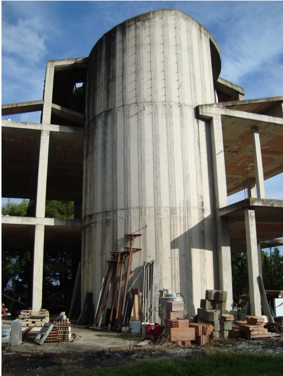
FOTO N. 7 - VANO SCALA CIRCOLARE IN C.A. SUL PROSPETTO OVEST