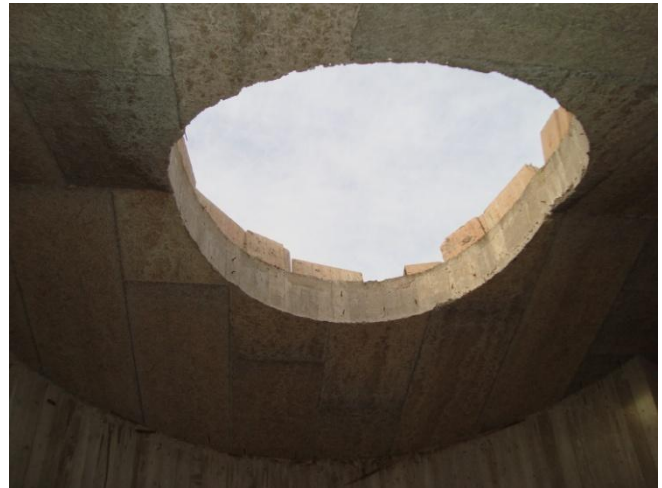
FORO CIRCOLARE SUL VANO SCALE