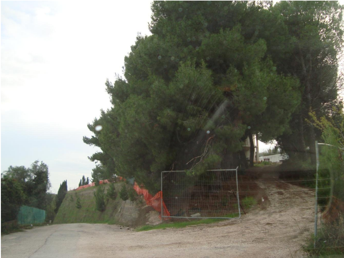
FOTO N.3 – ACCESSO AL LOTTO ( VISIBILE MANUFATTO DI SOSTEGNO IN TERRE ARMATE)