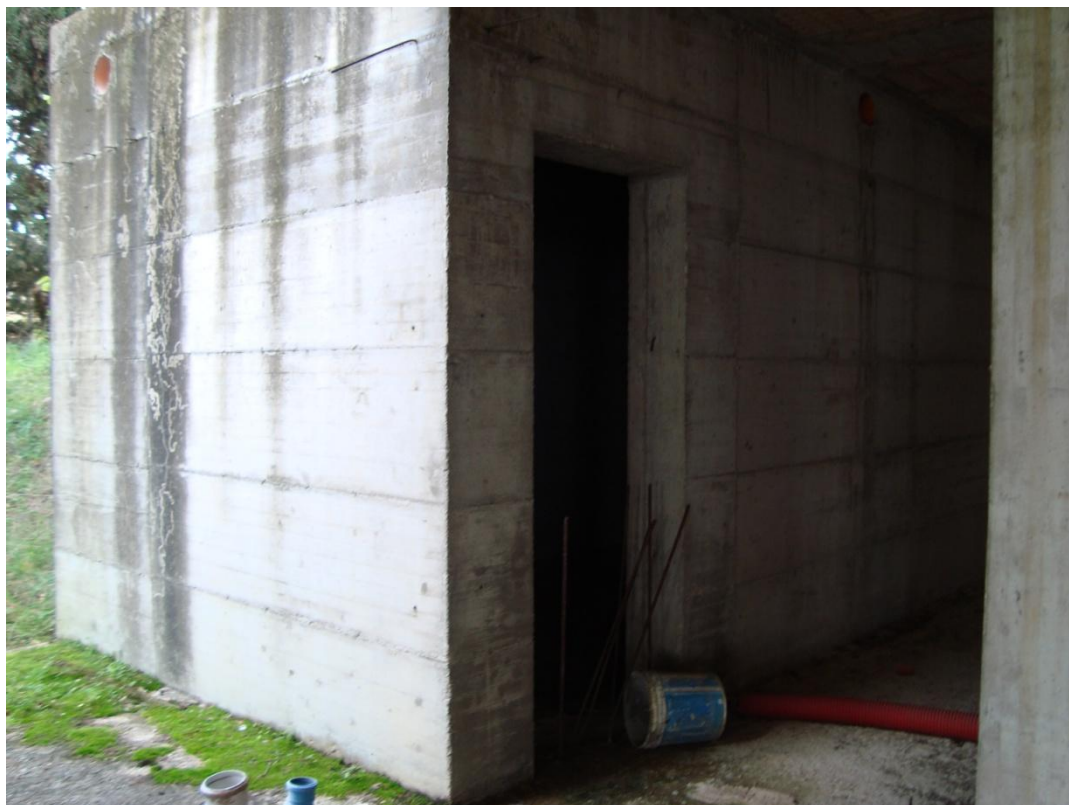
FOTO N.8 - CENTRALE TERNICA ED INGRESSO GARAGE