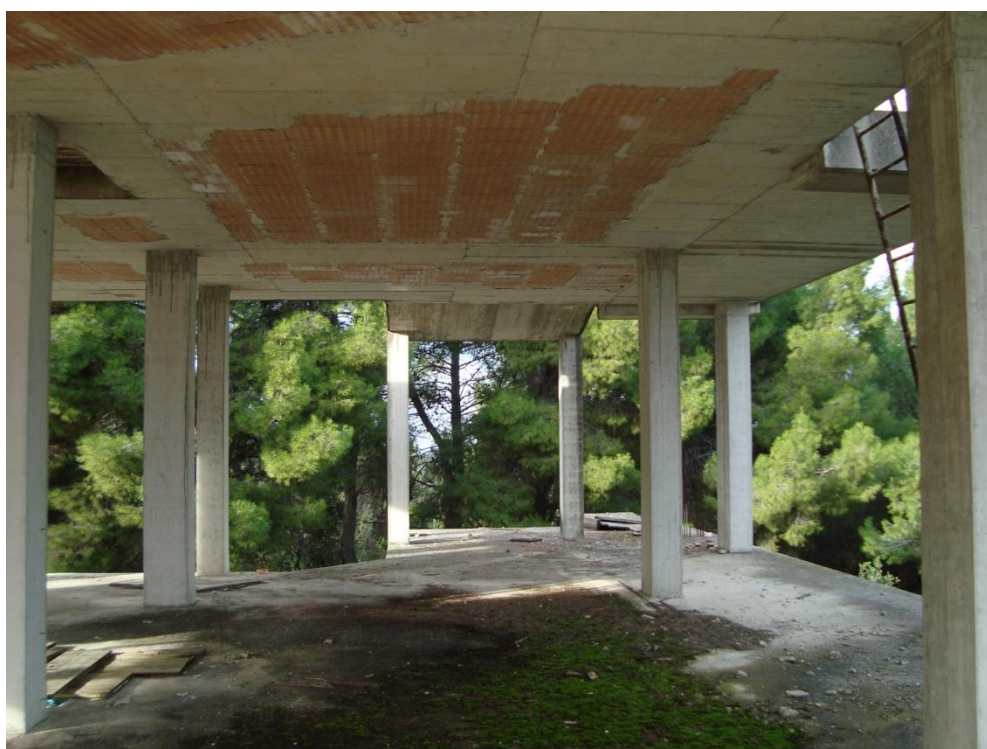
FOTO N.9 - PIANO PRIMO