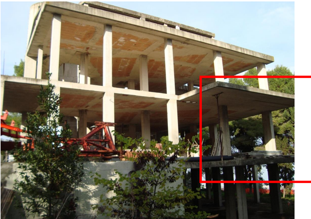
FOTO N.12 - DIFFORMITA' : SBALZI IN C.A. PIU' AMPI DEL PROGETTO DEPOSITATO ANCHE SUL PROSPETTO SUD