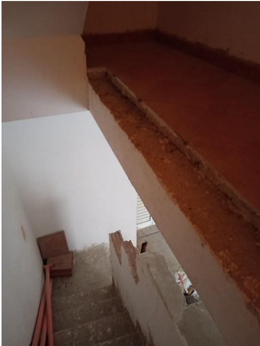
SCALA INTERNA CHE CONDICE DAL P.T AL P.PRIMO