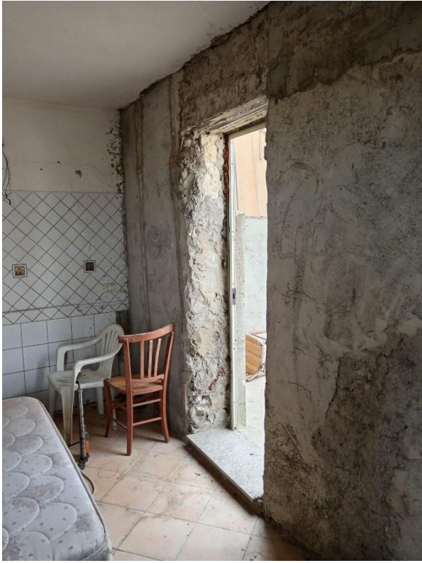
FOTO P. SECONDO, STANZA CON ACCESSO ALLA TERRAZZA