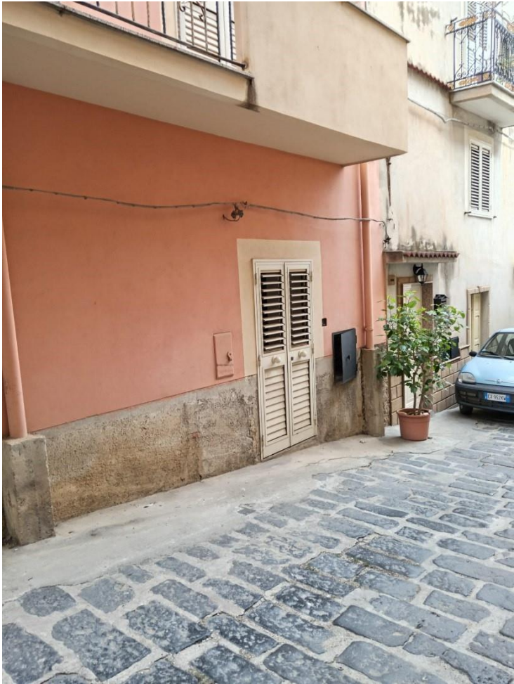
INGRESSO PRINCIPALE DELL'IMMOBILE