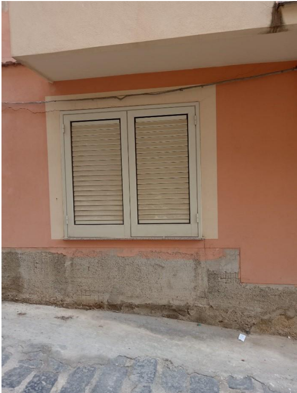
FOTO DEL PROSPETTO DOVE SI EVDENZIA LA MODIFICA DI UNA PORTA FINESTRA IN FINESTRA