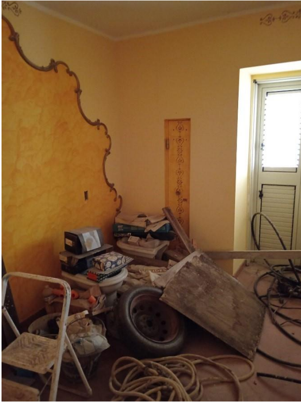
UNA DELLE CAMERE AL P. PRIMO, COME SI NOTA MANCANO INFISSI INTERNI