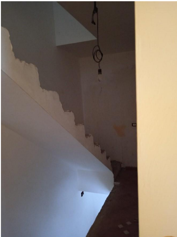
SCALA CHE CONDUCE DAL P. SECONDO AL P. TERZO