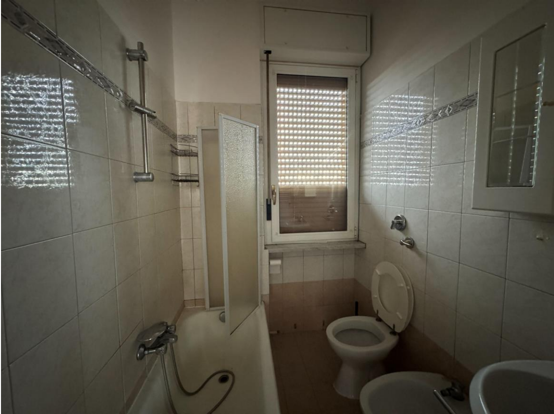
Foto 15. Bagno