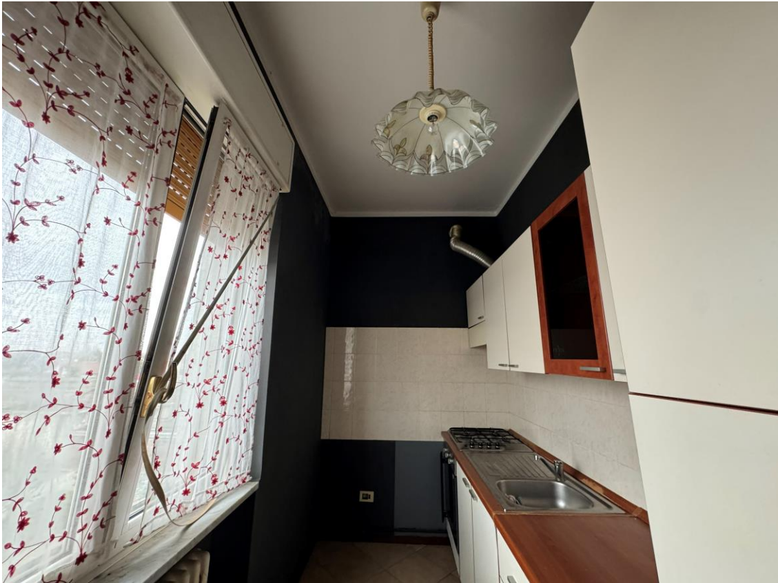
Foto 9. Cucina