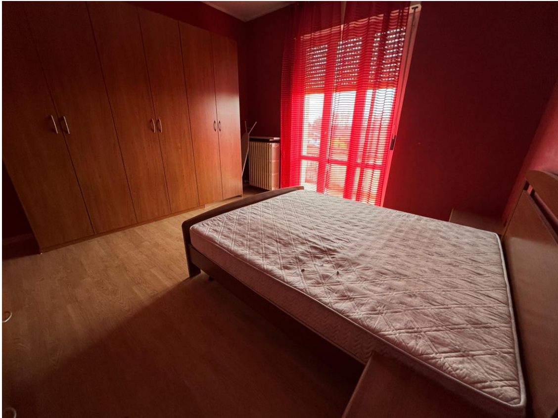
Foto 11. Camera 1