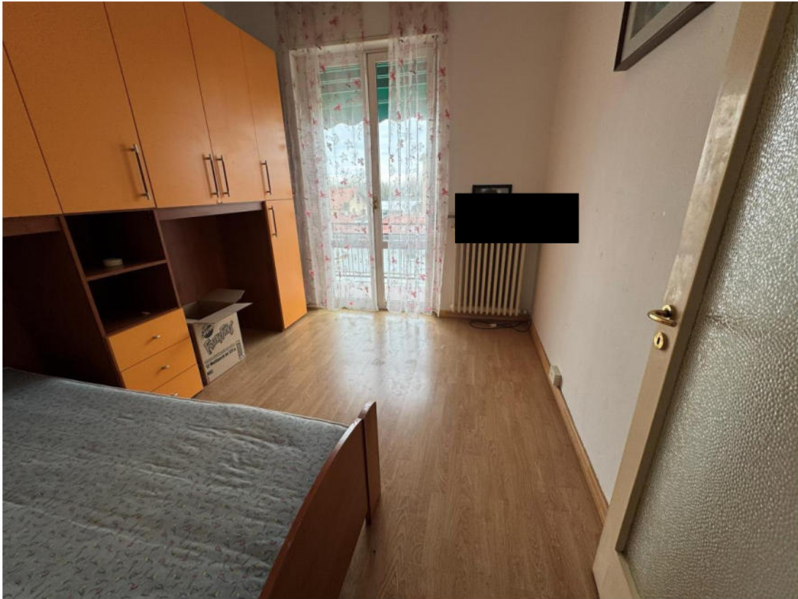
Foto 13. Camera 2