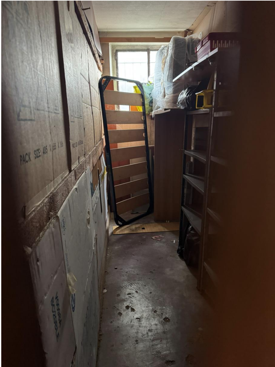
Foto 19. Vista cantina