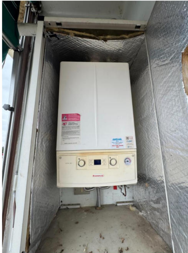
Foto 17. Stato attuale calderina