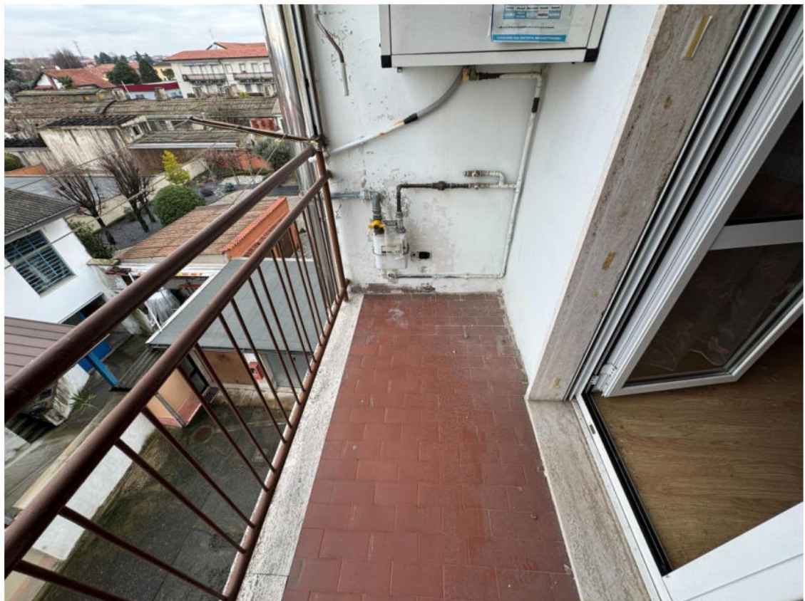
Foto 14. Terrazzo Camera 2