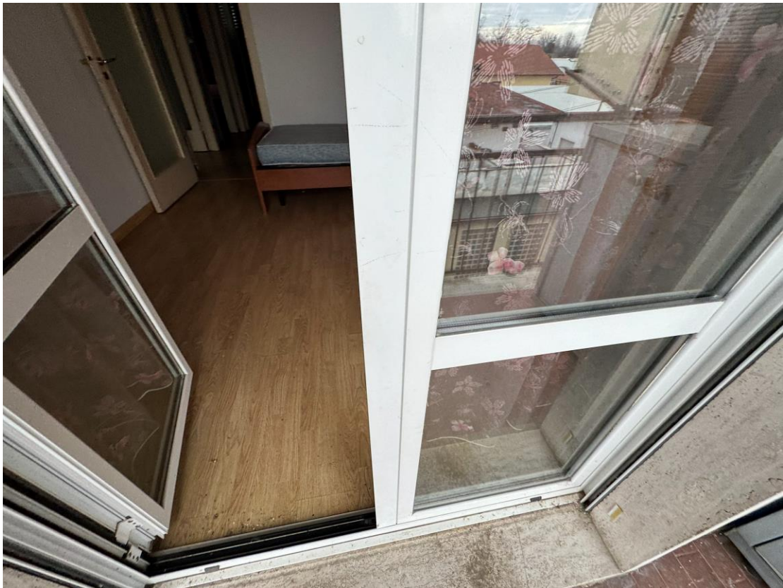
Foto 16. Particolare infissi esterni