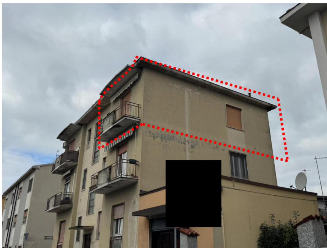
Foto 2. Identificazione dell'appartamento sul prospetto sud-est