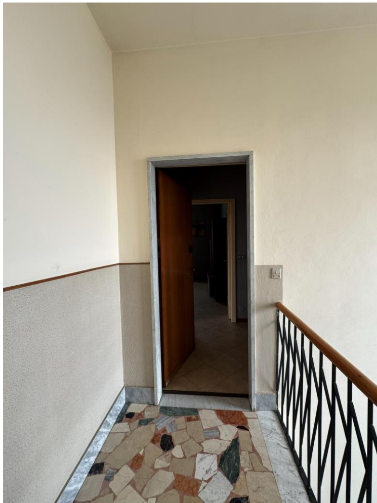
Foto 6. Ingresso