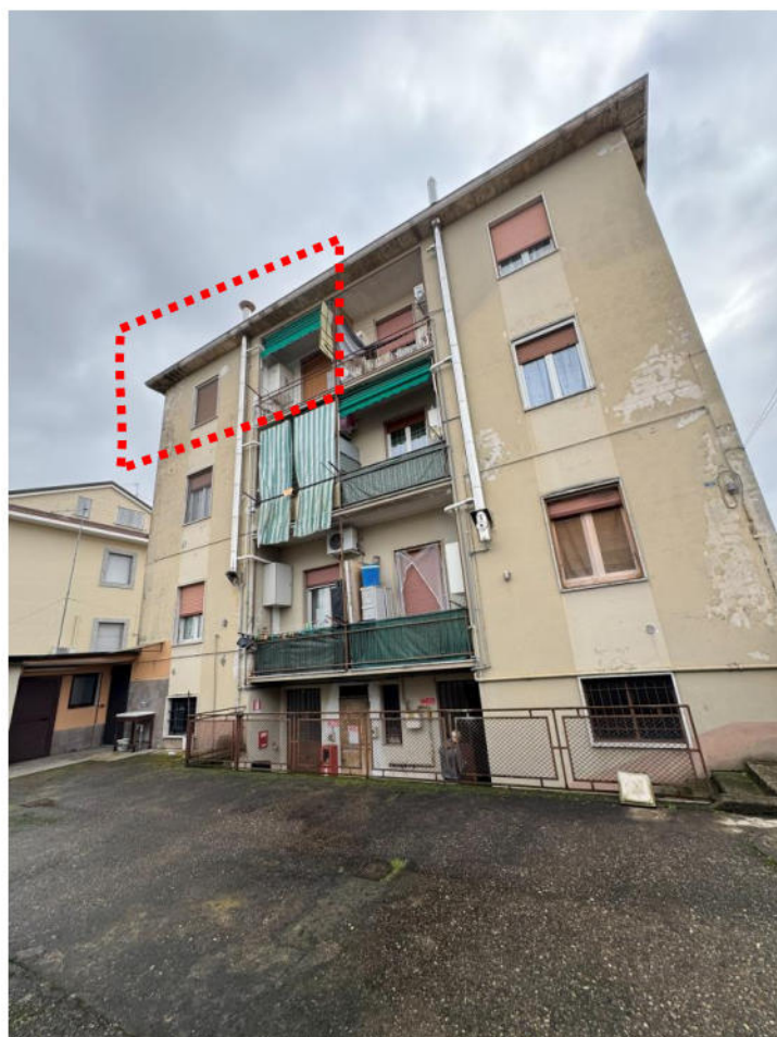
Foto 3. Identificazione dell'appartamento sul prospetto nord