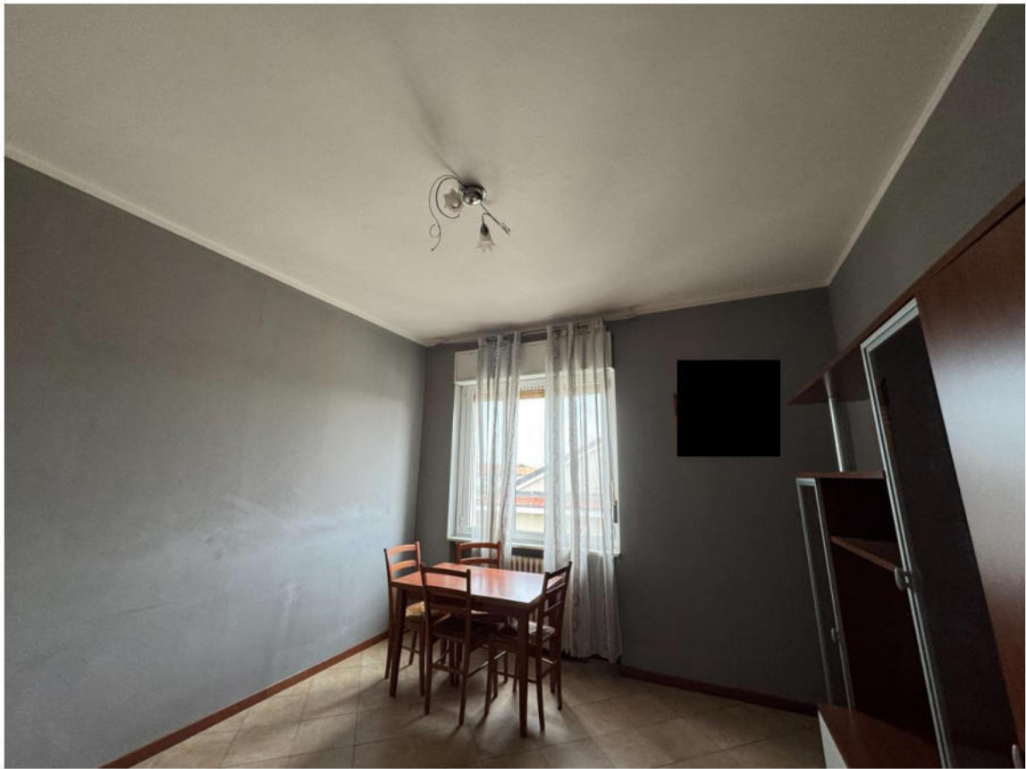
Foto 7. Soggiorno