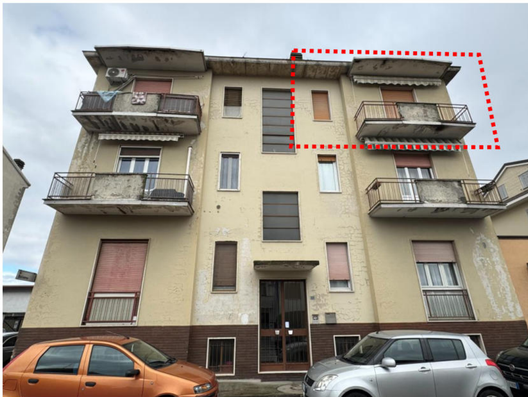
Foto 1. Fabbricato di cui fa parte l'immobile oggetto di stima vista sud