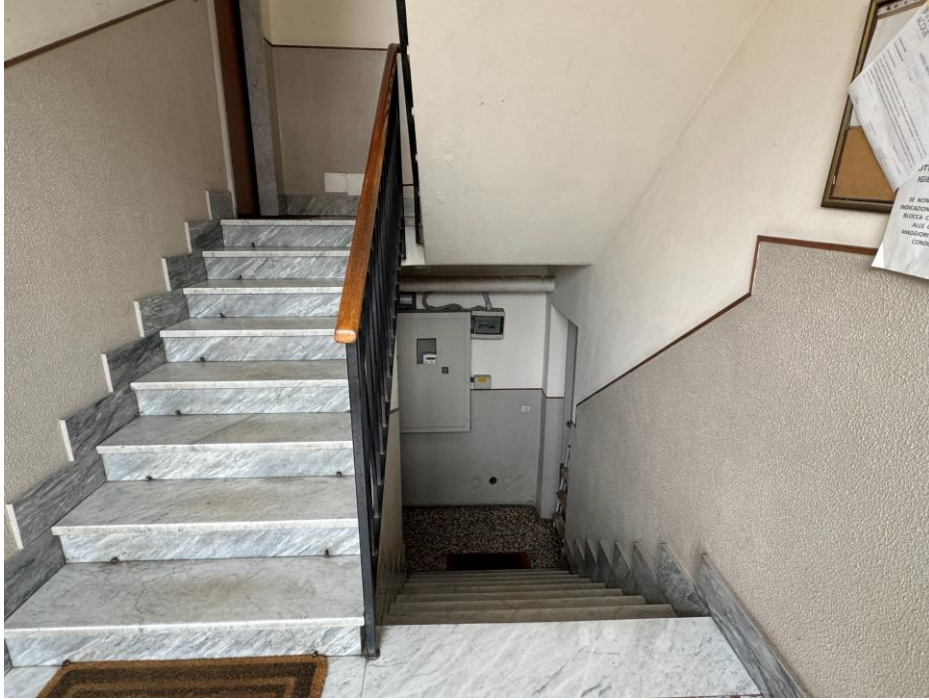
Foto 5. Vano scala