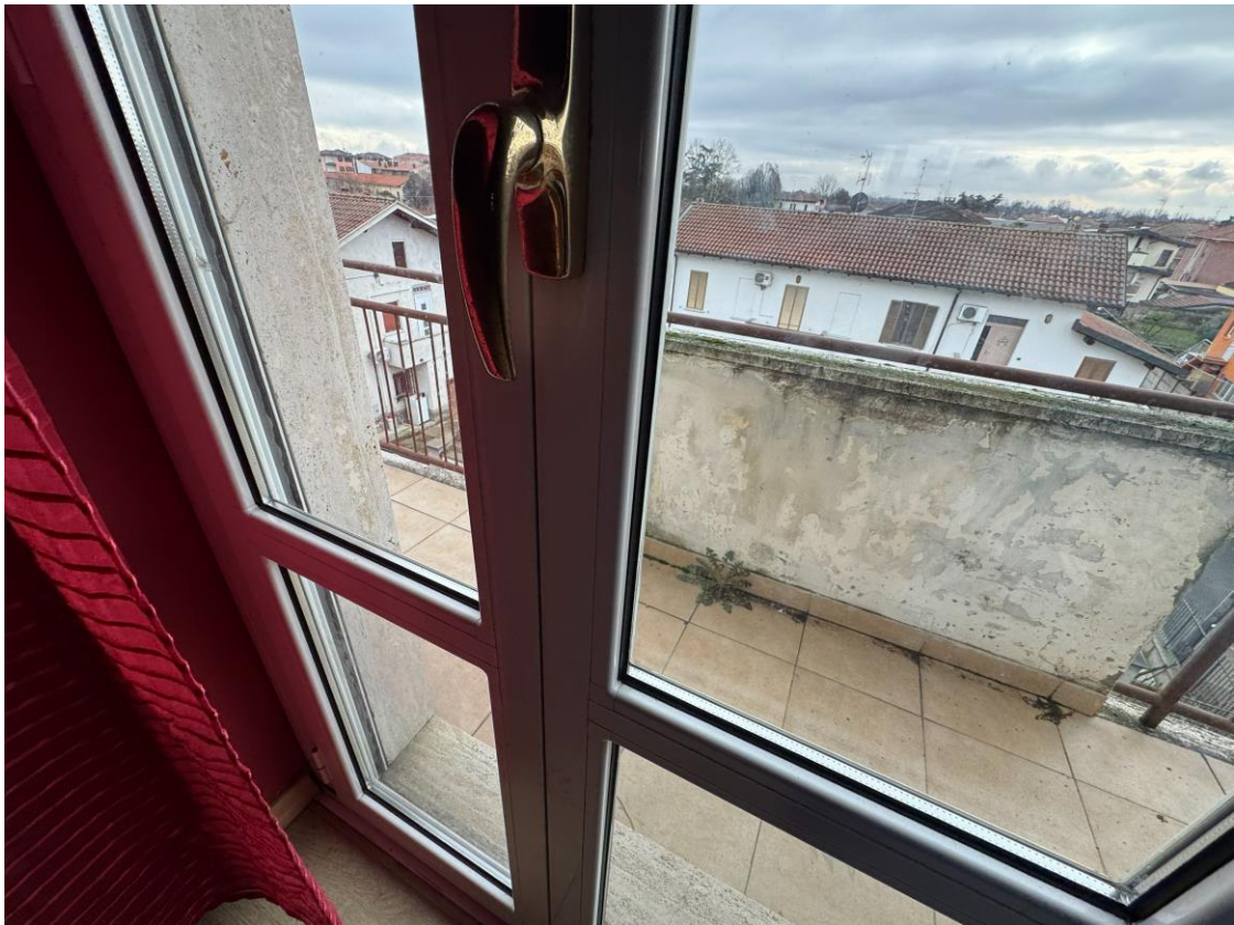
Foto 12. Terrazzo Camera 1