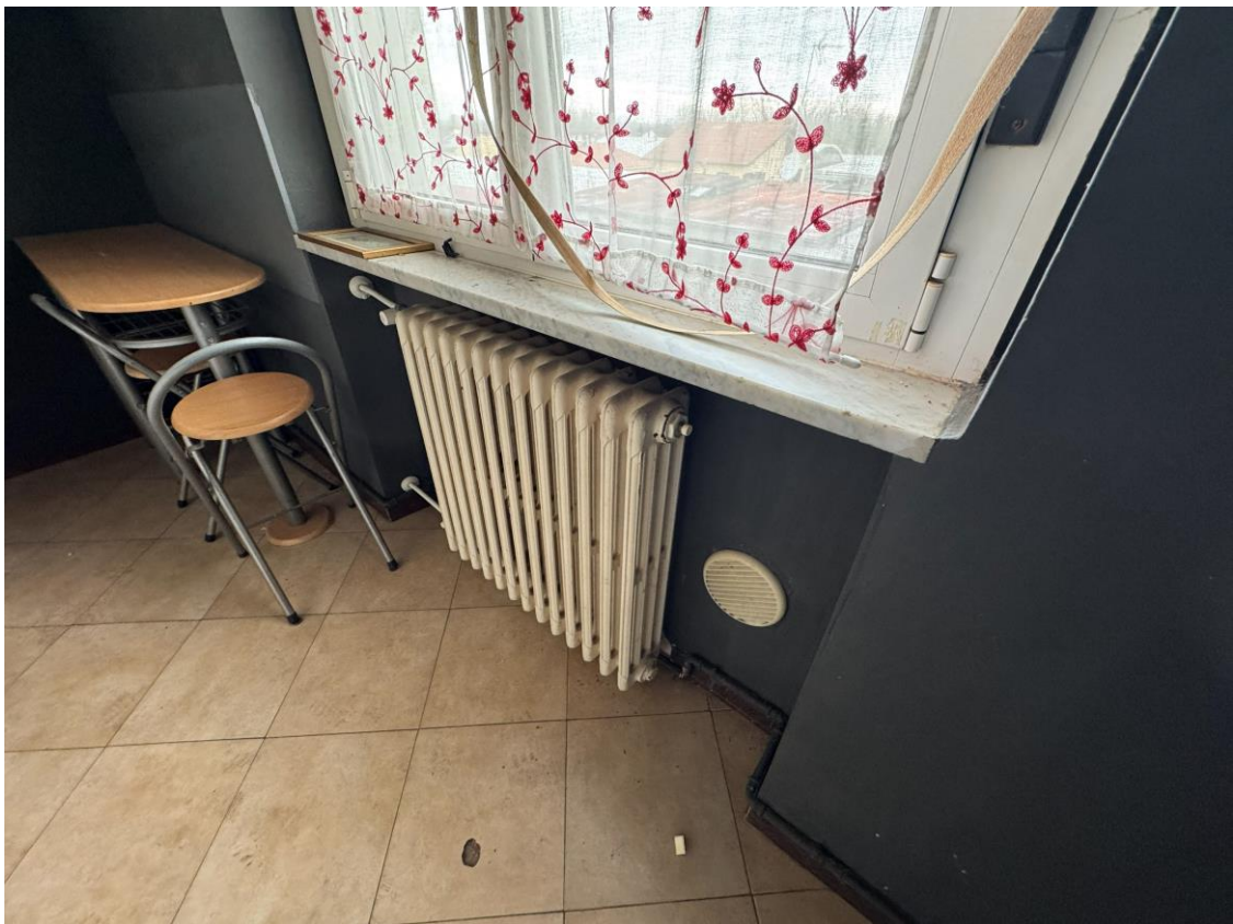
Foto 10. Particolare pavimenti in piastrelle