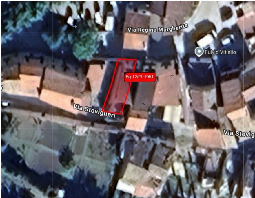
Mappa con evidenziazione degli immobili (satellite)

Il fabbricato si compone di tre porzioni tra loro aderenti: una centrale di maggiore altezza, composta di tre piani fuori terra con il tetto di copertura rispetto a Via Regina Margherita (contraddistinta con le particelle n. 778 su Via Regina Margherita e n. 779 su Via Stoviglieri) e due laterali: una sul lato est (contraddistinta con la particella n. 975 su Via Regina Margherita) ancora in due piani fuori terra su Via Regina Margherita e una sul lato ovest, che è quella oggetto della presente perizia (contraddistinta con le particelle n. 1951 su Via Regina Margherita e n. 777 su Via Stoviglieri) avente due piani fuori terra rispetto a Via Regina Margherita e due piani fuori terra anche rispetto a Via Stoviglieri.