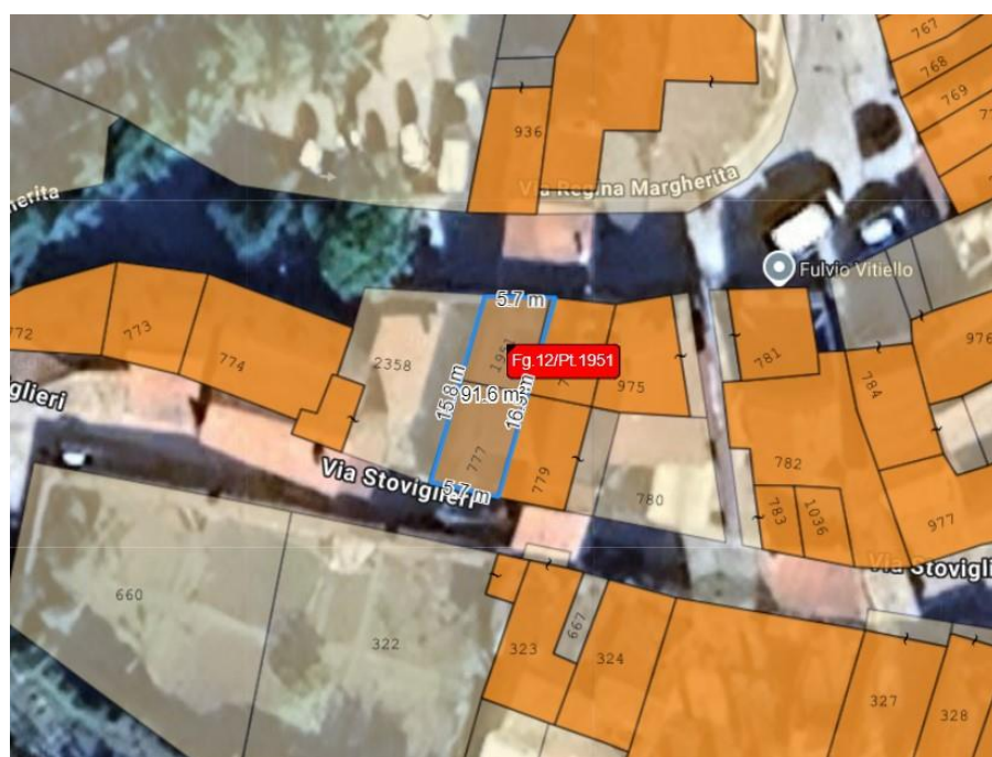
Mappa con evidenziazione degli immobili (sovrapposizione catastale e satellite)