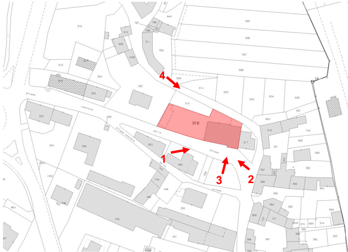
PLANIMETRIE CON POSIZIONE E NUMERAZIONE FOTO