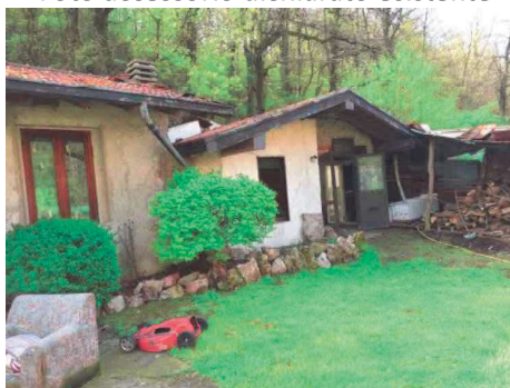
Foto accessorio adiacente