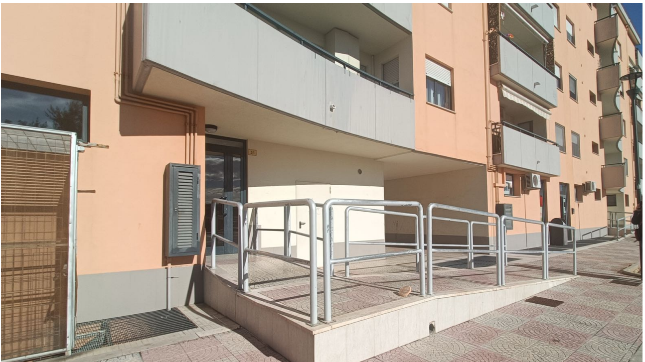
Immobile sito in Pescara alla Via di Sotto n.3/1, Piani quarto e quinto, Scala C, Palazzina B distinto al Foglio n.18 Particella n.2874 Sub. n.142