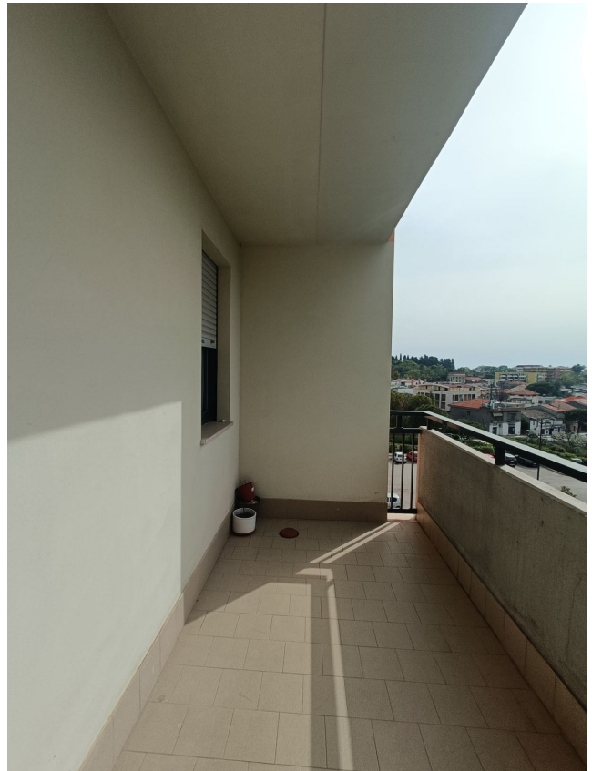
Immobile sito in Pescara alla Via di Sotto n.3/1, Piani quarto e quinto, Scala C, Palazzina B distinto al Foglio n.18 Particella n.2874 Sub. n.142