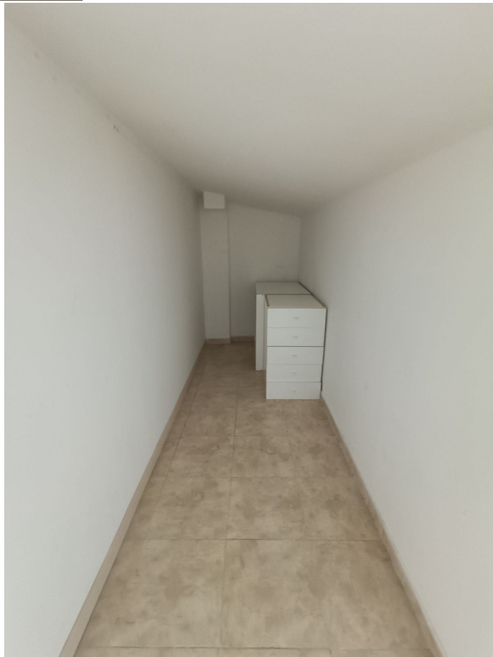
Immobile sito in Pescara alla Via di Sotto n.3/1, Piani quarto e quinto, Scala C, Palazzina B distinto al Foglio n.18 Particella n.2874 Sub. n.142