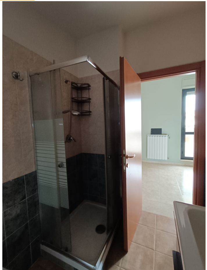
Immobile sito in Pescara alla Via di Sotto n.3/1, Piani quarto e quinto, Scala C, Palazzina B distinto al Foglio n.18 Particella n.2874 Sub. n.142