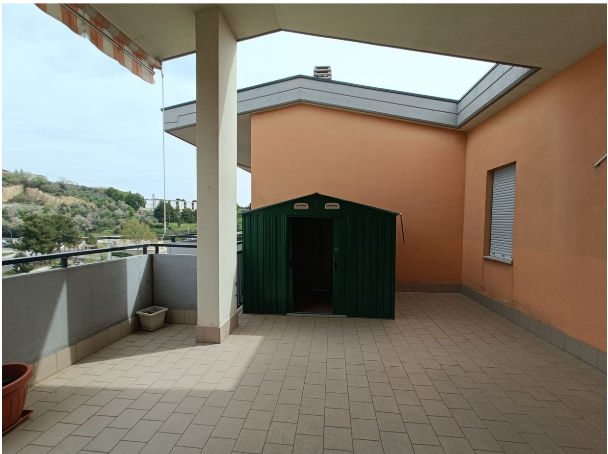
Immobile sito in Pescara alla Via di Sotto n.3/1, Piani quarto e quinto, Scala C, Palazzina B distinto al Foglio n.18 Particella n.2874 Sub. n.142