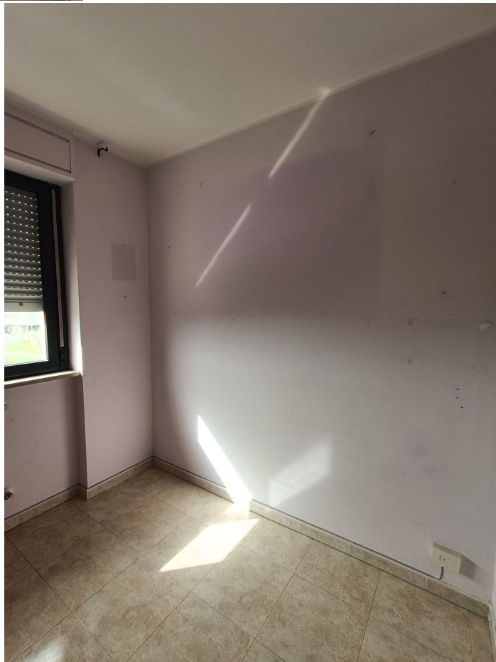
Immobile sito in Pescara alla Via di Sotto n.3/1, Piani quarto e quinto, Scala C, Palazzina B distinto al Foglio n.18 Particella n.2874 Sub. n.142