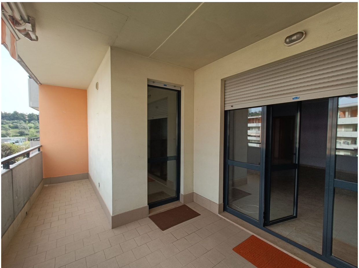
Immobile sito in Pescara alla Via di Sotto n.3/1, Piani quarto e quinto, Scala C, Palazzina B distinto al Foglio n.18 Particella n.2874 Sub. n.142