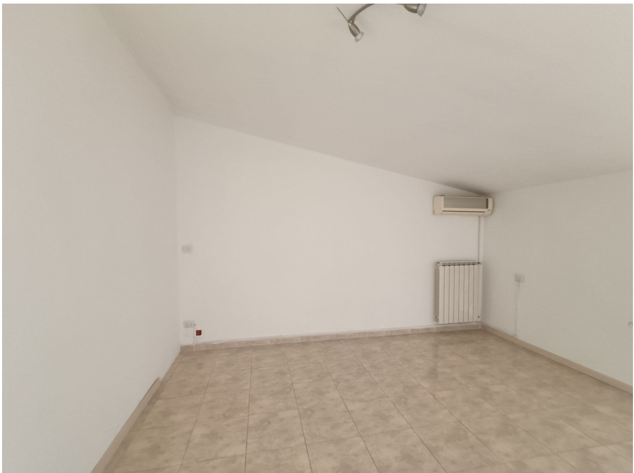
Immobile sito in Pescara alla Via di Sotto n.3/1, Piani quarto e quinto, Scala C, Palazzina B distinto al Foglio n.18 Particella n.2874 Sub. n.142