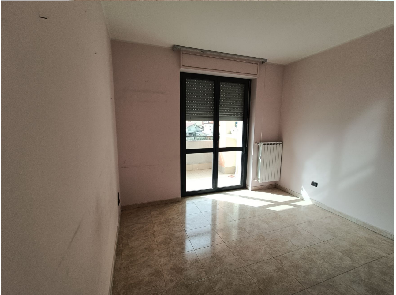
Immobile sito in Pescara alla Via di Sotto n.3/1, Piani quarto e quinto, Scala C, Palazzina B distinto al Foglio n.18 Particella n.2874 Sub. n.142