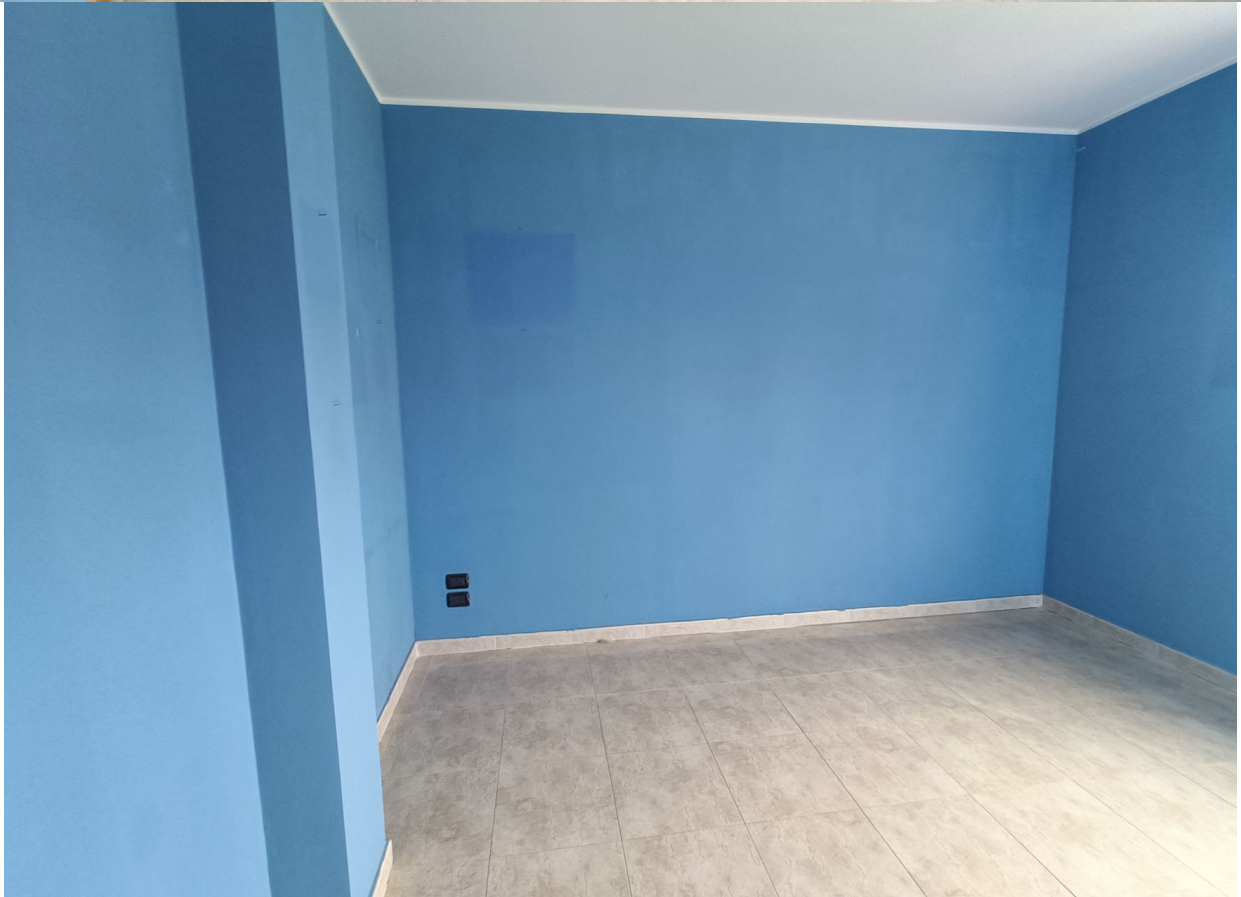
Immobile sito in Pescara alla Via di Sotto n.3/1, Piani quarto e quinto, Scala C, Palazzina B distinto al Foglio n.18 Particella n.2874 Sub. n.142