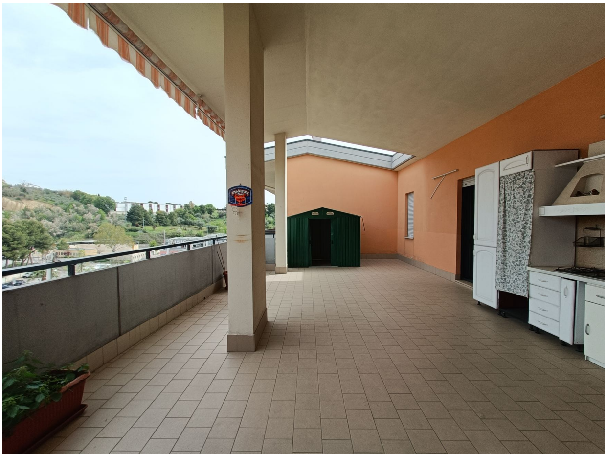
Immobile sito in Pescara alla Via di Sotto n.3/1, Piani quarto e quinto, Scala C, Palazzina B distinto al Foglio n.18 Particella n.2874 Sub. n.142