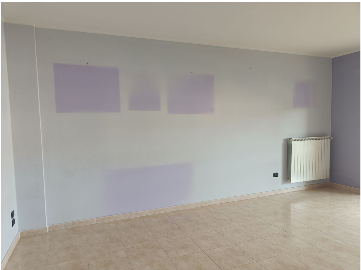
Immobile sito in Pescara alla Via di Sotto n.3/1, Piani quarto e quinto, Scala C, Palazzina B distinto al Foglio n.18 Particella n.2874 Sub. n.142