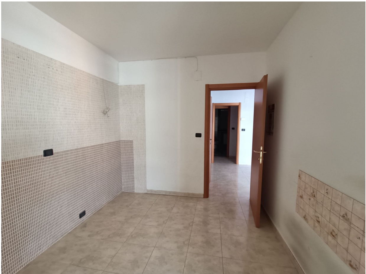
Immobile sito in Pescara alla Via di Sotto n.3/1, Piani quarto e quinto, Scala C, Palazzina B distinto al Foglio n.18 Particella n.2874 Sub. n.142