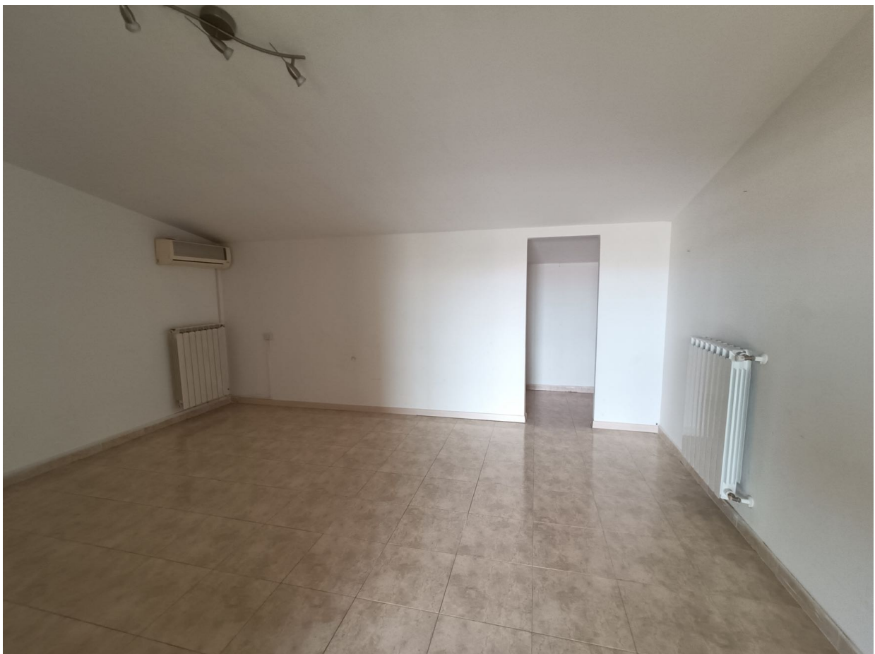
Immobile sito in Pescara alla Via di Sotto n.3/1, Piani quarto e quinto, Scala C, Palazzina B distinto al Foglio n.18 Particella n.2874 Sub. n.142