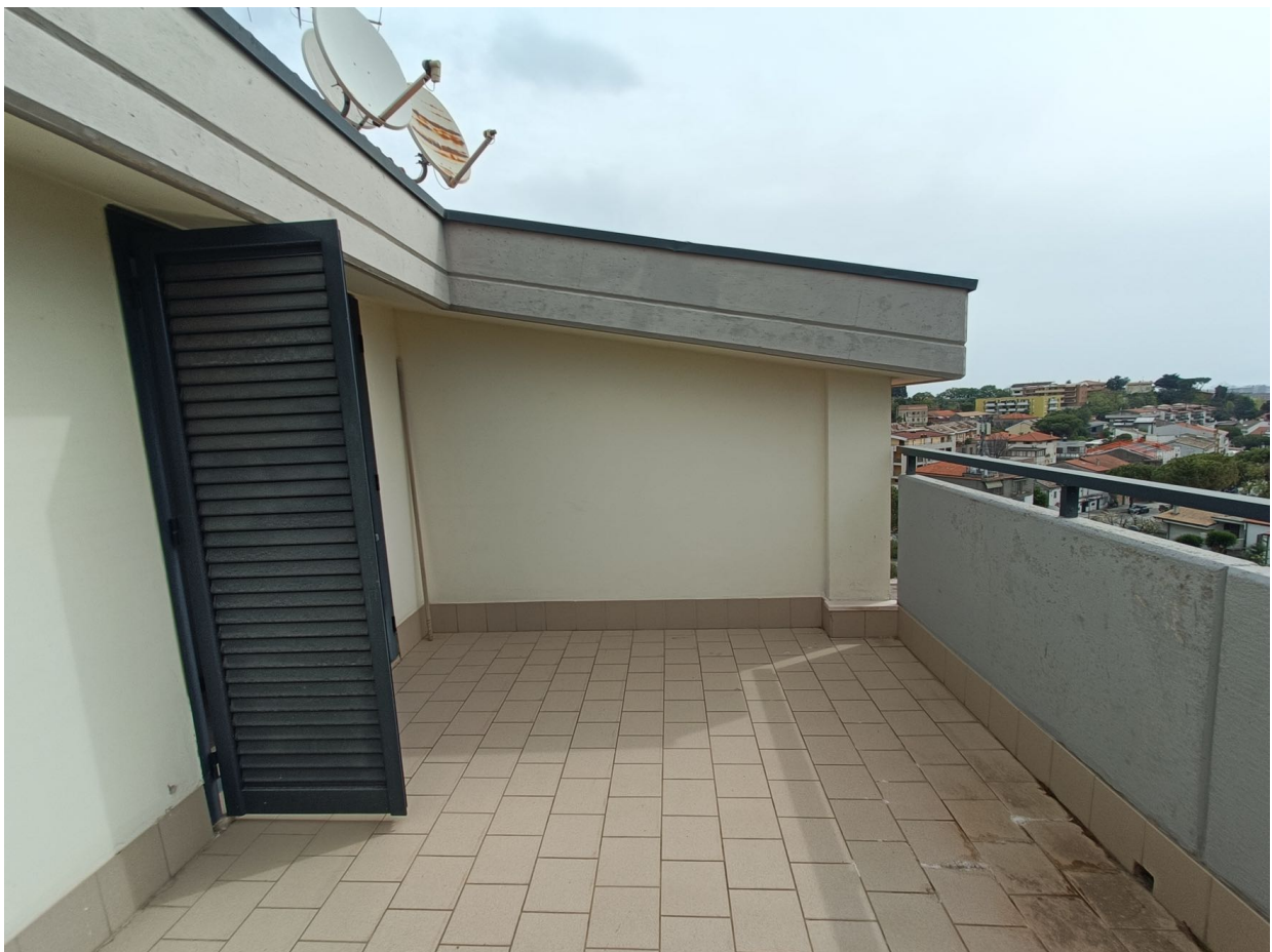
Immobile sito in Pescara alla Via di Sotto n.3/1, Piani quarto e quinto, Scala C, Palazzina B distinto al Foglio n.18 Particella n.2874 Sub. n.142