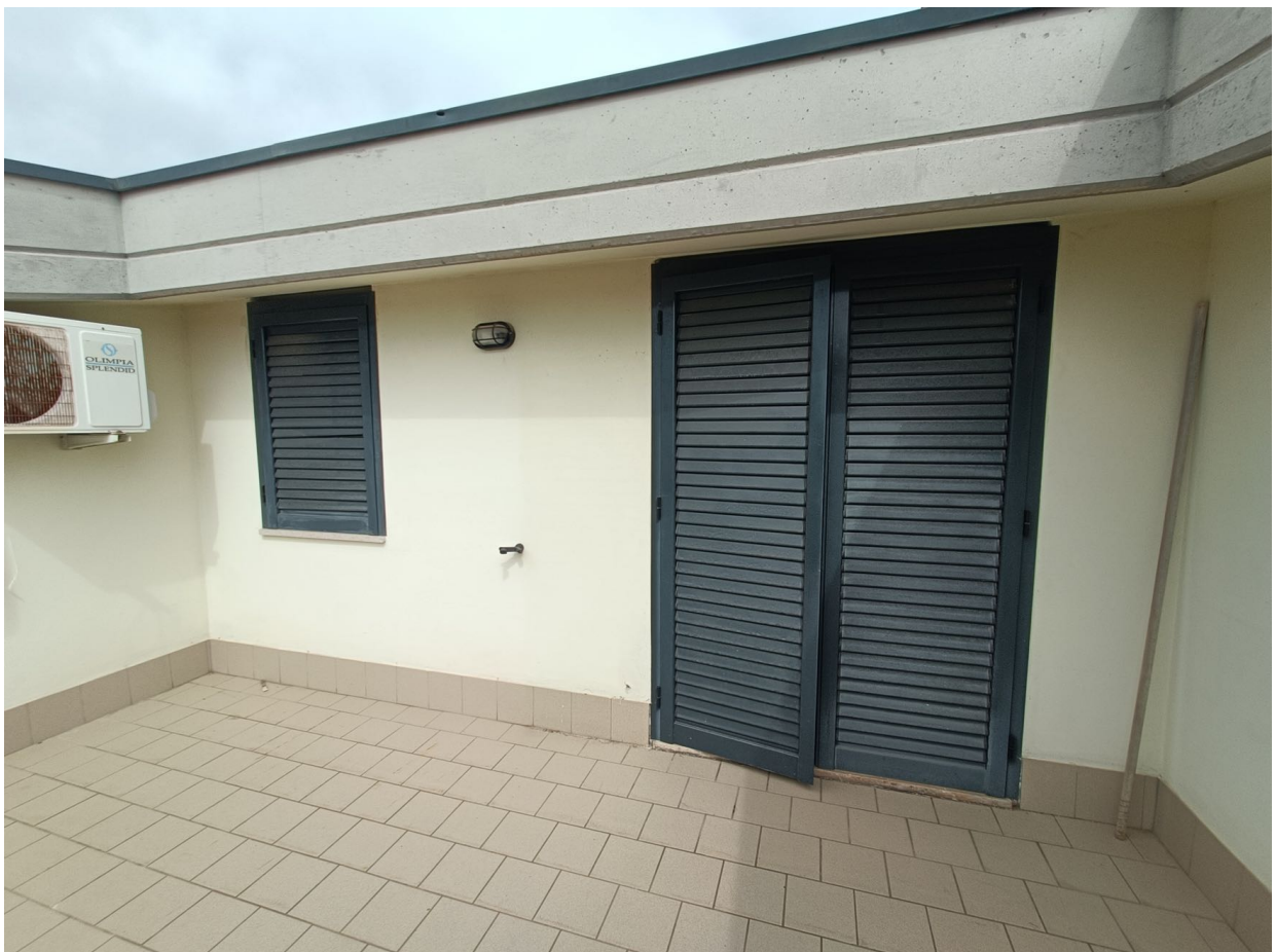
Immobile sito in Pescara alla Via di Sotto n.3/1, Piani quarto e quinto, Scala C, Palazzina B distinto al Foglio n.18 Particella n.2874 Sub. n.142