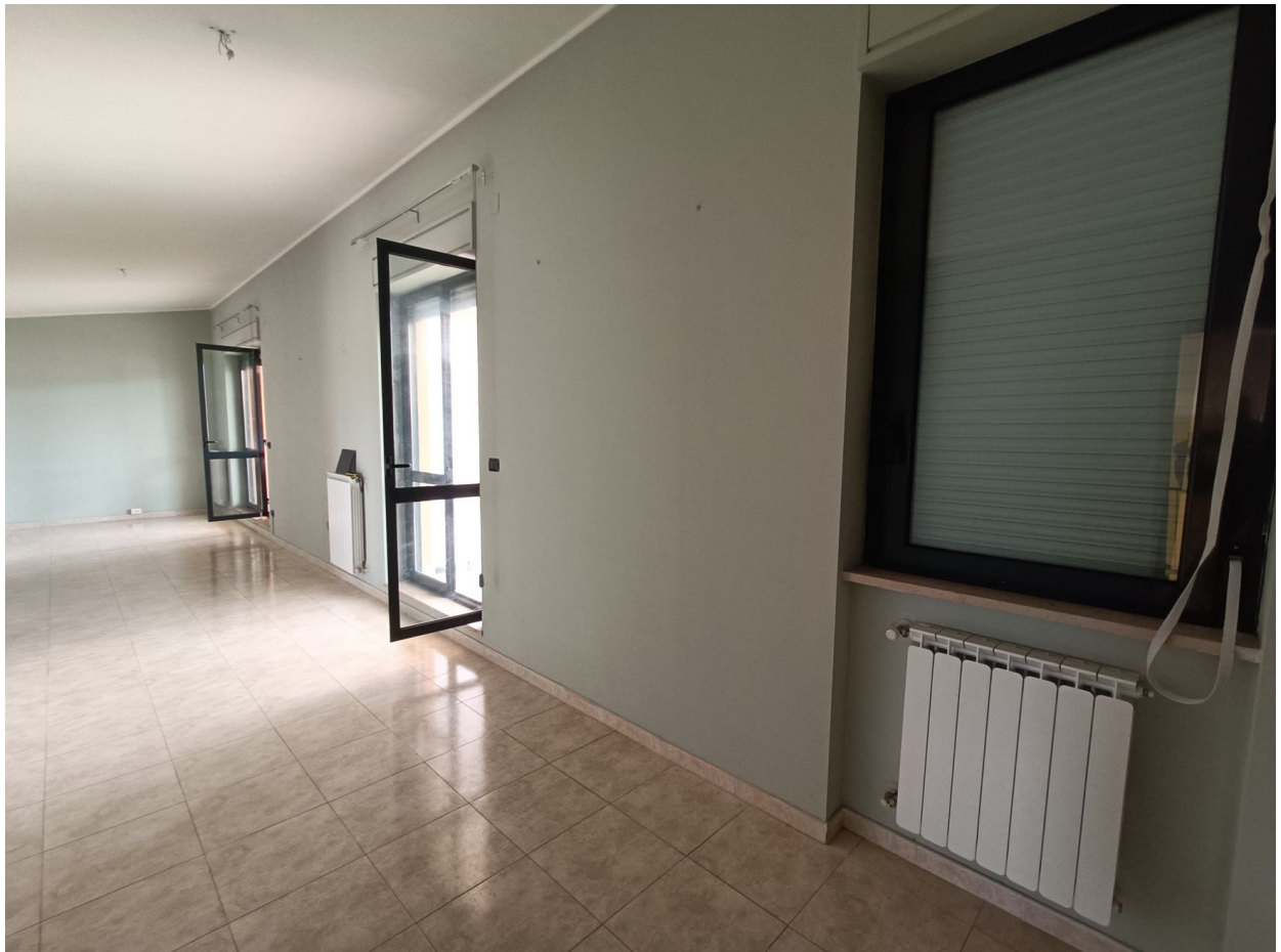
Immobile sito in Pescara alla Via di Sotto n.3/1, Piani quarto e quinto, Scala C, Palazzina B distinto al Foglio n.18 Particella n.2874 Sub. n.142