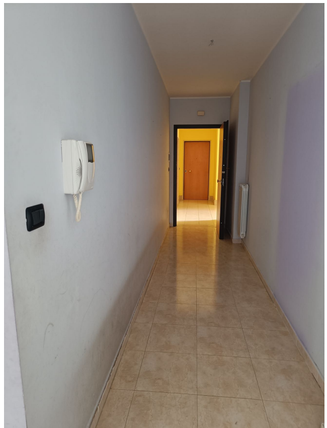
Immobile sito in Pescara alla Via di Sotto n.3/1, Piani quarto e quinto, Scala C, Palazzina B distinto al Foglio n.18 Particella n.2874 Sub. n.142