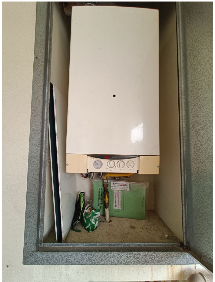
Immobile sito in Pescara alla Via di Sotto n.3/1, Piani quarto e quinto, Scala C, Palazzina B distinto al Foglio n.18 Particella n.2874 Sub. n.142