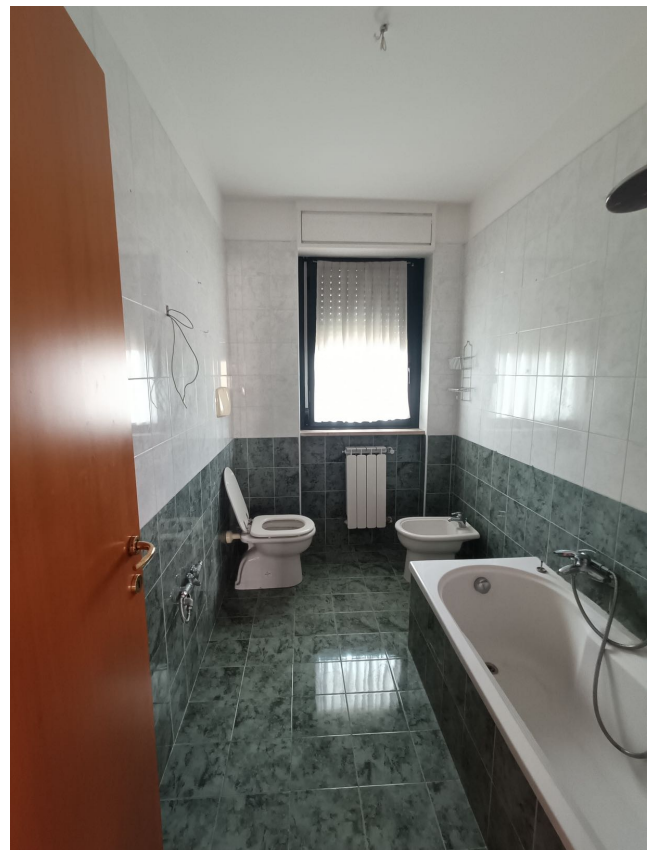
Immobile sito in Pescara alla Via di Sotto n.3/1, Piani quarto e quinto, Scala C, Palazzina B distinto al Foglio n.18 Particella n.2874 Sub. n.142