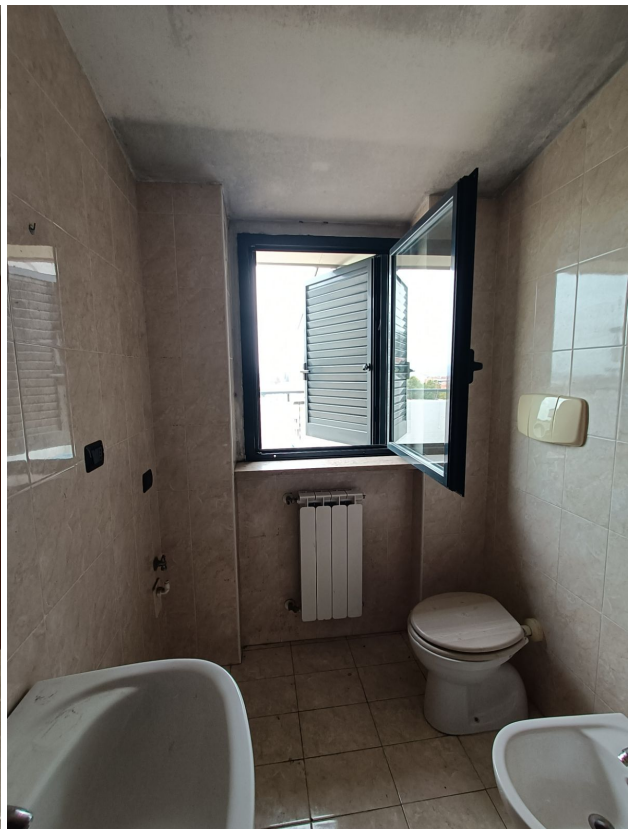
Immobile sito in Pescara alla Via di Sotto n.3/2, ai Piani quarto e quinto, Scala B, Palazzina B distinto al Foglio n.18 Particella n.2874 Sub. n.140. Piano quinto.