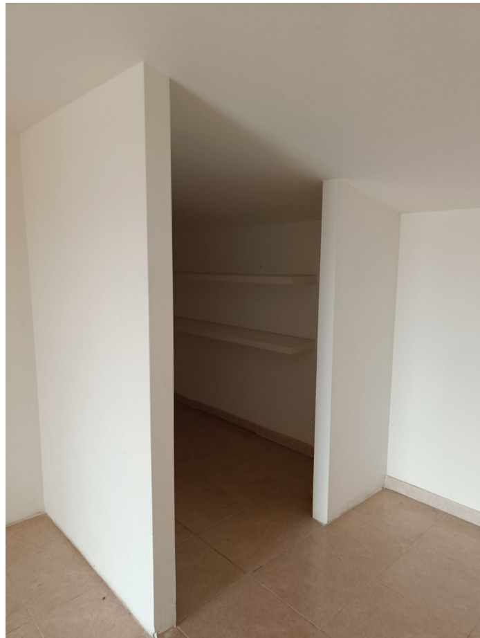
Immobile sito in Pescara alla Via di Sotto n.3/2, ai Piani quarto e quinto, Scala B, Palazzina B distinto al Foglio n.18 Particella n.2874 Sub. n.140. Piano quinto.