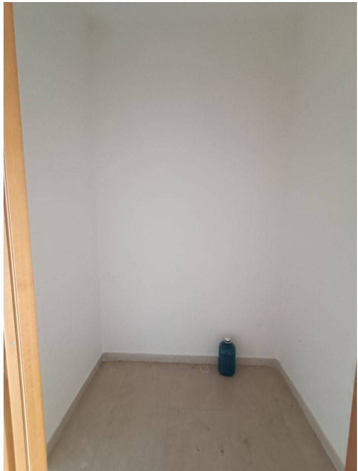
Immobile sito in Pescara alla Via di Sotto n.3/2, ai Piani quarto e quinto, Scala B, Palazzina B distinto al Foglio n.18 Particella n.2874 Sub. n.140. Piano quarto.