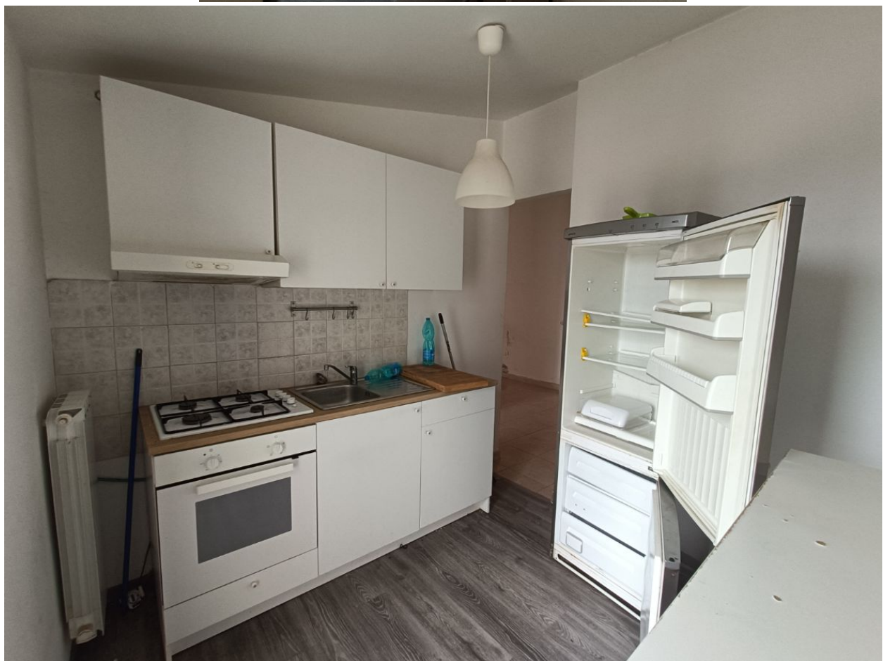
Immobile sito in Pescara alla Via di Sotto n.3/2, ai Piani quarto e quinto, Scala B, Palazzina B distinto al Foglio n.18 Particella n.2874 Sub. n.140. Piano quinto.