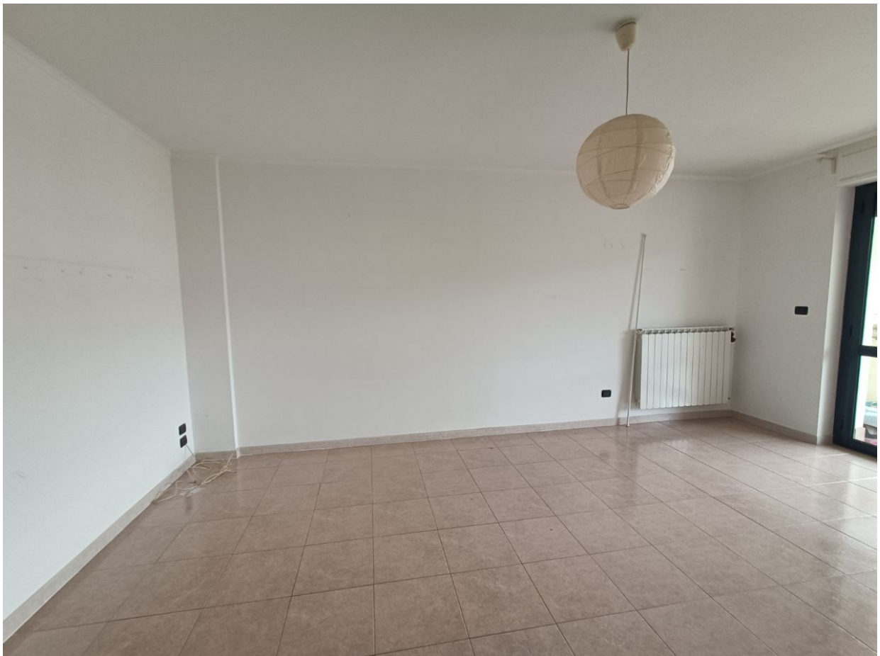
Immobile sito in Pescara alla Via di Sotto n.3/2, ai Piani quarto e quinto, Scala B, Palazzina B distinto al Foglio n.18 Particella n.2874 Sub. n.140. Piano quarto.