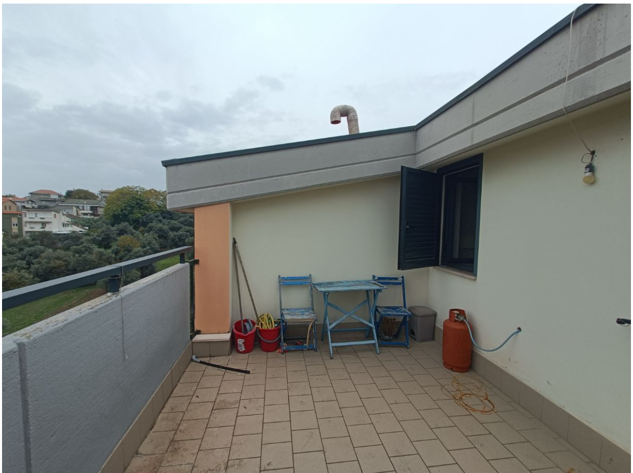
Immobile sito in Pescara alla Via di Sotto n.3/2, ai Piani quarto e quinto, Scala B, Palazzina B distinto al Foglio n.18 Particella n.2874 Sub. n.140. Piano quinto.