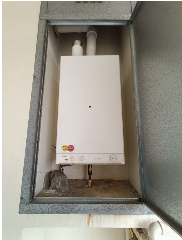
Immobile sito in Pescara alla Via di Sotto n.3/2, ai Piani quarto e quinto, Scala B, Palazzina B distinto al Foglio n.18 Particella n.2874 Sub. n.140. Piano quarto.