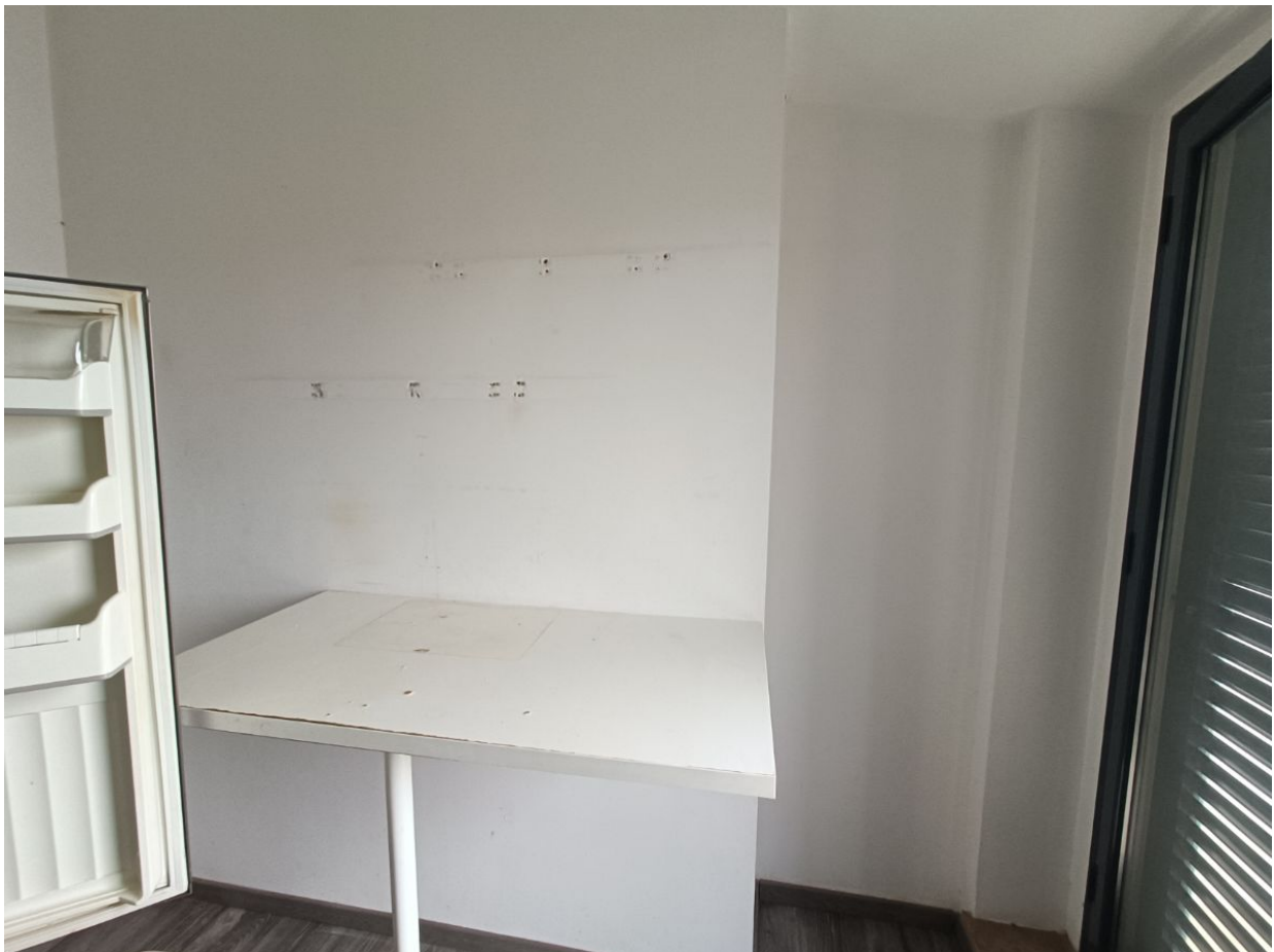
Immobile sito in Pescara alla Via di Sotto n.3/2, ai Piani quarto e quinto, Scala B, Palazzina B distinto al Foglio n.18 Particella n.2874 Sub. n.140. Piano quinto.