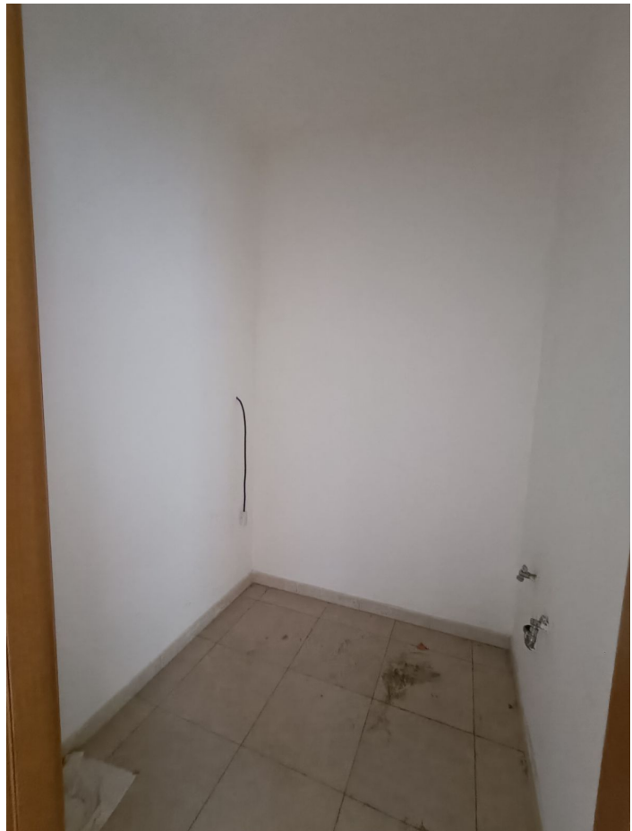
Immobile sito in Pescara alla Via di Sotto n.3/2, ai Piani quarto e quinto, Scala B, Palazzina B distinto al Foglio n.18 Particella n.2874 Sub. n.140. Piano quarto.