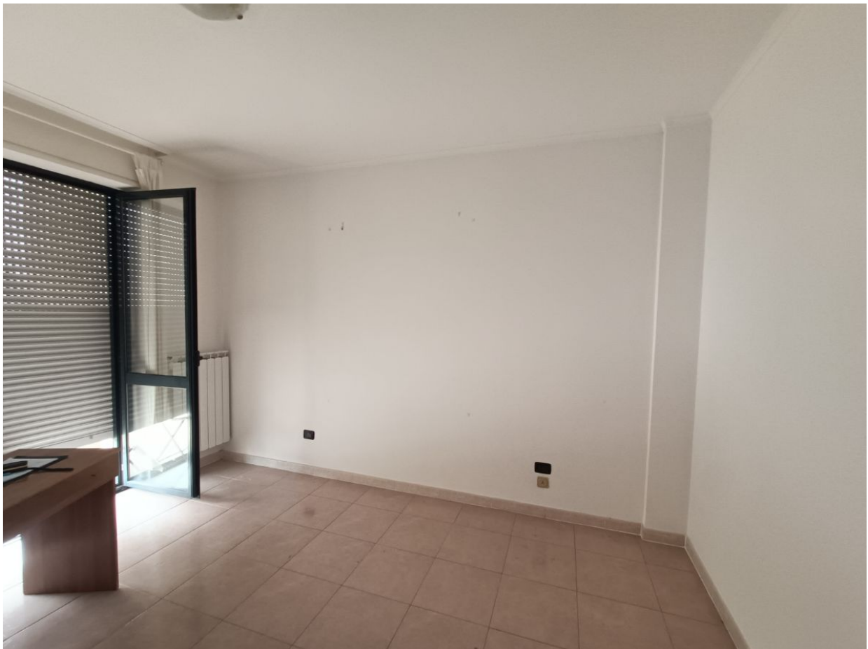
Immobile sito in Pescara alla Via di Sotto n.3/2, ai Piani quarto e quinto, Scala B, Palazzina B distinto al Foglio n.18 Particella n.2874 Sub. n.140. Piano quarto.