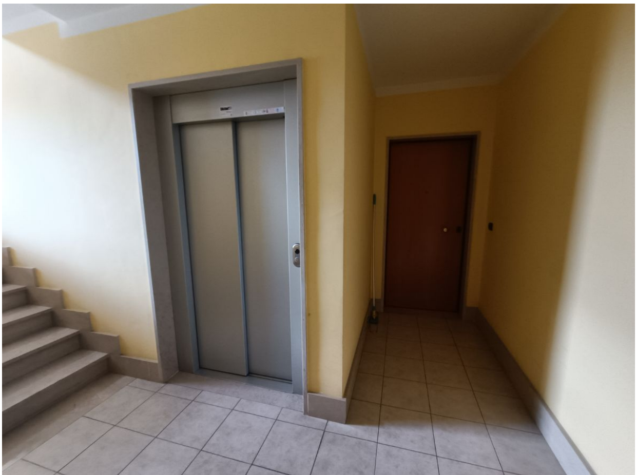
Immobile sito in Pescara alla Via di Sotto n.3/2, ai Piani quarto e quinto, Scala B, Palazzina B distinto al Foglio n.18 Particella n.2874 Sub. n.140. Piano quarto.