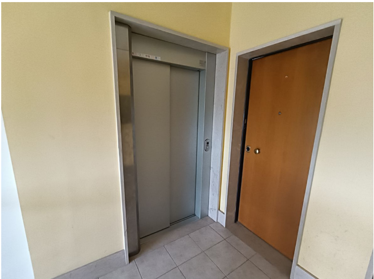
Immobile sito in Pescara alla Via di Sotto n.3/2, ai Piani quarto e quinto, Scala B, Palazzina B distinto al Foglio n.18 Particella n.2874 Sub. n.140. Piano quinto.