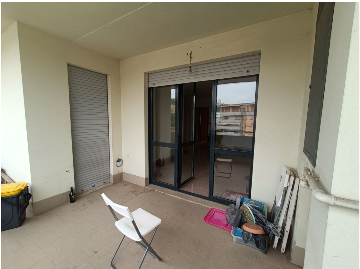
Immobile sito in Pescara alla Via di Sotto n.3/2, ai Piani quarto e quinto, Scala B, Palazzina B distinto al Foglio n.18 Particella n.2874 Sub. n.140. Piano quarto.