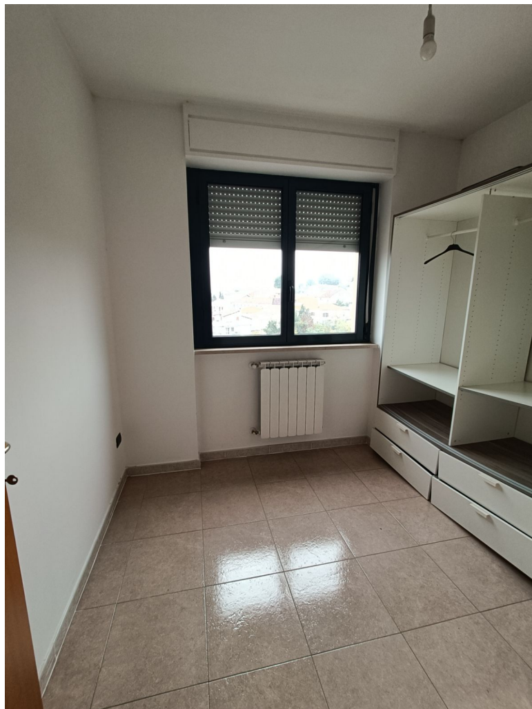
Immobile sito in Pescara alla Via di Sotto n.3/2, ai Piani quarto e quinto, Scala B, Palazzina B distinto al Foglio n.18 Particella n.2874 Sub. n.140. Piano quarto.