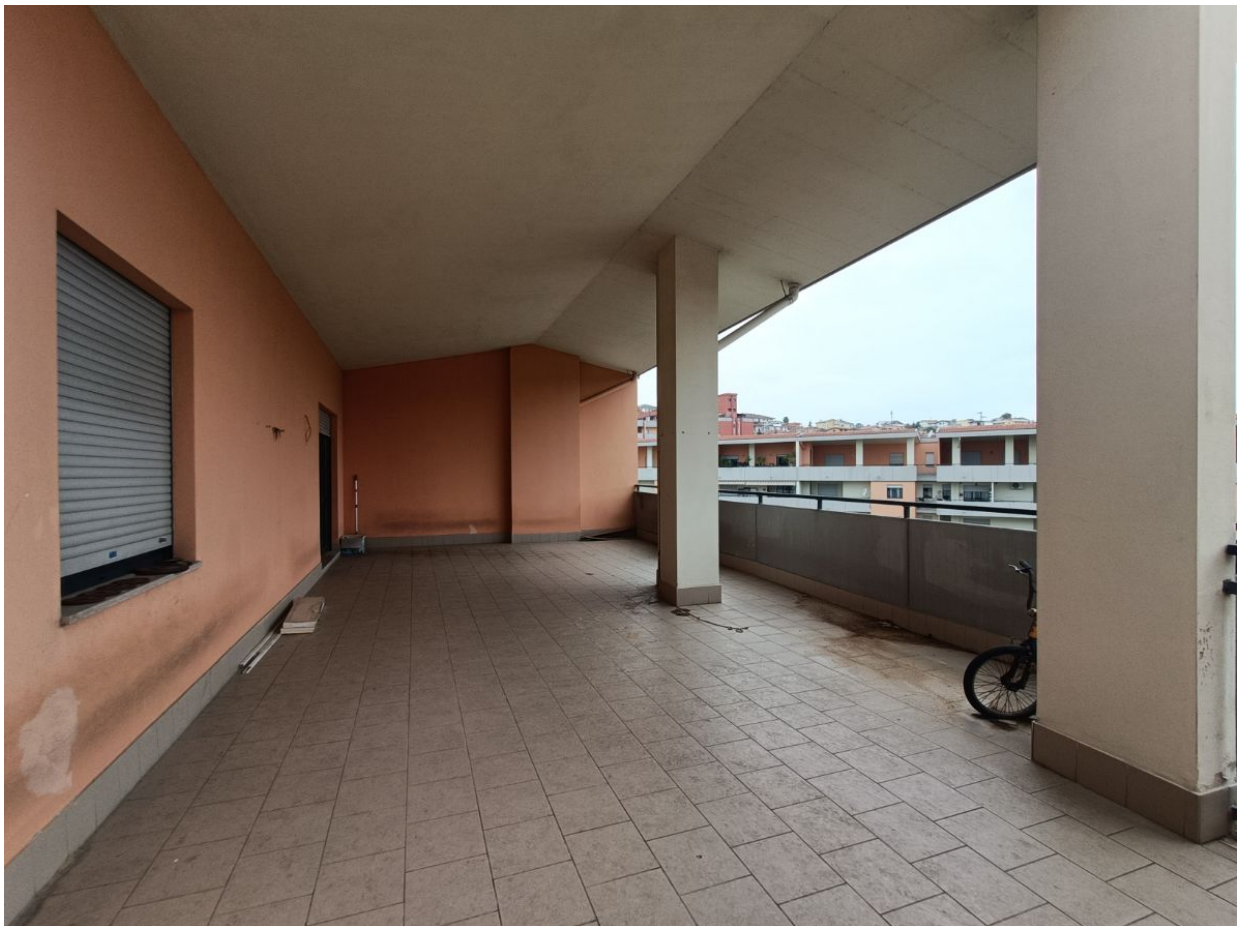
Immobile sito in Pescara alla Via di Sotto n.3/2, ai Piani quarto e quinto, Scala B, Palazzina B distinto al Foglio n.18 Particella n.2874 Sub. n.140. Piano quinto.