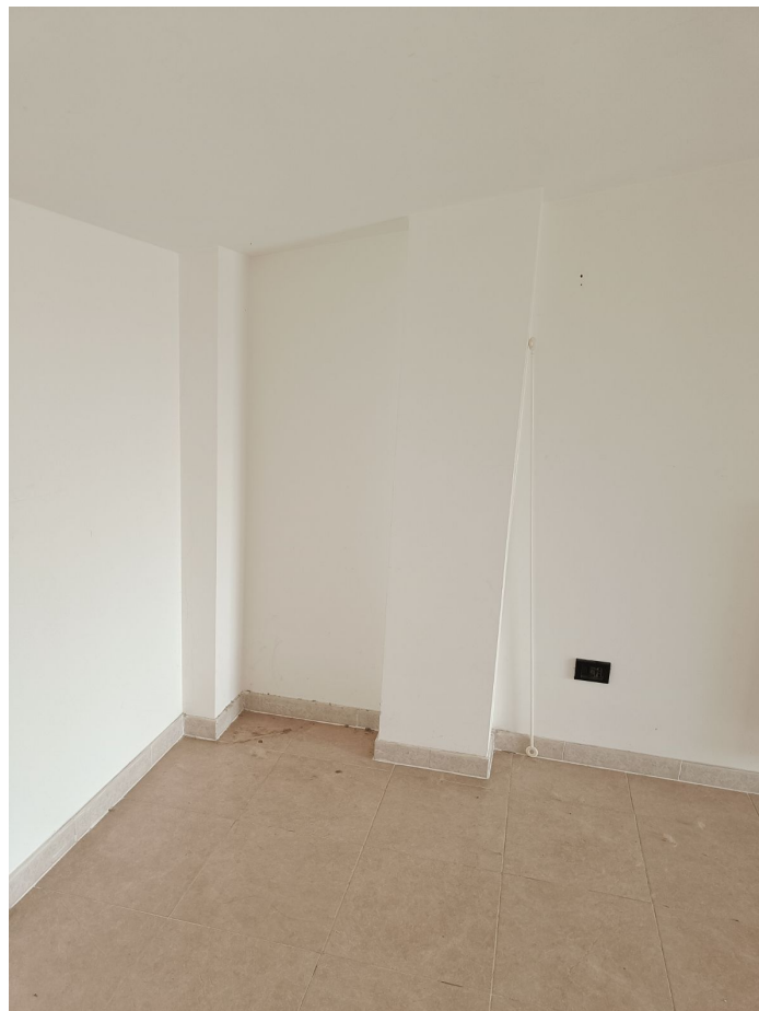
Immobile sito in Pescara alla Via di Sotto n.3/2, ai Piani quarto e quinto, Scala B, Palazzina B distinto al Foglio n.18 Particella n.2874 Sub. n.140. Piano quinto.