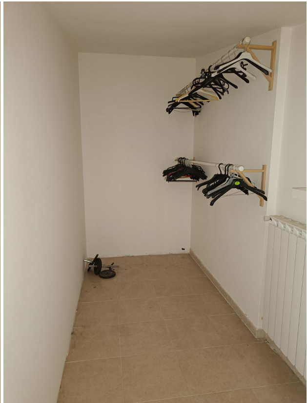
Immobile sito in Pescara alla Via di Sotto n.3/2, ai Piani quarto e quinto, Scala B, Palazzina B distinto al Foglio n.18 Particella n.2874 Sub. n.140. Piano quinto.