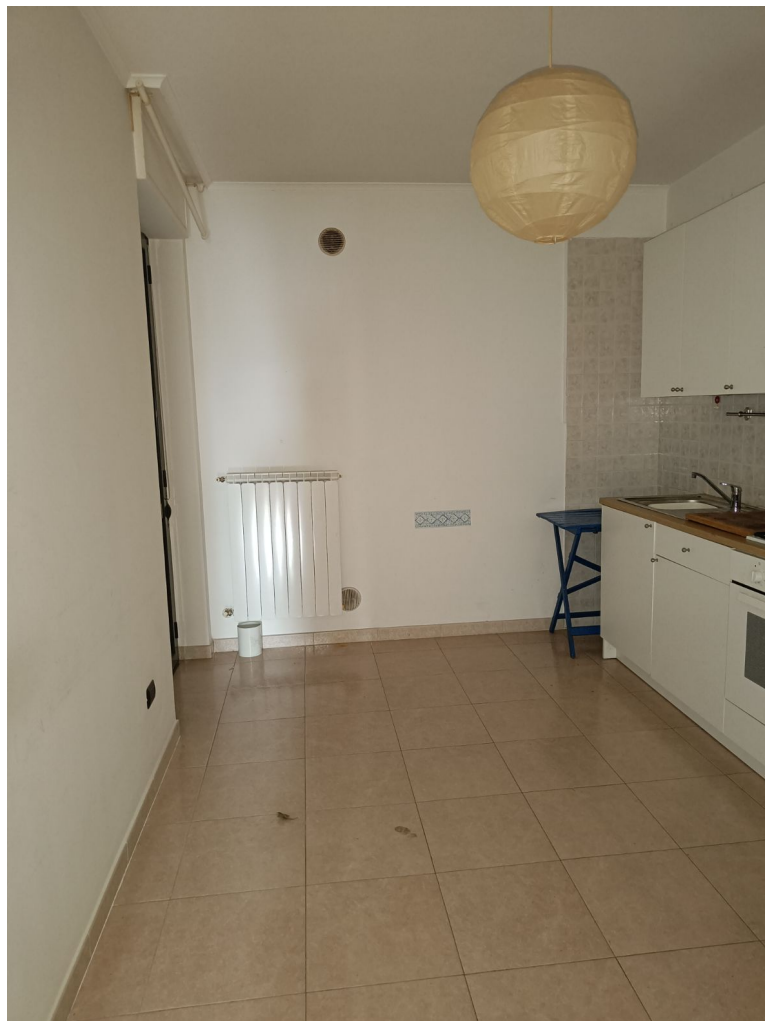
Immobile sito in Pescara alla Via di Sotto n.3/2, ai Piani quarto e quinto, Scala B, Palazzina B distinto al Foglio n.18 Particella n.2874 Sub. n.140. Piano quarto.