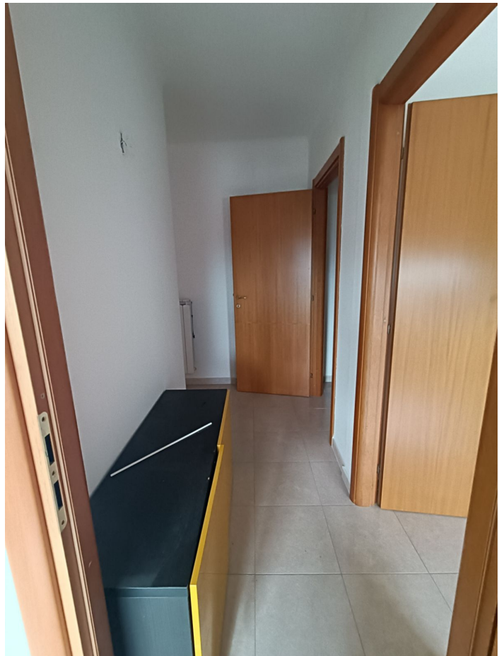
Immobile sito in Pescara alla Via di Sotto n.3/2, ai Piani quarto e quinto, Scala B, Palazzina B distinto al Foglio n.18 Particella n.2874 Sub. n.140. Piano quarto.