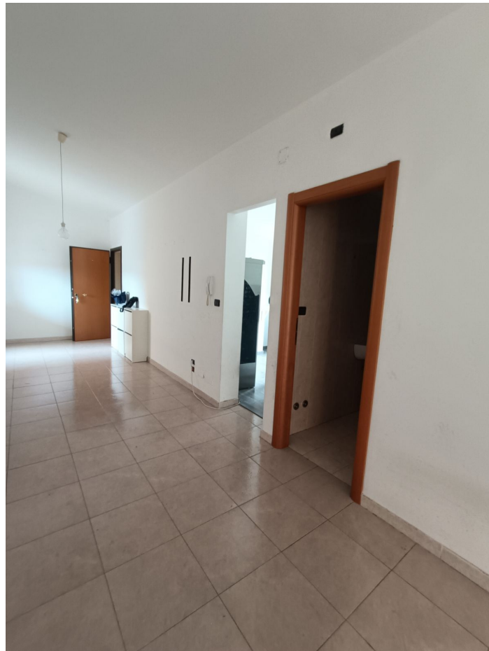
Immobile sito in Pescara alla Via di Sotto n.3/2, ai Piani quarto e quinto, Scala B, Palazzina B distinto al Foglio n.18 Particella n.2874 Sub. n.140. Piano quinto.