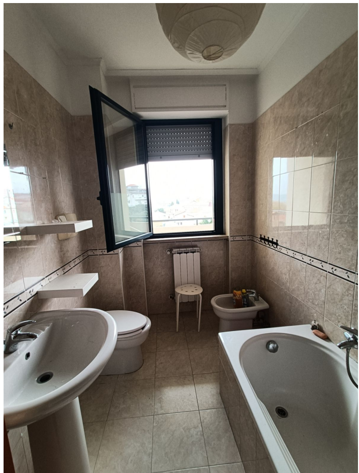
Immobile sito in Pescara alla Via di Sotto n.3/2, ai Piani quarto e quinto, Scala B, Palazzina B distinto al Foglio n.18 Particella n.2874 Sub. n.140. Piano quarto.