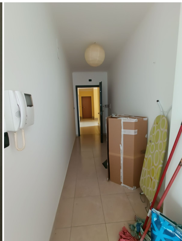
Immobile sito in Pescara alla Via di Sotto n.3/2, ai Piani quarto e quinto, Scala B, Palazzina B distinto al Foglio n.18 Particella n.2874 Sub. n.140. Piano quarto.