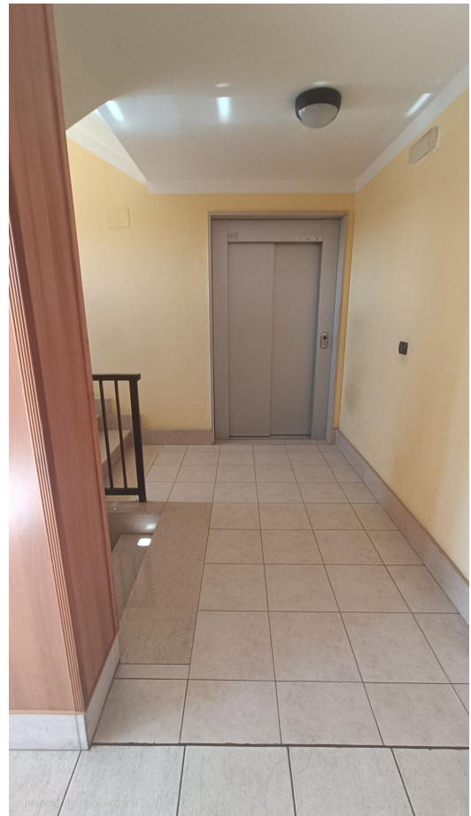
Immobile sito in Pescara alla Via di Sotto n.3/2, ai Piani quarto e quinto, Scala B, Palazzina B, distinto al Foglio n.18 Particella n.2874 Sub. n.140