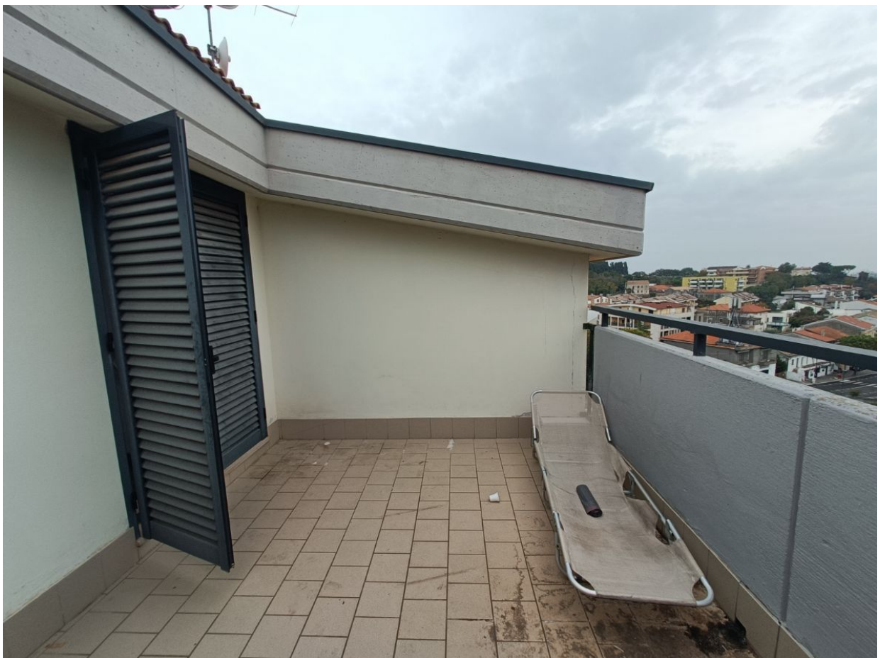
Immobile sito in Pescara alla Via di Sotto n.3/2, ai Piani quarto e quinto, Scala B, Palazzina B distinto al Foglio n.18 Particella n.2874 Sub. n.140. Piano quinto.