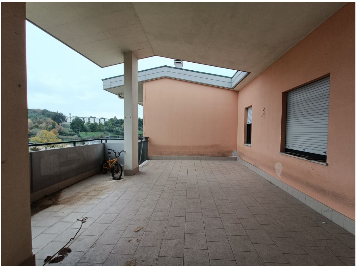
Immobile sito in Pescara alla Via di Sotto n.3/2, ai Piani quarto e quinto, Scala B, Palazzina B distinto al Foglio n.18 Particella n.2874 Sub. n.140. Piano quinto.