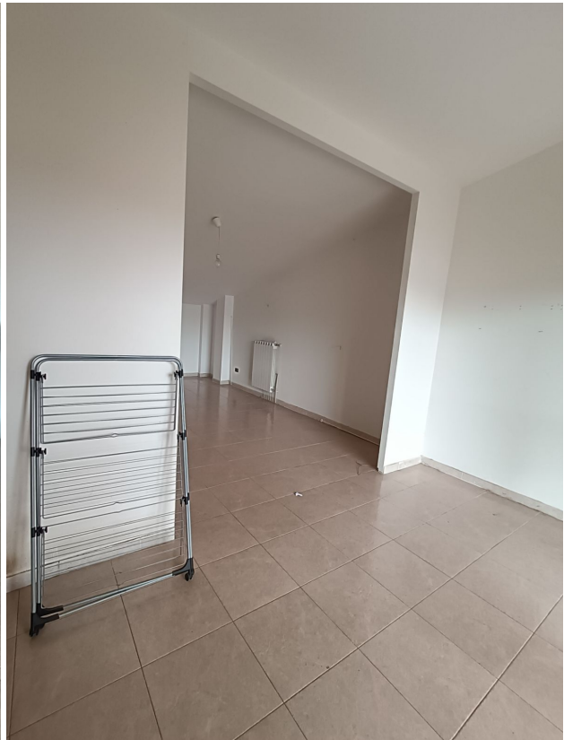
Immobile sito in Pescara alla Via di Sotto n.3/2, ai Piani quarto e quinto, Scala B, Palazzina B distinto al Foglio n.18 Particella n.2874 Sub. n.140. Piano quinto.