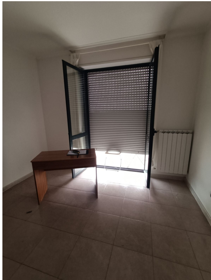
Immobile sito in Pescara alla Via di Sotto n.3/2, ai Piani quarto e quinto, Scala B, Palazzina B distinto al Foglio n.18 Particella n.2874 Sub. n.140. Piano quarto.