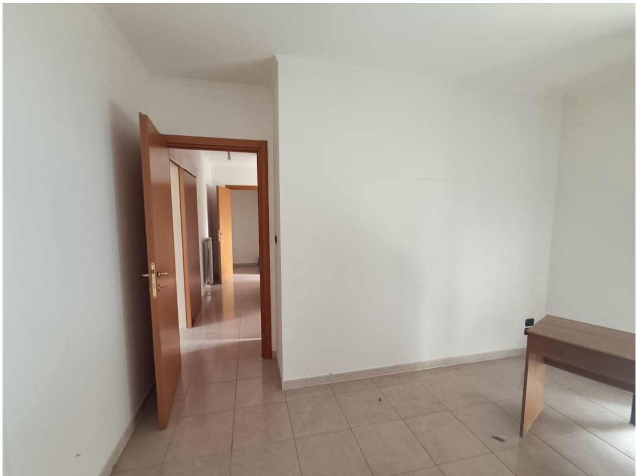
Immobile sito in Pescara alla Via di Sotto n.3/2, ai Piani quarto e quinto, Scala B, Palazzina B distinto al Foglio n.18 Particella n.2874 Sub. n.140. Piano quarto.