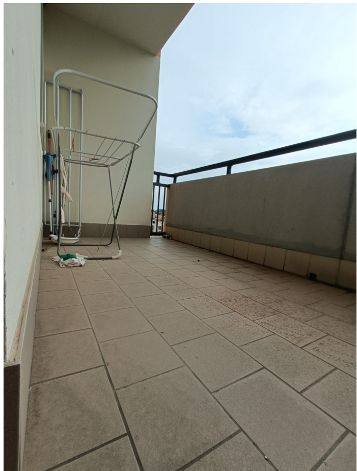
Immobile sito in Pescara alla Via di Sotto n.3/2, ai Piani quarto e quinto, Scala B, Palazzina B distinto al Foglio n.18 Particella n.2874 Sub. n.140. Piano quarto.