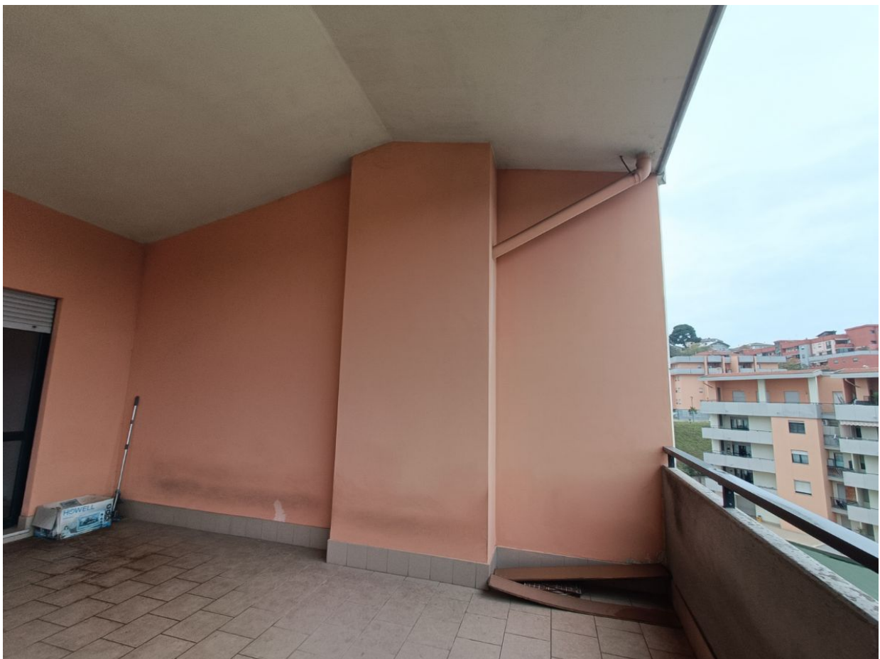
Immobile sito in Pescara alla Via di Sotto n.3/2, ai Piani quarto e quinto, Scala B, Palazzina B distinto al Foglio n.18 Particella n.2874 Sub. n.140. Piano quinto.