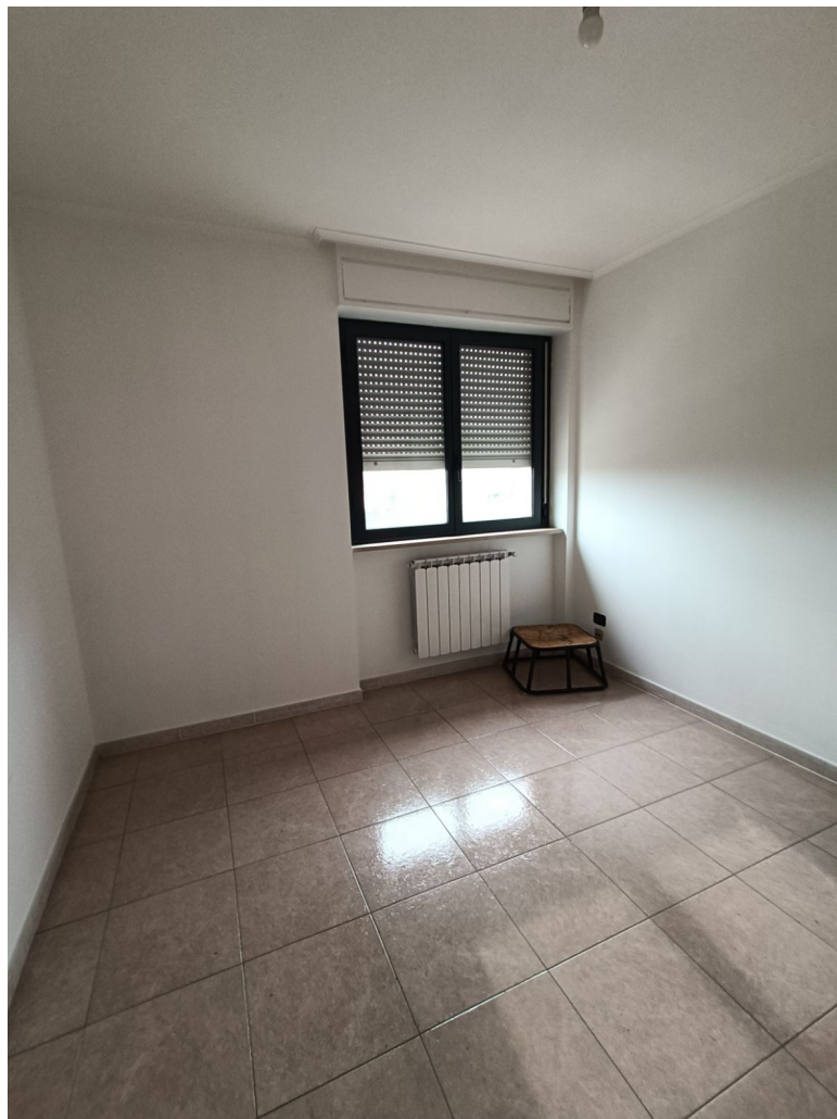
Immobile sito in Pescara alla Via di Sotto n.3/2, ai Piani quarto e quinto, Scala B, Palazzina B distinto al Foglio n.18 Particella n.2874 Sub. n.140. Piano quarto.