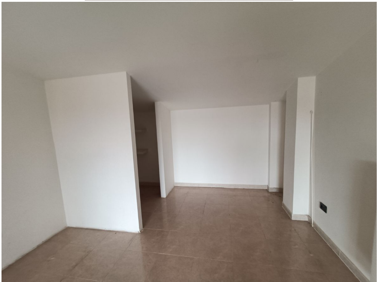
Immobile sito in Pescara alla Via di Sotto n.3/2, ai Piani quarto e quinto, Scala B, Palazzina B distinto al Foglio n.18 Particella n.2874 Sub. n.140. Piano quinto.