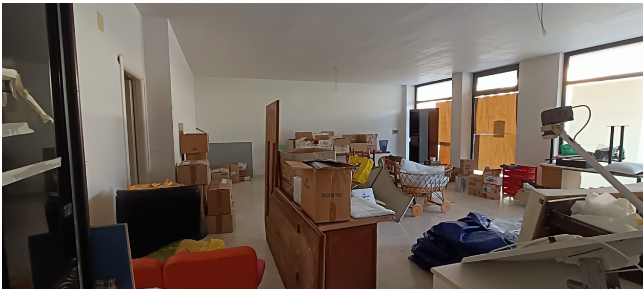
Immobile sito in Pescara alla Via di Sotto n.3/2, Piano terra, Scala B, Palazzina B distinto al Foglio n.18 Particella n.2874 Sub. n.132