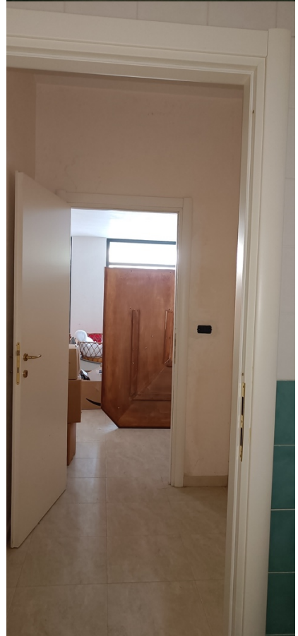
Immobile sito in Pescara alla Via di Sotto n.3/2, Piano terra, Scala B, Palazzina B distinto al Foglio n.18 Particella n.2874 Sub. n.132