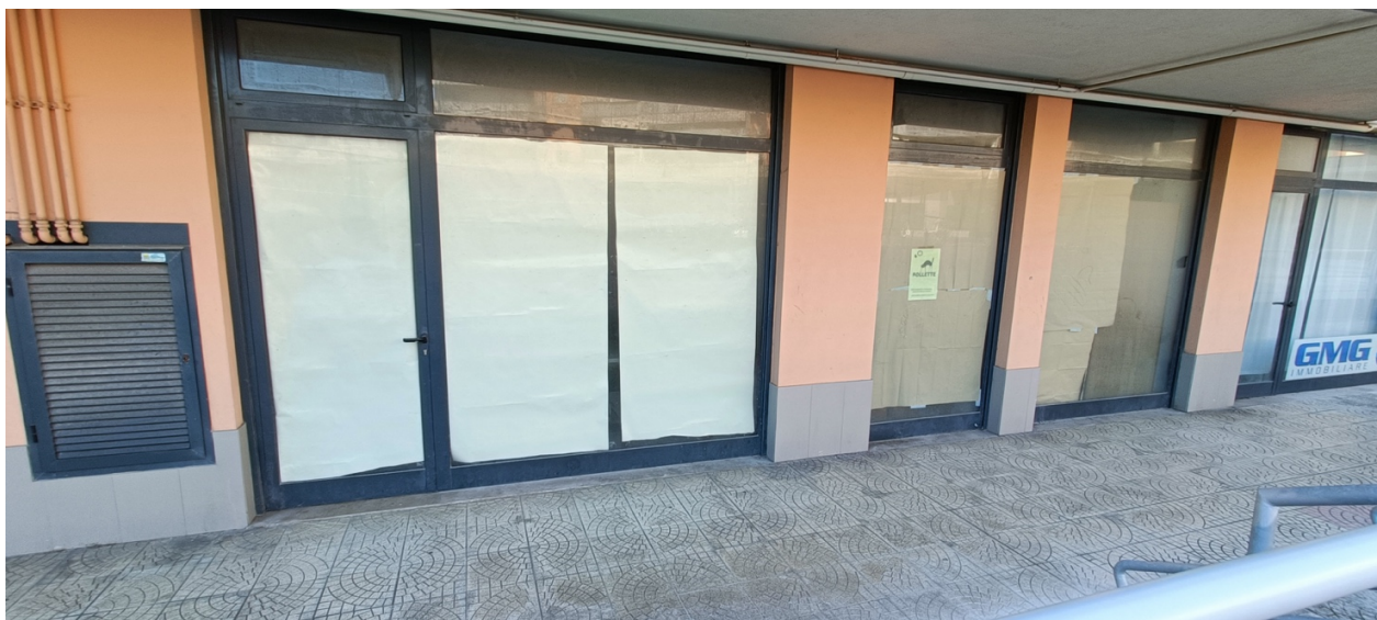
Immobile sito in Pescara alla Via di Sotto n.3/2, Piano terra, Scala B, Palazzina B distinto al Foglio n.18 Particella n.2874 Sub. n.132