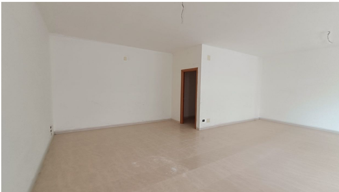
Immobile sito in Pescara alla Via di Sotto n.3, Piano terra, Scala D, Palazzina B distinto al Foglio n.18 Particella n.2874 Sub. n.125