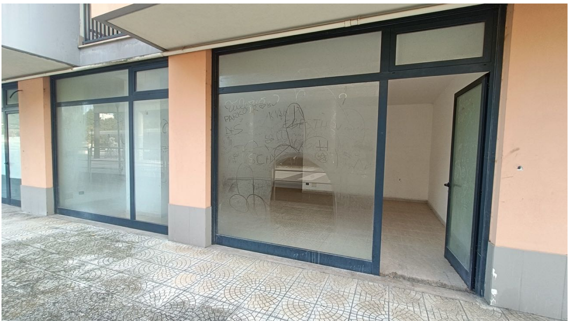
Immobile sito in Pescara alla Via di Sotto n.3, Piano terra, Scala D, Palazzina B distinto al Foglio n.18 Particella n.2874 Sub. n.125