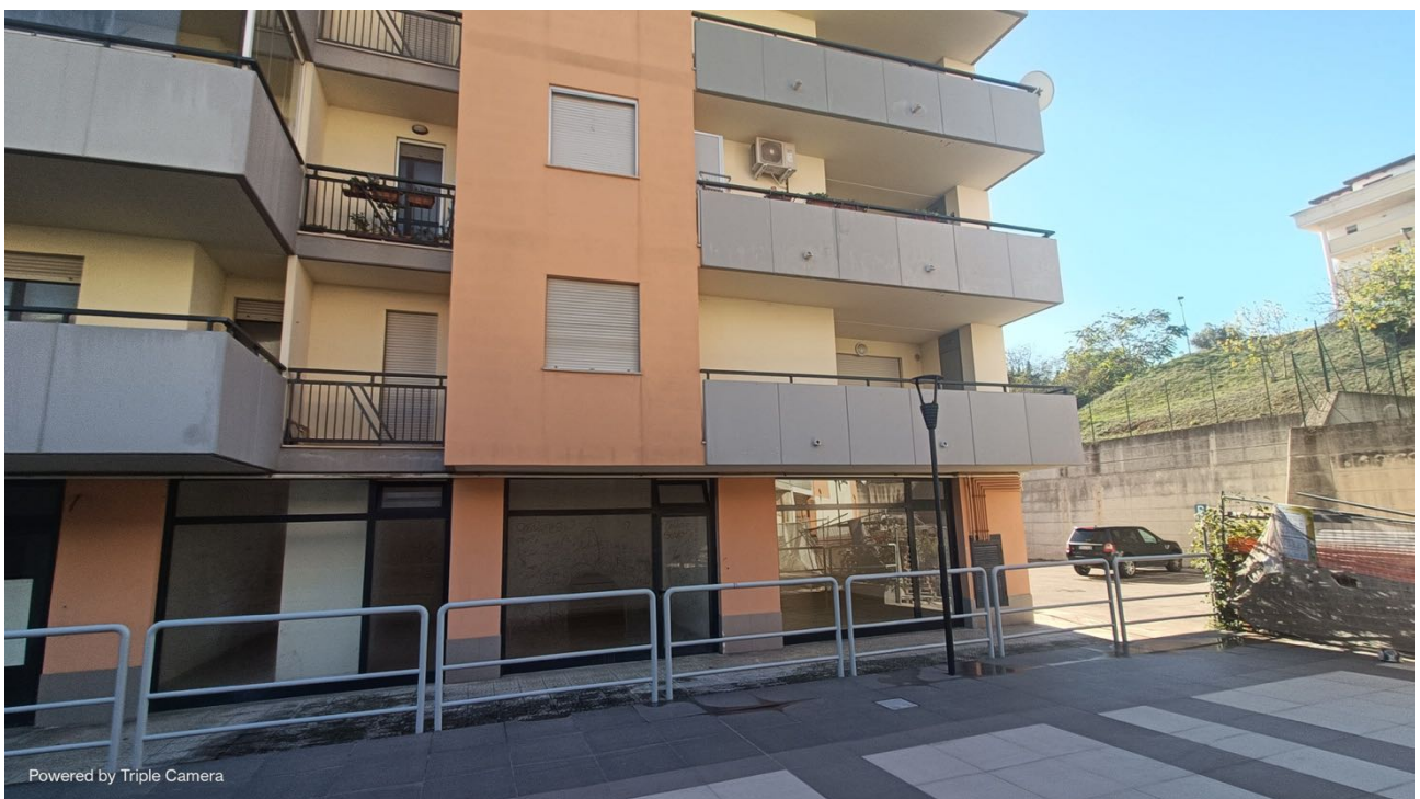
Immobile sito in Pescara alla Via di Sotto n.3, Piano terra, Scala D, Palazzina B distinto al Foglio n.18 Particella n.2874 Sub. n.125