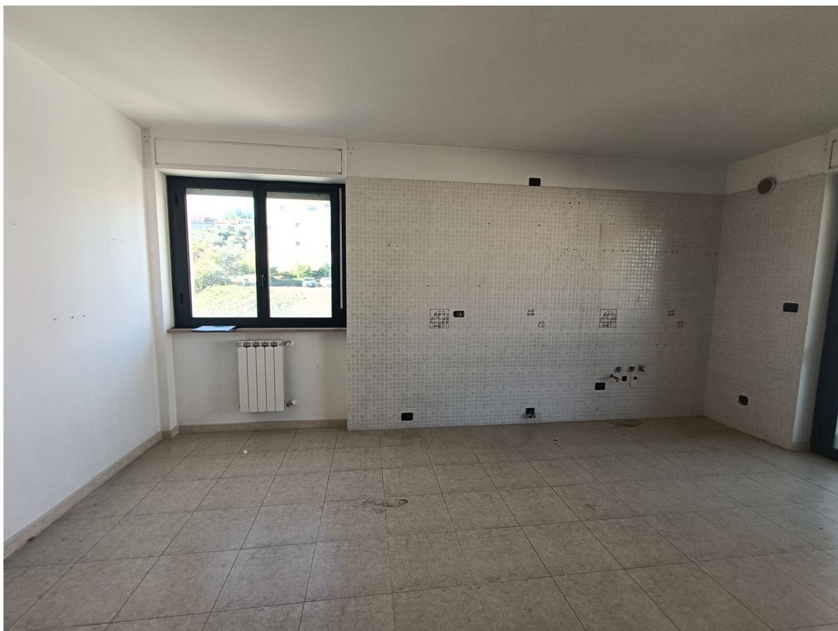
Immobile sito in Pescara alla Via di Sotto n.3, Piano quarto, Scala D, Palazzina B distinto al Foglio n.18 Particella n.2874 Sub. n.108