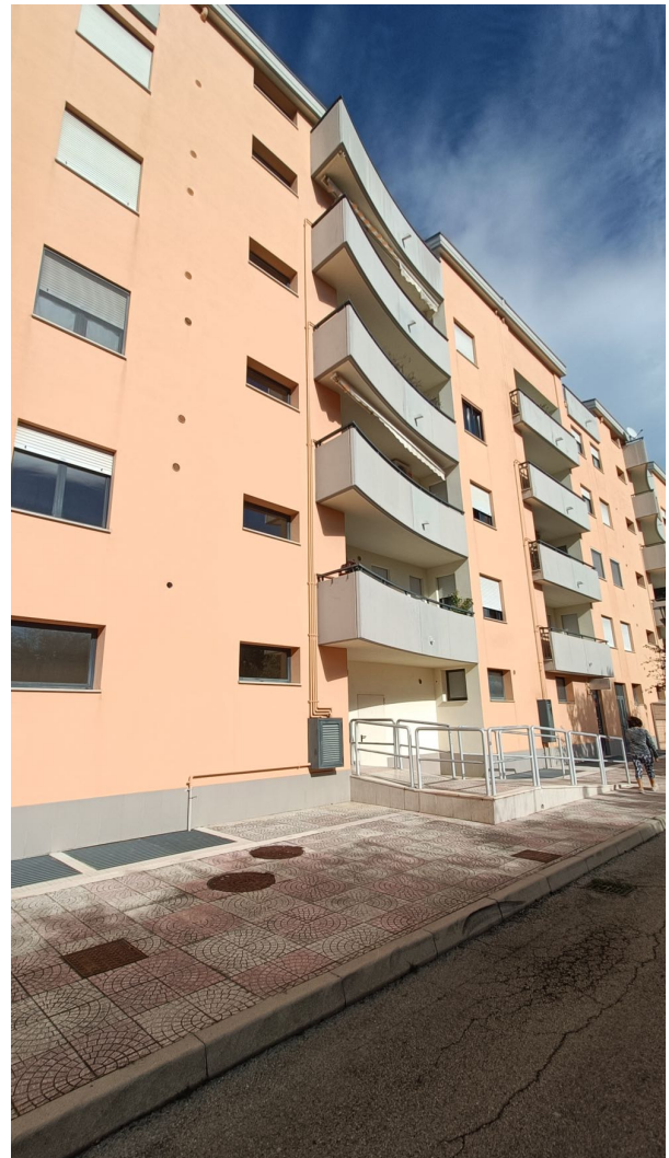
Immobile sito in Pescara alla Via di Sotto n.3, Piano quarto, Scala D, Palazzina B distinto al Foglio n.18 Particella n.2874 Sub. n.108