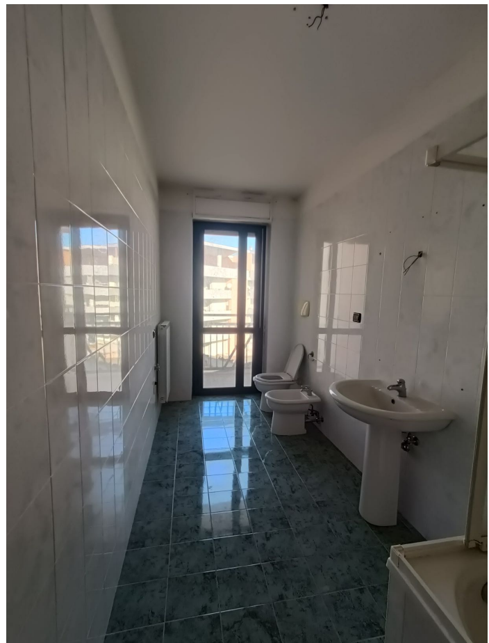
Immobile sito in Pescara alla Via di Sotto n.3, Piano quarto, Scala D, Palazzina B distinto al Foglio n.18 Particella n.2874 Sub. n.108