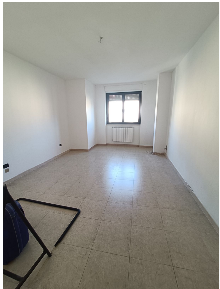
Immobile sito in Pescara alla Via di Sotto n.3, Piano quarto, Scala D, Palazzina B distinto al Foglio n.18 Particella n.2874 Sub. n.108