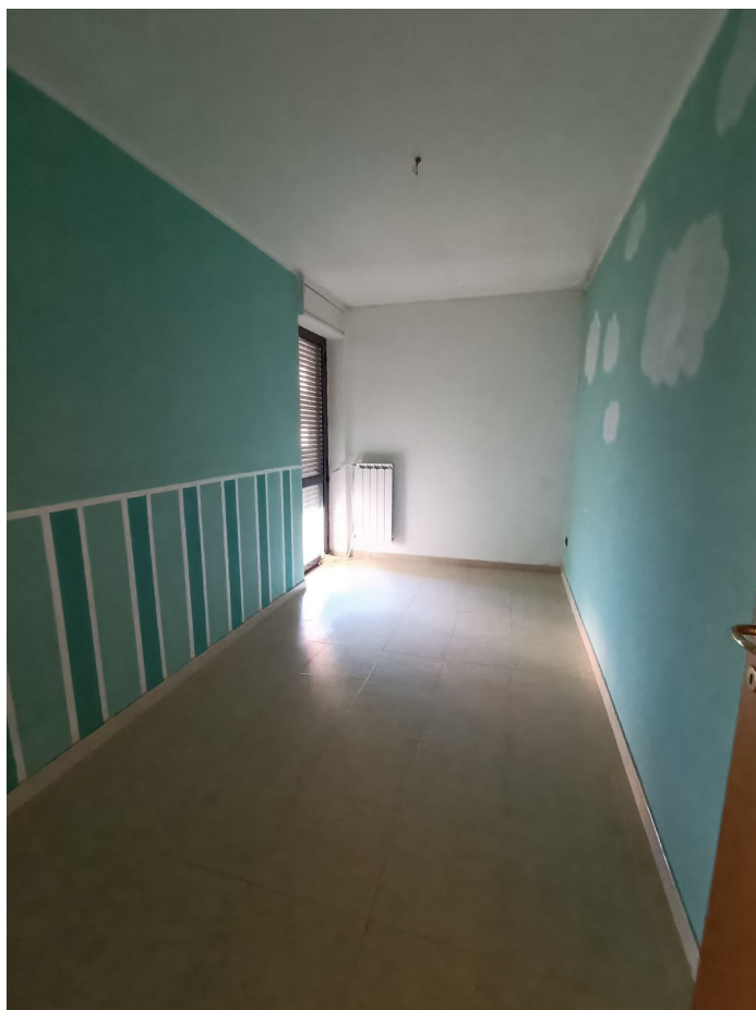
Immobile sito in Pescara alla Via di Sotto n.3, Piano quarto, Scala D, Palazzina B distinto al Foglio n.18 Particella n.2874 Sub. n.108