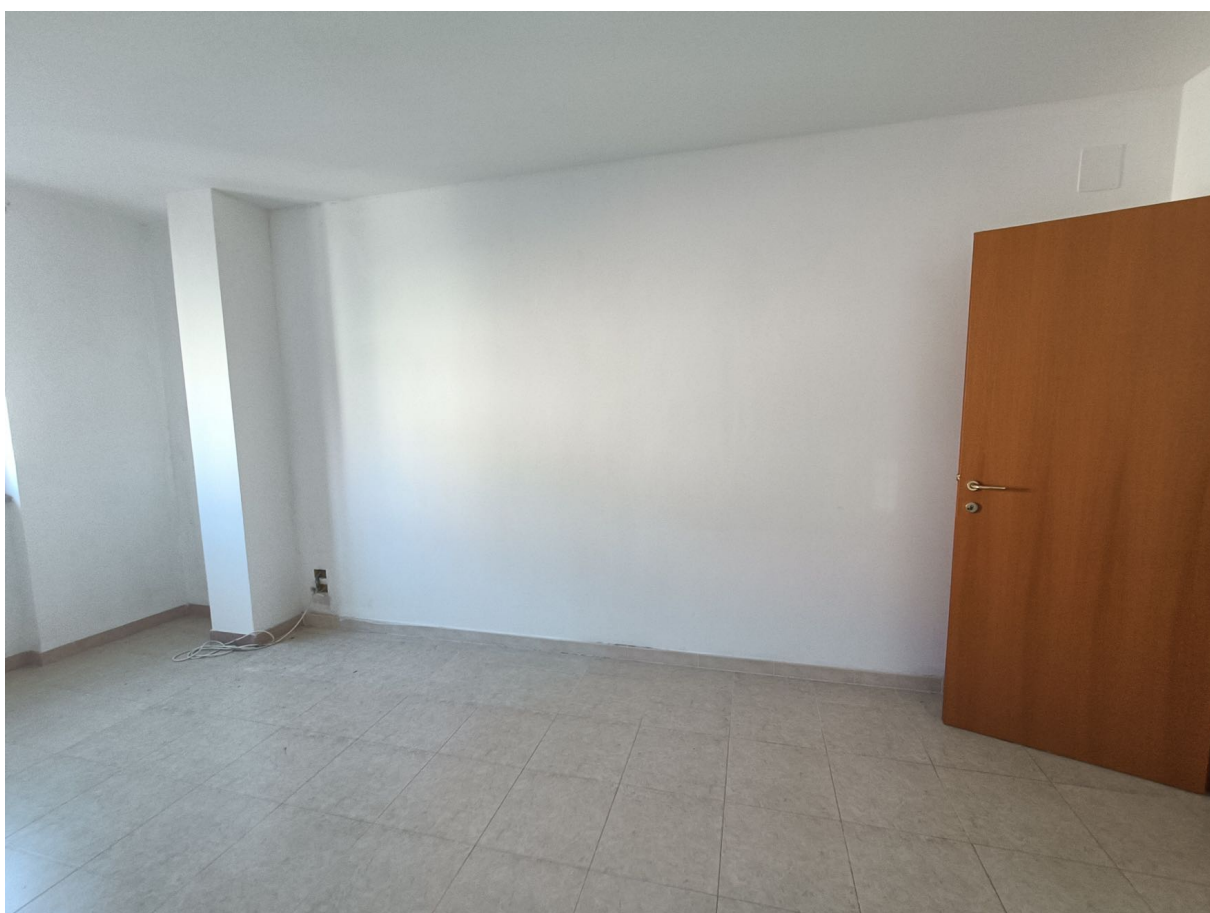
Immobile sito in Pescara alla Via di Sotto n.3, Piano quarto, Scala D, Palazzina B distinto al Foglio n.18 Particella n.2874 Sub. n.108