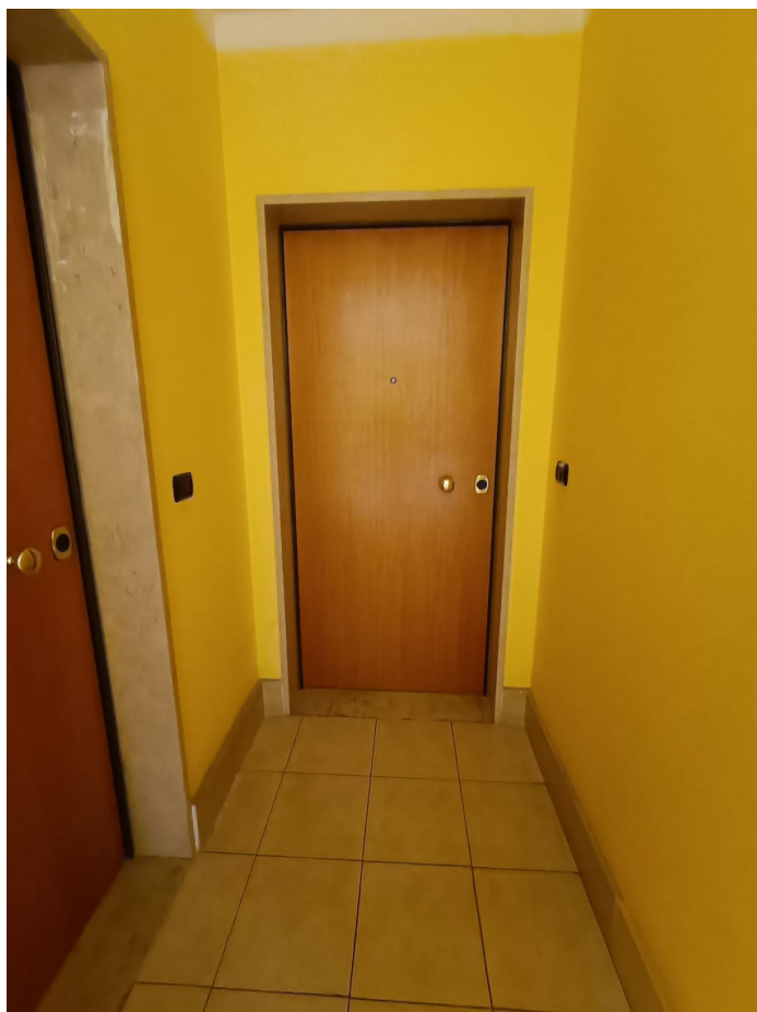
Immobile sito in Pescara alla Via di Sotto n.3, Piano quarto, Scala D, Palazzina B distinto al Foglio n.18 Particella n.2874 Sub. n.108