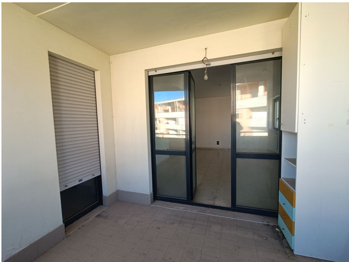
Immobile sito in Pescara alla Via di Sotto n.3, Piano quarto, Scala D, Palazzina B distinto al Foglio n.18 Particella n.2874 Sub. n.108