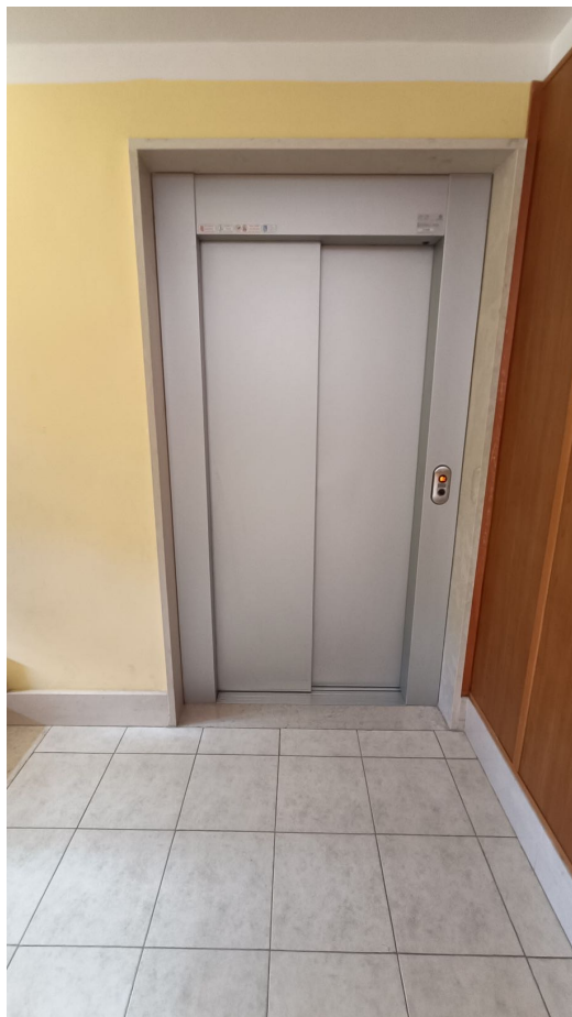
Immobile sito in Pescara alla Via di Sotto n.3, Piano quarto, Scala D, Palazzina B distinto al Foglio n.18 Particella n.2874 Sub. n.108