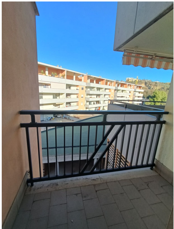
Immobile sito in Pescara alla Via di Sotto n.3, Piano quarto, Scala D, Palazzina B distinto al Foglio n.18 Particella n.2874 Sub. n.108