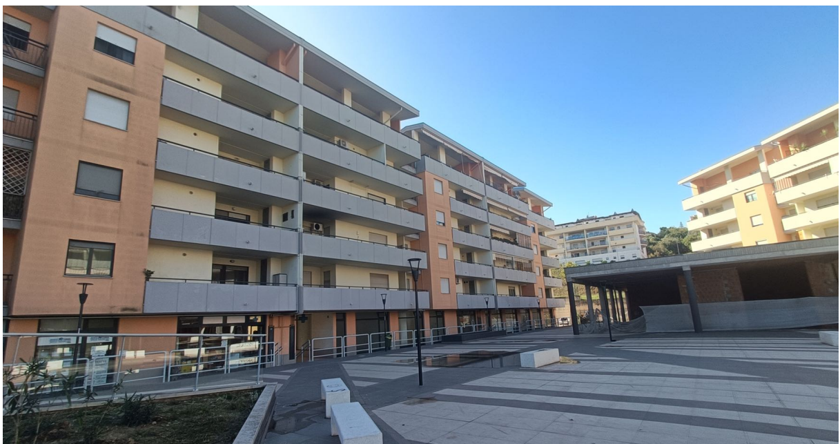
Immobile sito in Pescara alla Via di Sotto n.3, Piano quarto, Scala D, Palazzina B distinto al Foglio n.18 Particella n.2874 Sub. n.108