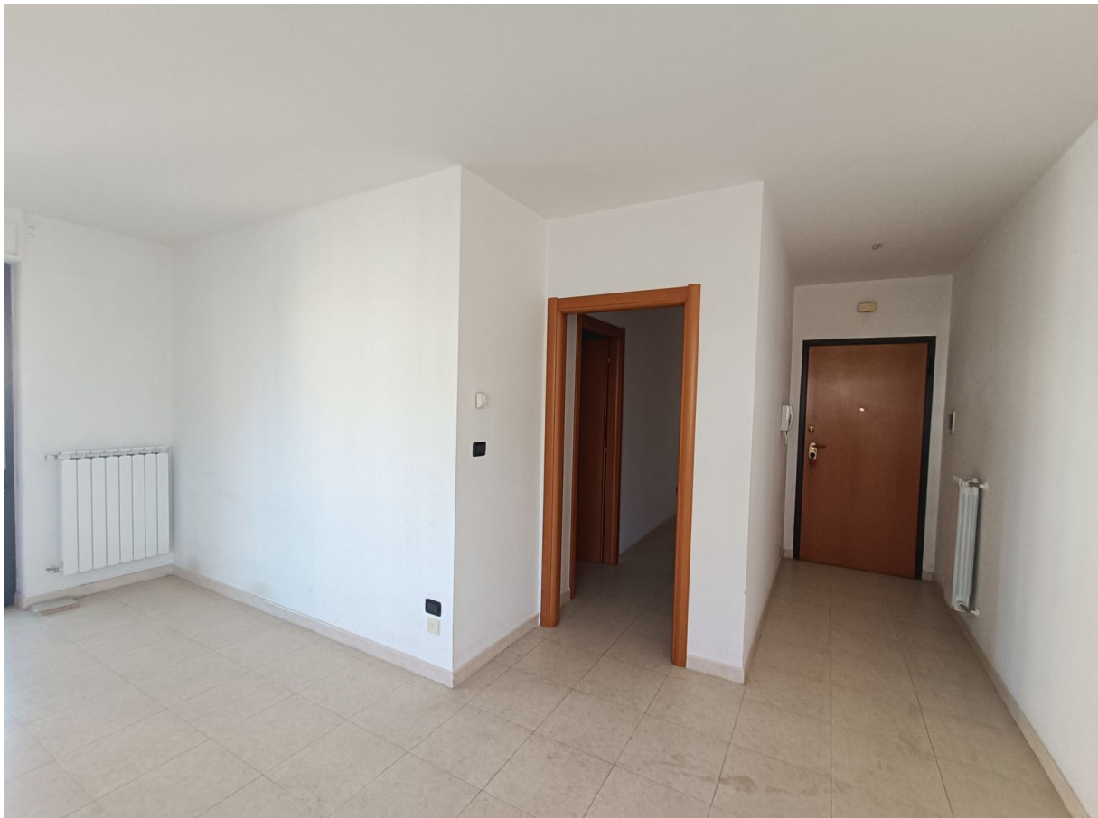
Immobile sito in Pescara alla Via di Sotto n.3, Piano quarto, Scala D, Palazzina B distinto al Foglio n.18 Particella n.2874 Sub. n.108