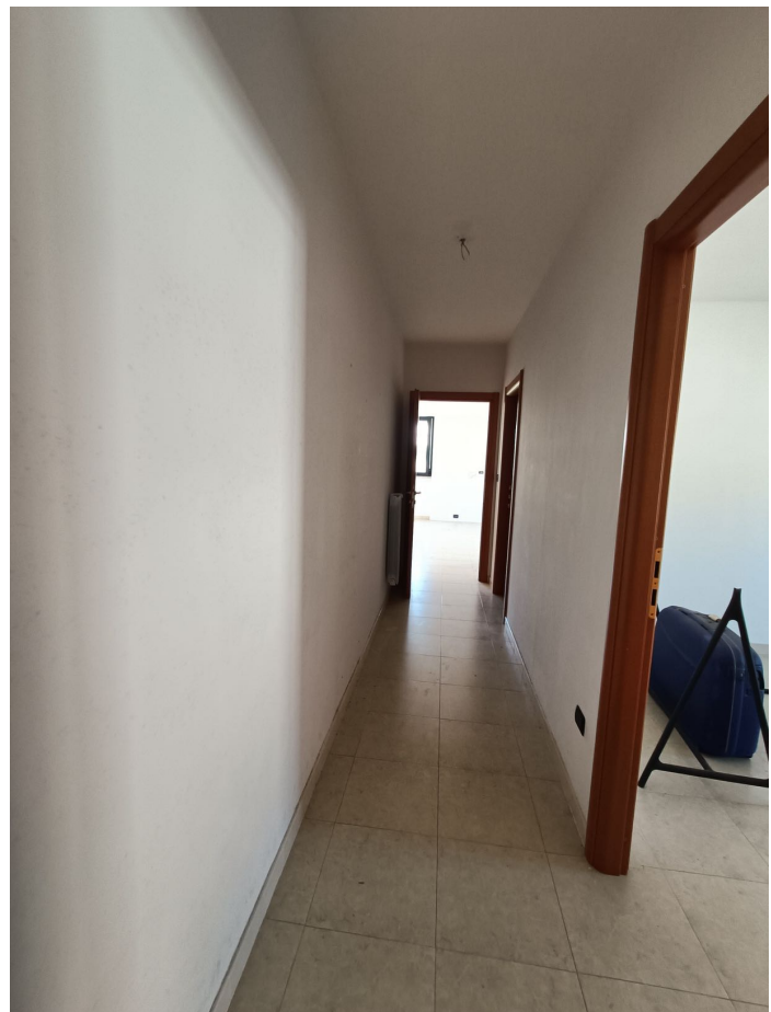
Immobile sito in Pescara alla Via di Sotto n.3, Piano quarto, Scala D, Palazzina B distinto al Foglio n.18 Particella n.2874 Sub. n.108