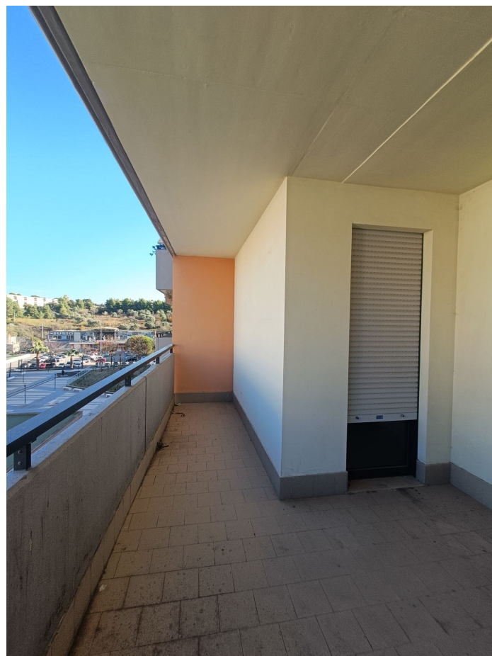
Immobile sito in Pescara alla Via di Sotto n.3, Piano quarto, Scala D, Palazzina B distinto al Foglio n.18 Particella n.2874 Sub. n.108