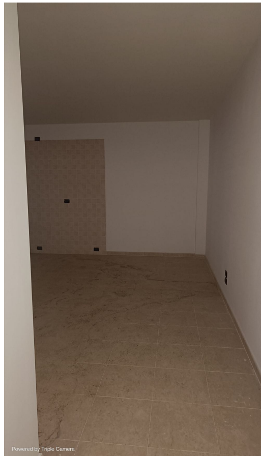
Immobile sito in Pescara alla Via di Sotto n.3/1, Piano primo, Scala C, Palazzina B distinto al Foglio n.18 Particella n.2874 Sub. n.101