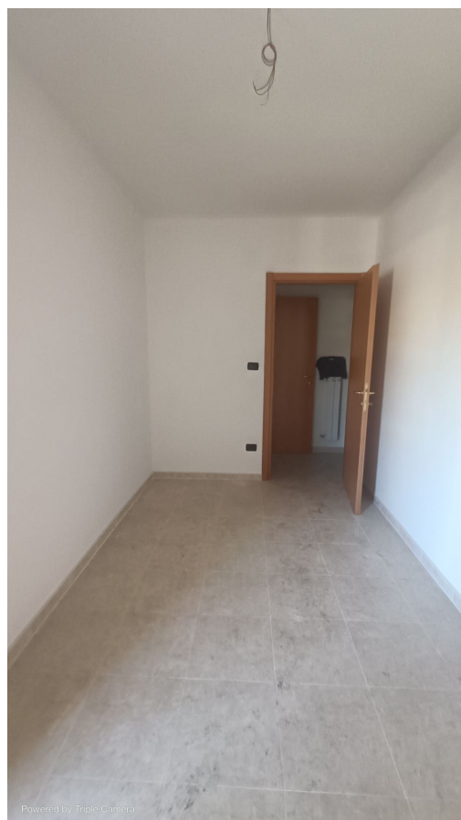
Immobile sito in Pescara alla Via di Sotto n.3/1, Piano primo, Scala C, Palazzina B distinto al Foglio n.18 Particella n.2874 Sub. n.101