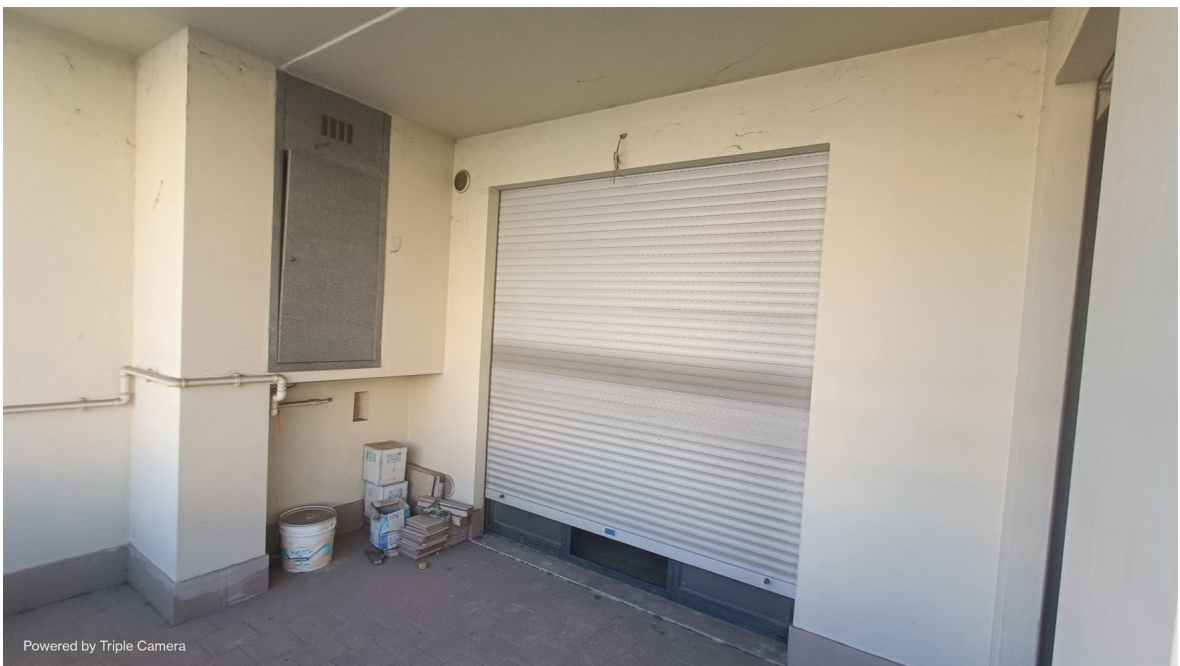
Immobile sito in Pescara alla Via di Sotto n.3/1, Piano primo, Scala C, Palazzina B distinto al Foglio n.18 Particella n.2874 Sub. n.101