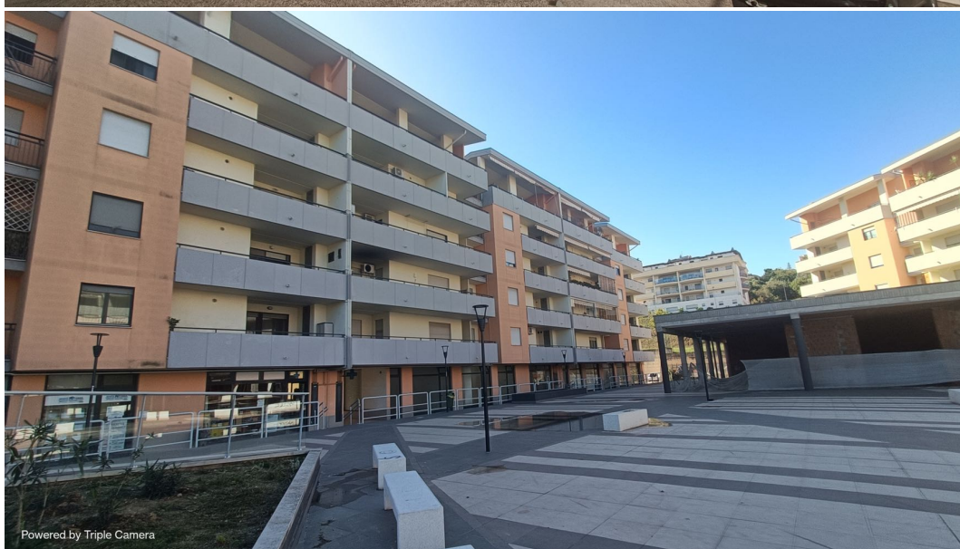
Immobile sito in Pescara alla Via di Sotto n.3/1, Piano primo, Scala C, Palazzina B distinto al Foglio n.18 Particella n.2874 Sub. n.101