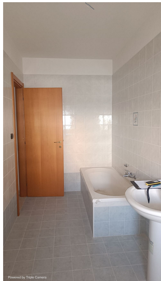
Immobile sito in Pescara alla Via di Sotto n.3/1, Piano primo, Scala C, Palazzina B distinto al Foglio n.18 Particella n.2874 Sub. n.101