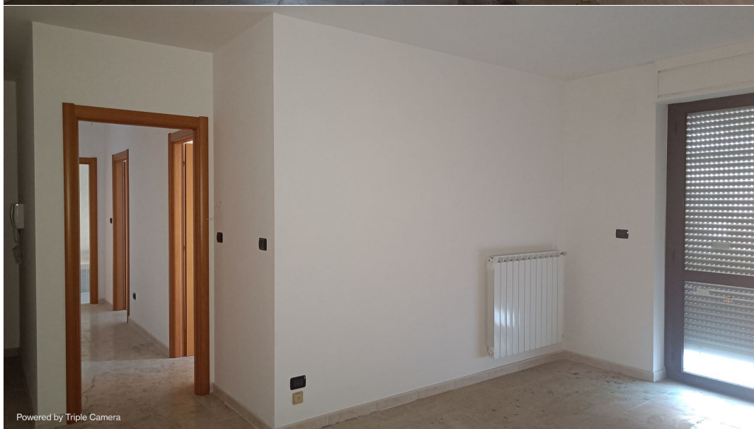
Immobile sito in Pescara alla Via di Sotto n.3/1, Piano primo, Scala C, Palazzina B distinto al Foglio n.18 Particella n.2874 Sub. n.101