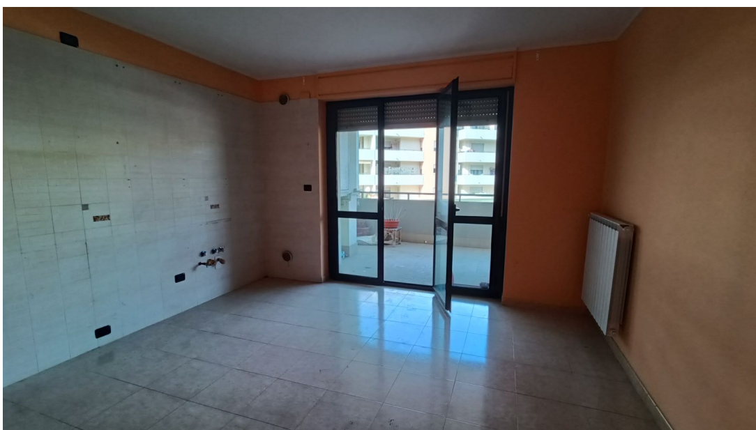
Immobile sito in Pescara alla Via di Sotto n.3/1, Piano secondo, Scala C, Palazzina B distinto al Foglio n.18 Particella n.2874 Sub. n.98