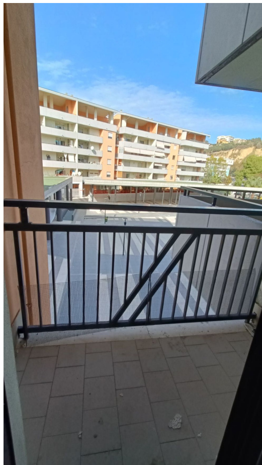
Immobile sito in Pescara alla Via di Sotto n.3/1, Piano secondo, Scala C, Palazzina B distinto al Foglio n.18 Particella n.2874 Sub. n.98