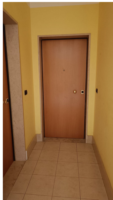
Immobile sito in Pescara alla Via di Sotto n.3/1, Piano secondo, Scala C, Palazzina B distinto al Foglio n.18 Particella n.2874 Sub. n.98