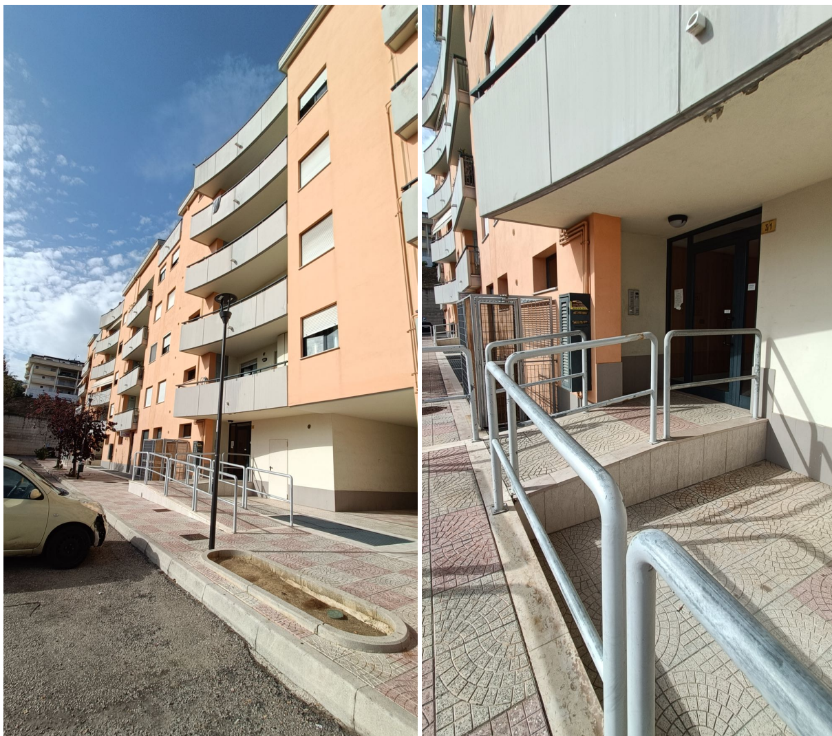
Immobile sito in Pescara alla Via di Sotto n.3/1, Piano secondo, Scala C, Palazzina B distinto al Foglio n.18 Particella n.2874 Sub. n.98