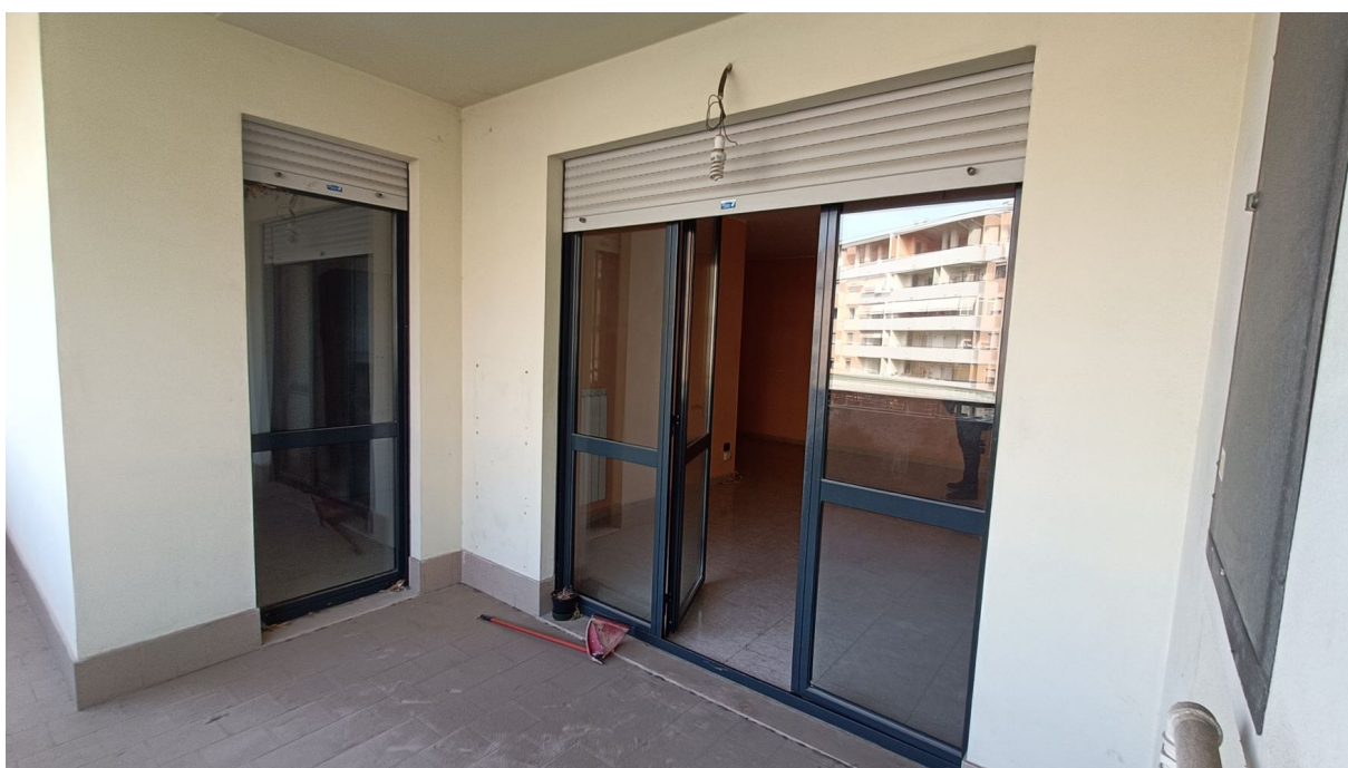
Immobile sito in Pescara alla Via di Sotto n.3/1, Piano secondo, Scala C, Palazzina B distinto al Foglio n.18 Particella n.2874 Sub. n.98