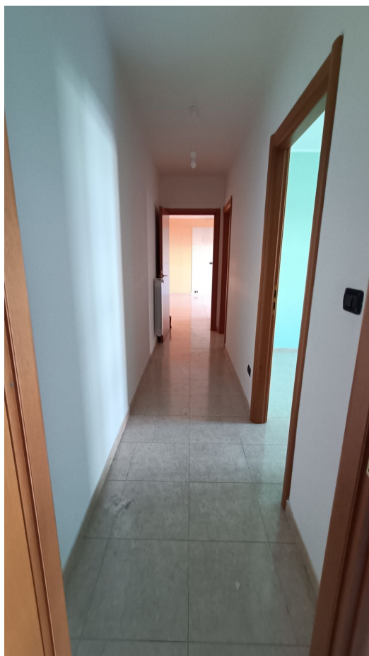
Immobile sito in Pescara alla Via di Sotto n.3/1, Piano secondo, Scala C, Palazzina B distinto al Foglio n.18 Particella n.2874 Sub. n.98