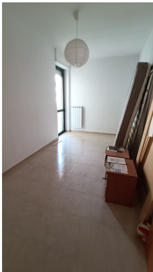
Immobile sito in Pescara alla Via di Sotto n.3/1, Piano secondo, Scala C, Palazzina B distinto al Foglio n.18 Particella n.2874 Sub. n.98