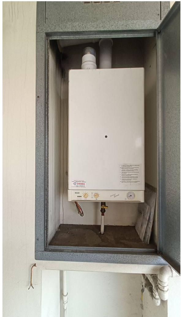
Immobile sito in Pescara alla Via di Sotto n.3/3, Piano quarto, Scala A, Palazzina B distinto al Foglio n.18 Particella n.2874 Sub. n.63