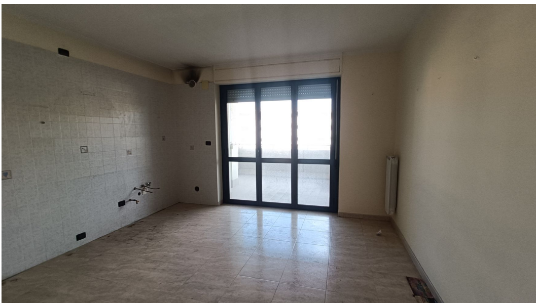
Immobile sito in Pescara alla Via di Sotto n.3/3, Piano quarto, Scala A, Palazzina B distinto al Foglio n.18 Particella n.2874 Sub. n.63