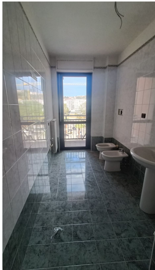
Immobile sito in Pescara alla Via di Sotto n.3/3, Piano quarto, Scala A, Palazzina B distinto al Foglio n.18 Particella n.2874 Sub. n.63