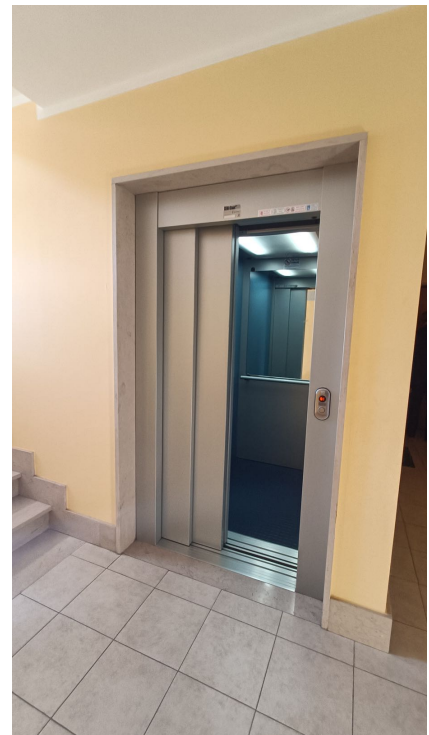
Immobile sito in Pescara alla Via di Sotto n.3/3, Piano quarto, Scala A, Palazzina B distinto al Foglio n.18 Particella n.2874 Sub. n.63