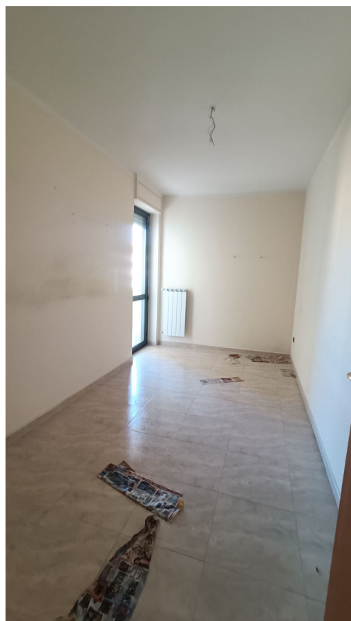
Immobile sito in Pescara alla Via di Sotto n.3/3, Piano quarto, Scala A, Palazzina B distinto al Foglio n.18 Particella n.2874 Sub. n.63