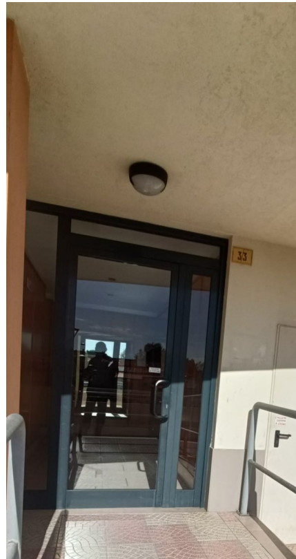
Immobile sito in Pescara alla Via di Sotto n.3/3, Piano quarto, Scala A, Palazzina B distinto al Foglio n.18 Particella n.2874 Sub. n.63