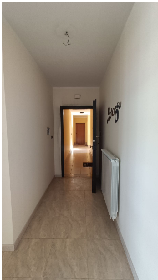
Immobile sito in Pescara alla Via di Sotto n.3/3, Piano quarto, Scala A, Palazzina B distinto al Foglio n.18 Particella n.2874 Sub. n.63