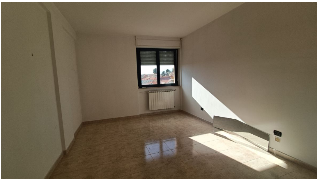
Immobile sito in Pescara alla Via di Sotto n.3/2, Piani quarto e quinto, Scala B, Palazzina B distinto al Foglio n.18 Particella n.2874 Sub. n.139. Piano quarto.