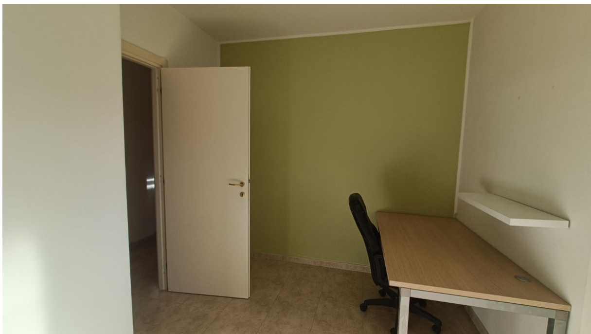
Immobile sito in Pescara alla Via di Sotto n.3/2, Piani quarto e quinto, Scala B, Palazzina B distinto al Foglio n.18 Particella n.2874 Sub. n.139. Piano quarto.