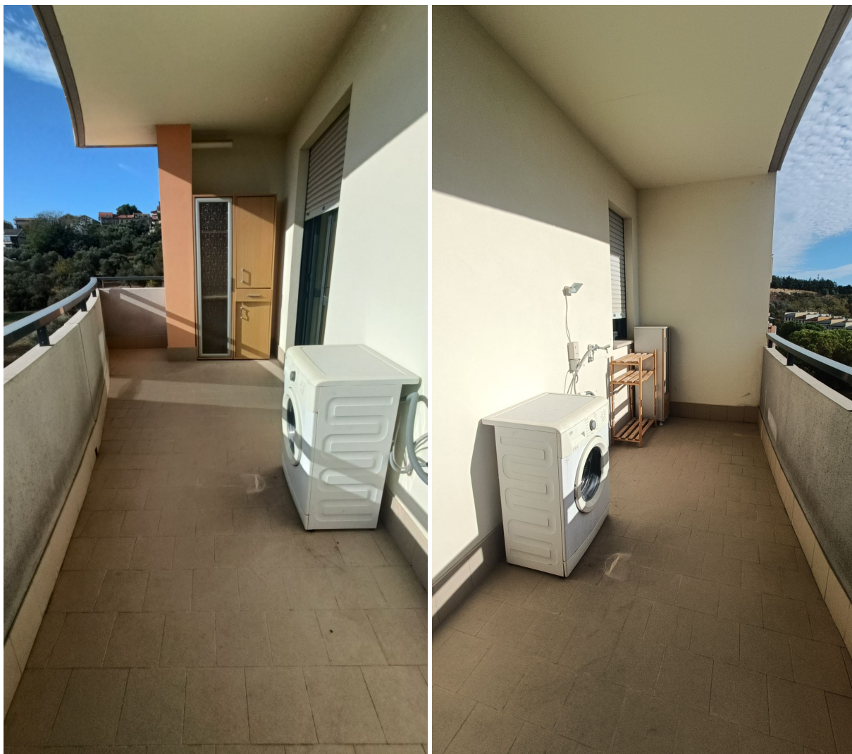
Immobile sito in Pescara alla Via di Sotto n.3/2, Piani quarto e quinto, Scala B, Palazzina B distinto al Foglio n.18 Particella n.2874 Sub. n.139. Piano quarto.