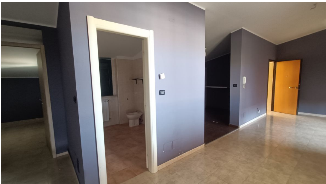
Immobile sito in Pescara alla Via di Sotto n.3/2, Piani quarto e quinto, Scala B, Palazzina B distinto al Foglio n.18 Particella n.2874 Sub. n.139. Piano quinto.