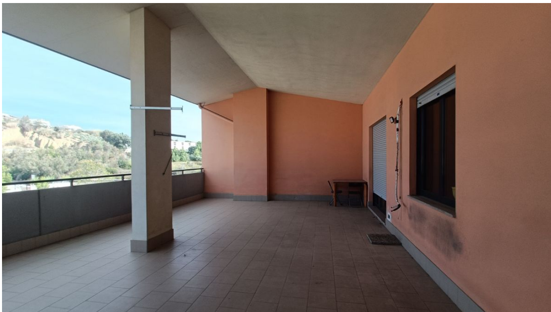
Immobile sito in Pescara alla Via di Sotto n.3/2, Piani quarto e quinto, Scala B, Palazzina B distinto al Foglio n.18 Particella n.2874 Sub. n.139. Piano quinto.