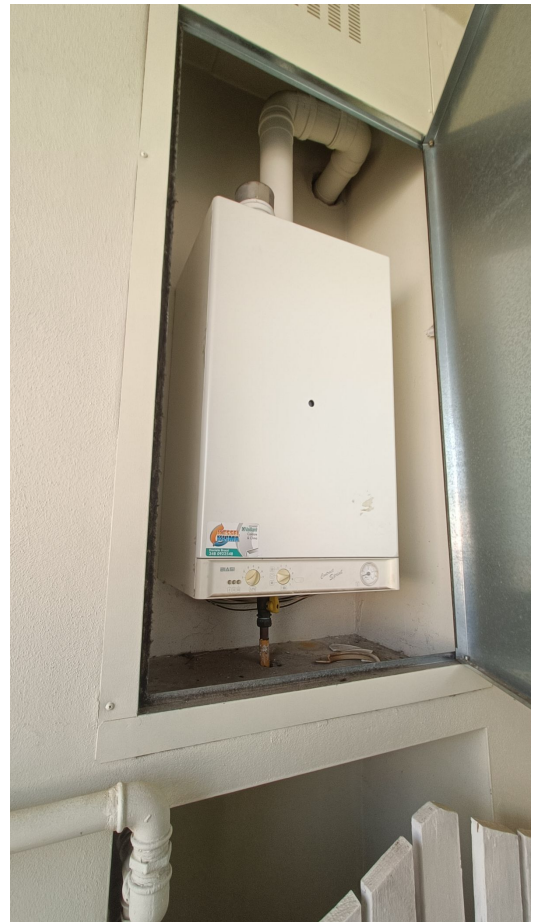
Immobile sito in Pescara alla Via di Sotto n.3/2, Piani quarto e quinto, Scala B, Palazzina B distinto al Foglio n.18 Particella n.2874 Sub. n.139. Piano quarto.