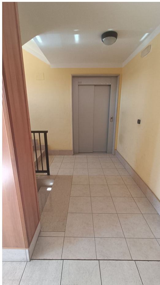
Immobile sito in Pescara alla Via di Sotto n.3/2, Piani quarto e quinto, Scala B, Palazzina B, distinto al Foglio n.18 Particella n.2874 Sub. n.139.