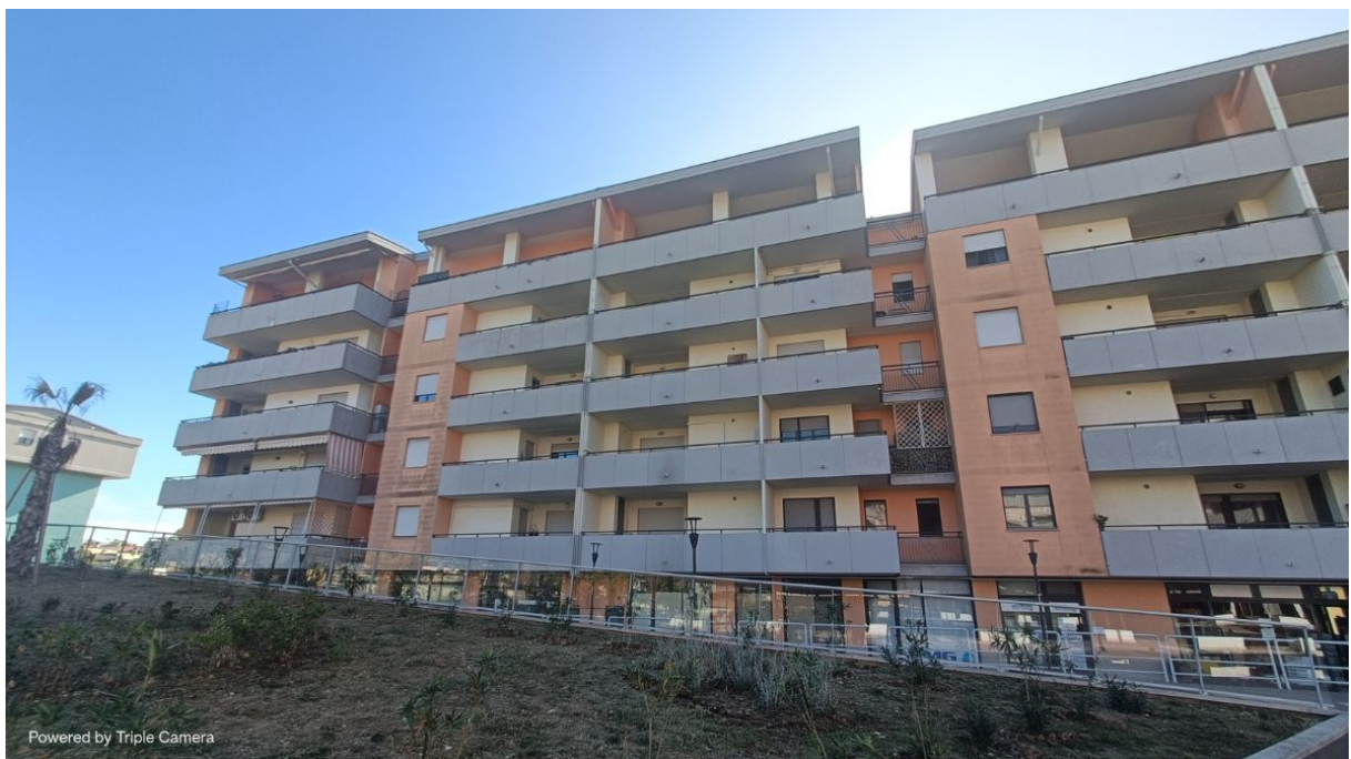
Immobile sito in Pescara alla Via di Sotto n.3/2, Piani quarto e quinto, Scala B, Palazzina B, distinto al Foglio n.18 Particella n.2874 Sub. n.139.