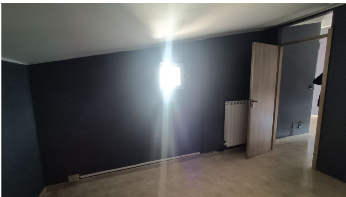
Immobile sito in Pescara alla Via di Sotto n.3/2, Piani quarto e quinto, Scala B, Palazzina B distinto al Foglio n.18 Particella n.2874 Sub. n.139. Piano quinto.