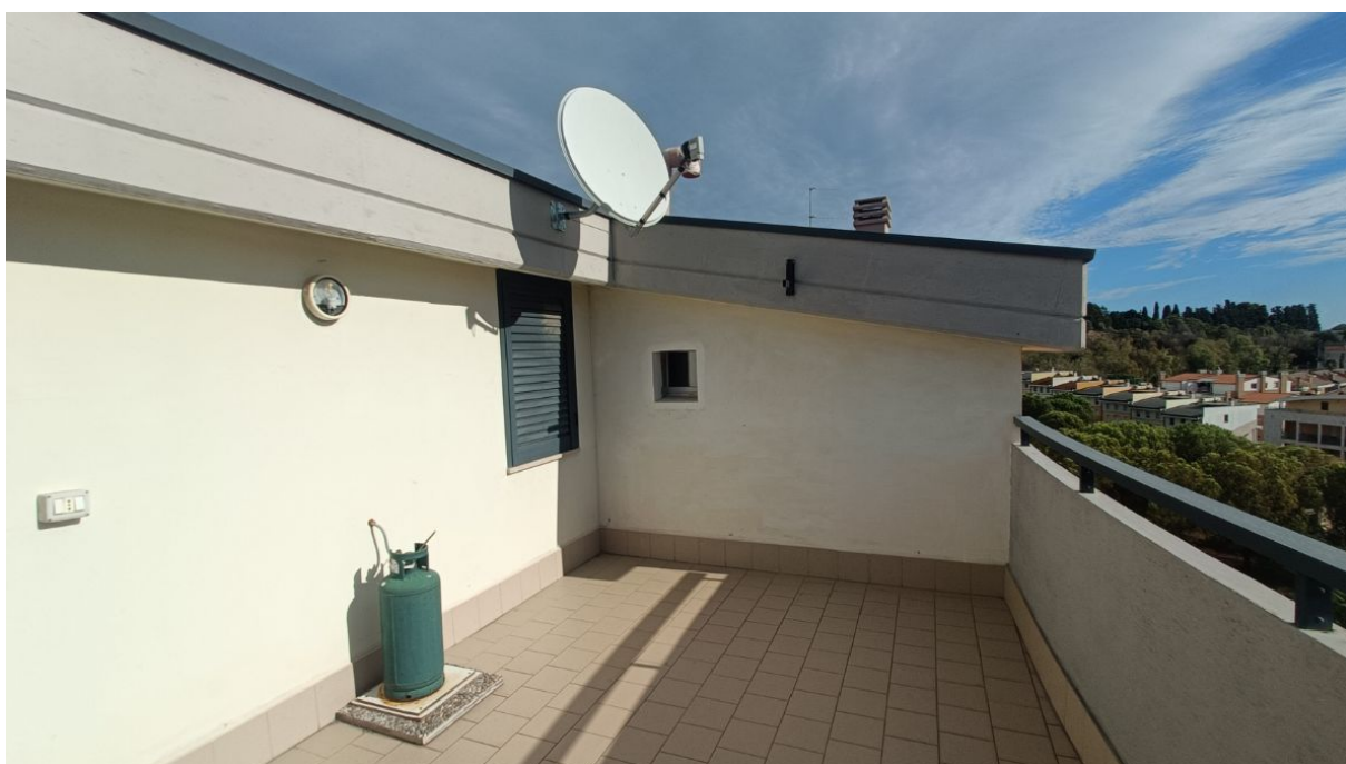
Immobile sito in Pescara alla Via di Sotto n.3/2, Piani quarto e quinto, Scala B, Palazzina B distinto al Foglio n.18 Particella n.2874 Sub. n.139. Piano quinto.