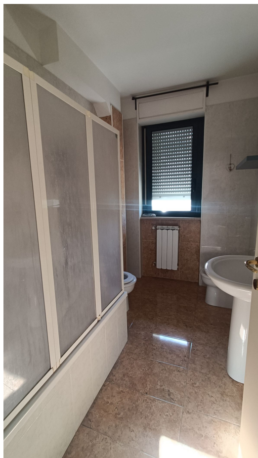
Immobile sito in Pescara alla Via di Sotto n.3/2, Piani quarto e quinto, Scala B, Palazzina B distinto al Foglio n.18 Particella n.2874 Sub. n.139. Piano quarto.