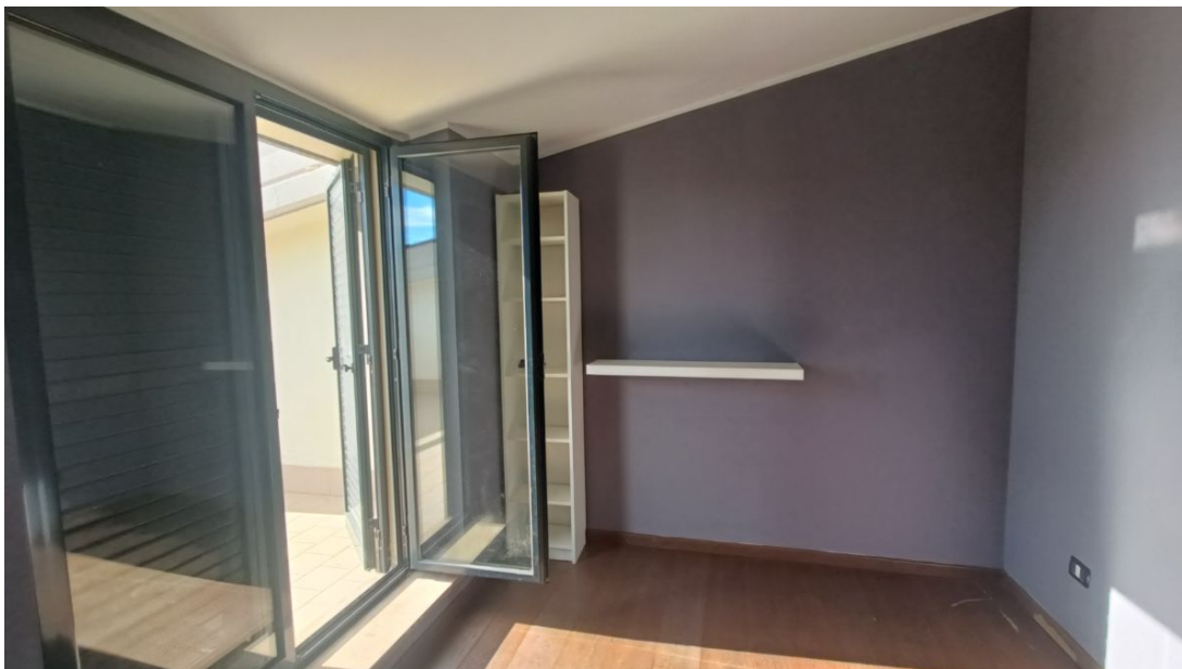
Immobile sito in Pescara alla Via di Sotto n.3/2, Piani quarto e quinto, Scala B, Palazzina B distinto al Foglio n.18 Particella n.2874 Sub. n.139. Piano quinto.