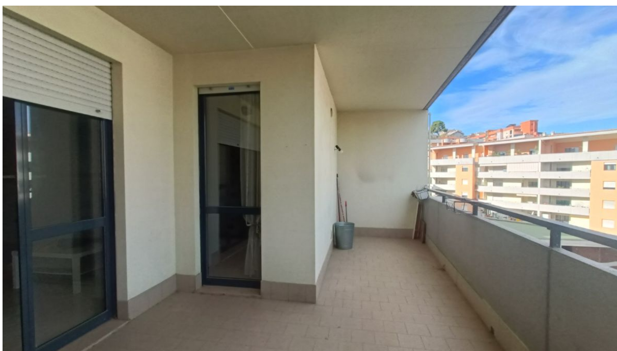
Immobile sito in Pescara alla Via di Sotto n.3/2, Piani quarto e quinto, Scala B, Palazzina B distinto al Foglio n.18 Particella n.2874 Sub. n.139. Piano quarto.