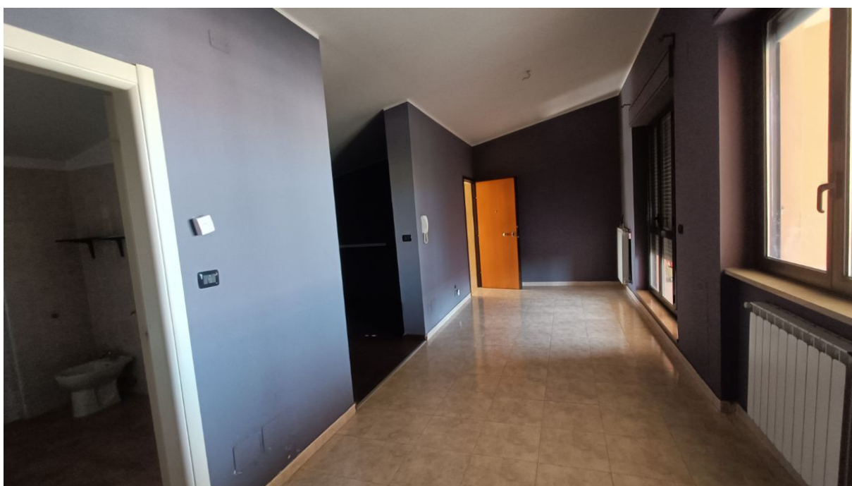
Immobile sito in Pescara alla Via di Sotto n.3/2, Piani quarto e quinto, Scala B, Palazzina B distinto al Foglio n.18 Particella n.2874 Sub. n.139. Piano quinto.