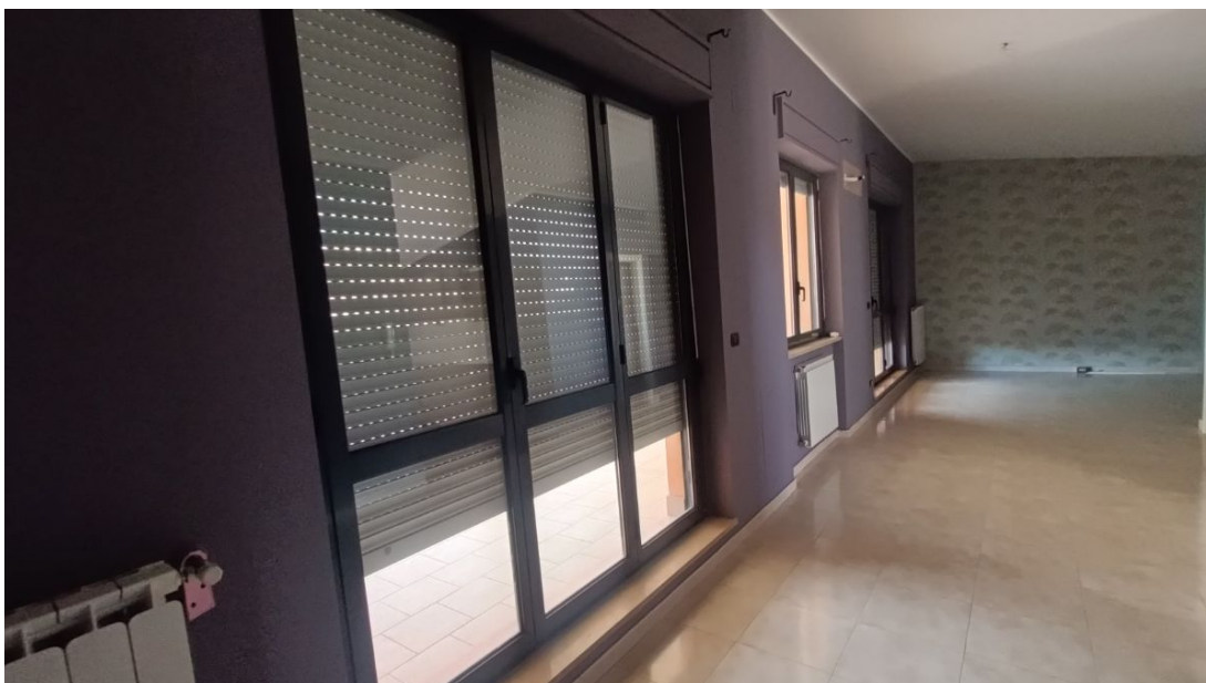
Immobile sito in Pescara alla Via di Sotto n.3/2, Piani quarto e quinto, Scala B, Palazzina B distinto al Foglio n.18 Particella n.2874 Sub. n.139. Piano quinto.