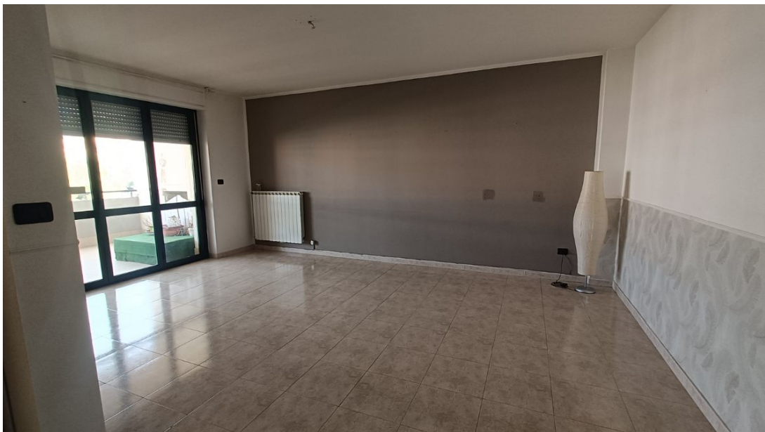
Immobile sito in Pescara alla Via di Sotto n.3/2, Piani quarto e quinto, Scala B, Palazzina B distinto al Foglio n.18 Particella n.2874 Sub. n.139. Piano quarto.