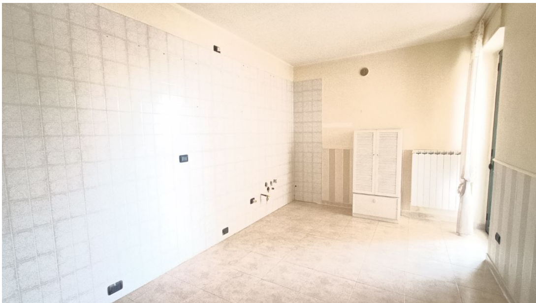
Immobile sito in Pescara alla Via di Sotto n.3/2, Piani quarto e quinto, Scala B, Palazzina B distinto al Foglio n.18 Particella n.2874 Sub. n.139. Piano quarto.