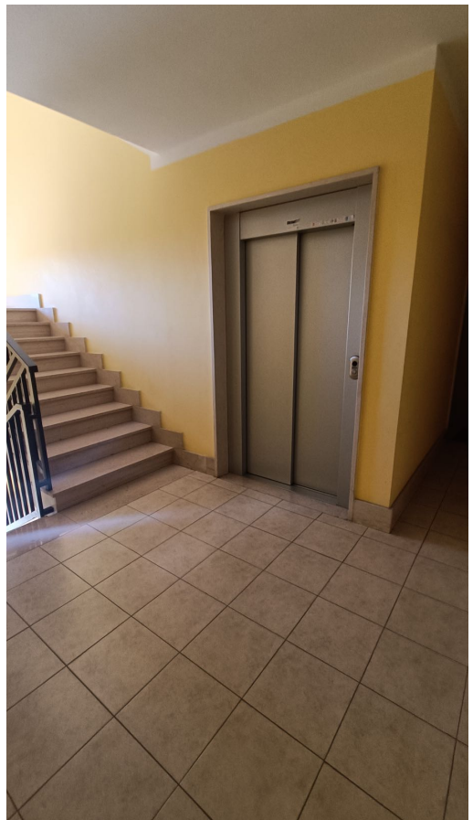
Immobile sito in Pescara alla Via di Sotto n.3, Piano primo, Scala D, Palazzina B distinto al Foglio n.18 Particella n.2874 Sub. n.119