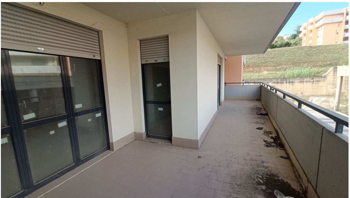
Immobile sito in Pescara alla Via di Sotto n.3, Piano primo, Scala D, Palazzina B distinto al Foglio n.18 Particella n.2874 Sub. n.119