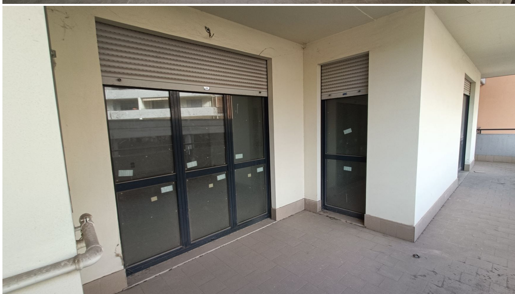
Immobile sito in Pescara alla Via di Sotto n.3, Piano primo, Scala D, Palazzina B distinto al Foglio n.18 Particella n.2874 Sub. n.119