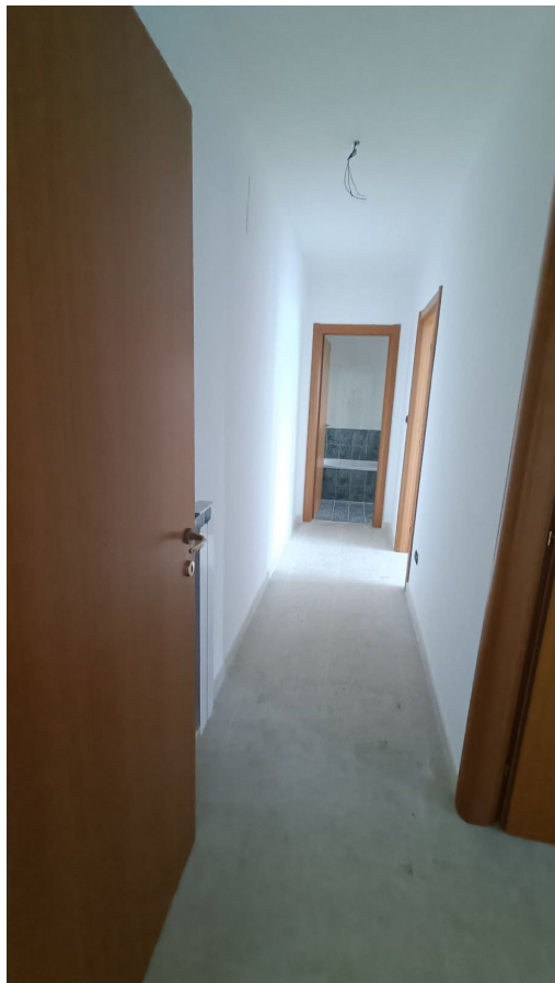
Immobile sito in Pescara alla Via di Sotto n.3, Piano primo, Scala D, Palazzina B distinto al Foglio n.18 Particella n.2874 Sub. n.119