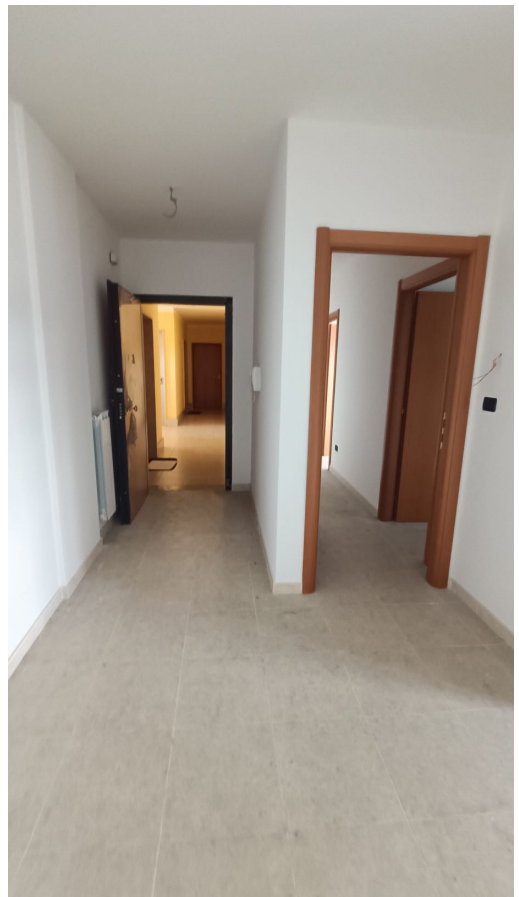
Immobile sito in Pescara alla Via di Sotto n.3, Piano primo, Scala D, Palazzina B distinto al Foglio n.18 Particella n.2874 Sub. n.119