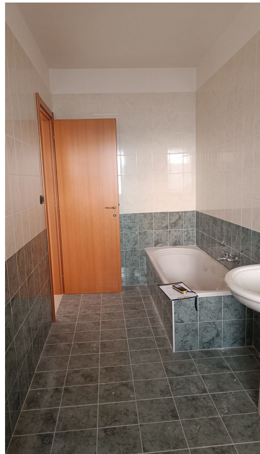
Immobile sito in Pescara alla Via di Sotto n.3, Piano primo, Scala D, Palazzina B distinto al Foglio n.18 Particella n.2874 Sub. n.119