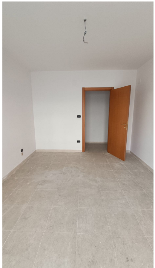
Immobile sito in Pescara alla Via di Sotto n.3, Piano primo, Scala D, Palazzina B distinto al Foglio n.18 Particella n.2874 Sub. n.119