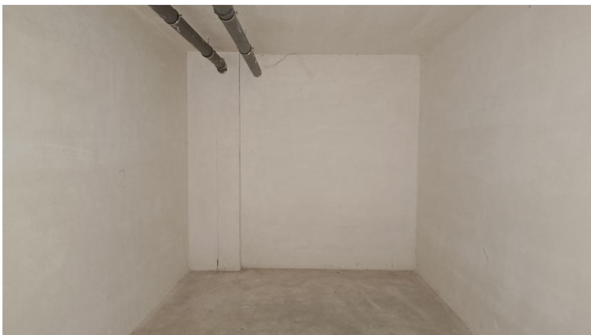
Immobile sito in Pescara alla Via di Sotto n.3, Piano interrato, Palazzina B distinto al Foglio n.18 Particella n.2874 Sub. n.30