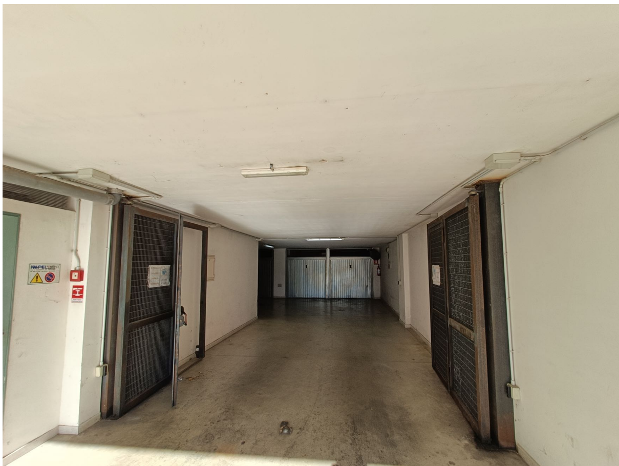
Immobile sito in Pescara alla Via di Sotto n.3, Piano interrato, Palazzina B distinto al Foglio n.18 Particella n.2874 Sub. n.30