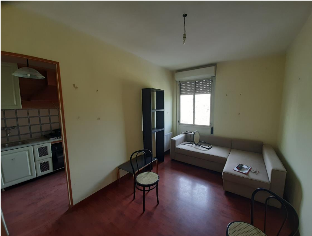
Soggiorno-pranzo, con vista cucina