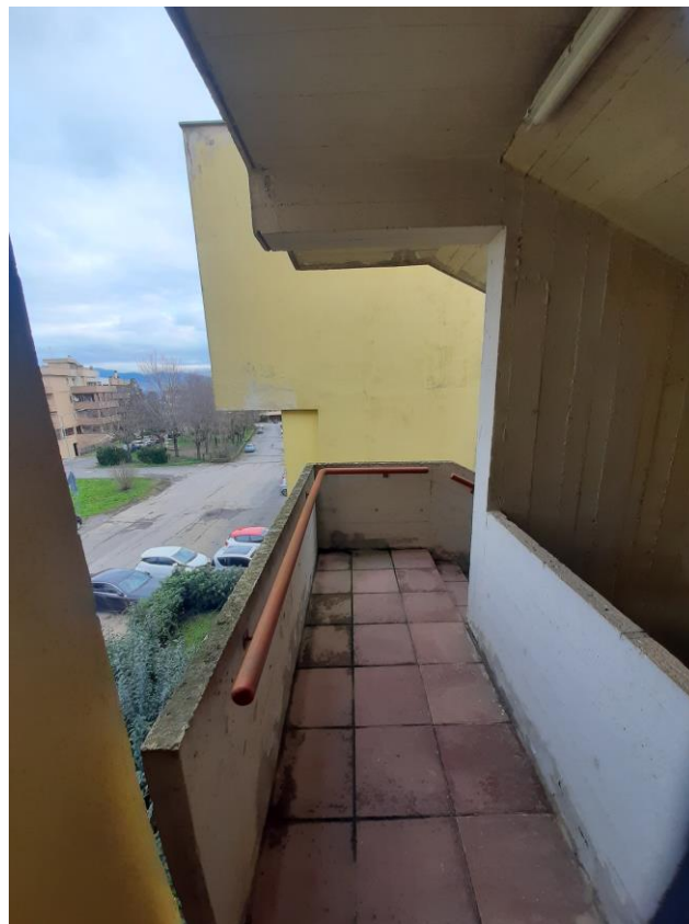
Scala Edificio A4 (civico 8 di Via Palmiro Togliatti)