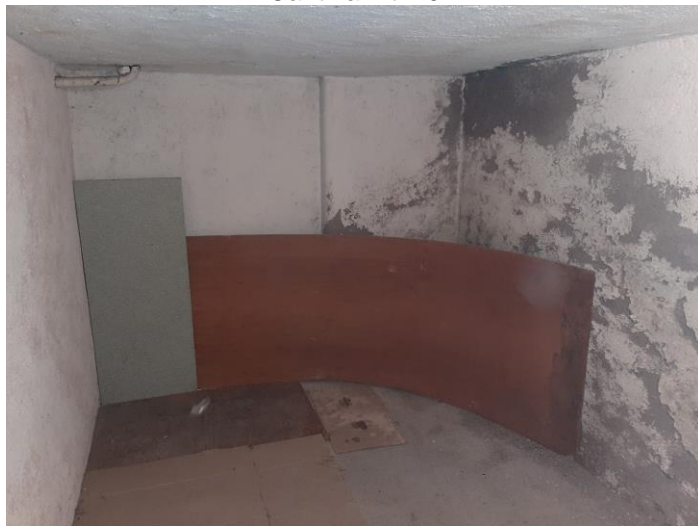
Cantina Int 20