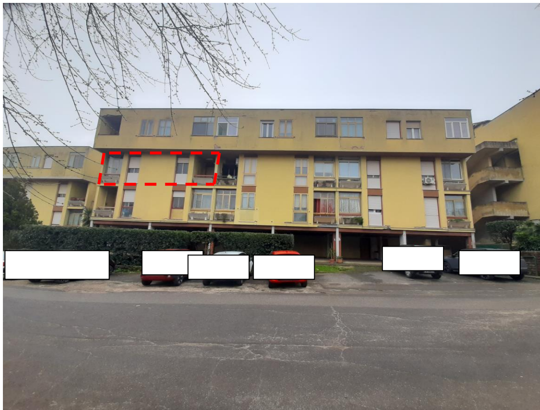
Facciata condominio – con localizzazione alloggio