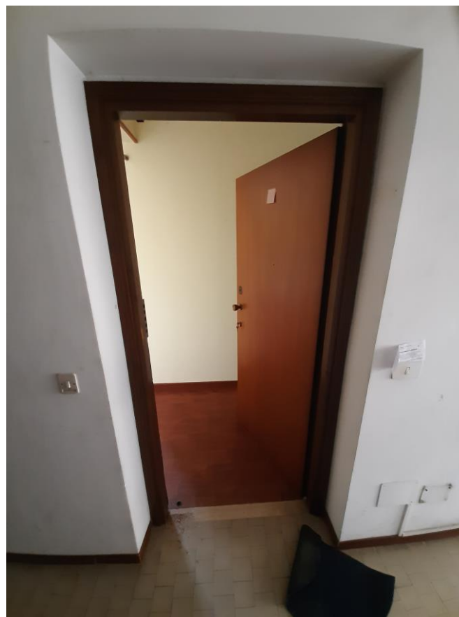
portoncino di ingresso all'alloggio int. 20 (visto dall'esterno)