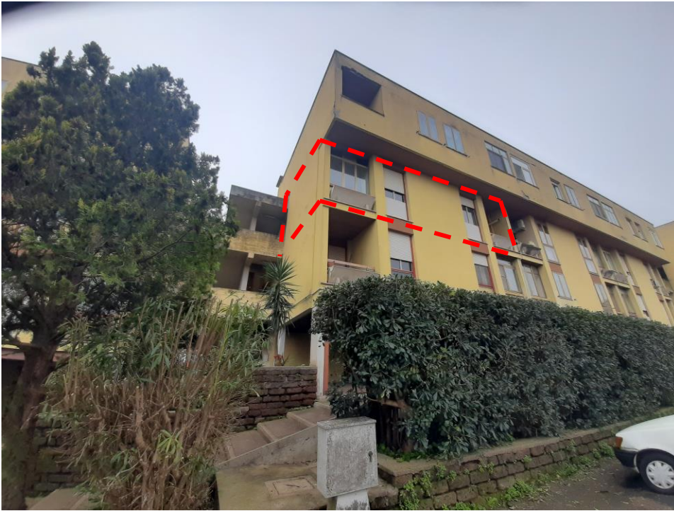
Facciata condominio (scala A4) – con localizzazione alloggio