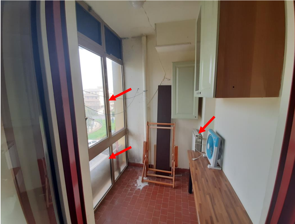
Balcone 1 con infisso e radiatore da rimuovere