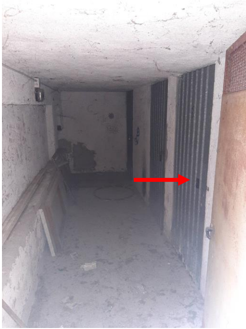
Cantina Int. 20