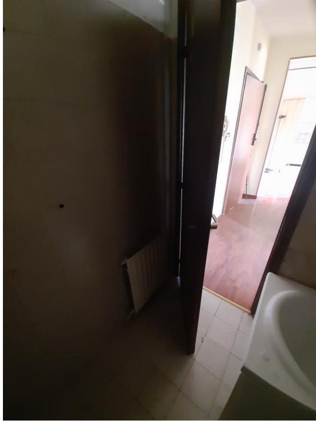
Bagno (unica foto sviluppata, per assenza di corrente e/o malfunzionamento flash)