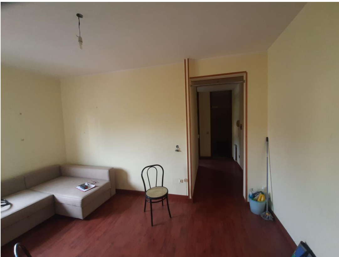
Soggiorno-pranzo, con vista zona ingresso disimpegno