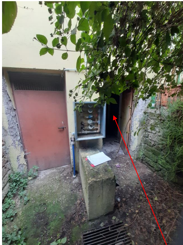
Porta di accesso alle cantine