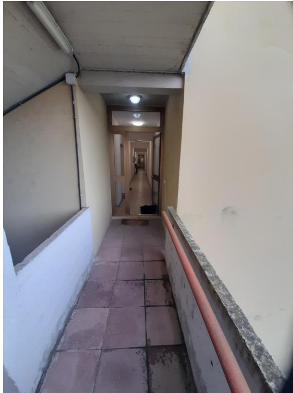
Scala Edificio A4 (civico 8 di Via Palmiro Togliatti)