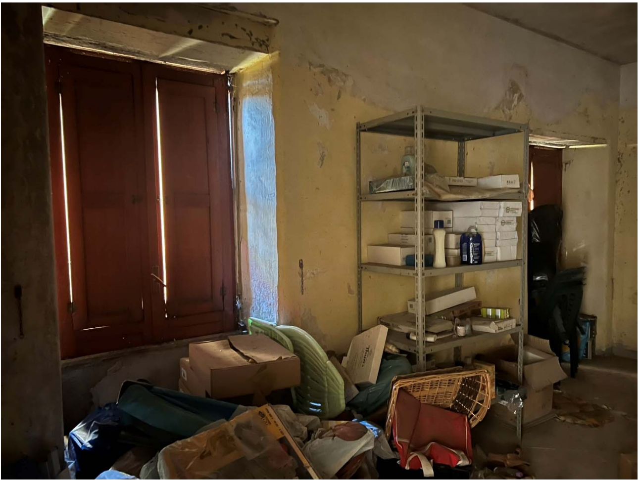
Foto 11 – Vista interna dell'unità p.la 25-sub 11: dettaglio del secondo ambiente