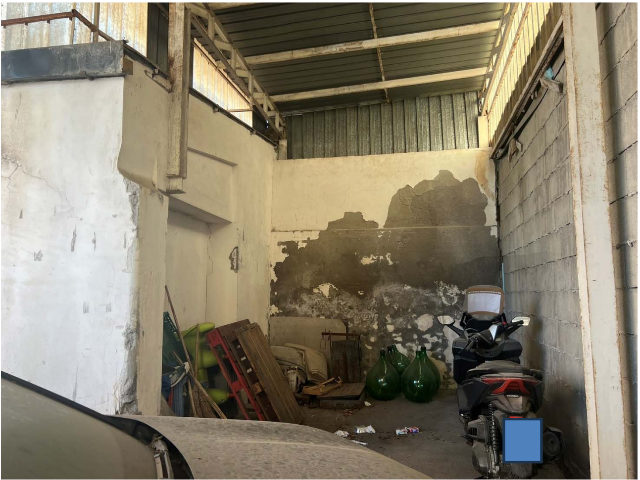
Foto 17 – Vista dell'area di corte coperta da tettoia metallica – p.lla 1075