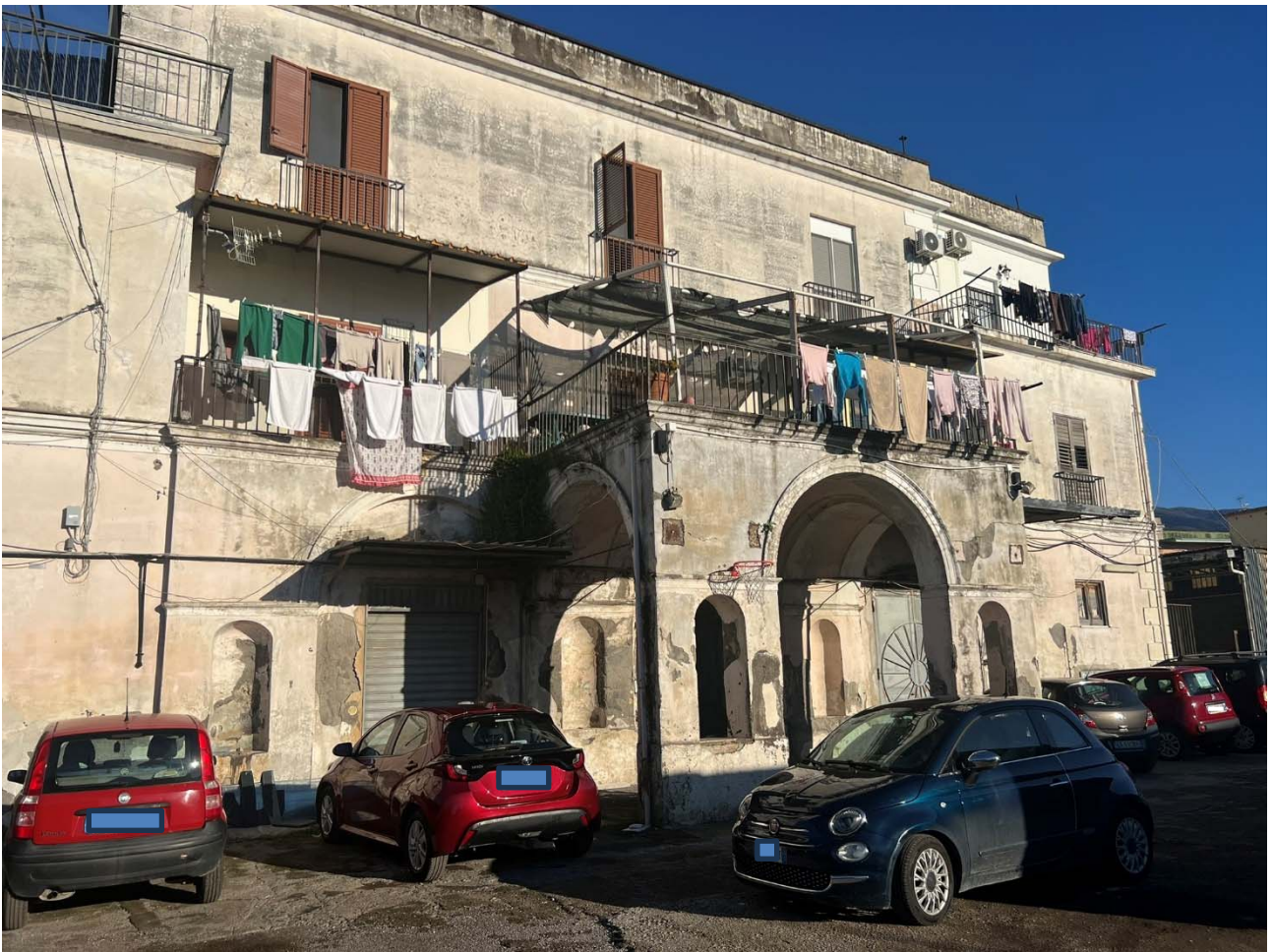
Foto 1 - Vista del fabbricato sito in Traversa Prima via Tavernola n. 70/l già n. 72, Castellamare di Stabia (Na)