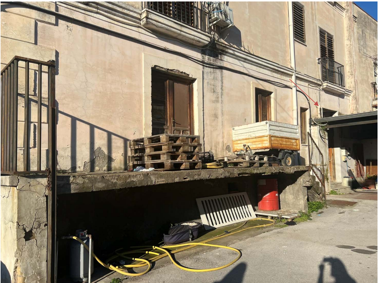
Foto 4 - Vista degli accessi all'unità p.la 25-sub 11