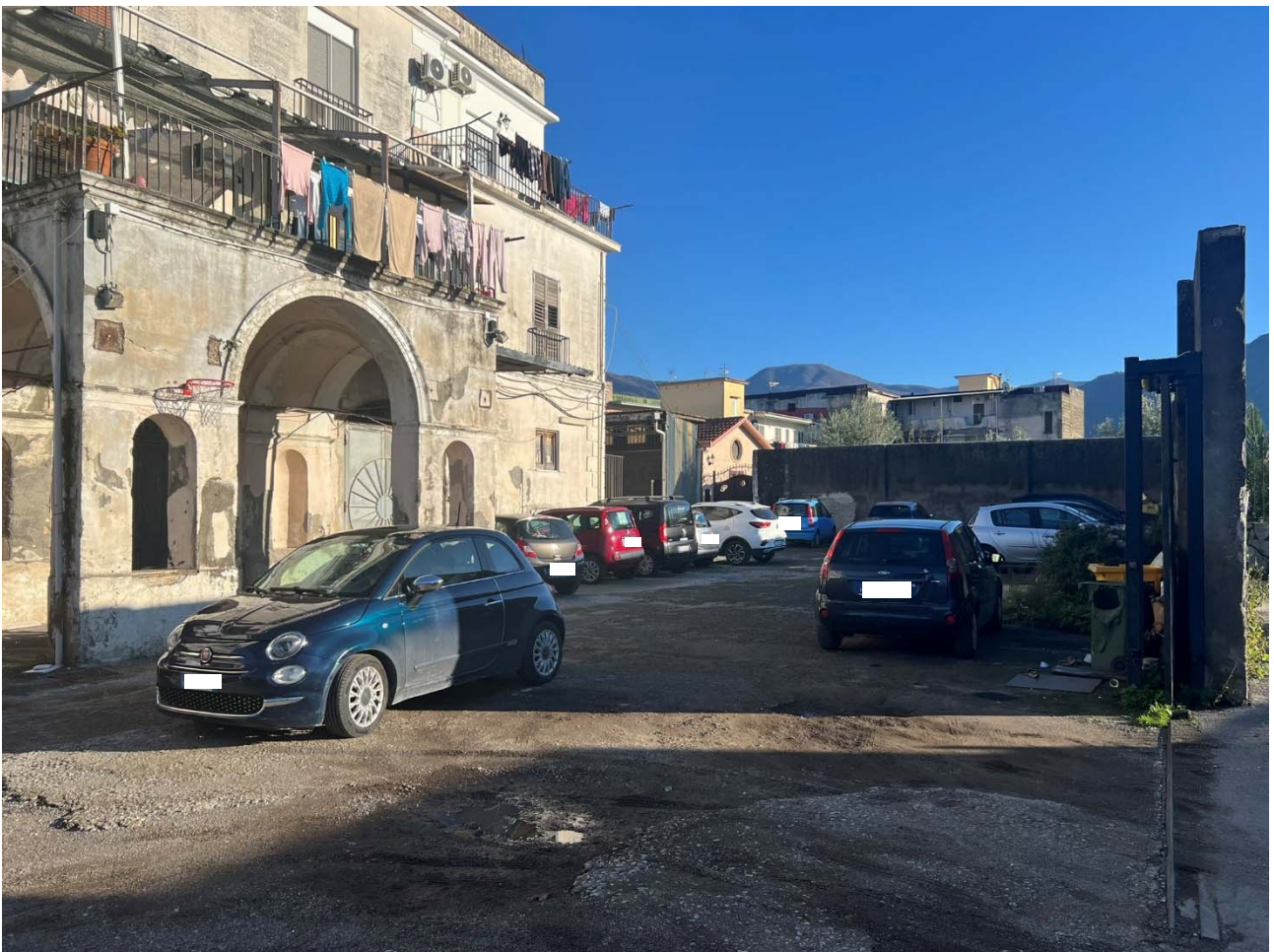
Foto 2 – Vista dell'area cortilizia comune che disimpegna il fabbricato e il piccolo compendio staggiato, posto a sud del complesso