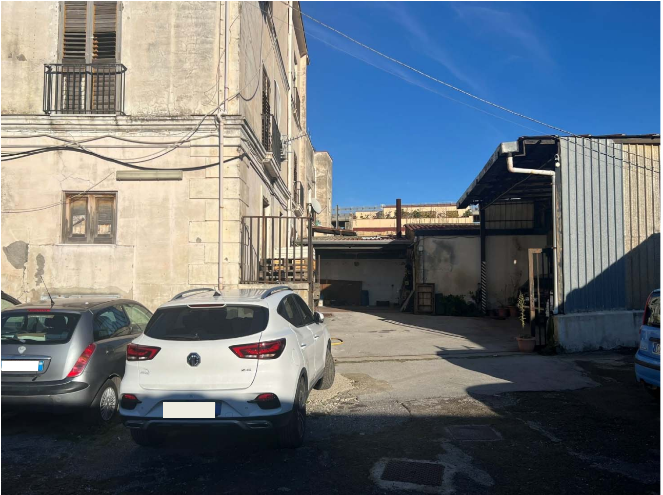
Foto 3 – Vista dell'accesso dall'area cortilizia comune al compendio staggitto