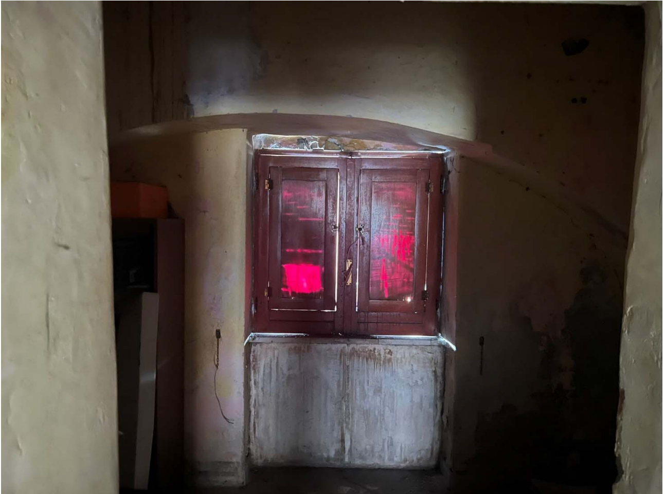
Foto 12 – Vista interna dell'unità p.la 25-sub 11: dettaglio del piccolo locale sul fondo del secondo ambiente