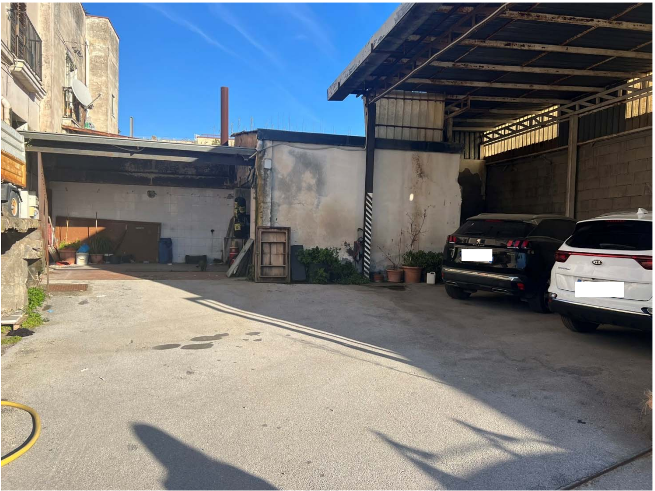
Foto 13 – Vista dell'area cortilizia e dell'area depositi – p.lla 1075