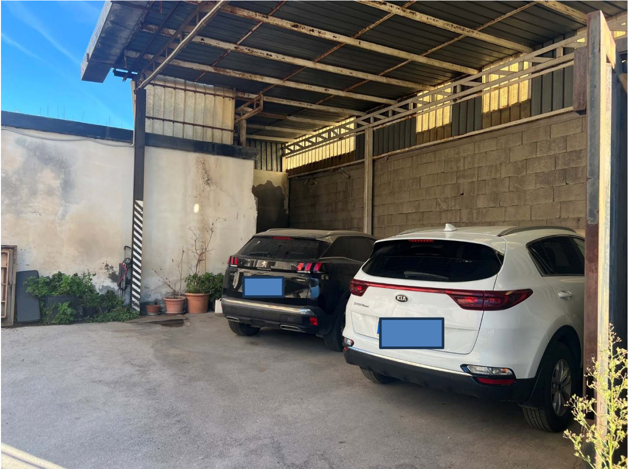
Foto 18 – Vista dell'area di corte coperta da tettoia metallica – p.lla 1075