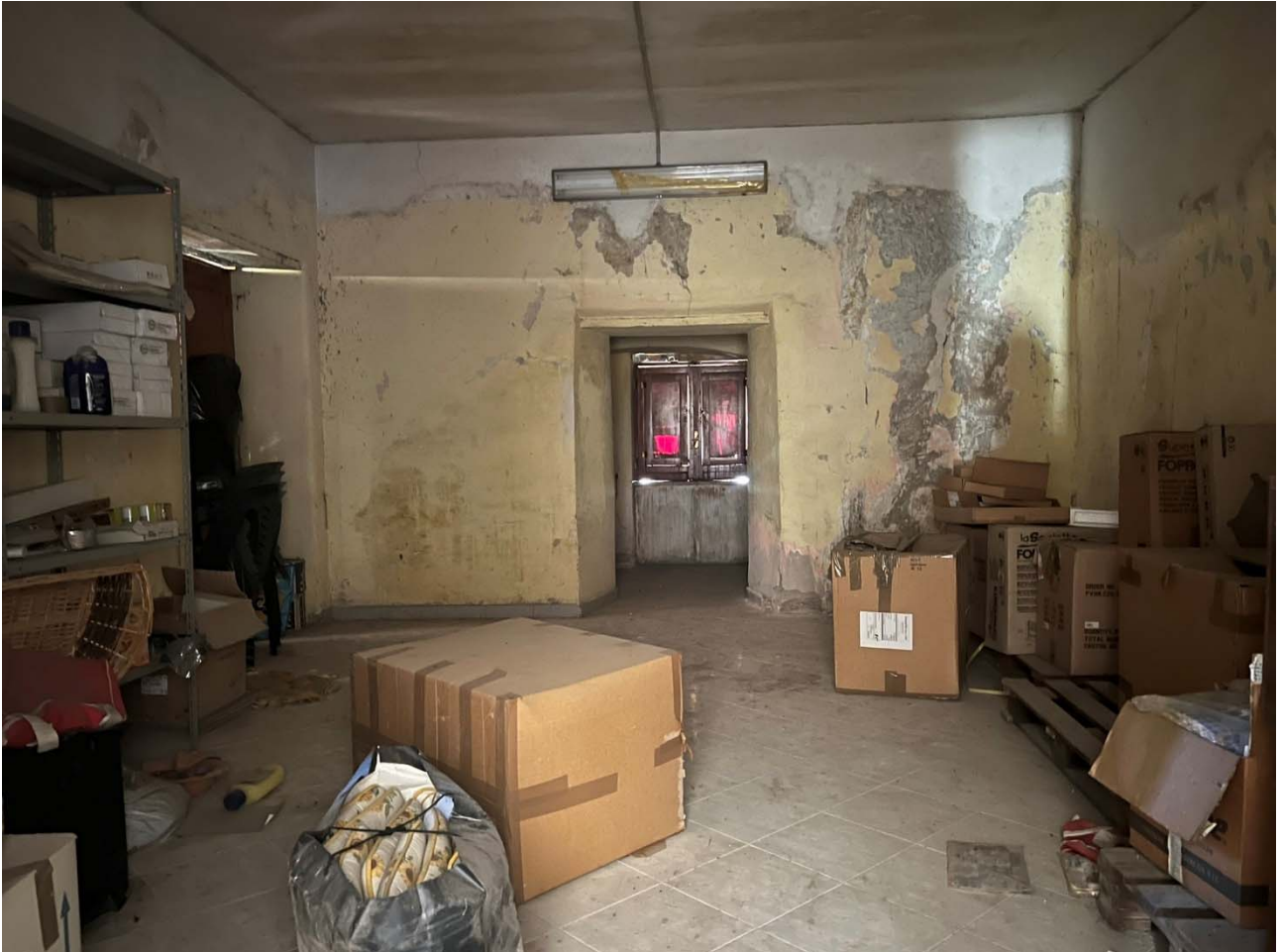
Foto 10 – Vista interna dell'unità p.la 25-sub 11: dettaglio del secondo ambiente