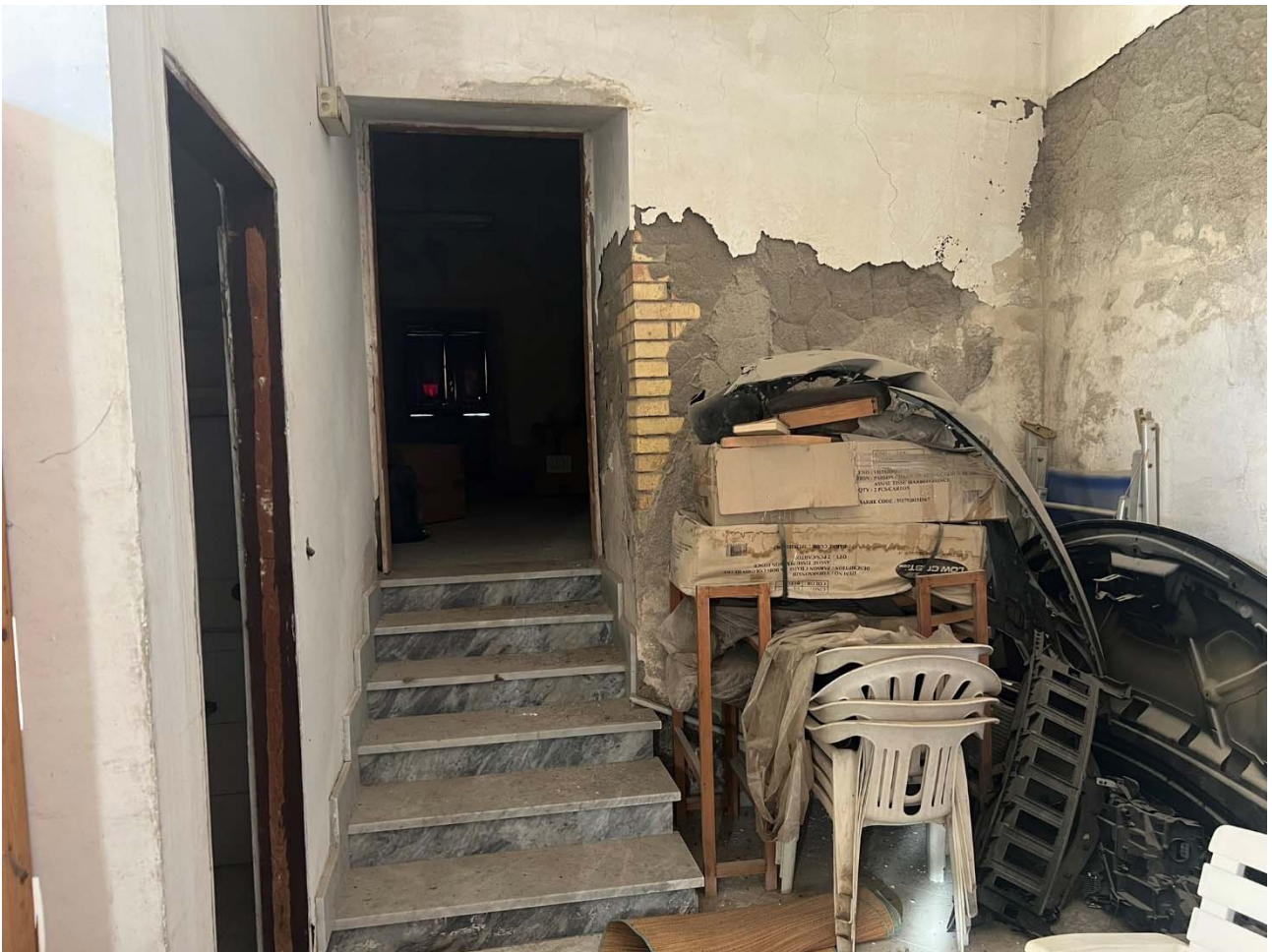
Foto 7 – Vista interna dell'unità p.la 25-sub 11: dettaglio della scala che copre il dislivello interno