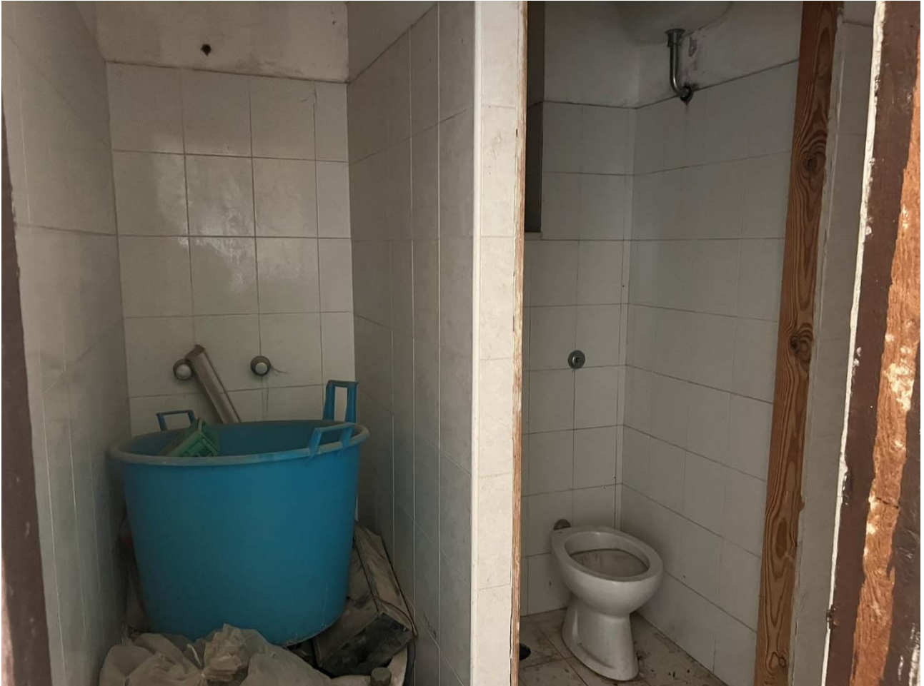
Foto 8 – Vista interna dell'unità p.la 25-sub 11: dettaglio dell'unico servizio