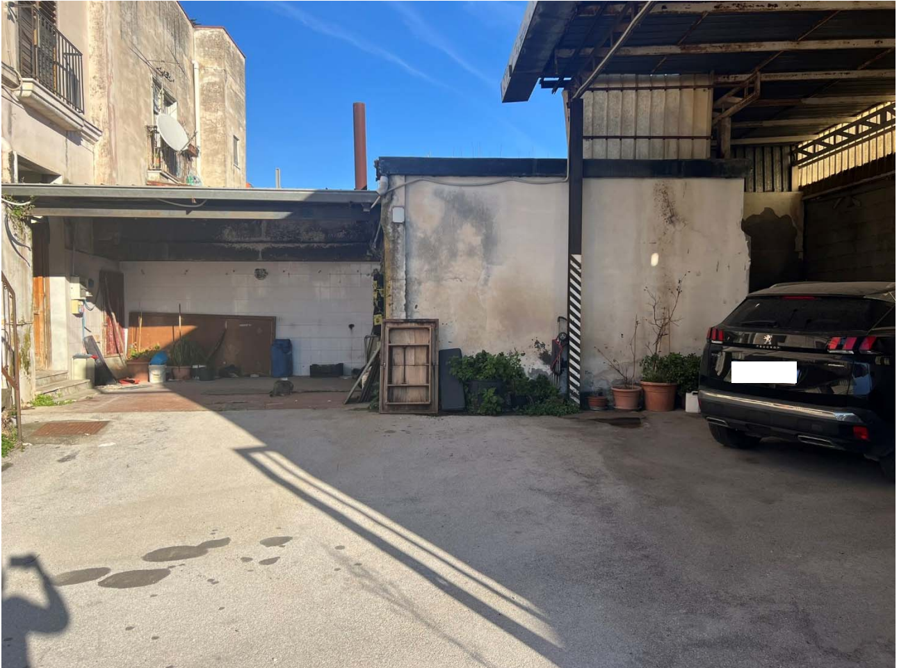
Foto 14 – Vista dell'area cortilizia e dell'area depositi – p.lla 1075