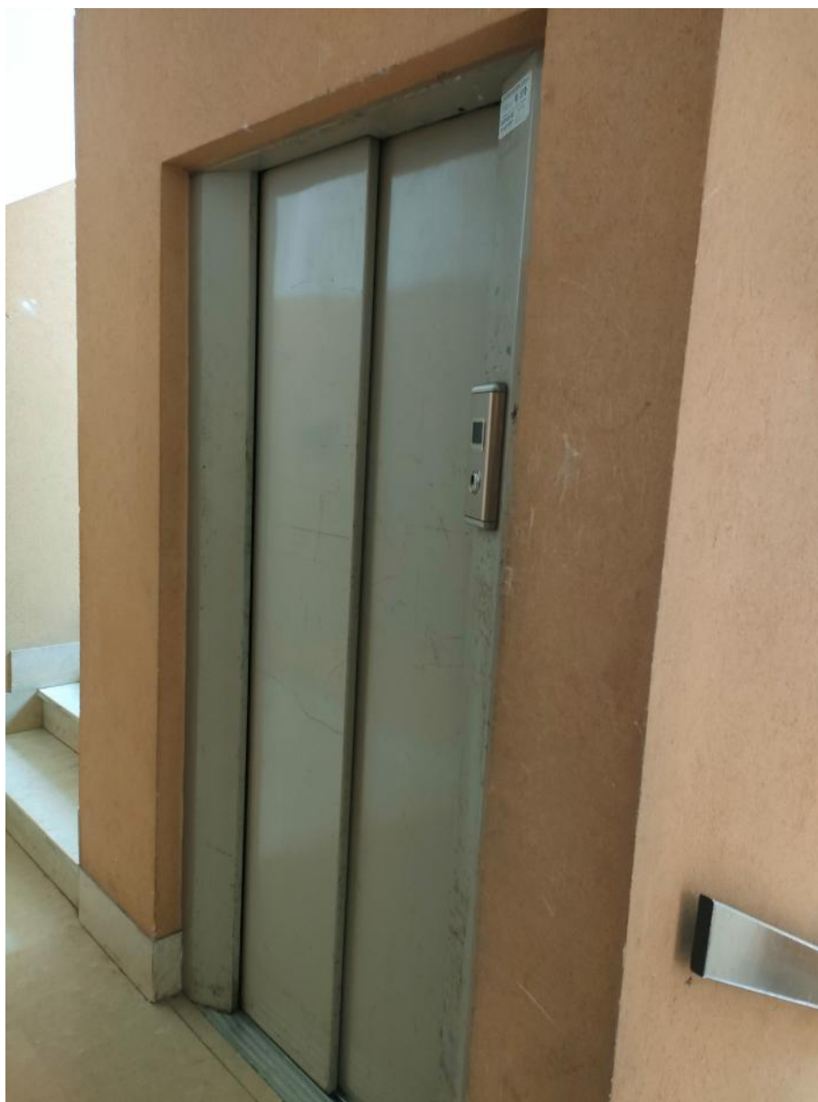
Vano scala ed Ascensore condominiale