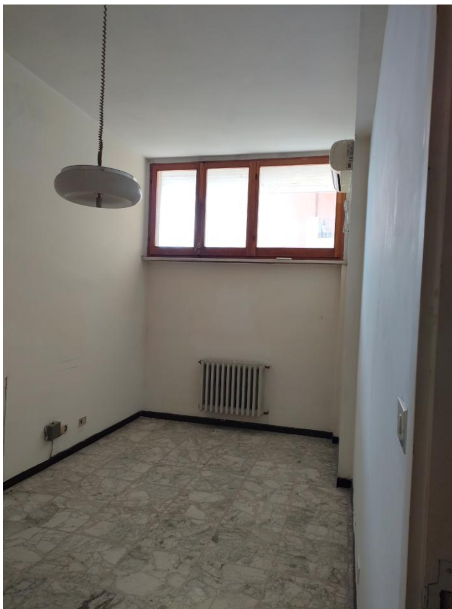
Vista interna destinazione studio professionale 3