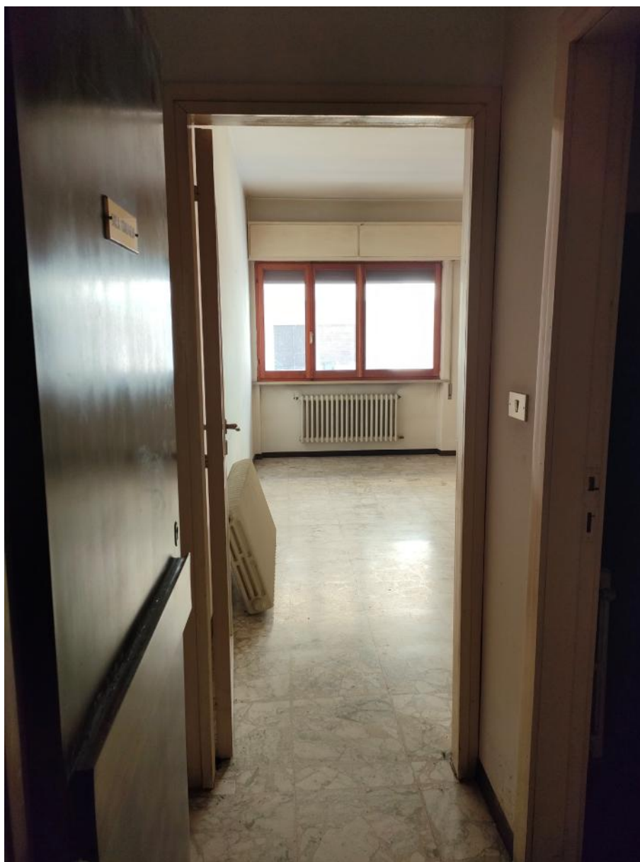
Vista interna destinazione studio professionale 2