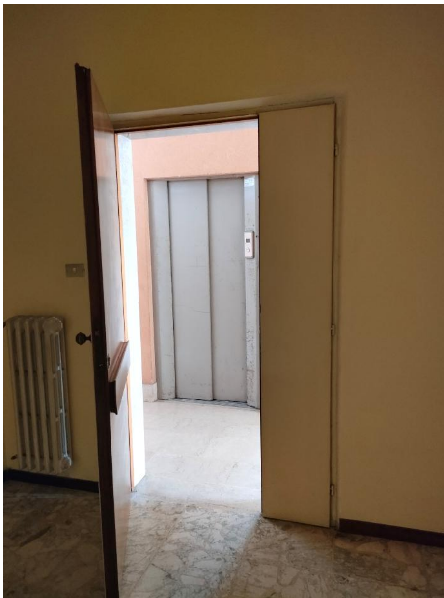
Vista Ingresso all'unità immobiliare composta da n. 3 piccoli uffici con servizi