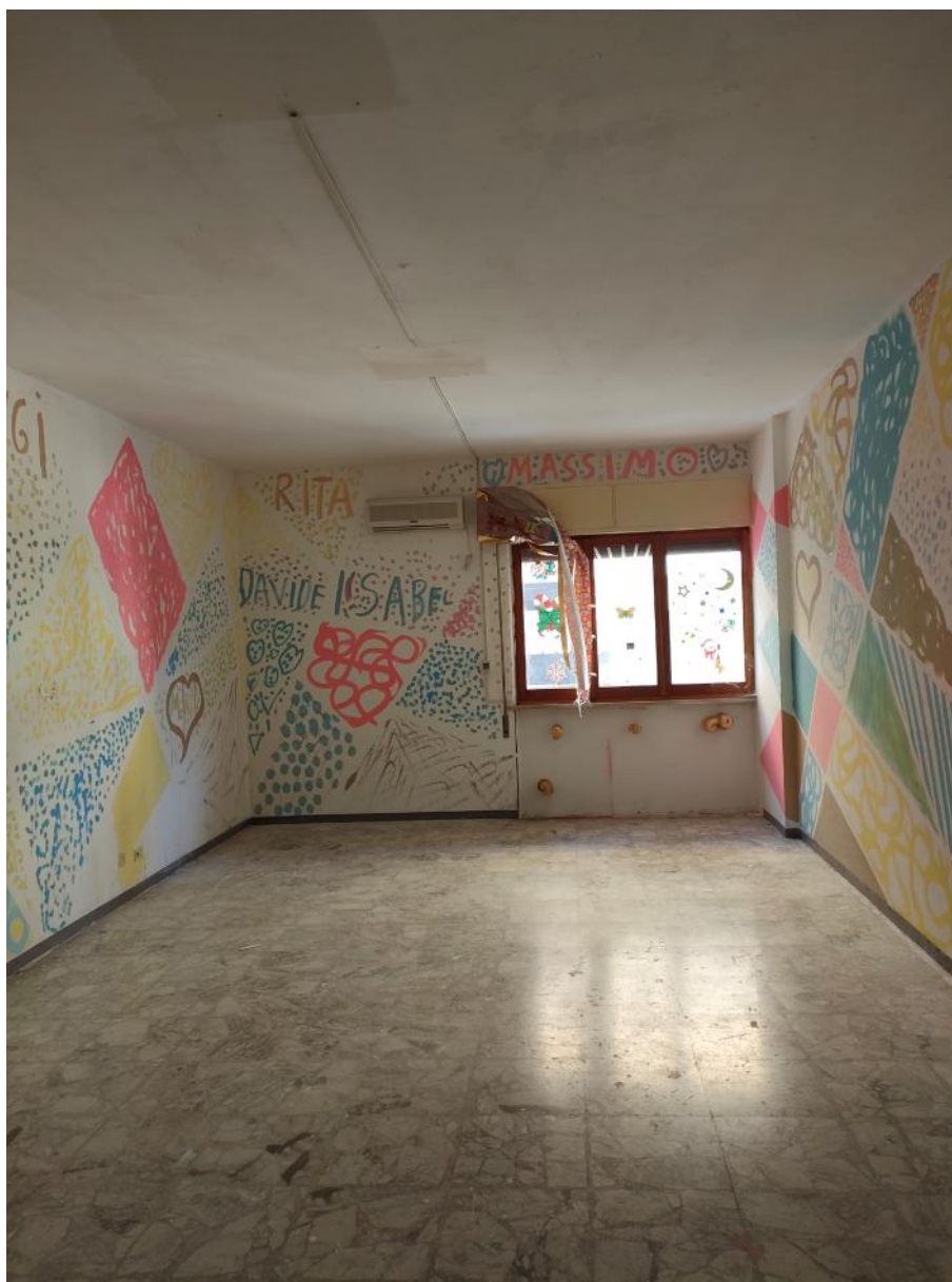
Vista interna destinazione studio professionale 1