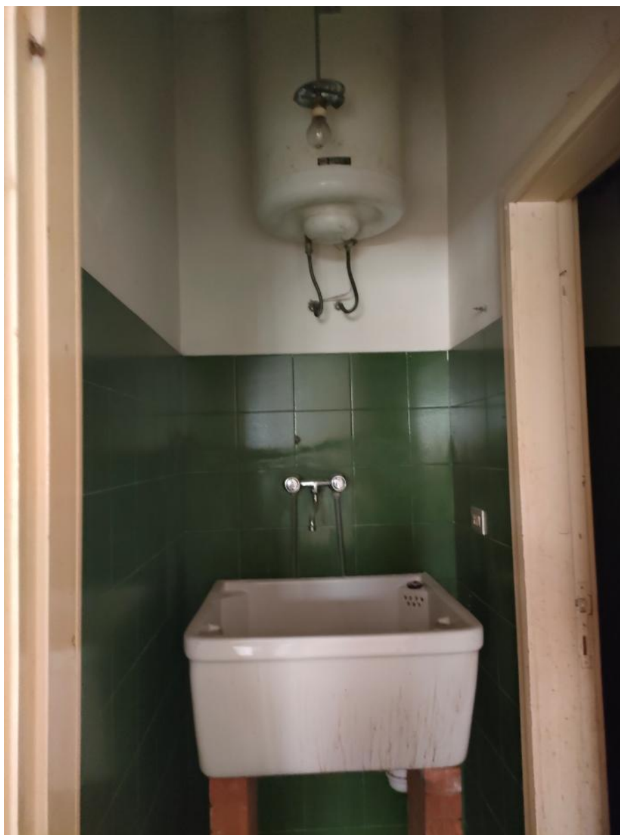
Vista Antibagno con boiler acqua calda