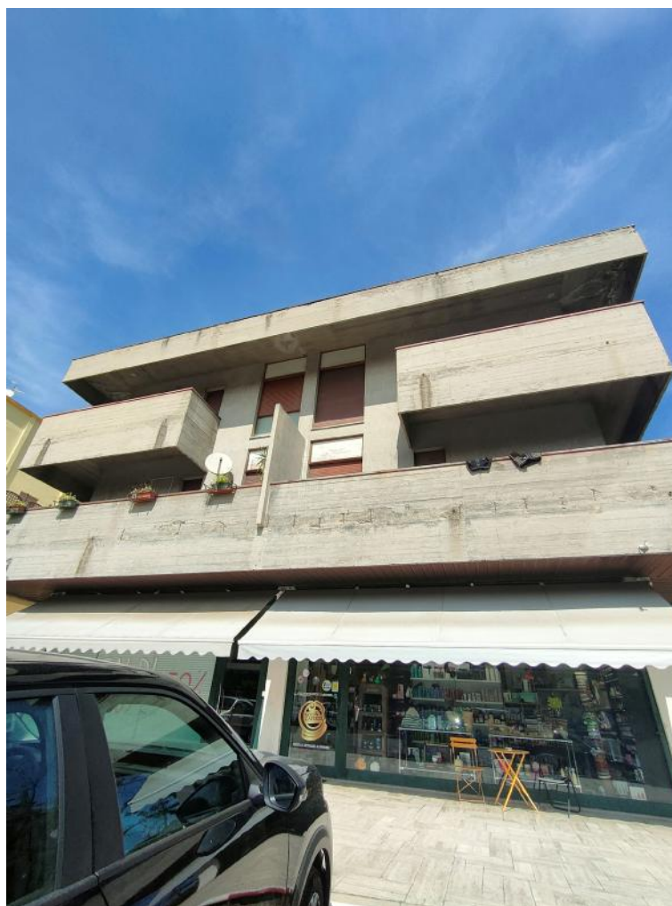
Vista Esterna della palazzina con ingresso da Via Circonvallazione Ragusa n. 49

Unità immobiliare composta da n. 3 uffici con servizi siti a Teramo in Via Circonvallazione Ragusa n. 49