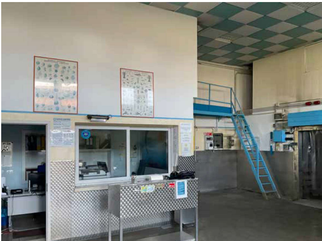
foto 04 - vista interna laboratorio zona vendita