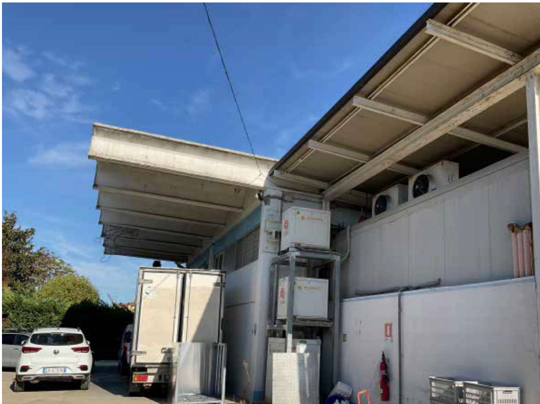
foto 02 - vista esterna laboratorio