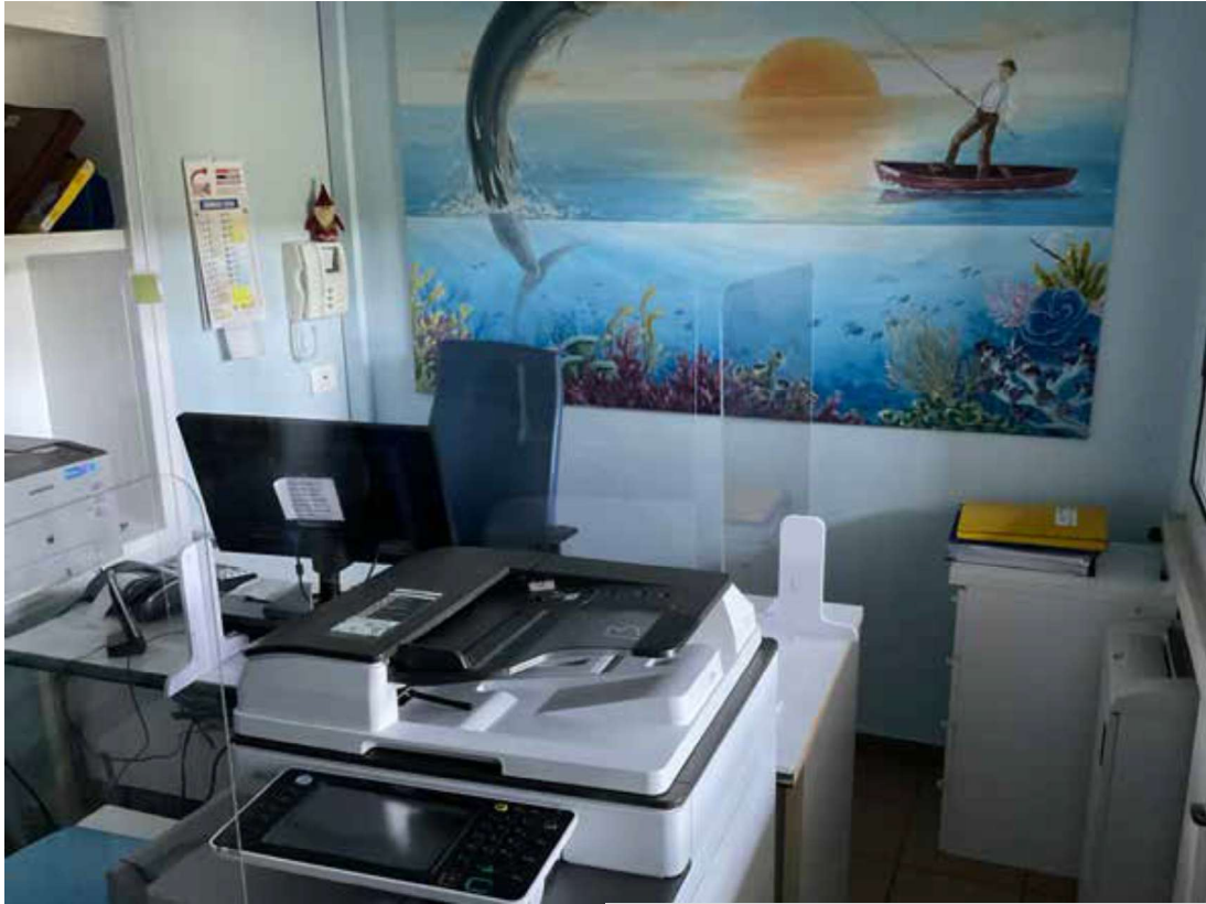
foto 07 - vista interna laboratorio zona ufficio