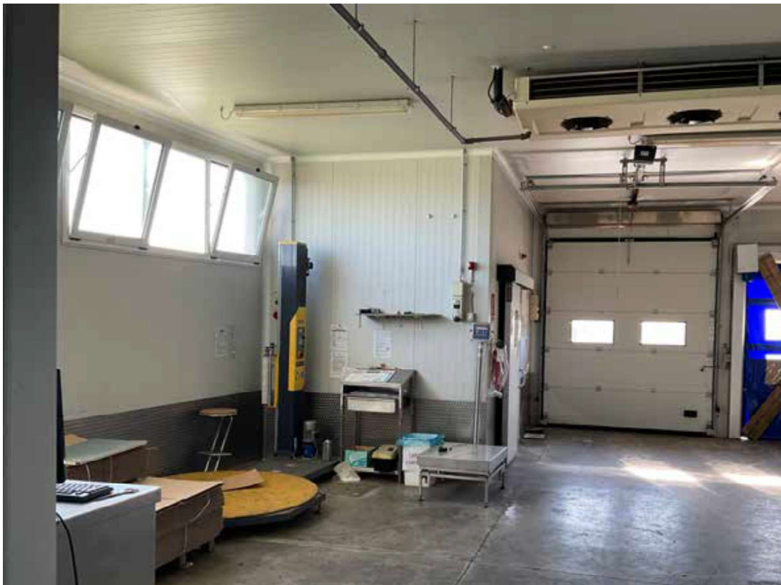
foto 10 - vista interna laboratorio zona carico