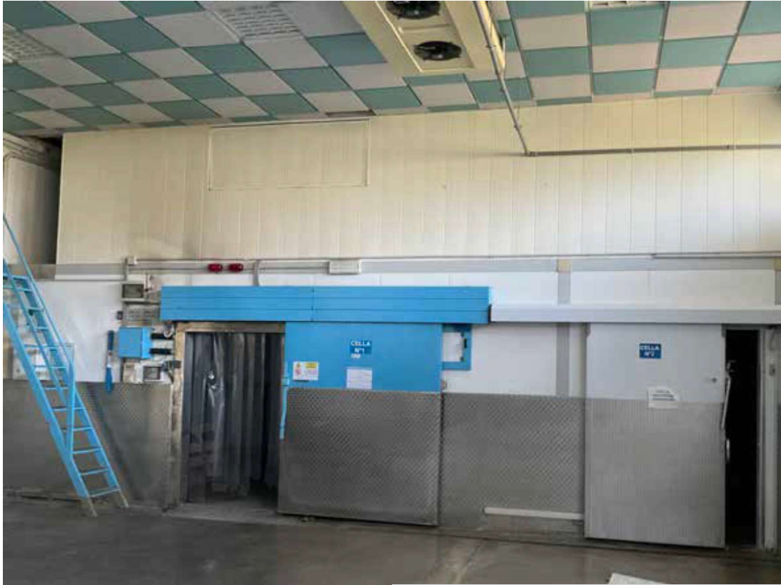
foto 05 - vista interna laboratorio zona vendita