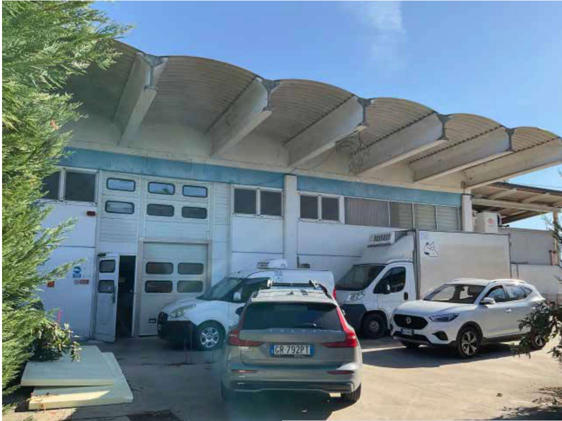
foto 01 - vista esterna laboratorio