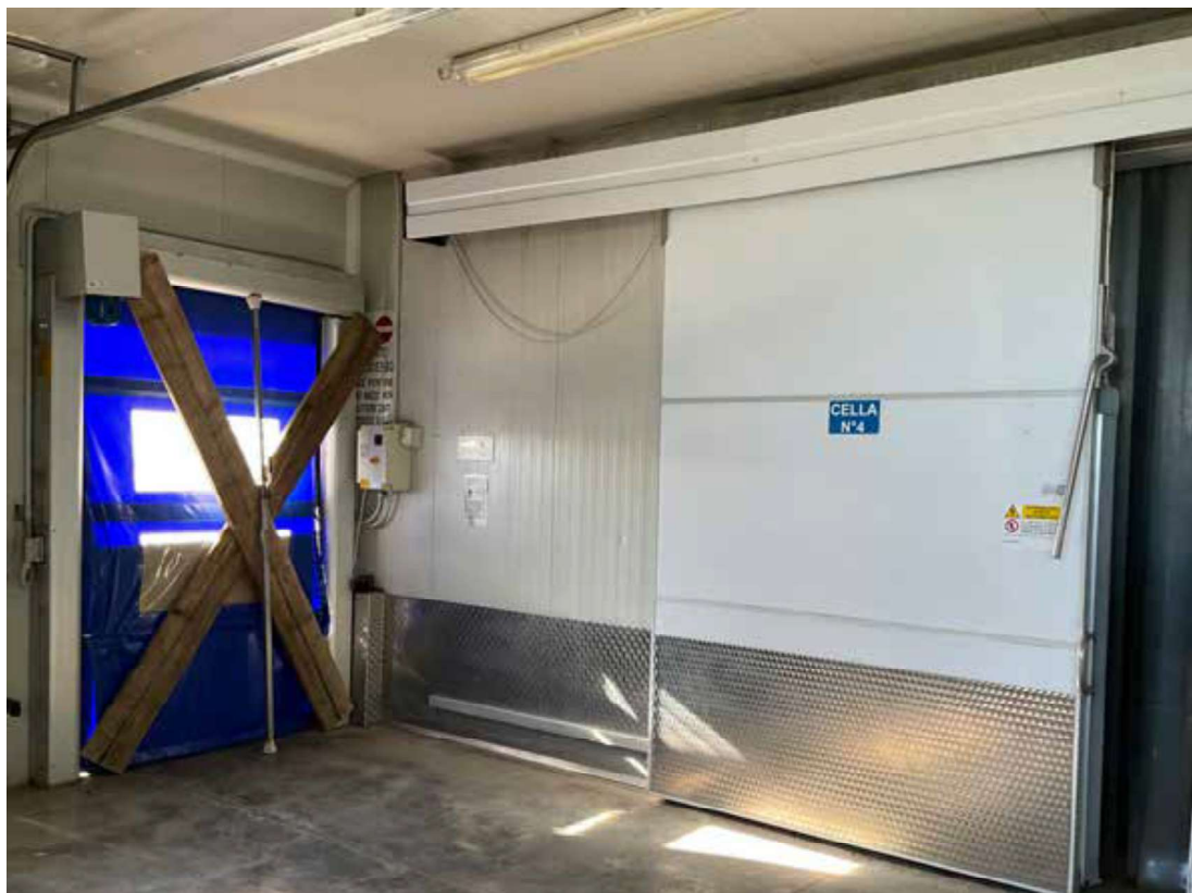
foto 12 - vista interna laboratorio zona carico