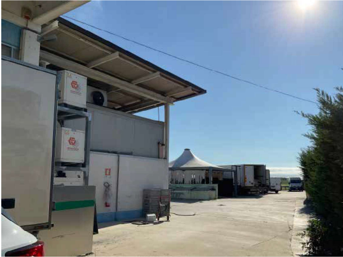
foto 03 - vista esterna laboratorio