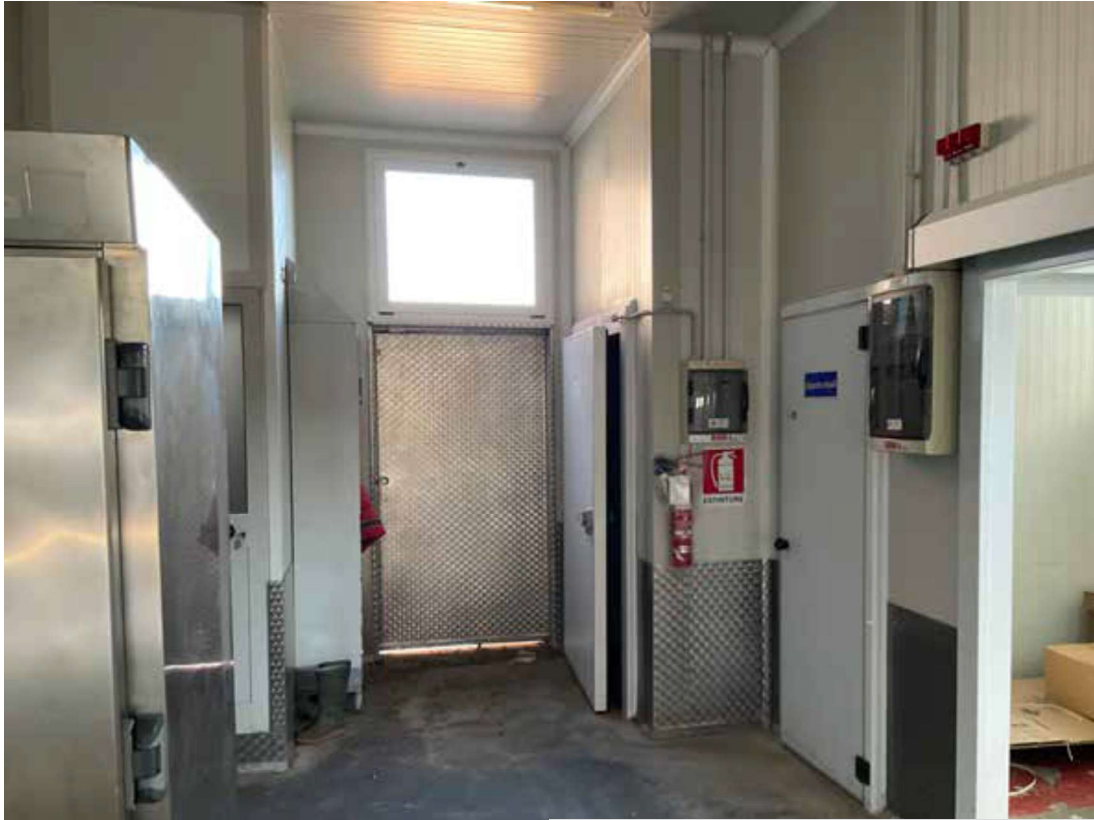
foto 09 - vista interna laboratorio