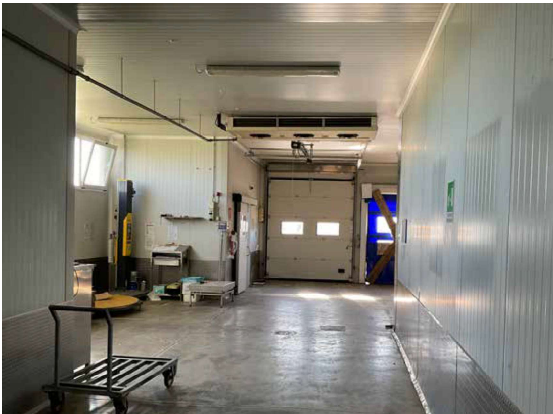
foto 08 - vista interna laboratorio zona carico