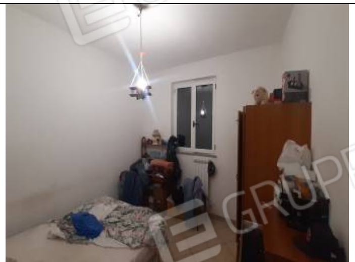
Abitazione al foglio n° 32, particella n° 236, sub. 2