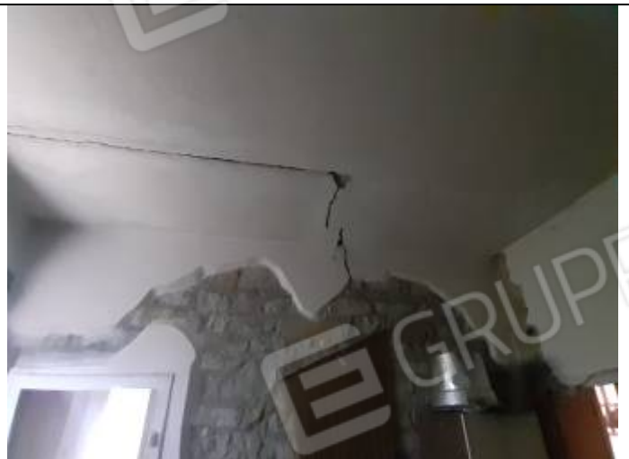
Deposito al foglio n° 32, particella n° 238, sub. 1