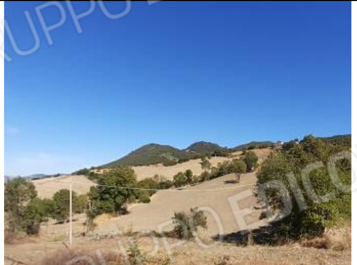
Terreno al foglio n° 32 particella n° 106