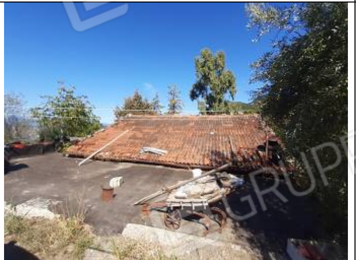
Depositi al foglio n° 32, particella n° 235, sub. 2 e 3