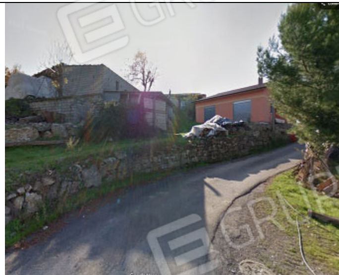
Fondo agricolo al foglio n° 32 con annessi fabbricati