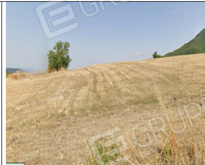
Fondo al foglio n° 31 particelle n° 32, 33 e 35