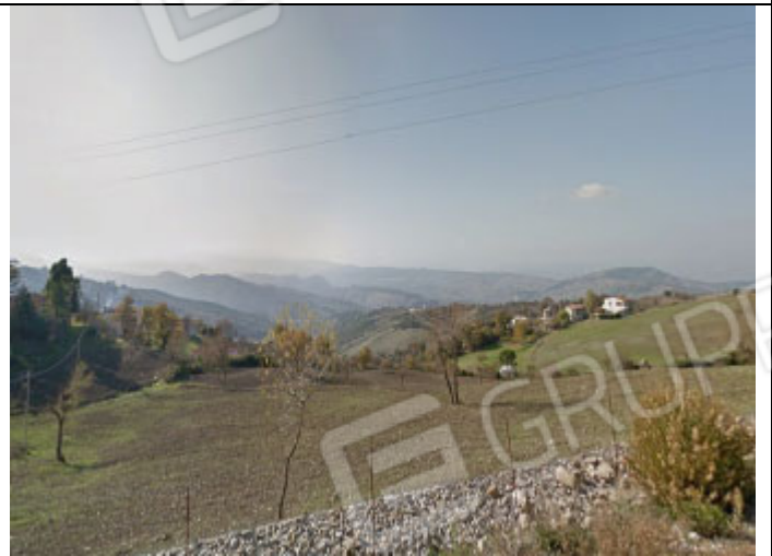
Terreni al foglio n° 32 particelle n° 83, 99, 101, 118, 215, 217, 218, 234, 239