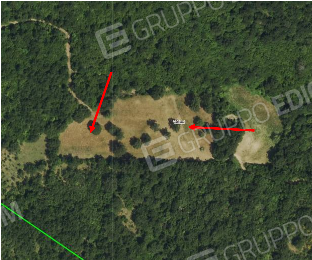
VISTA AEREA DEI LOTTI