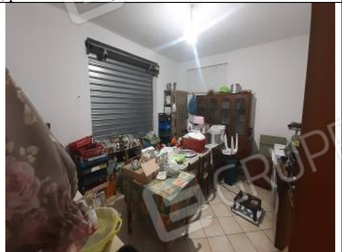
Deposito al foglio n° 32, particella n° 236, sub. 3