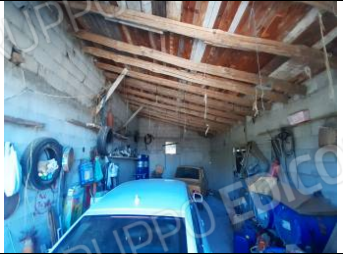
Deposito al foglio n° 32, particella n° 237, sub. 1