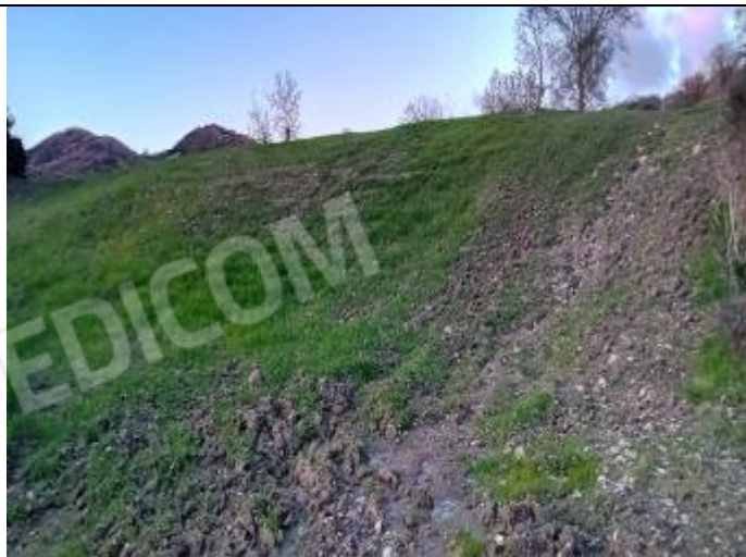
LOTTO 006 - Particella n° 6 del foglio n° 34