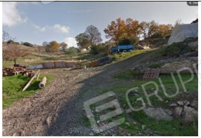
Terreni al foglio n° 32 particelle n° 103 e 105