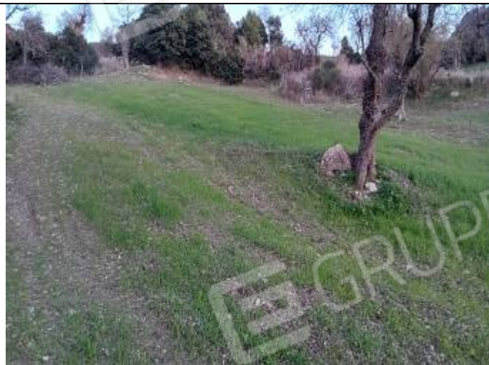
LOTTO 07 - Particella n° 11 del foglio n° 34