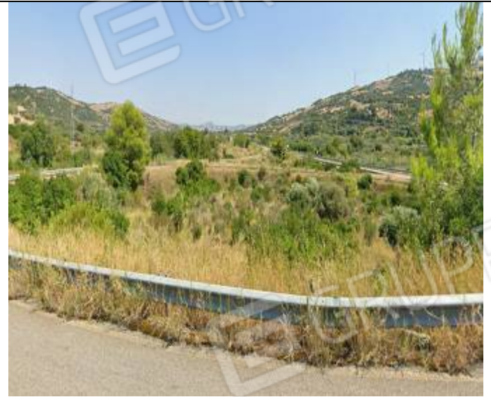
Fondo al foglio n° 6 particella n° 133