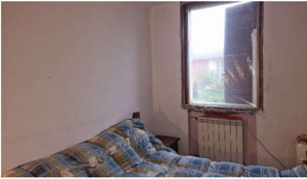
14. Camera da letto P1