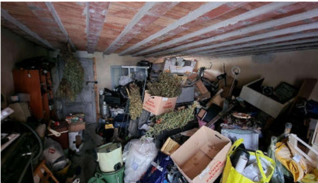
8. Rustico - interno