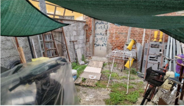
6. Corte esclusiva