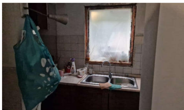
3. Angolo cottura