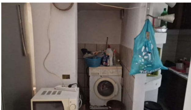
4. Ripostiglio sottoscala