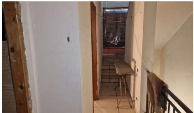
11. Disimpegno P1