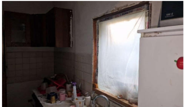
9. Particolare finestra mancante