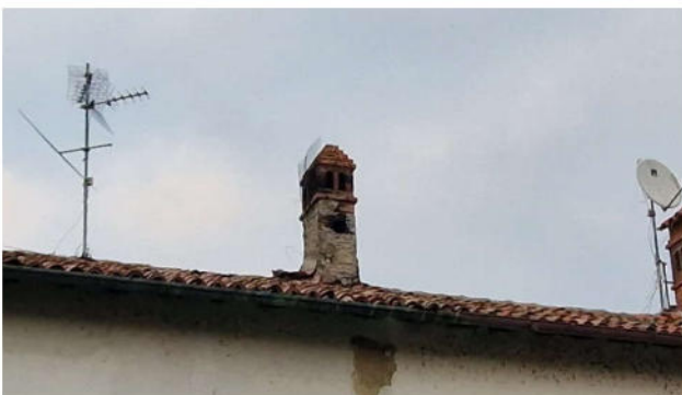
20. Particolare del comignolo pericolante