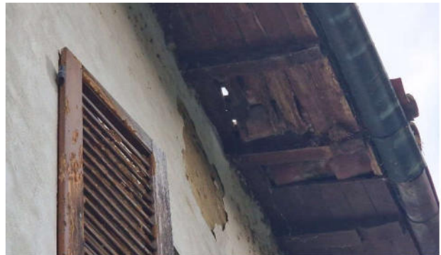
19. Particolare delle condizioni della copertura