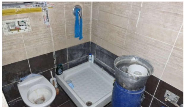
13. Bagno P1