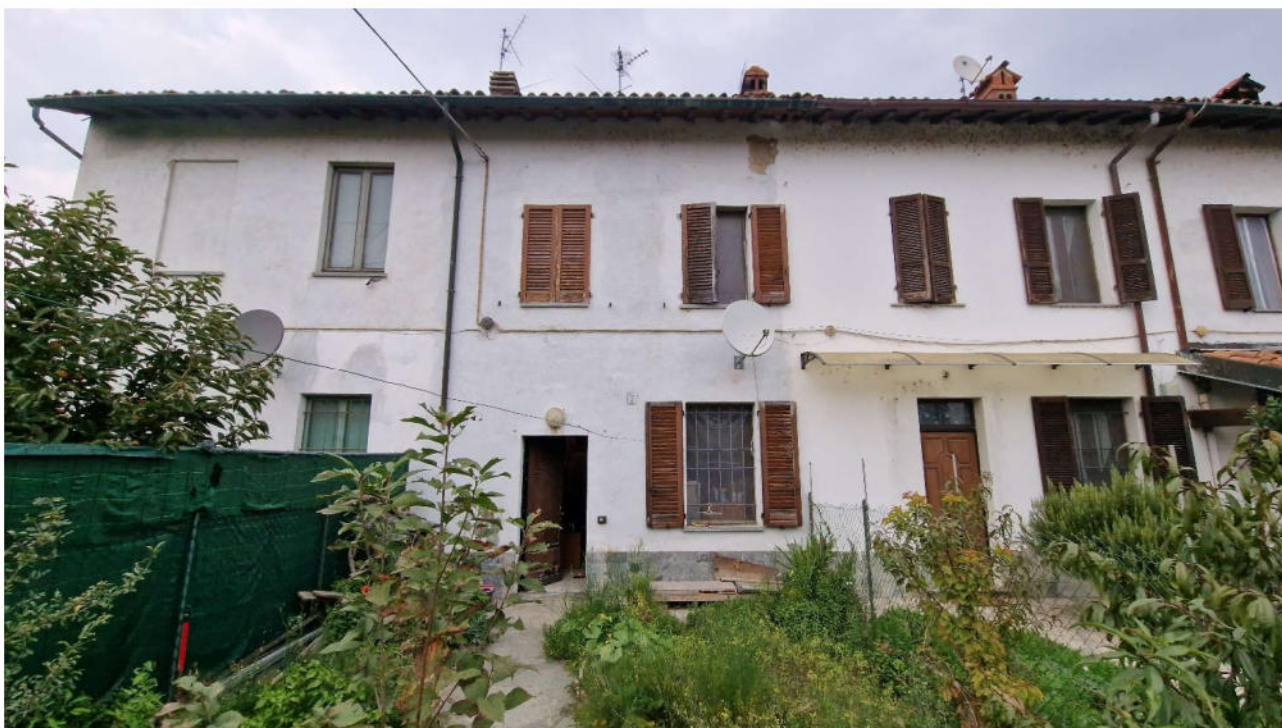
1. Veduta esterna del fabbricato