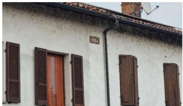
21. Particolare dei degradi del prospetto