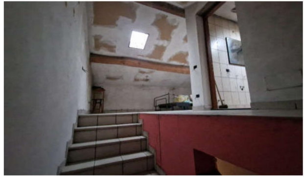
15. Accesso al piano secondo