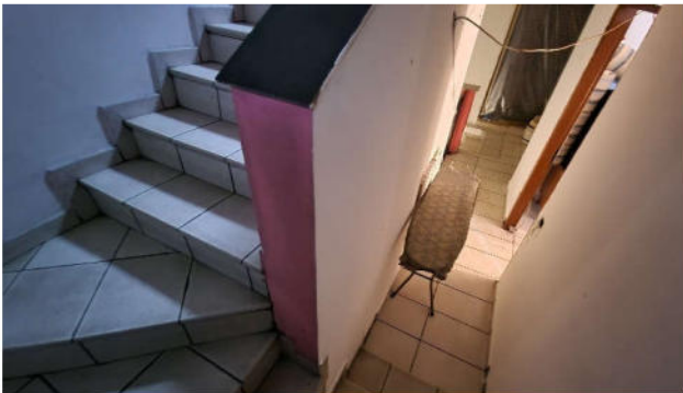
18. Corpo scala