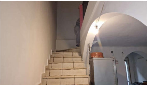
10. Accesso al piano primo