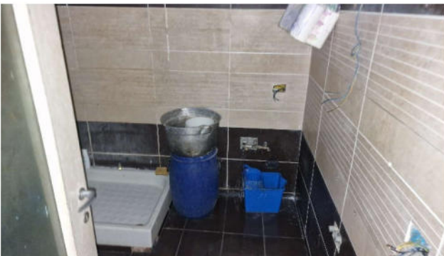
12. Bagno P1