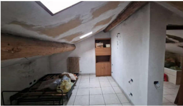
16. Mansarda P2