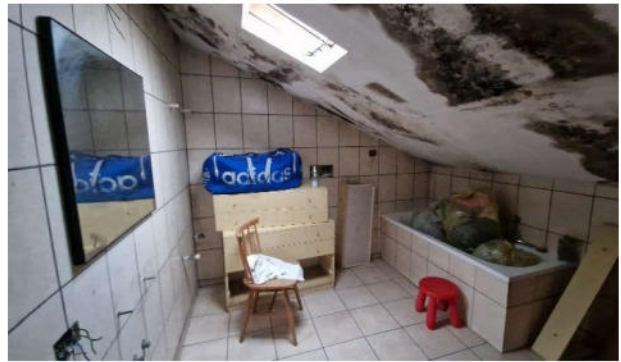
17. Bagno P2 con gravi infiltrazioni