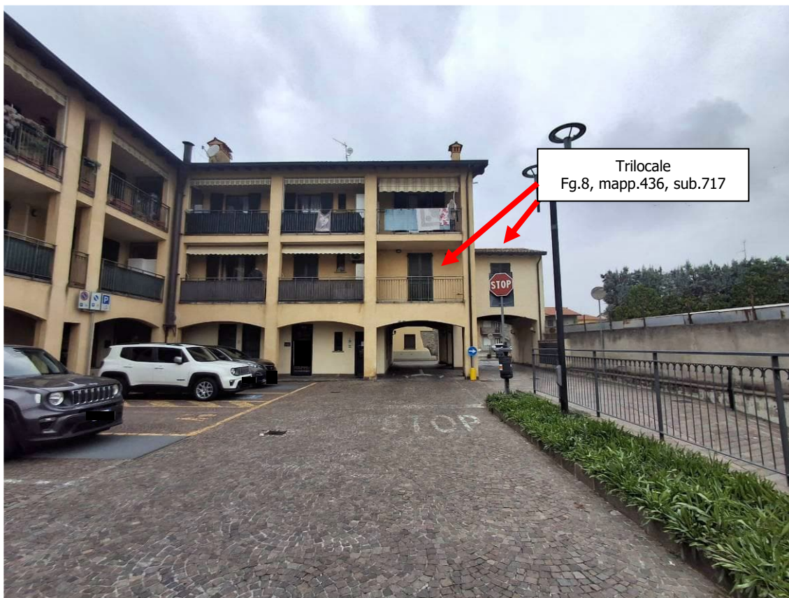
1) Veduta contesto edificio condominiale da corte interna