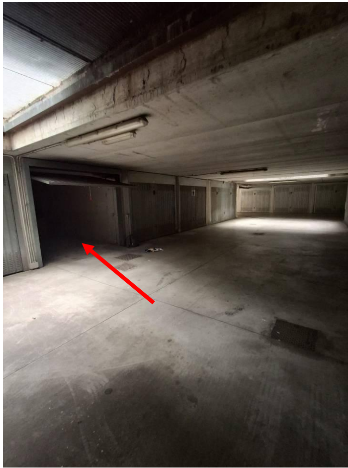
17) Corsello coperto autorimesse con autorimessa fg.8, mapp.436, sub.762