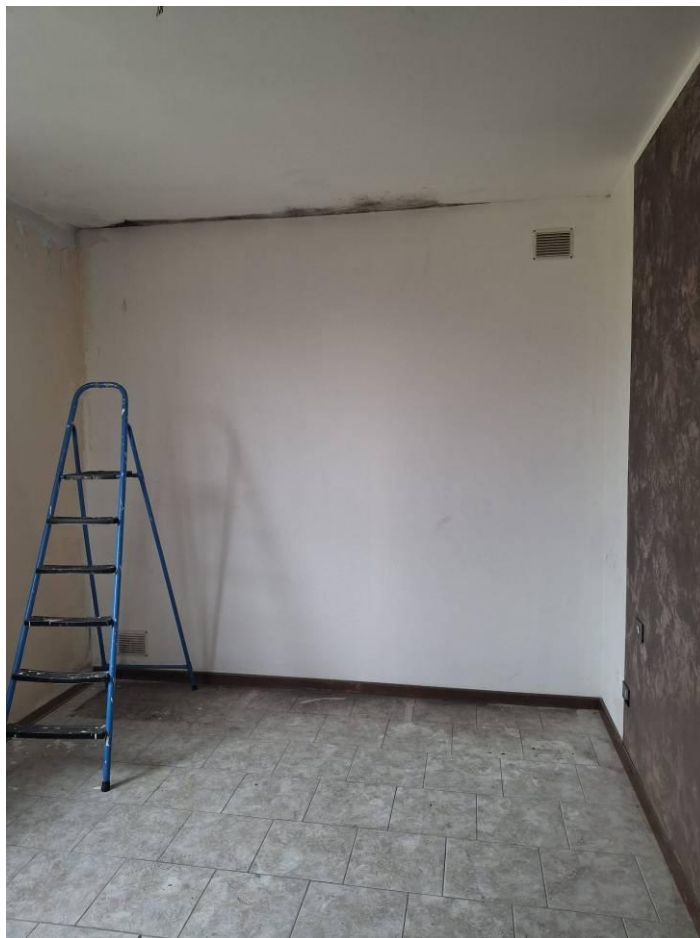
14) Camera 2 parete di fondo con griglie di areazione