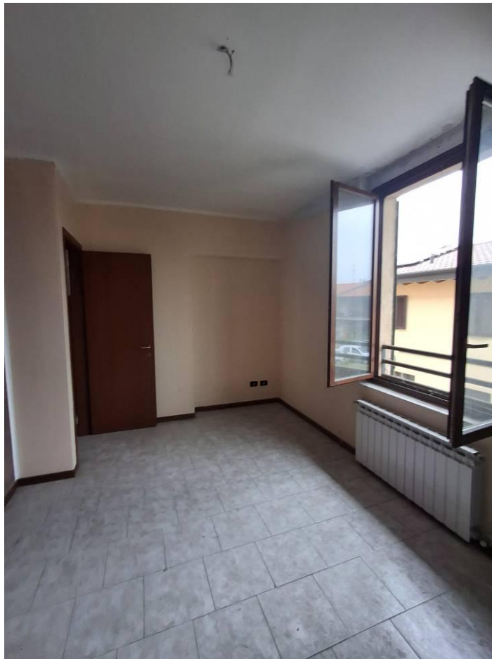
13) Camera 2