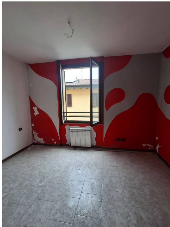
12) Camera 1