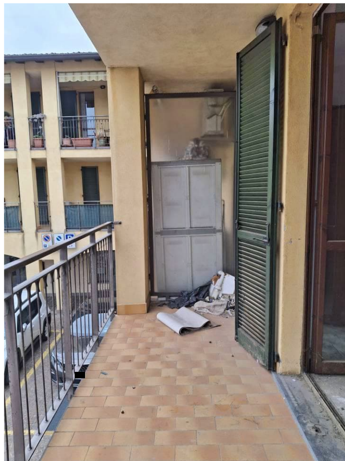
8) Veduta balcone