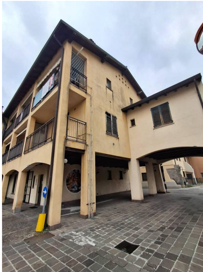
3) Particolare porzione in cui è inserita l'unità abitativa (piano 1°)