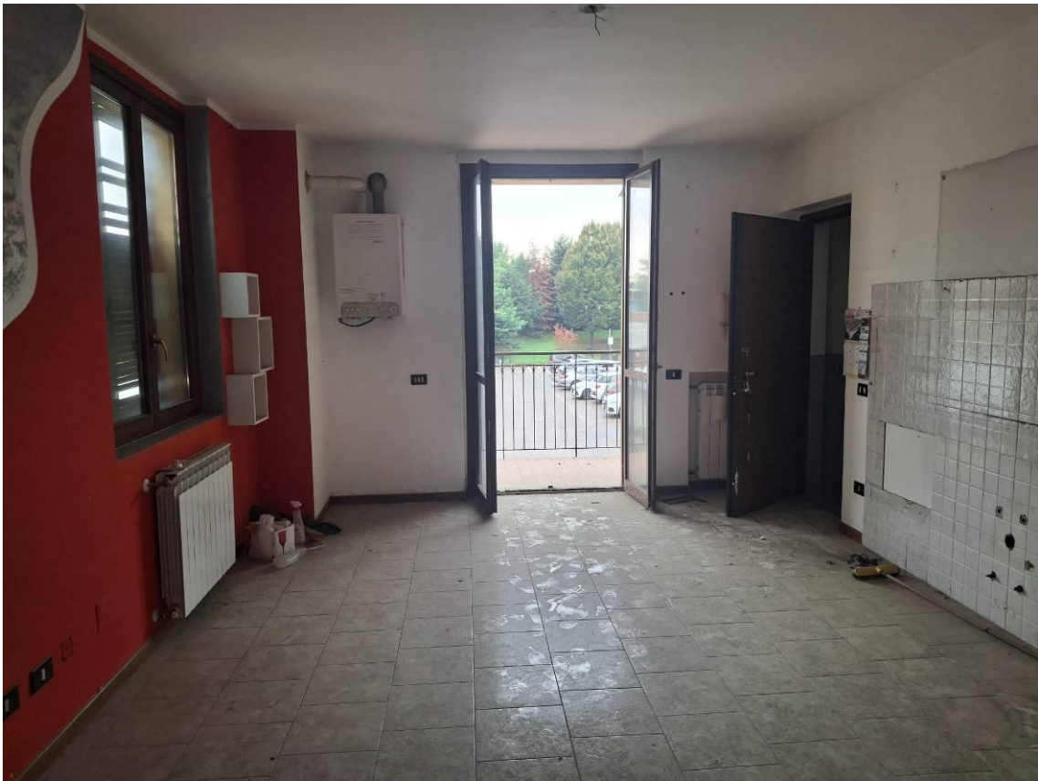
7) Veduta soggiorno