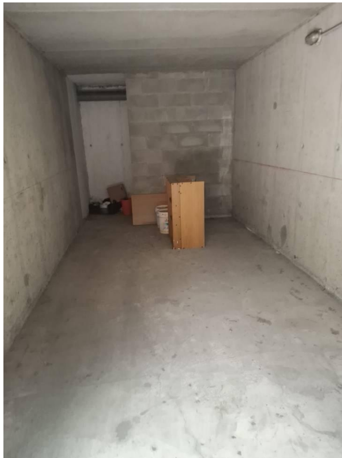
18) Veduta interna autorimessa fg.8, mapp.436, sub.762