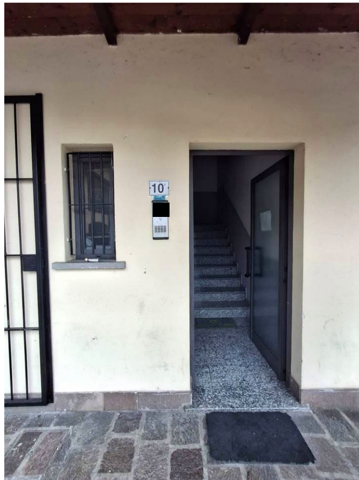
6) Veduta ingresso vano scale condominiale