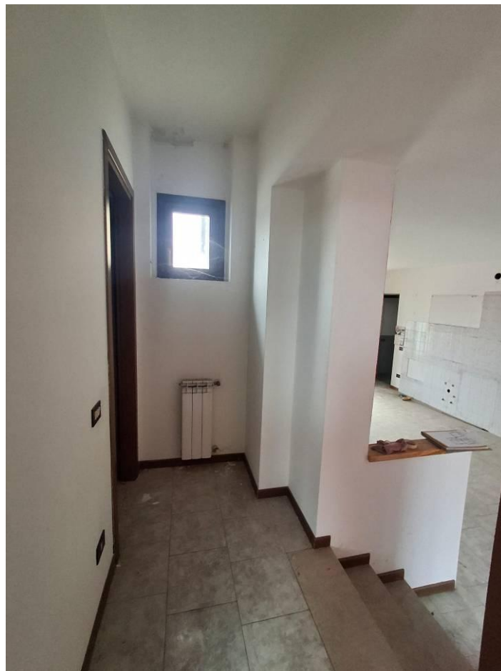
11) Disimpegno notte visto da camera 2