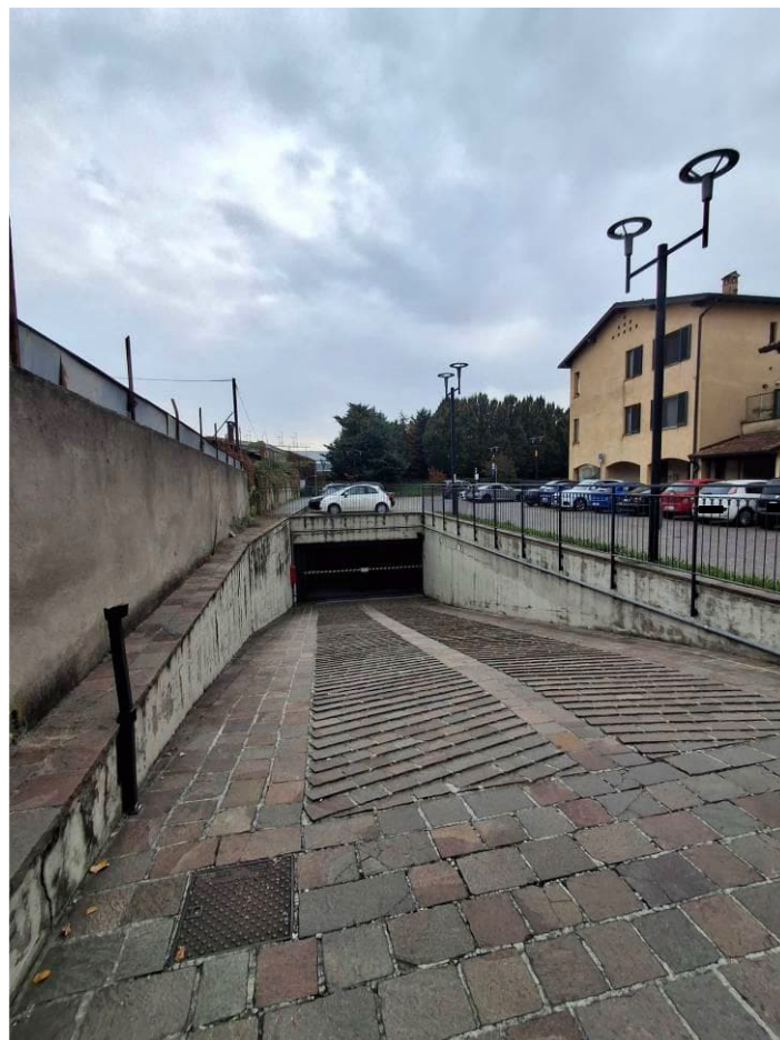
16) Rampa di accesso alle autorimesse