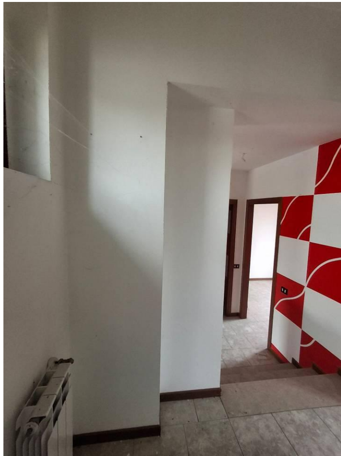
10) Disimpegno notte visto da zona bagno