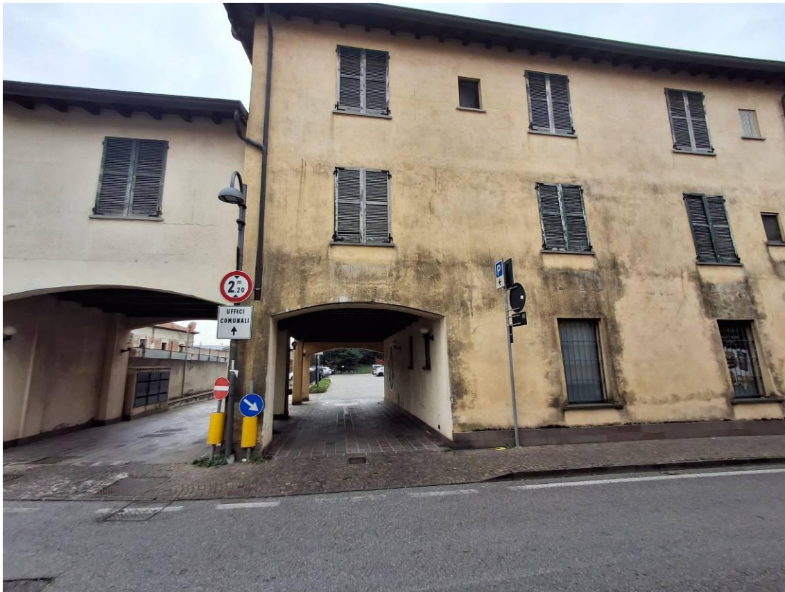
5) Veduta da via XXV Aprile