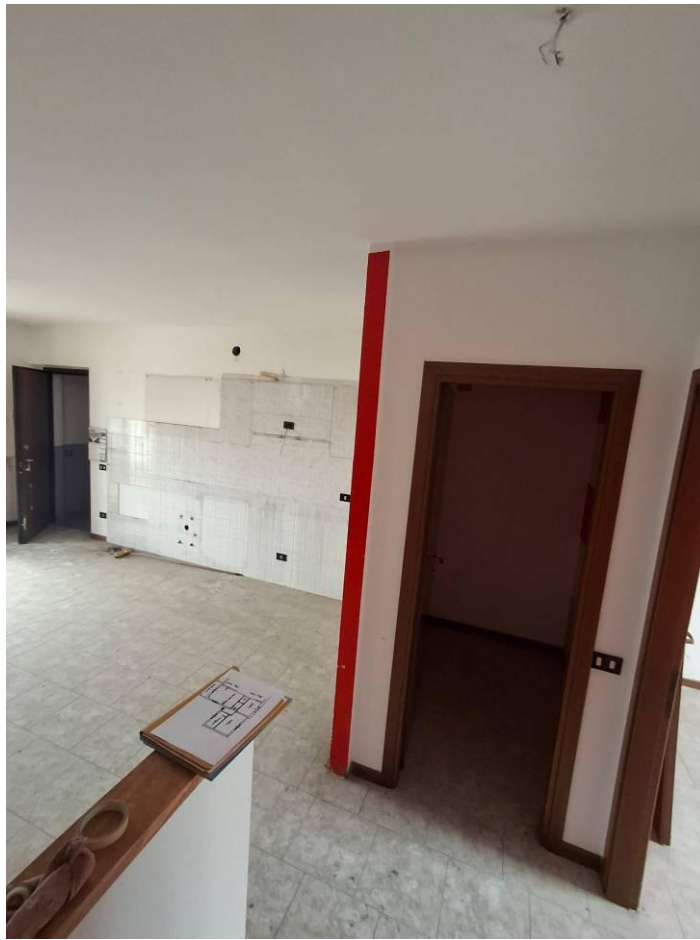
9) Veduta soggiorno e ripostiglio