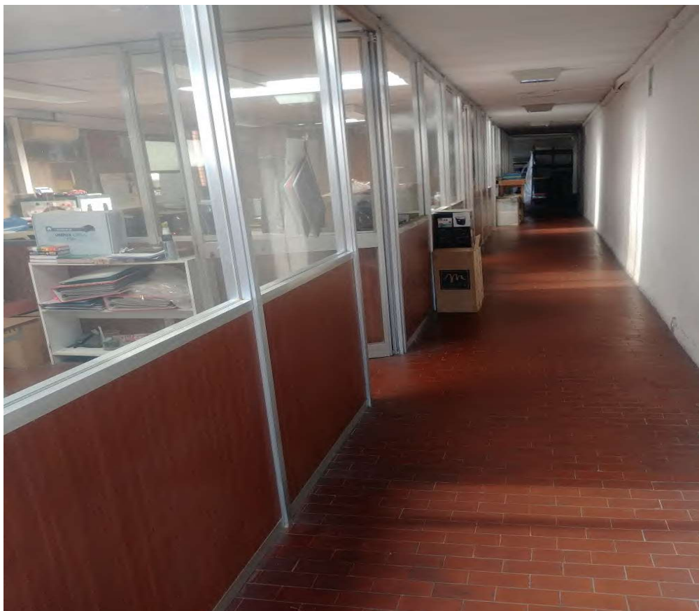
- Vista interna della zona uffici- 10