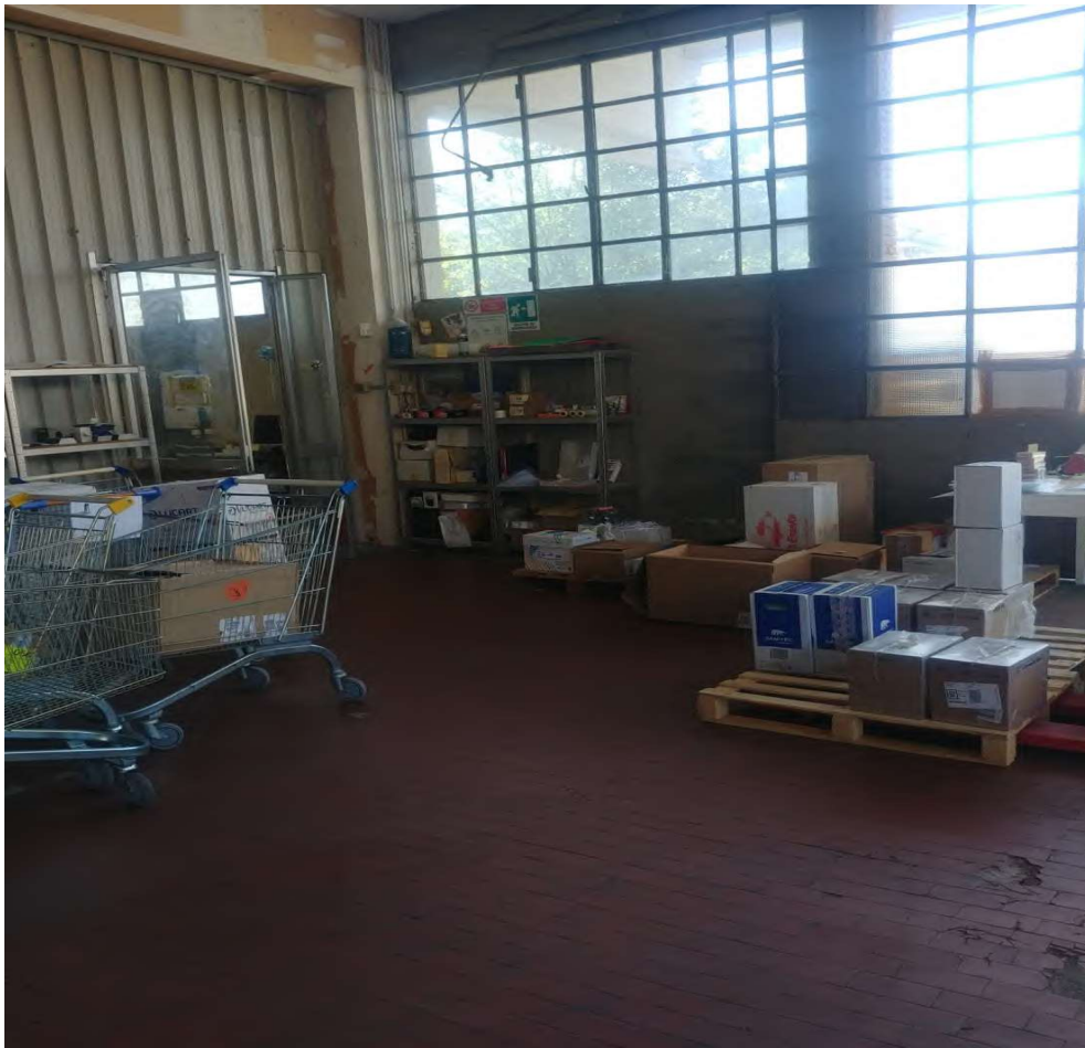
- Vista interna del magazzino deposito – 11