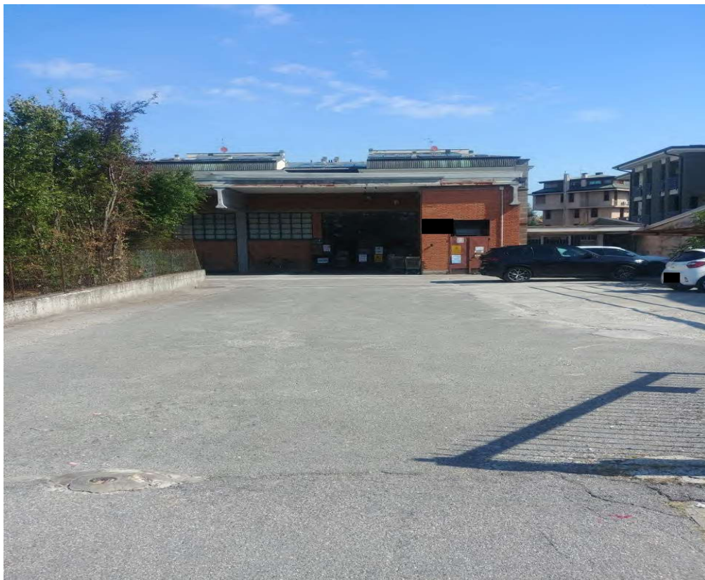
- Vista frontale dal cortile interno comune - 2