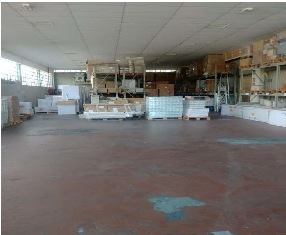
- Vista interna del magazzino deposito – 12