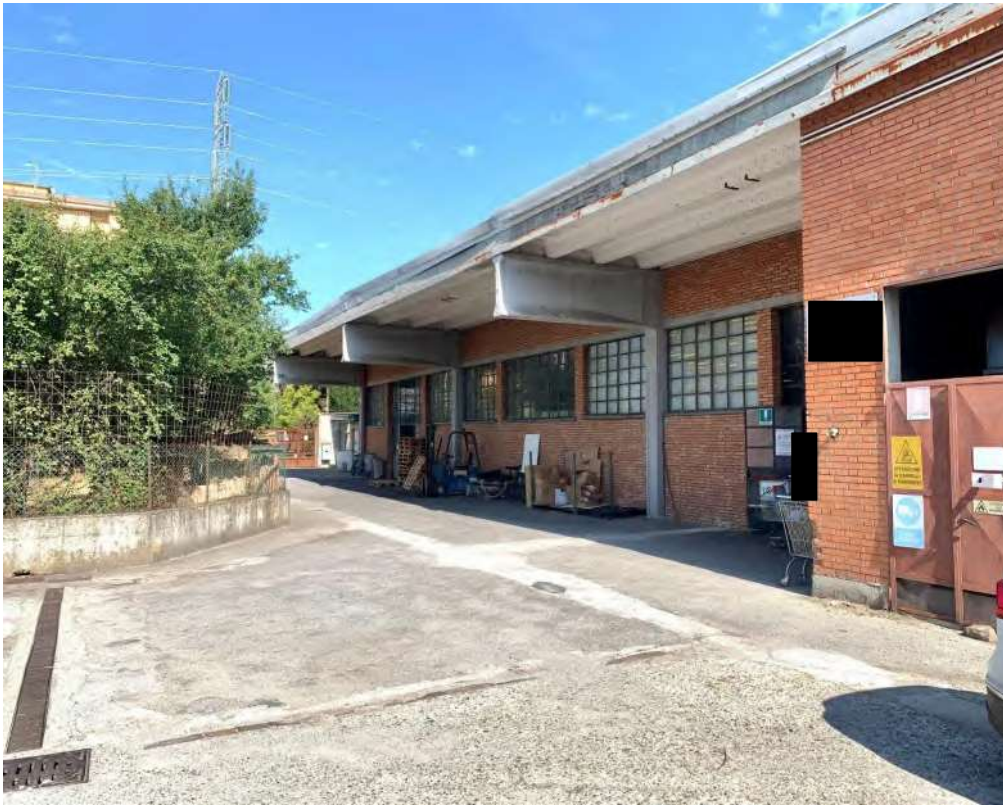
- Vista frontale dal cortile interno comune - 1

- Magazzino al piano terra con cortile e giardino comuni edificabili -