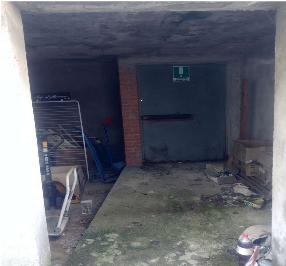
- Vista interna uscita di sicurezza - 8