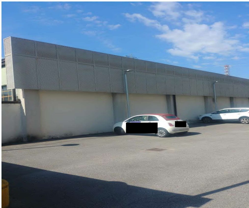
- Vista dal parcheggio a nord - 4