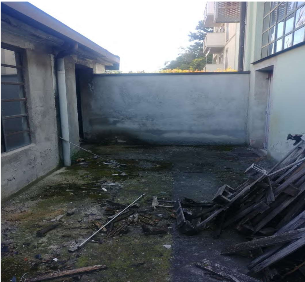
- Vista cortile comune uscita di sicurezza - 6