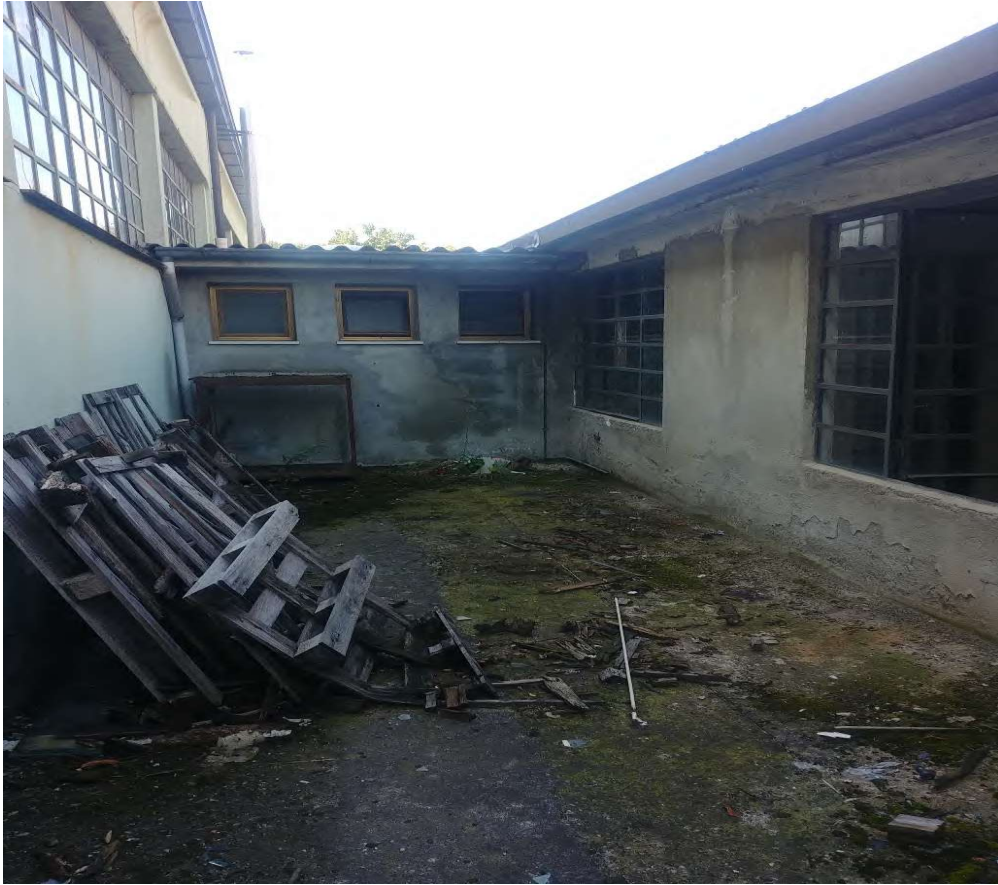
- Vista cortile comune uscita di sicurezza - 5