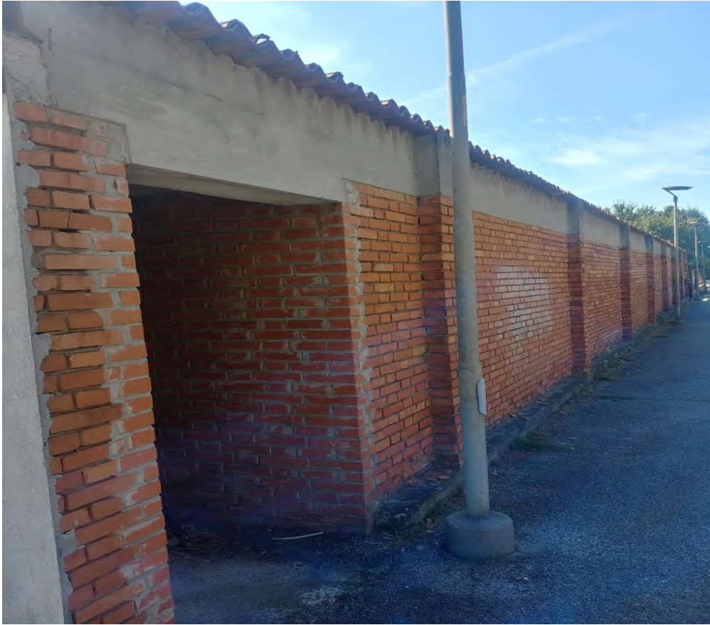
- Vista esterna uscita di sicurezza su via Solera - 7