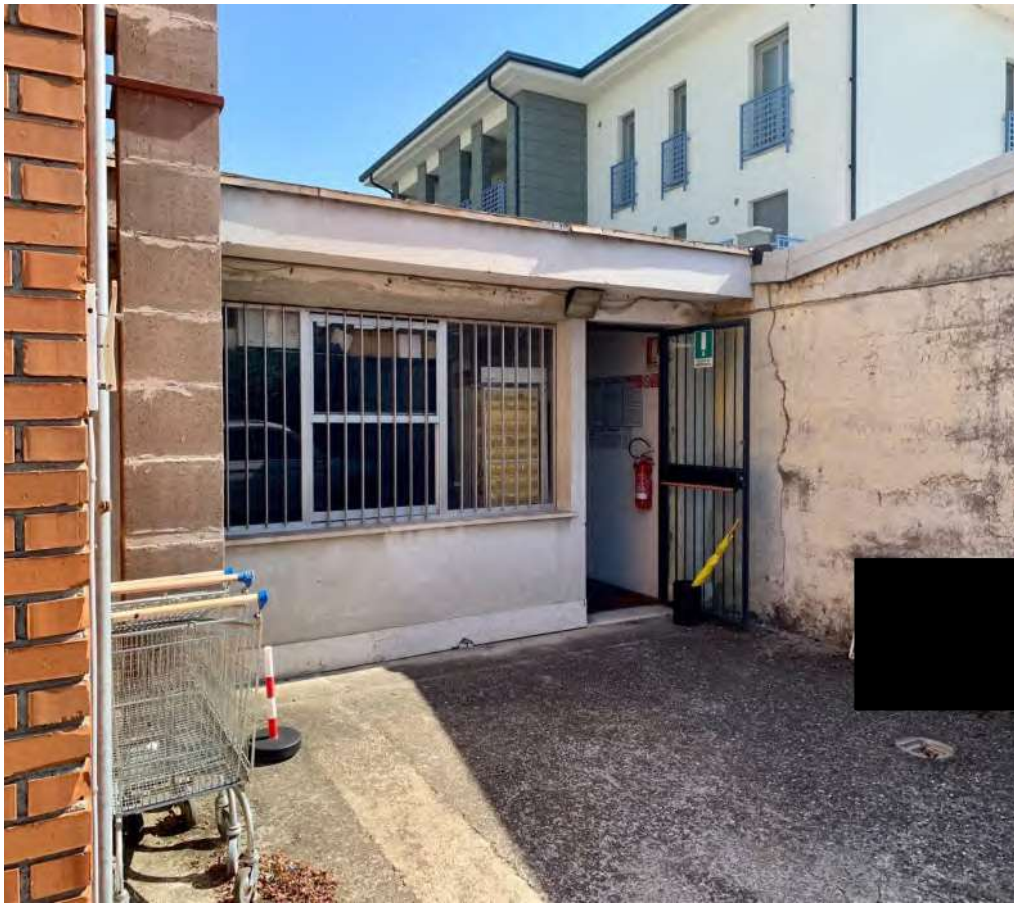
- Vista dal cortile sud-est - 3