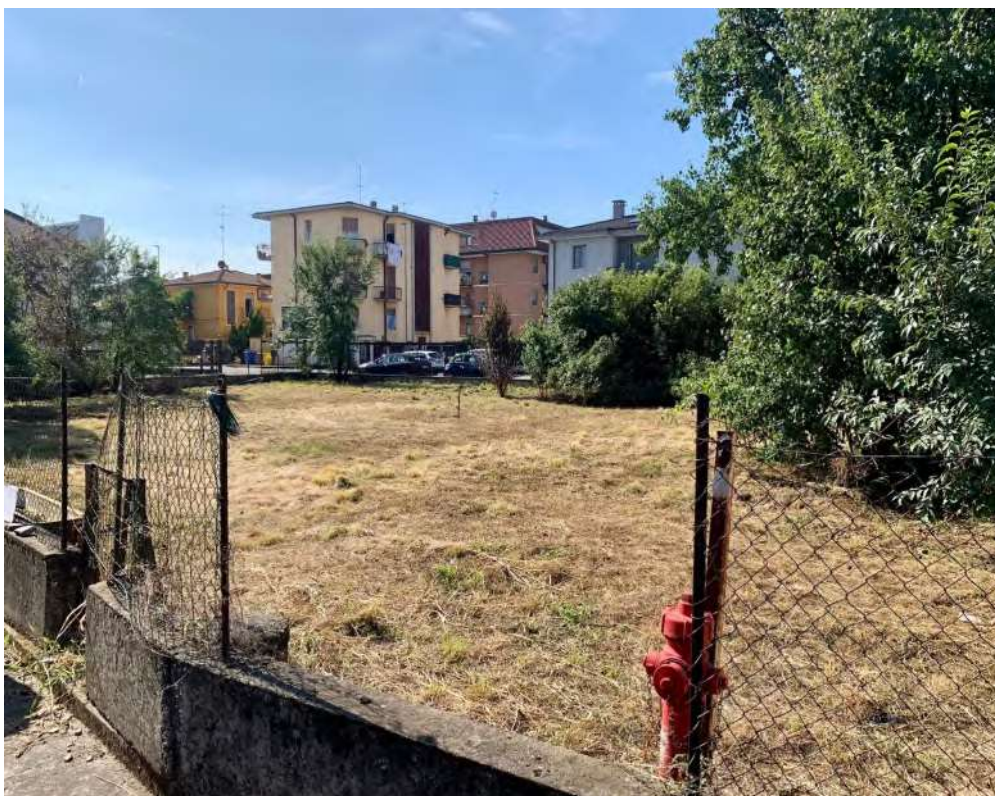
- Vista del cortile giardino comune edificabile – 13