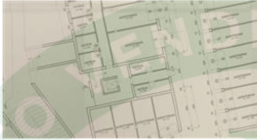
stralcio planimetria di progetto