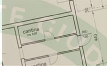
particolare del vano cantina