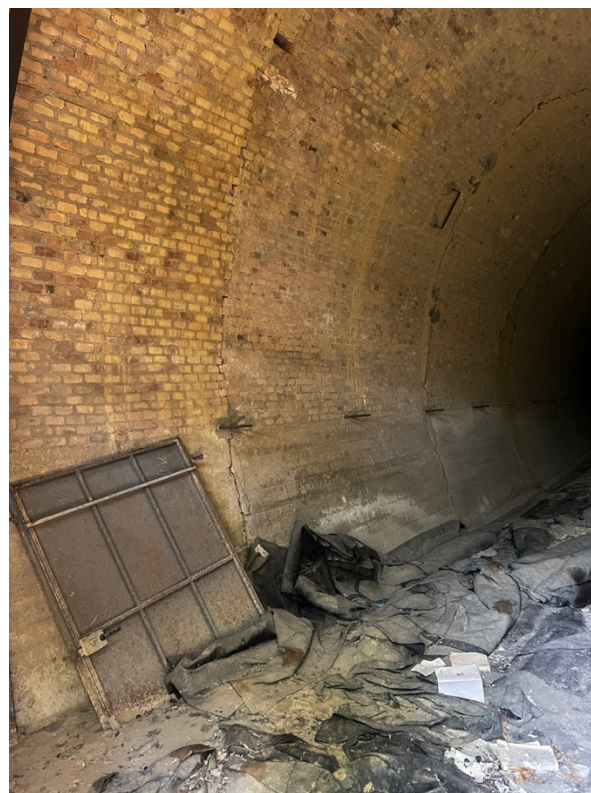
Foto n°8 e n°9 - vista interna galleria (Fg.75, P.lla521 graffata al Fg. 75, P.lla 523)