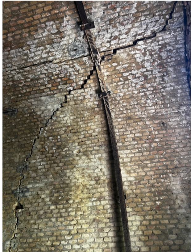
Foto n°10 e n°11 - vista interna galleria (Fig.75, P.Ila 521 graffata al Fig. 75, P.Ila 523)