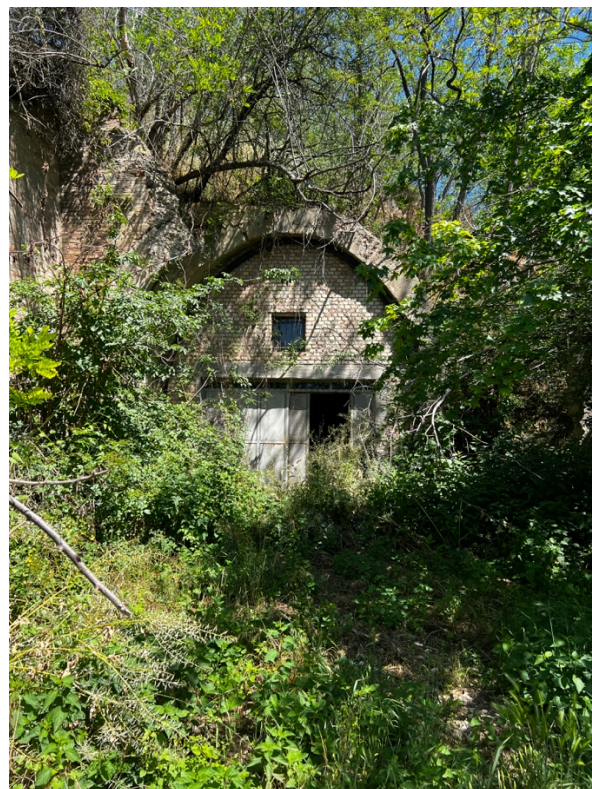
Foto n°6 e n°7 - vista terreni ed ingresso galleria (Fg.75, P.lla521 graffata al Fg. 75, P.lla 523)