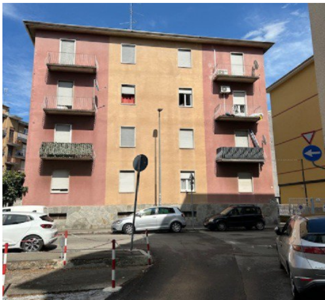
Prospetto ovest via Prella