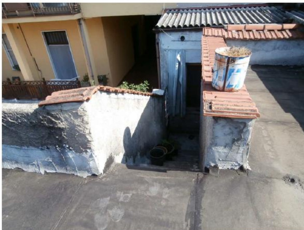
Copertura piana a terrazzo su parte del fabbricato