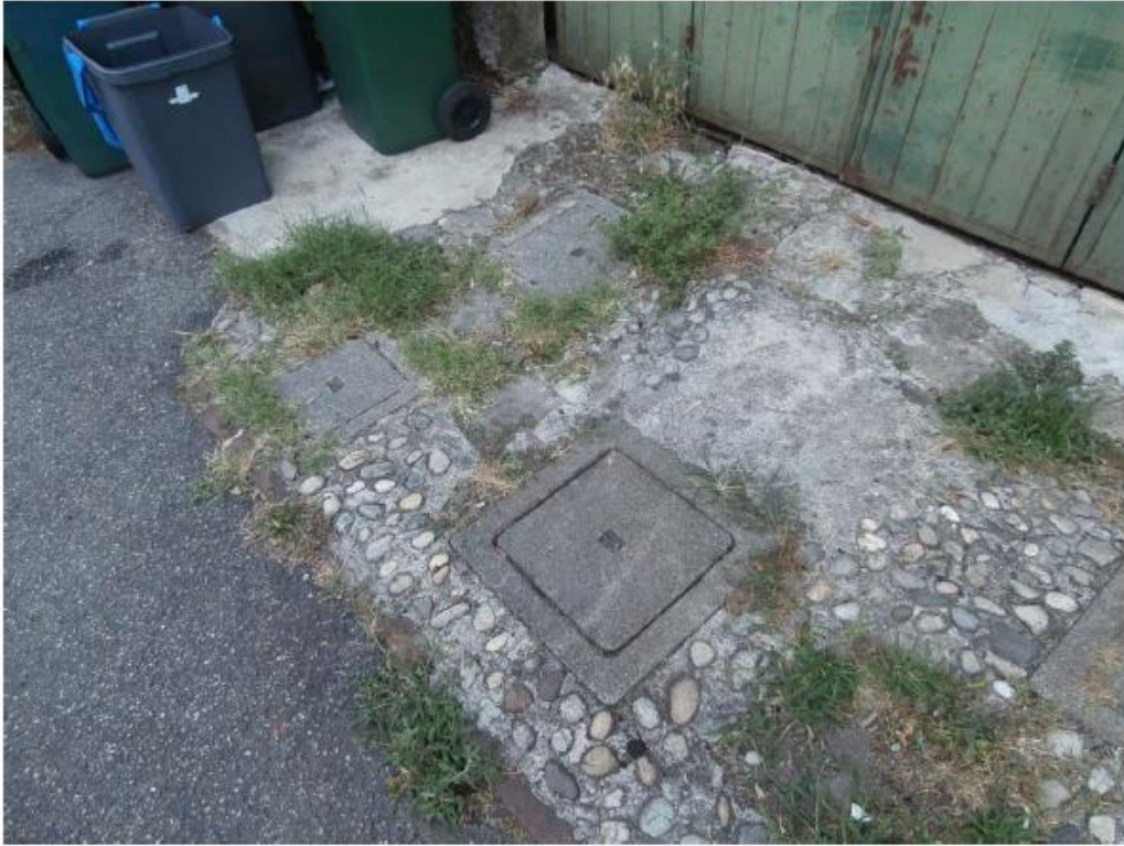
Alloggiamento contatore enel in comune con edificio adiacente