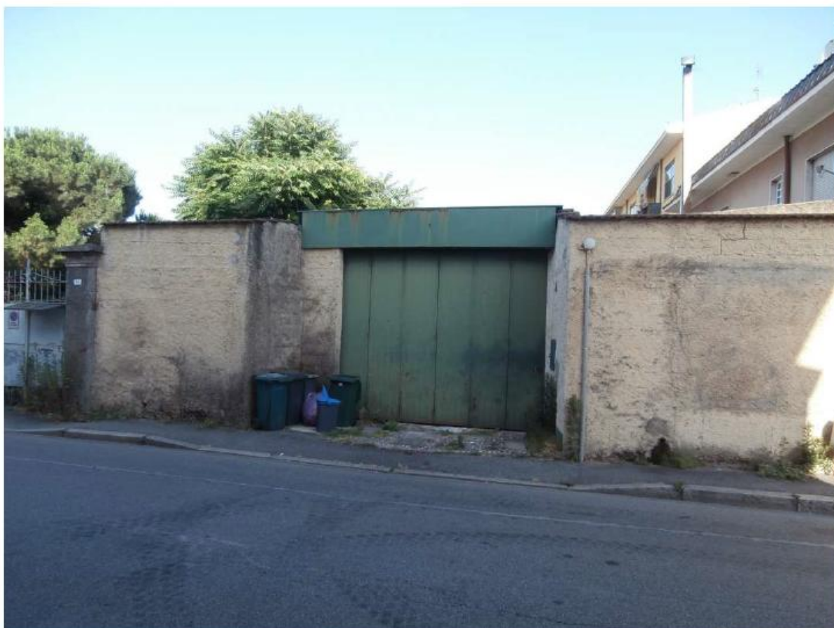
Vista portone di ingresso - Via Marconi n. 60