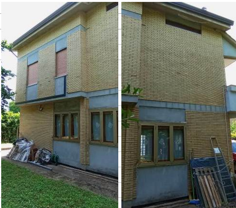
Foto da 2 a 10_ Viste esterne dell'unità abitativa