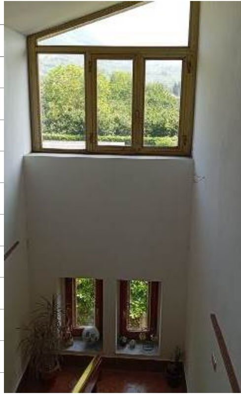
Foto da 25 a 28_ Viste della scala interna di collegamento al piano primo e al piano secondo/sottotetto