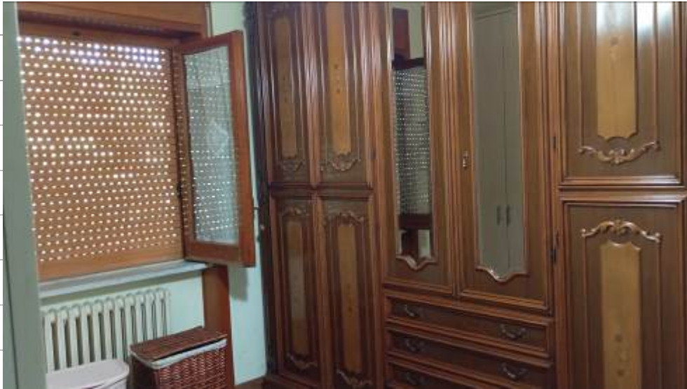
Foto da 17 a 20_ Piano primo – viste delle quattro camere da letto