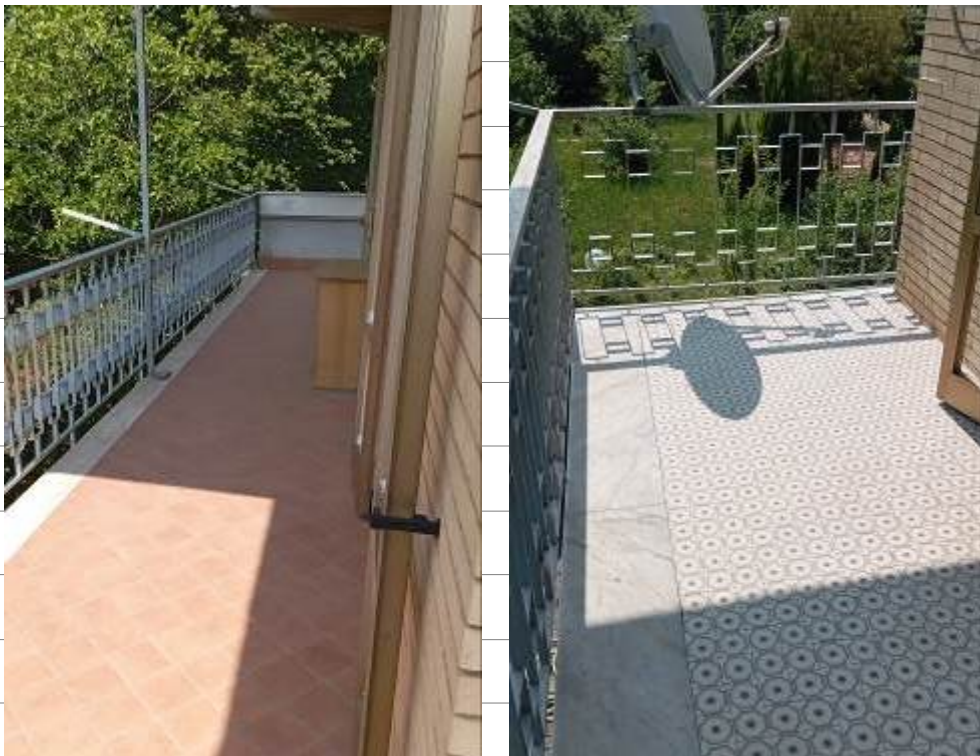
Foto 21 e 22_ Piano primo – viste dei due balconi di servizio a tre camere da letto