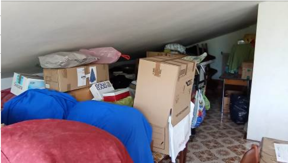
Foto 29 e 30_ Vieste del piano sottotetto