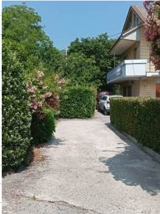
Foto 1_percorso di accesso all'abitazione

Infine, si fa rilevare che costituisce pertinenza al fabbricato anche un'area a verde destinata ad orto – giardino non oggetto di pignoramento [REDACTED] che, allo stato, appare senza soluzione di continuità con la particella pignorata e, in particolare, con l'annesso resede circostante il fabbricato sui lati est, nord ed ovest (v. foto seguenti).